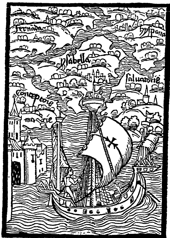
Fig. 1 Barcos e castelos nas Índias ocidentais