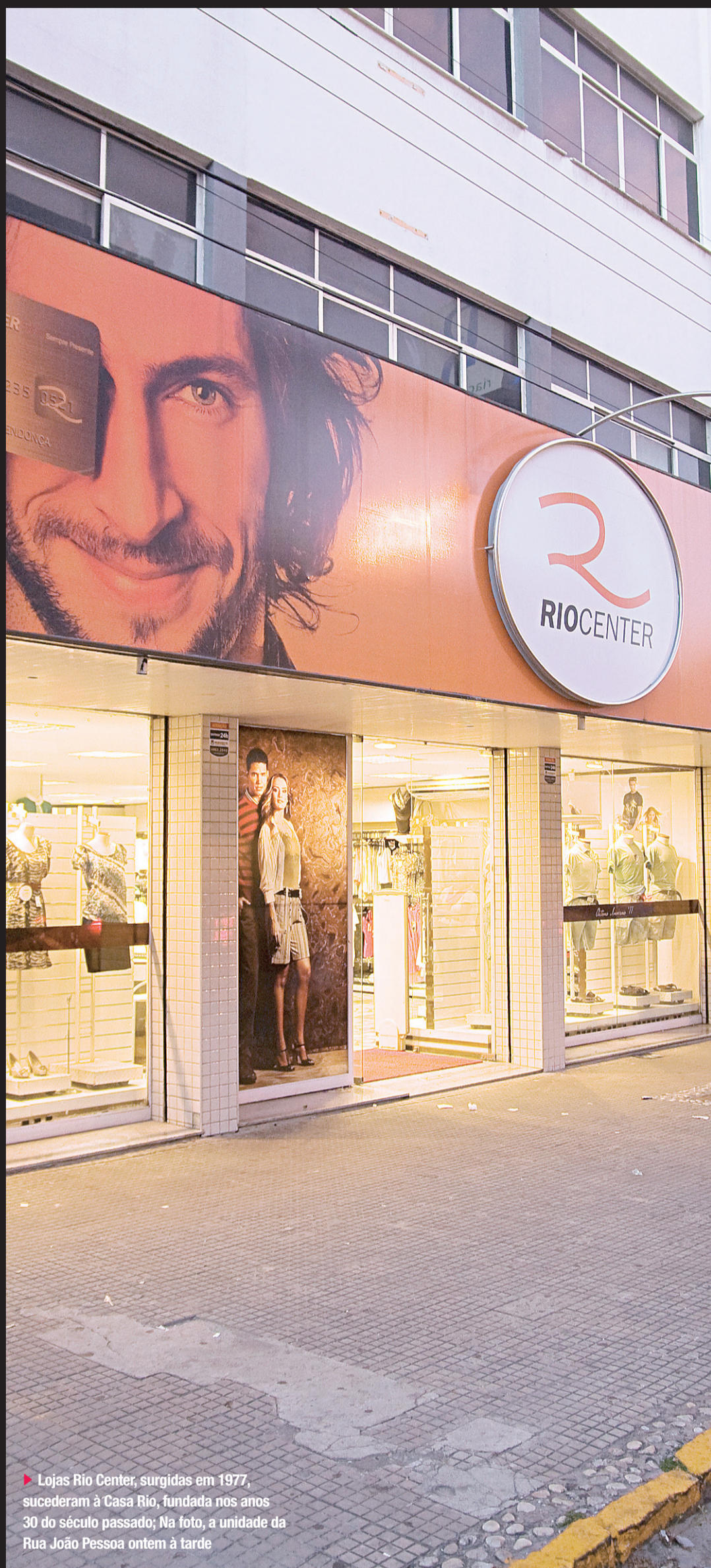
► Lojas Rio Center, surgidas em 1977, sucederam à Casa Rio, fundada nos anos 30 do século passado; Na foto, a unidade da Rua João Pessoa ontem à tarde