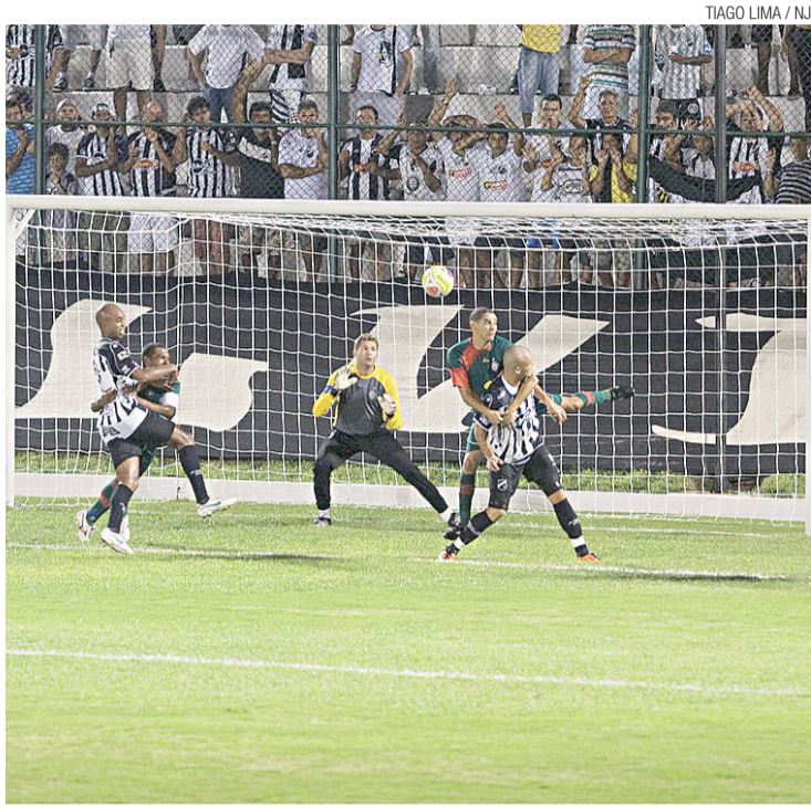
▶ Lance de ABC e Santa Cruz: alvinegro "alugou" lado do campo