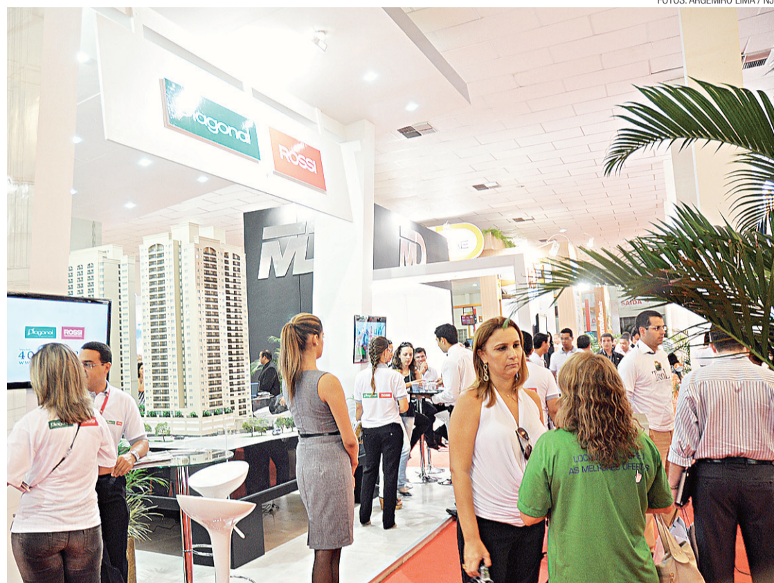
► O salão foi aberto ontem

A Cyrela e a Plano & Plano tem ainda um segundo estande de 54 metros quadrados onde estão sendo comercializados outros quatro produtos (L’Acqua Condominium Club, Vita Residencial Clube, Novo Stilo Home Club e Infinity Areia Preta). Cada um inspirou a cria-