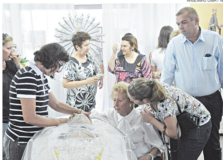
► Familiares e amigos durante o velório

No final da década de 30, a capital dos potiguares já se configurava como um ponto geográfico estratégico das Américas. Durante a Segunda Grande Guerra, um pouco mais tarde, início dos anos 40, a cidade serviu como base militar dos Estados Unidos. Observando esse cenário de grande transformação econômica e cultural, Alcides Araújo enxergou a