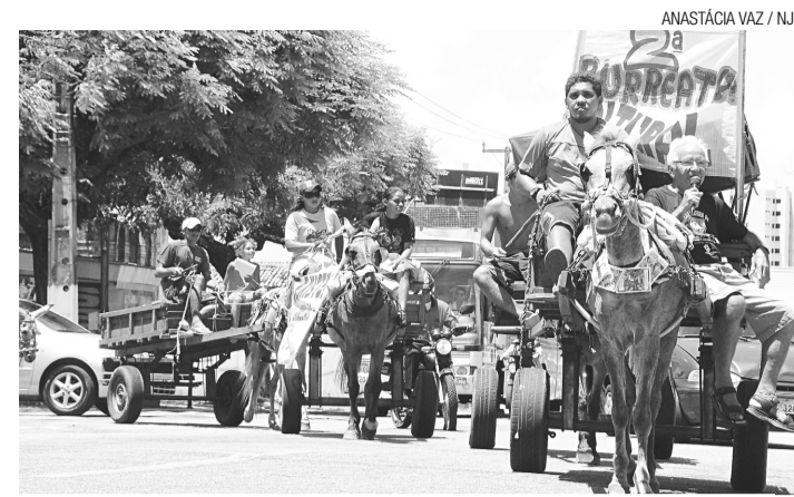
▶ Contador contrata carroceiros e faz manifestação pelas ruas do centro