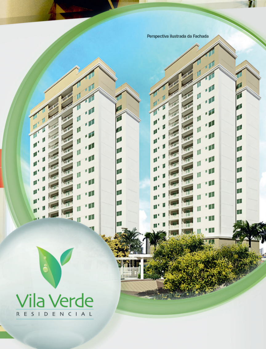
Perspectiva ilustrada da Fachada