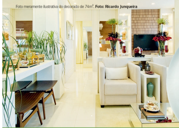
Foto meramente ilustrativa do decorado de 74m².