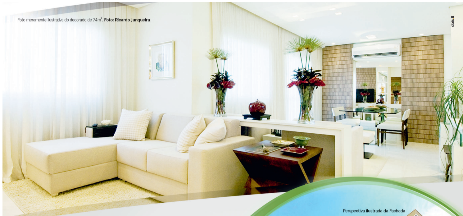
Foto meramente ilustrativa do decorado de 74m².