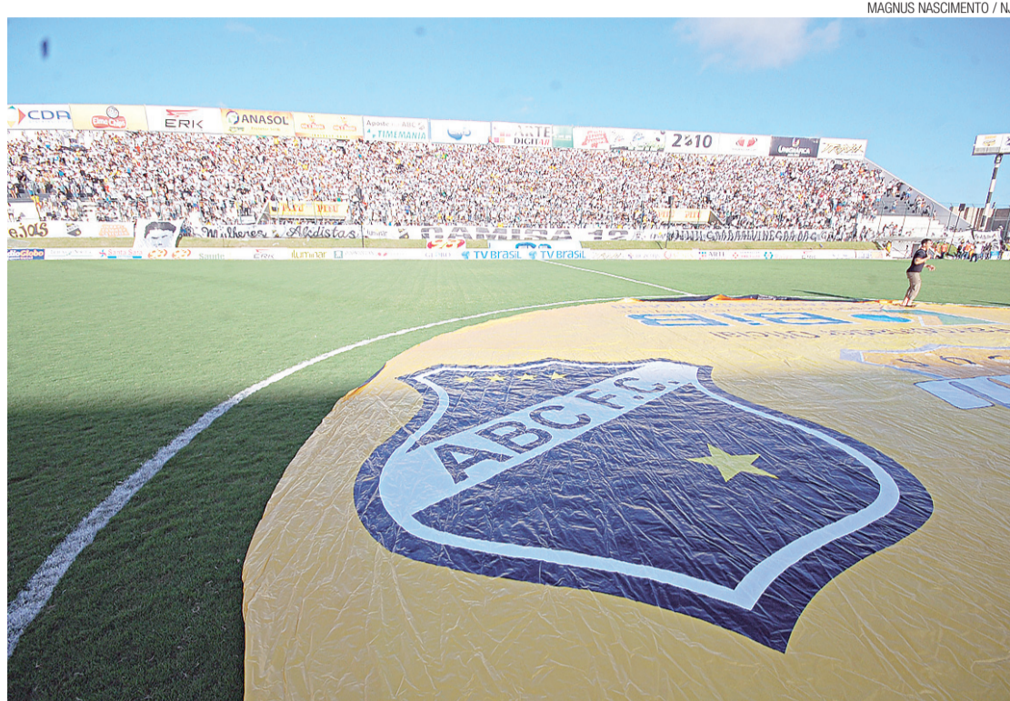
Estádio Frasqueirão lotado na final da Série C 2010: clube conta com apoio ainda maior na Segundona