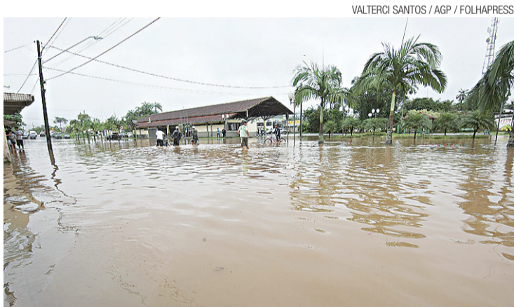
▶ Cheia em Morretes, onde ocorreu o quarto óbito registrado no Paraná

Canelinha (61 km de Florianópolis) teve 1.500 pessoas afetadas, enquanto em São Pedro de Alcân-