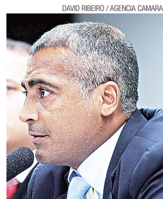
O deputado Romário: marra

Agora, o alvirrubro potiguar busca, além de um atacante para o lugar de Mamão, mais um volante e outro meia. "Todos contratados até agora são de qualidade. Mas precisamos de mais jogadores para reforçar o elenco e atender as necessidades do nosso treinador", finalizou o dirigente americano.