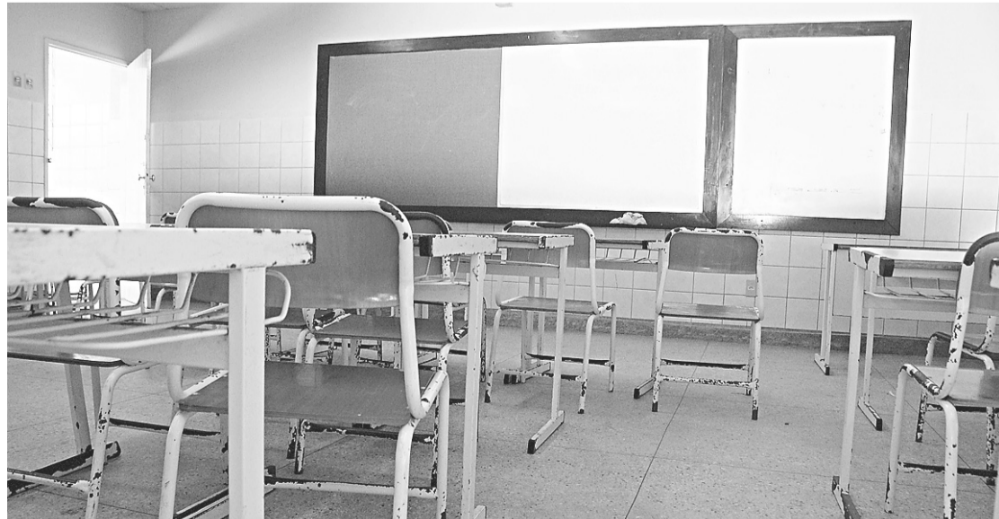
► Aulas no município, como as da Escola Ulisses de Góis, deveriam ter começado no dia 18 de fevereiro