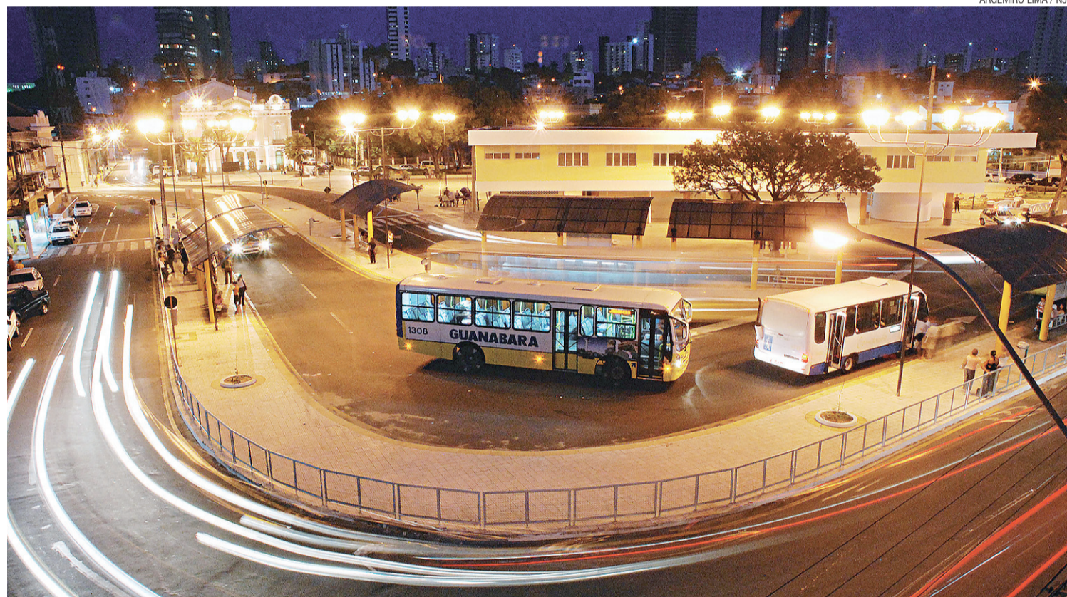
► Bairro da Ribeira vai ganhar projeto revitalizante