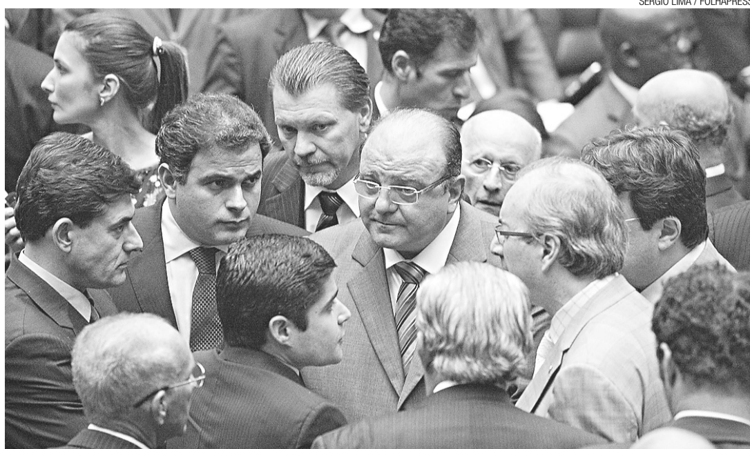
► Votação na Câmara foi encerrada na madrugada

globam, por exemplo, topos de morro e várzeas de rios, sendo consideradas importantes para a produção de água e a proteção do solo contra a erosão daí o fato de receberem proteção especial.