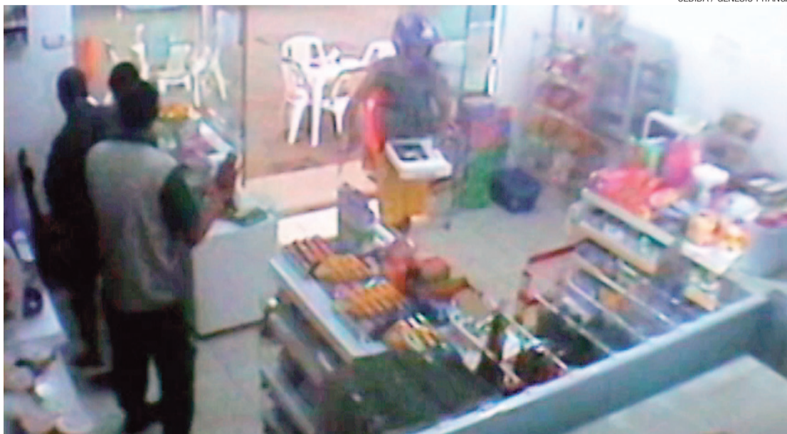
▶ Imagens gravadas pelo sistema de monitoramento de uma loja de conveniência em Macaíba incriminam o ex-soldado

Independente da colaboração do comando da Aeronáutica, a re-