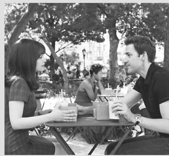
Noivo da Minha Melhor Amiga [Cinemark] - 11h20 - 16h30 - 19h10 - 21h50 - [Moviecom] - 19:20 - 21:40