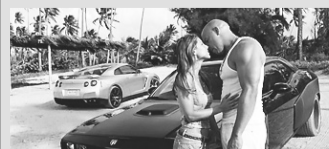
Velozes e Furiosos 5 - [Cinemark] 11h50 - 13h20 - 16h20 - 17h35 - 19h20 - 22h20 - 23h20 - [Moviecom] - 13:45 - 16:25 - 19:05 - 21:45

Thor 3D - [Cinemark] - 13h30 - (sem a exibição 3D) - 15h00 - 20h40 - [Moviecom] - 14:20 - 16:40 - 19:00 - 21:20