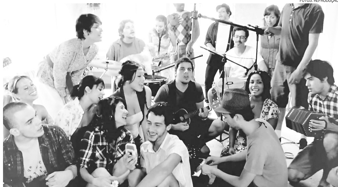
► Músicos se reuniram na casa de amigos, gravaram vídeo

A produção envolveu cerca de 25 pessoas, incluindo câmeras, iluminadores e os muitos figurantes