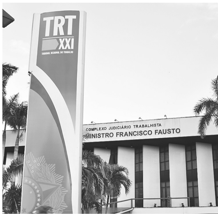
► Depois de audiência mediada pelo Tribunal Regional do Trabalho da 21ª Região, motoristas e cobradores fizeram manifestação em frente ao sindicato