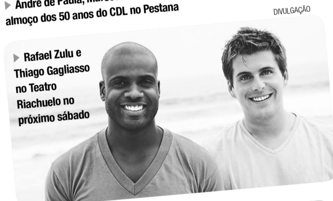
▶ Rafael Zulu e Thiago Gagliasso no Teatro Riachuelo no próximo sábado