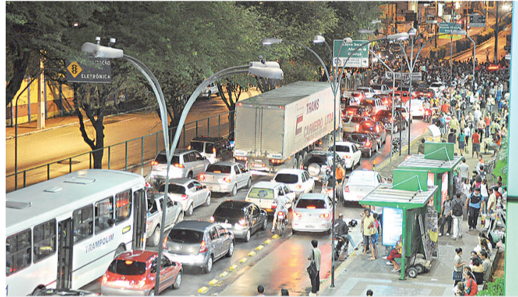
► Protesto parou o trânsito na Av. Salgado Filho

O tempo foi passando e as ações iam ficando mais criativas. Em um momento, cerca 100 jovens ficaram pulando e gritando “quem não pular está com Micarla”. Um ônibus da linha 46 (Ponta