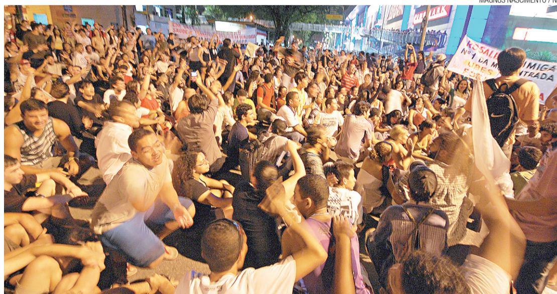
► Manifestantes sentaram no asfalto em frente ao Midway

O tempo foi passando e as ações iam ficando mais criativas. Em um momento, cerca 100 jovens ficaram pulando e gritando “quem não pular está com Micarla”. Um ônibus da linha 46 (Ponta