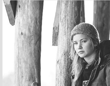
Inverno da Alma [Cinemark] - 14h00