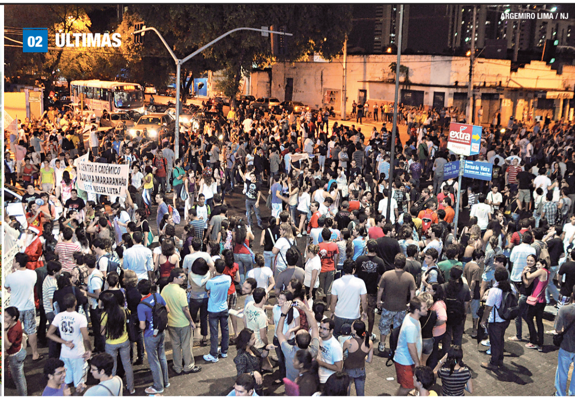
► Dia começou com protesto de servidores estaduais diante da Governadoria...