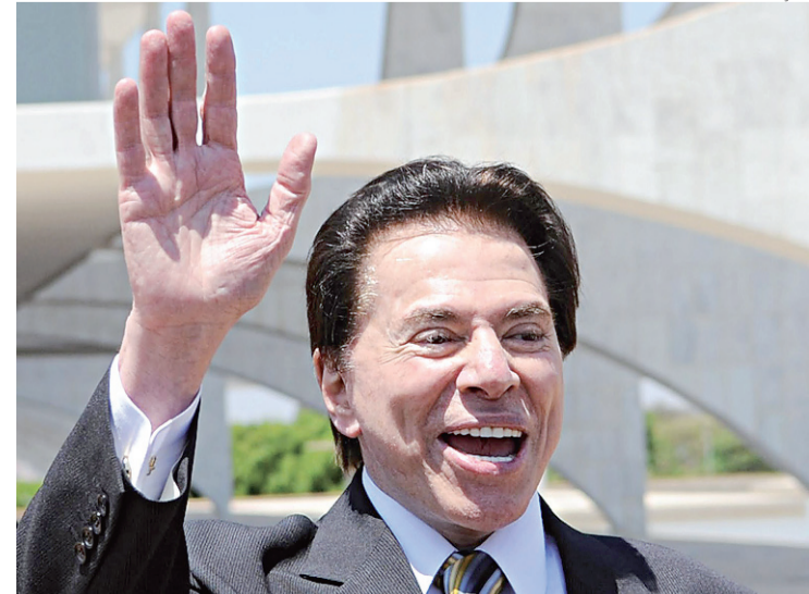
► Empresário esteve no Planalto, com Lula, em 2010