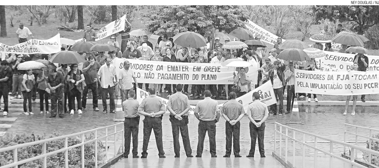
▶ Grevistas fazem manifestação em frente à Governadoria