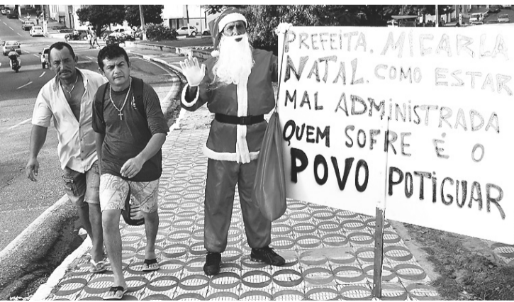
► Taxista leva sua mensagem para a opinião pública

"É o seguinte, fala quem pode e obedece quem tem juízo. Vou voltar sabendo que o sindicato não fez nada por nós", reclamou um motorista que não quis se identificar.