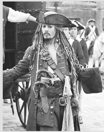
Piratas do Caribe 4 - Navegando em Águas Misteriosas (sem a exibição 3D) - [Cinemark] 11h00 - 14h05 - 17h10 - 20h20 - 23h30 - [Moviecom] - 13:00 - 15:50 - 14:20 - 17:20 - 20:20