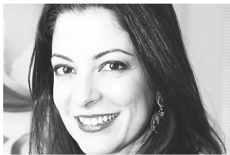
► Ana Paula Padrão é escalada em projeto gigante da Record