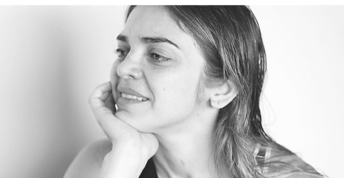
► Atriz acha que os "autos" de final de ano não promovem a cultura

Suas críticas aos autos de Natal, realizados pelo Governo do Estado e Prefeitura de Natal no final de dezembro, são de razões práticas e ideológicas. Um estado laico não deveria montar espetáculos religiosos em sua opinião e com finalidades eleitorais. "Dá a falsa ideia que o poder público investe em cultura" quando na realidade é por uma curta temporada. Por exemplo, os editais criados pelos órgãos de cultura abrindo financiamento para projetos no setor são cada vez mais raros. Ela não se conforma que sejam investidos R$ 1 milhão nos autos quando esse valor poderia financiar o ano inteiro projetos de maior consistência do ponto de vista cultural.