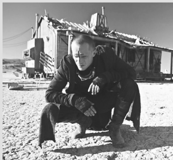
Padre 3D [Cinemark] - 16h10 - 18h30 - 21h00 - [Moviecom] - sem a exibição 3D 15:20 - 17:25 - 19:30 - 21:35