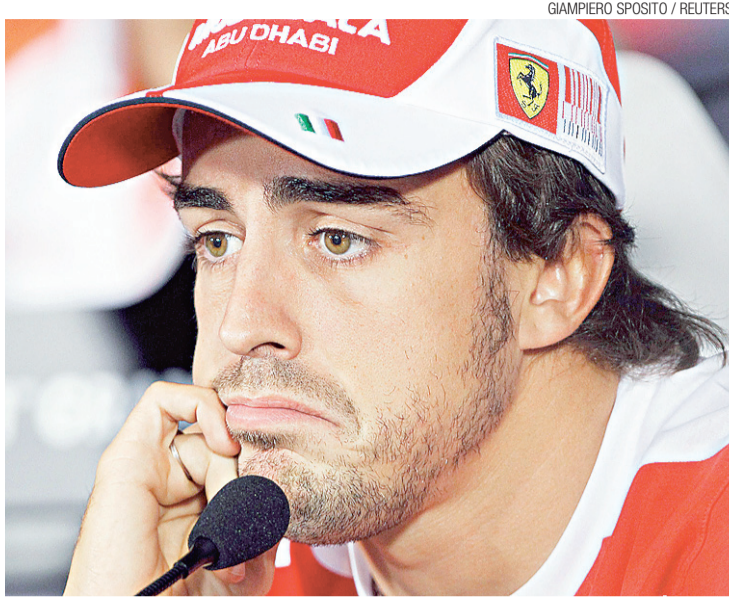
Fernando Alonso superou o líder Vettel

SE A LIDERANÇA na parte da manhã ficou com o alemão Nico Rosberg (Mercedes), a sexta-feira de treinos livres para o GP do Canadá de F-1, sétima etapa do Mundial, que acontece amanhã em Montréal, terminou com o espanhol Fernando Alonso (Ferrari) como o mais veloz no geral.