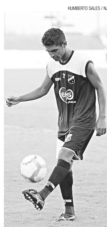
▶ Pio volta à lateral direita

Apesar de ter anunciado a escalação da equipe, o treinador ainda terá dois treinos pela frente. Hoje pela manhã, o técnico alvinegro comanda um treino tático para acertar a equipe. Mas é no domingo, dois dias antes de retor-