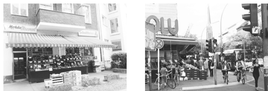
Quitanda na rua Birkenstrasse, cena comum na capital alemã, assim como mercados turcos