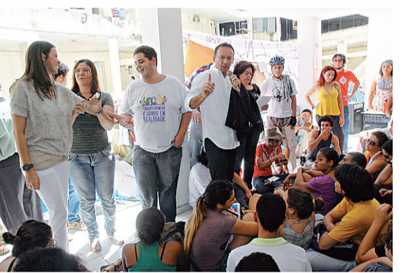
► Após ameaça até de acionar a polícia, estudantes que integram movimento Fora Micarla ficam na Câmara até a terça-feira, quando presidência espera retirada