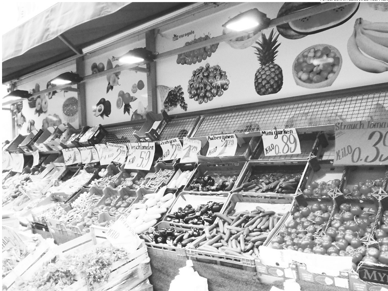
Preços dos legumes baixaram depois da ameaça da bactéria

/ TEMOR / JORNALISTA NATALENSE RADICADA EM BERLIM MOSTRA COMO OS ALEMÃES ENFRENTAM O TERROR DA BACTÉRIA QUE AMEDRONTA A EUROPA