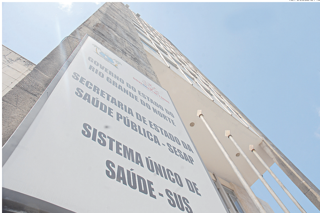
► Sesap registrou 4.515 casos de dengue este ano no RN

que apresentou alguma incidência de dengue chegou a 92. Natal lidera a quantidade de notificações (3.837 casos), seguido por Mossoró (1.906), Parnamirim (1.108), Santa Cruz (621), João Câmara (560), Macaíba (473), São Gonçalo do Amarante (453), Nova Cruz (416), Pau dos Ferros (397) e São Paulo do Potengi (341).