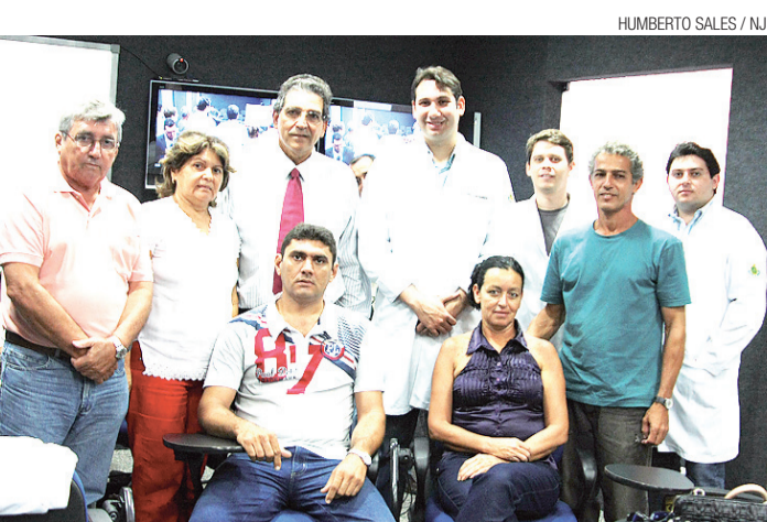
▶ Pacientes e médicos antes da cirurgia: confiança