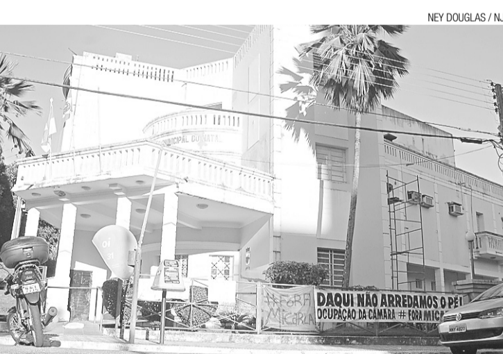
► Faixa na frente da Câmara mostra que acampados ficarão no local