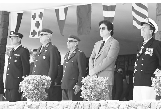
► O vice-governador Robinson Faria entre os comandantes das Forças Armadas no Rio Grande do Norte