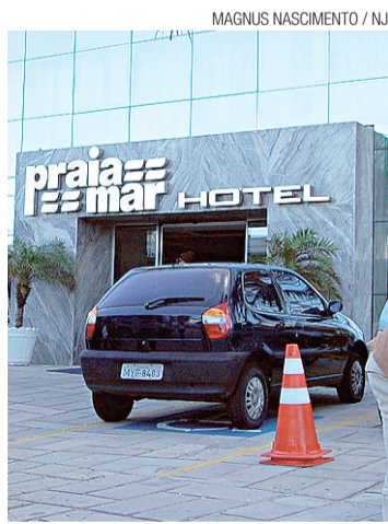
Praiamar sedia o evento