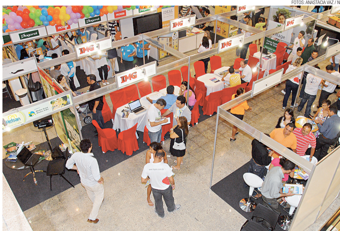
► Feira tem 80 estandes de venda

No ano de 2010, a Caixa Econômica Federal financiou 22 mil moradias, totalizando R$ 1,4 bilhão reais em empréstimos imobiliários. Em 2001, foram finan-