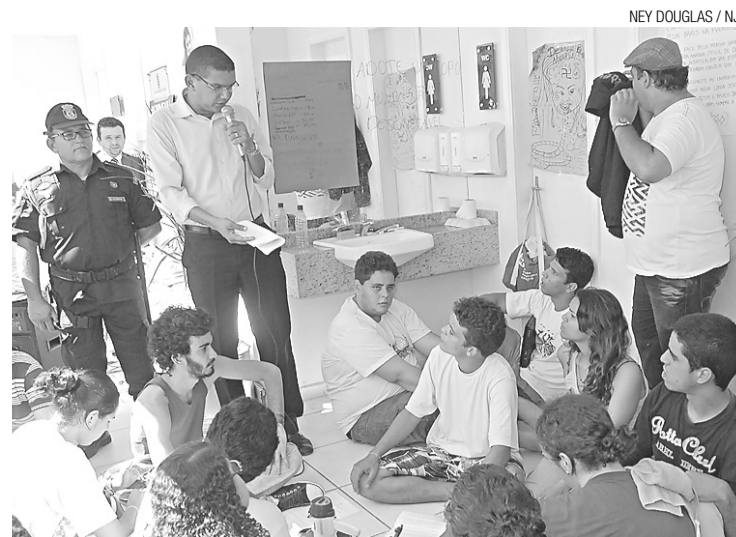
► Chefe da segurança negocia com manifestantes