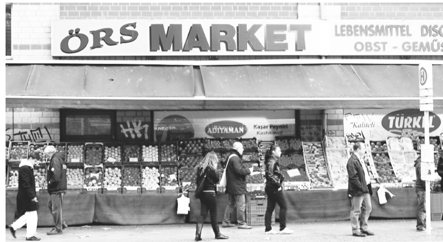
Alemães estão temerosos, mas sem alarmismos, relata jornalista potiguar