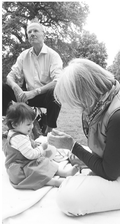
Hábito do piquenique em Berlim passa a ser mais cuidadoso após o E.Coli