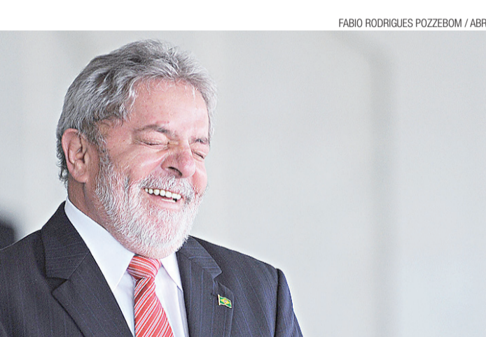
► Ex-presidente cobra R$ 200 mil por palestra

Os produtos mais exportados em maio foram soja (US$ 3,37 bilhões), com crescimento de 27% na comparação com maio do ano passado, e carnes (US$ 1,37 bilhões), aumento o volume de vendas em 14%.