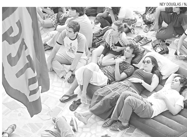
► Jovens tem permissão da justiça para permanecerem acampados