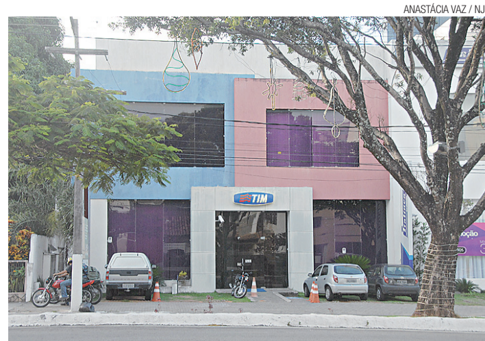
► Tim está proibida de vender novas linhas no Ceará

O embaixador da Itália no Brasil, Gherardo La Francesca, estará segunda-feira em Roma, para prestar consultas ao Ministério de Assuntos Exteriores do país. La Francesca foi convocado ontem pelo governo da Itália para esclarecimentos sobre a decisão do Supremo Tribunal Federal (STF) de rejeitar a extradição e autorizar a libertação do ex-ativista político Cesare Battisti. Diplomatas brasileiros foram informados pelas autoridades italianas que a convocação, embora motivada pela libertação de Battisti, tem o objetivo de esclarecimentos técnicos e jurídicos sobre o caso.