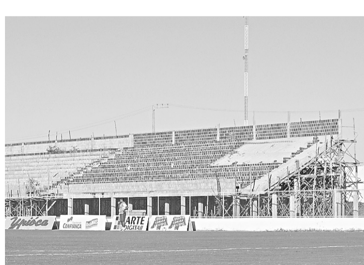
▶ Arquibancada: serviço será retomado na próxima semana

Lima afirmou que o estádio estará pronto para a estreia do América em casa, no dia 31 de julho, diante do Campinense/PB, já com a arquibancada finalizada e os refletores instalados. "Para a estreia ele estará pronto. O estádio ficará com a capacidade