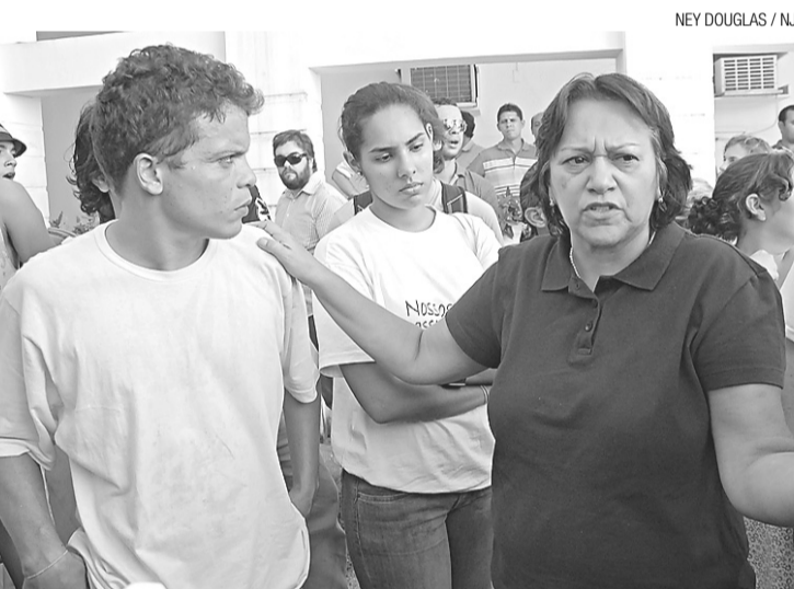
► Fátima Bezerra marcou presença no protesto contra a prefeita

Para a sargento Regina, a reabertura da comissão é possível e insiste na questão do diálogo com a bancada da situação. “É possível reabrir a CEI sim, mas precisa do diálogo. Ao mesmo tempo estamos em contato com o Ministério Público para a instauração de um inquérito. Entregamos um material e já tenho mais documentos para levar aos promotores”, afirmou.