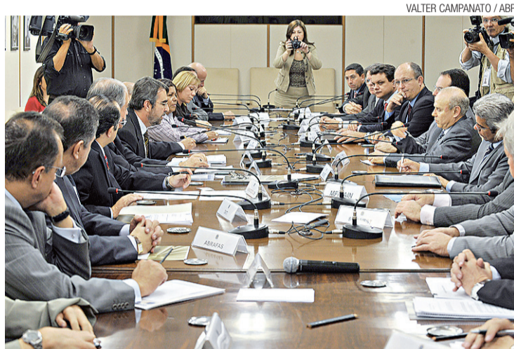
Reunião no Ministério da Fazenda definiu agenda de ações

Segundo Fontana, um dos pontos apresentados pelo setor já vem sendo discutido pelo Ministério da Fazenda dentro da re-