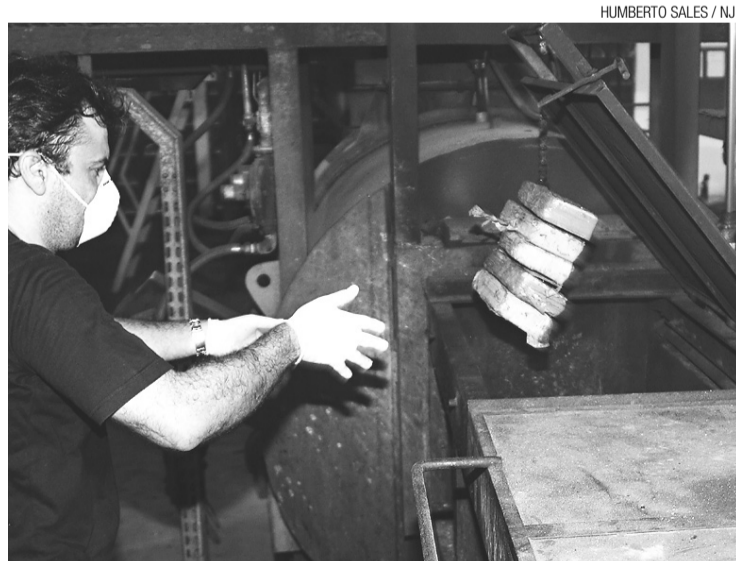
As chamas 247,8 kg de crack, 104,7 kg de cocaína e 93,9 kg de maconha