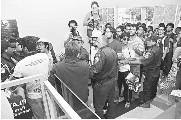
▶ Jovens tentam acesso às galerias do plenário