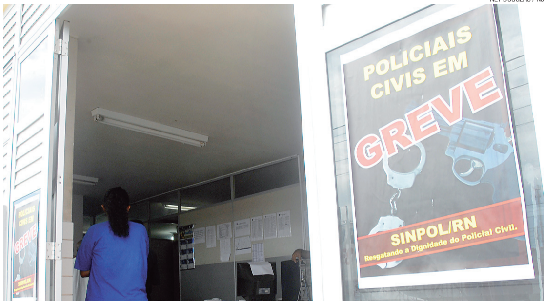
NEY DOUGLAS / NJ

▶ Tribunal de Justiça julga legal a greve da Polícia Civil