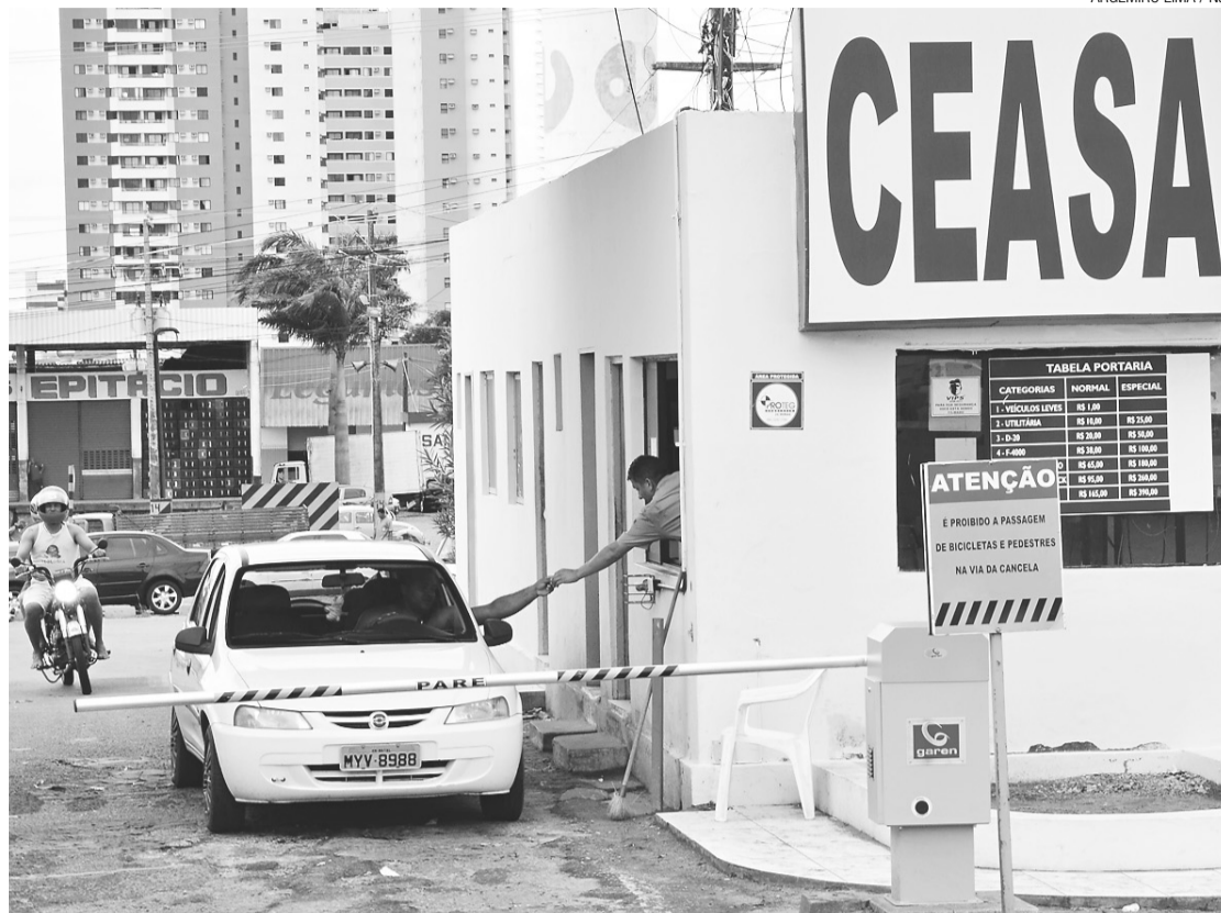
Determinação do MP deve entrar em vigor em trinta dias