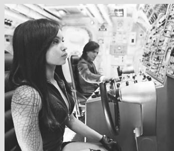
X-MEN: Primeira Classe – [Cinemark] - 11h05 - 11h30 - 14h40 - 17h45 - 21h00 - 22h00 - 00h00 - [Moviecom] - 13:30 - 16:10 - 18:50