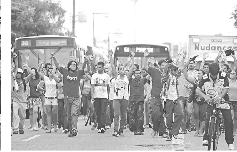
▶ Passeata seguiu pelas ruas até a prefeitura

perfurado, ele diz que esse valor foi cobrado pela empresa que fez a obra, mas não houve concordância da CEF e do TCU e por isso o pagamento não foi efetuado e a empresa cobra na Justiça o valor que afirma ter direito. "Ao contrário desse vereador não tenho nenhuma ação de improbidade na Justiça. O que está ocorrendo é que Natal está passando por um caos administrativo completo e os correligionários da prefeitura perderam o bom senso. Isso é desespero de causa querendo atingir uma administração que foi aprovada pela população de Natal diferentemente da atual". Com relação às obras inacabadas, o ex-prefeito também rebateu as acusações do vereador Enildo. Segundo ele, a reforma do mercado das Rocas começou a ser feita em 2008, mas não deu tempo para terminar ainda na sua administração.