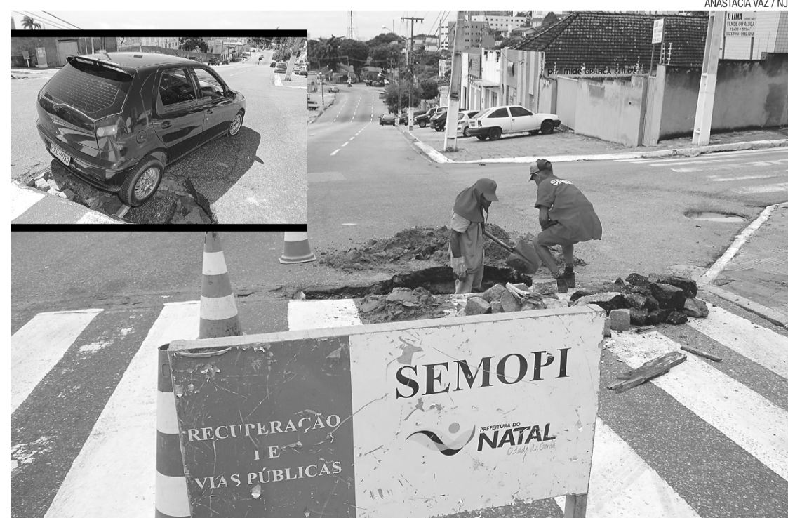
▶ Funcionários da Secretaria Municipal de Obras Públicas e Infraestrutura realizam o reparo do asfalto na avenida

"Além disso, a operação de tapa buracos se estendeu pelas avenidas Mor Gouveia, Rio Grande do Sul e Parafba, e nas ruas Campina Grande e Adolfo Gordo, na Cidade da Esperança, zona Oeste da capital. No Alecrim, as obras de recuperação de trechos danificados pela ação das chuvas e do tempo avançaram nas avenidas Coronel Estevam, Presidente Bandeira e Mário Negócio, como também nos arredores da praça Gentil Ferreira", diz o comunicado.