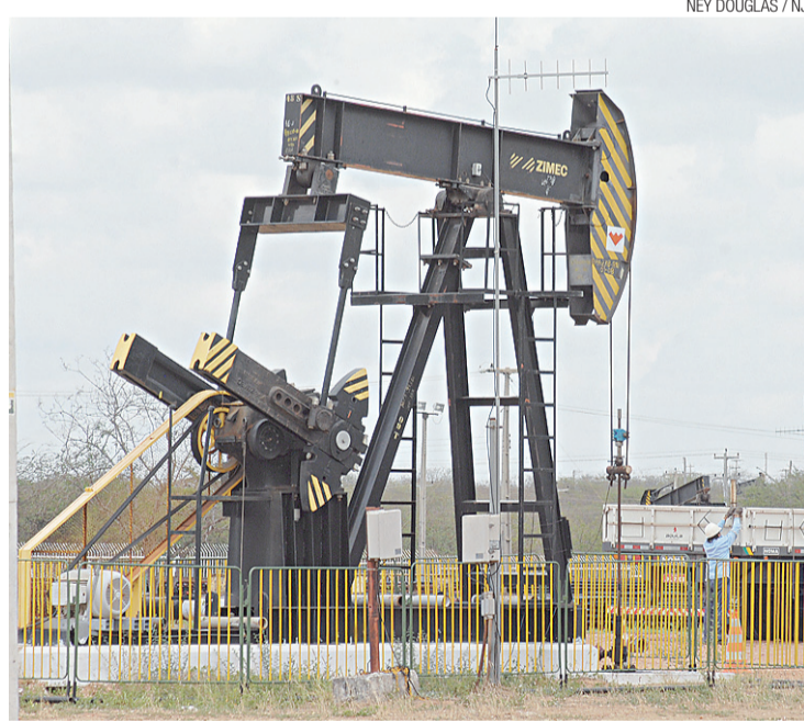
► Produção de petróleo garantiu R$ 185,49 milhões em royalties

O município que recebeu a maior quantidade de dinheiro em royalties foi Macau, com R$ 2,63 milhões.