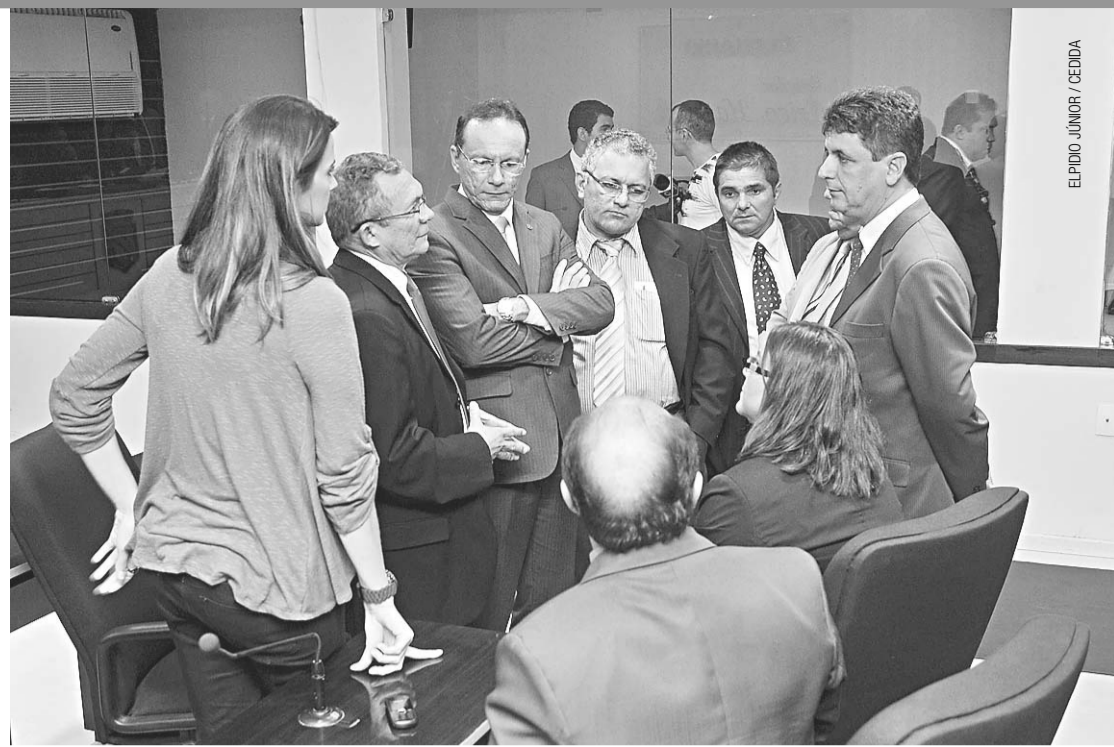
▶ Vereadores conversam durante a sessão