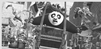
Kung Fu Panda 2 – [Cinemark] -12h00 - 12h45 - 13h05 - 15h00 - 15h15 - 17h10 - 17h30 - 19h30 - 19h50 - 22h10 - [Moviecom] - 13:50 - 15:10 - 15:50 17:10 - 17:50 - 19:10 - 19:50 - 21:10 21:50