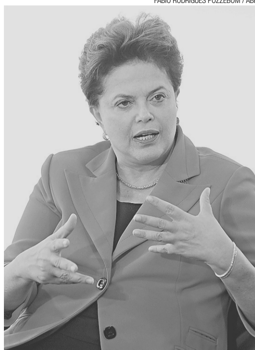
► Dilma Rousseff não tem consenso na base

Alguns senadores do PMDB, no entanto, adotaram um discurso mais cauteloso sobre a neces-