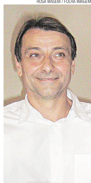
► Cesare Battisti

O anúncio da ação foi divulgado pelo próprio grupo no Twitter.