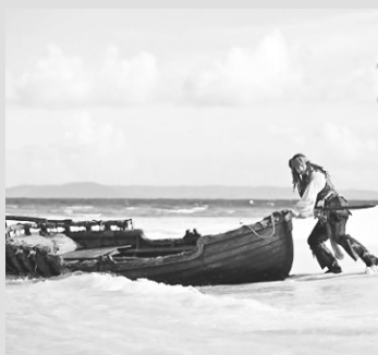
Piratas do Caribe: Navegando em Águas Misteriosas – [Cinemark] - 14h15 - 17h20 - 20h25 - 23h30 - [Moviecom] - 14:25 - 21:30