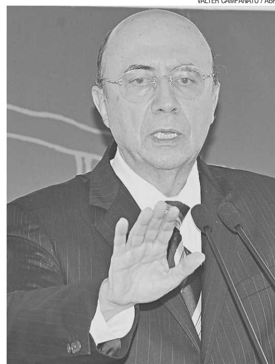
► Henrique Meirelles preside Conselho Público Olímpico

sidade de alterar a medida provisória que determina orçamentos sigilosos das obras, depois de terem criticado publicamente a alteração feita pela Câmara.