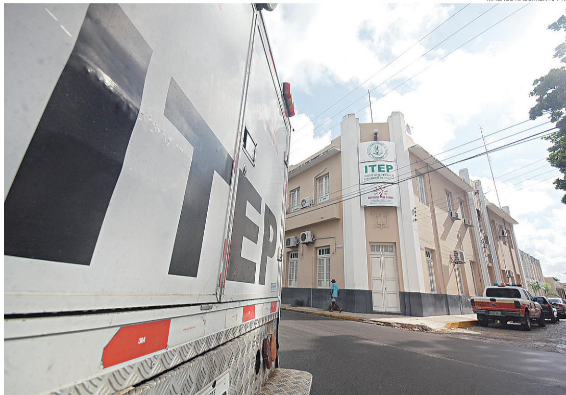
► Polícia judiciária deve manter serviços, diz MP

O secretário de segurança ainda foi recomendado a examinar a conveniência administrativa e le-