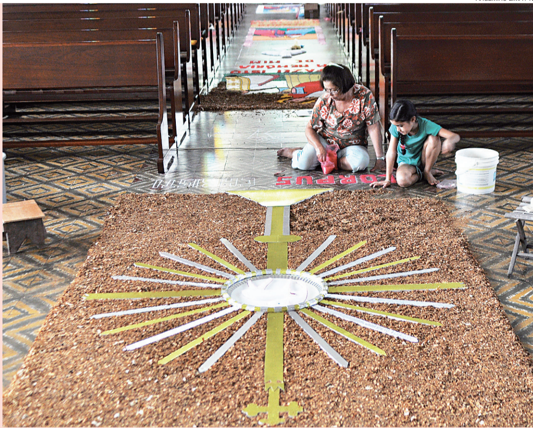
ARGEMIRO LIMA / NJ

Igrejas como a de Santo Afonso Maria de Ligório, no Mirassol, mantêm viva a tradição de criar tapetes de serragem para a passagem do Santíssimo, ritual que marca o dia de Corpus Christi entre os católicos