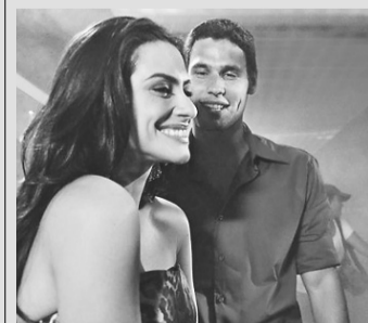
Qualquer Gato Vira Lata – [Cinemark] 11h00 - 13h20 - 15h40 - 18h10 - 20h40 - 23h00 - [Moviecom] - 15:30 - 17:35 - 19:40 - 21:45