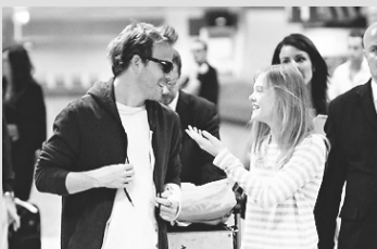
Um Lugar Qualquer – [Cinemark] 14h00