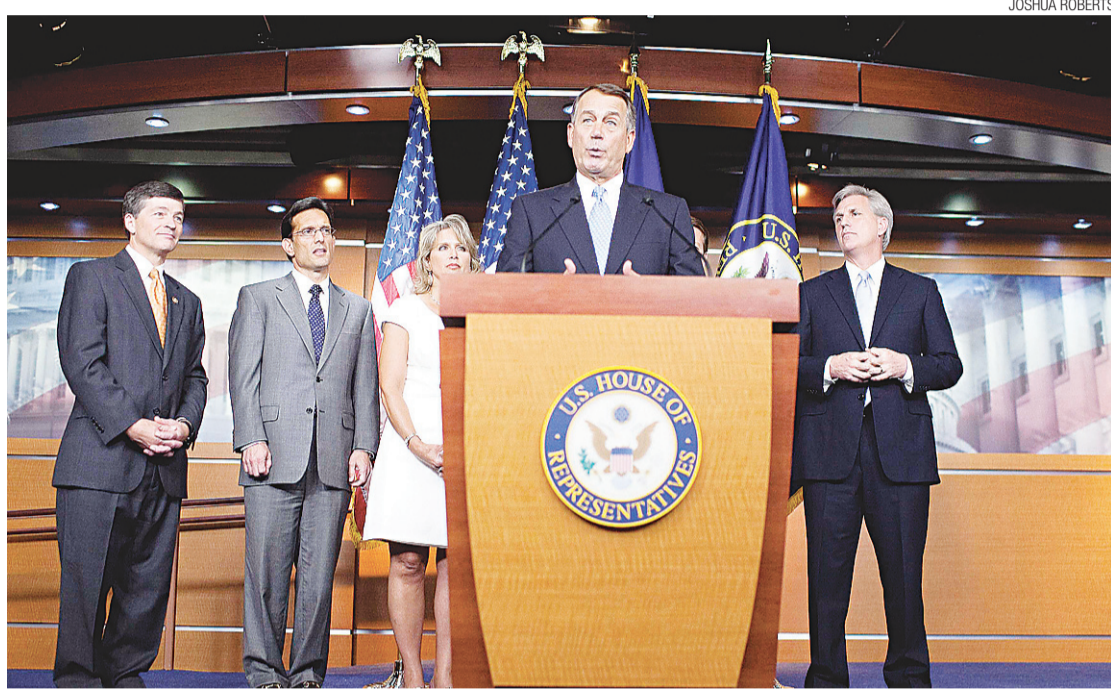
Presidente da Câmara dos Deputados, o republicano John A. Boehner adiou votação sobre endividamento

que, embora só o Congresso possa garantir que o governo pague todas as suas contas, o Tesouro detalhará, conforme se aproxima o dia 2, como fará sem poder tomar empréstimo”, disse à reportagem uma porta-voz do Tesouro.