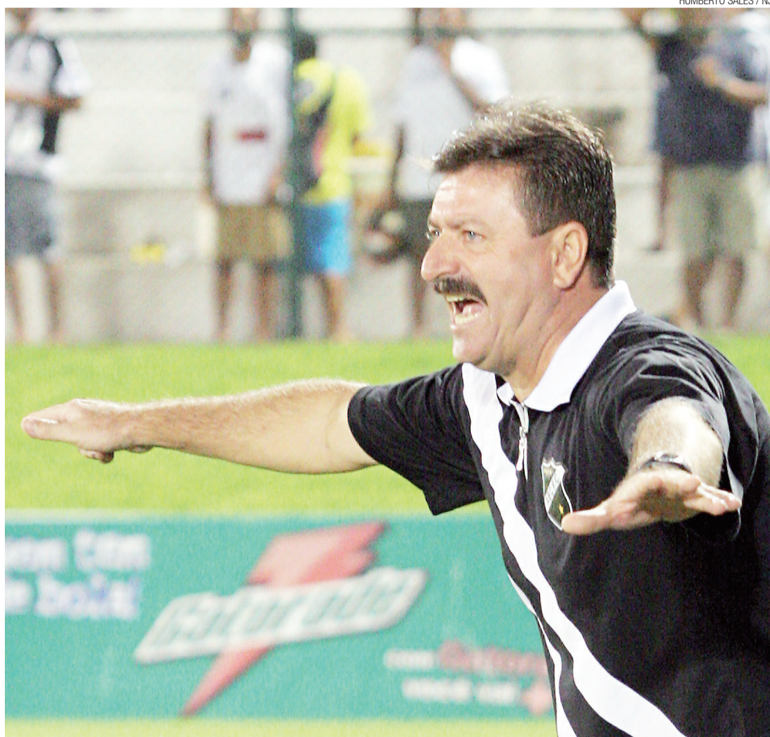
HUMBERTO SALES / NJ

São cinco só para o confronto desta sexta-feira. O quinteto das ausências é formado pelo zagueiro Tiago Garça, com problema no púbis, o volante Makelele, o lateral-esquerdo Renatinho Potiguar e o centroavante Leandro, todos com o terceiro cartão amarelo recebido no duelo contra o Azulão estão fora. No caso do atacante, o jogador ainda sofre com uma le-