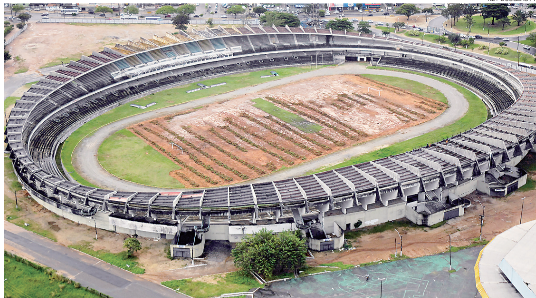
► Machado será demolido para dar lugar a Arena das Dunas

O secretário diz que nunca deixou de acreditar no projeto local e não reclama da torcida contra. "Em nenhum processo desse tamanho, dessa natureza, você vai ter unanimidade. Eu só não entendi, em alguns momentos, porque