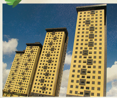
Porto do Alto

Mais do que transformar em realidade, a Estrutural transforma sonhos em felicidade.