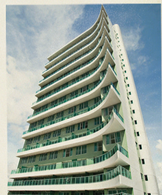
Jardins do Alto