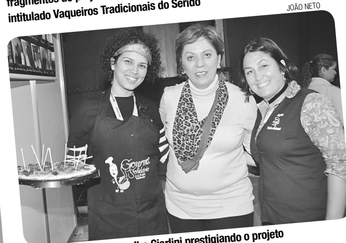
▶ A governadora Rosalba Ciarlini prestigiando o projeto Gourmet Solidário, uma iniciativa do Grupo de Apoio à Criança com Câncer - GACC/RN