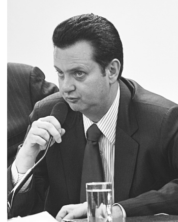
► Kassab tenta oficializar PSD

Hoje existem 27 agremiações partidárias no Brasil registradas no TSE.