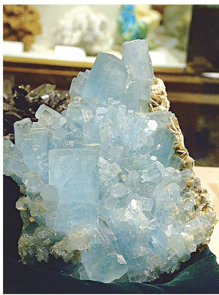
Pedras potiguares sem brutas do estado