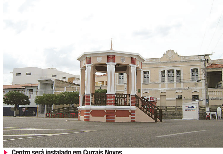
Centro será instalado em Currais Novos

beneficiamento, diz ele, é preciso ter dois atrativos: matéria-prima de primeira qualidade e mercado, principalmente na área de ro-