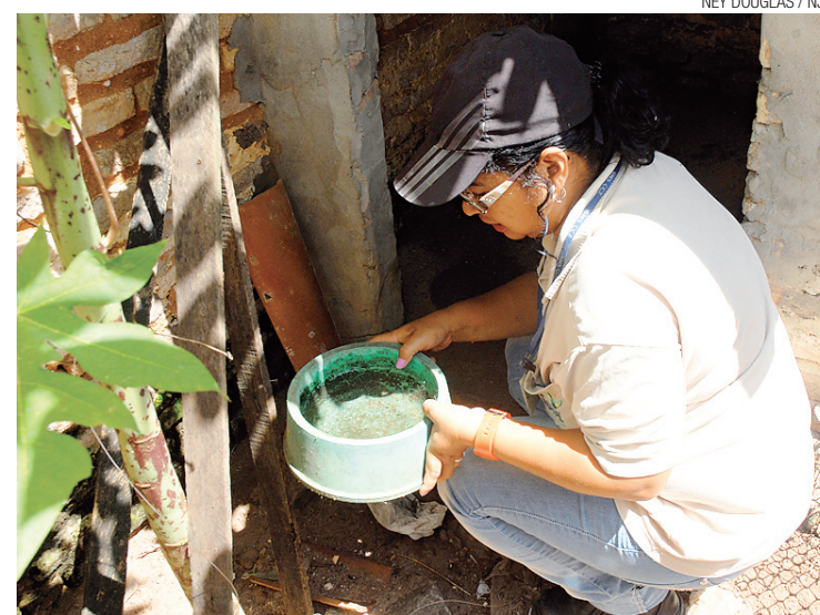
▶ Agentes endêmicos continuam combatendo o mosquito transmissor

/ BOLETIM / ÍNDICE DE LETALIDADE NO RN É TRÊS VEZES SUPERIOR AO QUE A OMS CONSIDERA NORMAL; HÁ 6 MIL CASOS SUPEITOS EM UM MÊS