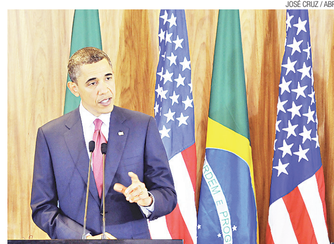
Obama depende do Senado para reverter situação