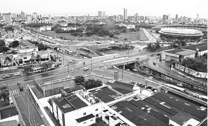
Entorno do Machadão está no projeto das obras de mobilidade

Em meio a uma grave crise, com 22 autoridades ligadas ao Ministério dos Transportes demitidas desde o início do mês, o segmento teve apenas quatro aeroportos concluídos neste ano, em aeroportos e portos. Essas obras representam 1% do total previsto no setor.