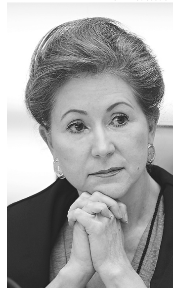
► Gracie: primeira ministra do STF

Alguns nomes são cotados para ocupar o posto no STF, como a juíza Sylvia Steiner, do Tribunal Penal Internacional. Além dela, outros nomes são cotados, como as ministras do Superior Tribunal de Justiça Nancy Andrighi e do Superior Tribunal Militar Maria Elizabeth Rocha.