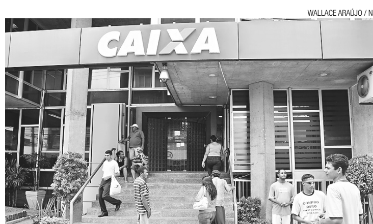
WALLACE ARAÚJO / NJ

Caixa tem 30 dias para analisar o projeto