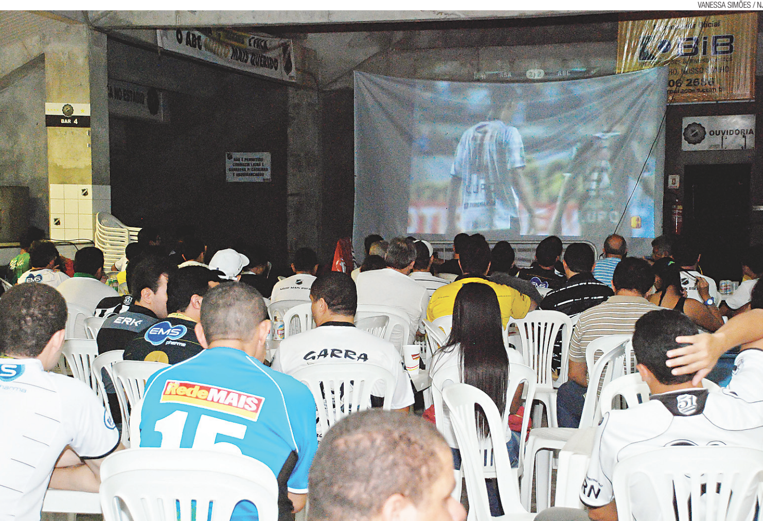
Torcida acompanhou jogo em telão no Frasqueirão