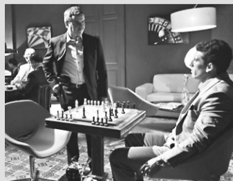
ASSALTO AO BANCO CENTRAL – [Cinemark] – 11h20 - 16h25 - 18h50 - 21h15 - 23h45 – [Moviecom] – 15:05 - 17:15 - 19:25 - 21:35

CAPITÃO AMÉRICA: O PRIMEIRO VINGADOR – [Cinemark] – 14h40 - 15h45 - 17h30 - 20h20 - 21h25 - 23h10 – [Moviecom] – 15:50 - 18:25 - 19:30 - 21:00 - 21:35