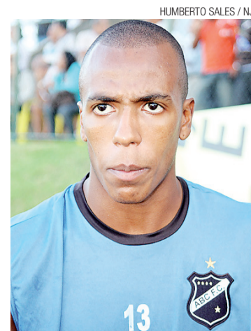
▶ Samuel pode entrar na direita

Tudo o concreto demolido do Machadoão e Machadoinho será completamente reaproveitado. Serão cerca de 10 mil metros cúbicos de concretos, processados na própria obra para servirem de base ao asfalto que será implantado no entorno da Arena das Dunas. As árvores retiradas do local serão replantadas.