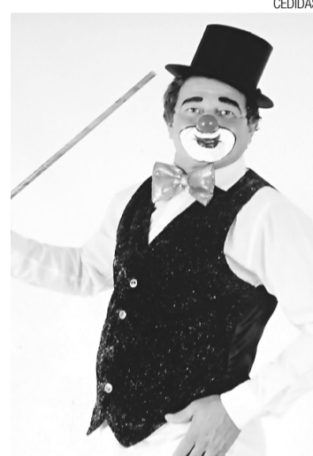
► José Milton Mariano da Silva é seu nome de batismo, mas podem chamá-lo de palhaço Tiririca