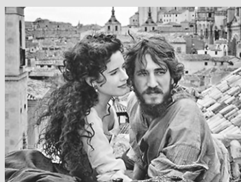
LOPE – [Cinemark] – 14h00