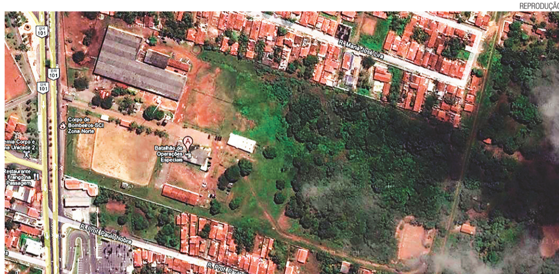
▶ Vista aérea do terreno onde será erguido o estádio na Zona Norte

Apesar de assegurar que a Arena das Dunas ficará pronta até dezembro de 2013, Rosalba preferiu não estimar tempo para o início e o término da construção do novo estádio da Zona Norte, que deverá servir como centro de treinamento para o evento mundial e, dependendo do cronograma, poderá ser utilizado para