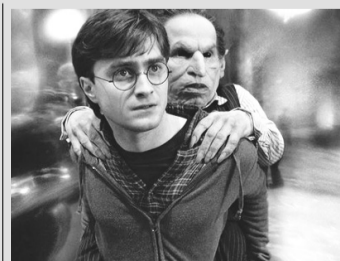
HARRY POTTER E AS RELÍQUIAS DA MORTE – [Cinemark] – 12h50 - 18h35 - 00h10 – [Moviecom] – 16:25 - 21:10

NÃO SE PREOCUPE, NADA VAI DAR CERTO! – [Moviecom] – 14:20 - 19:05