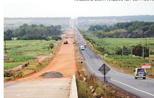
► Obra do Dnit é alvo de investigação

MP DENUNCIA GLEDSON E MAIS 10 POR DESVIAR VERBAS DA BR-101