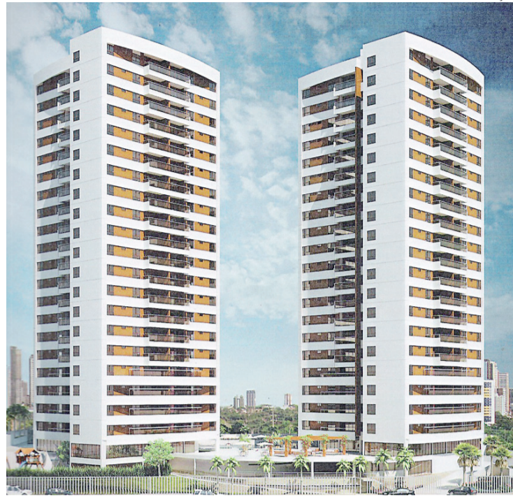
▶ Condomínio Saint Charbel: projeto de sustentabilidade

Outro dado único no bairro tem relação com o nível de escolaridade. De acordo com dados do Instituto Brasileiro de Geografia e Estatística, mais de um terço dos moradores de Capim Macio tem escolaridade acima de 10 anos e possuem nível superior.