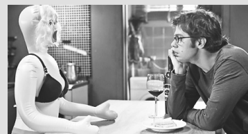
CILADA.COM – [Cinemark] – 12h45 - 15h00 - 17h20 - 19h40 - 22h00 - 00h20

DYLAN E DOG AS CRIATURAS DA NOITE [Cinemark] – 15:15 - 21:40