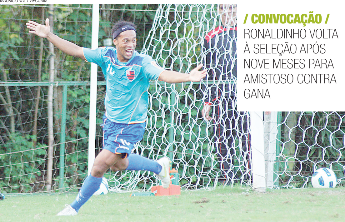
▶ Ronaldinho é destaque no Brasileiro

/ CONVOCAÇÃO / RONALDINHO VOLTA À SELEÇÃO APÓS NOVE MESES PARA AMISTOSO CONTRA GANA