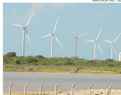
ANASTÁCIA VAZ / NJ

LEILÃO DE EÓLICA GARANTE AO RN INVESTIMENTOS DE R$ 1,7 BILHÃO