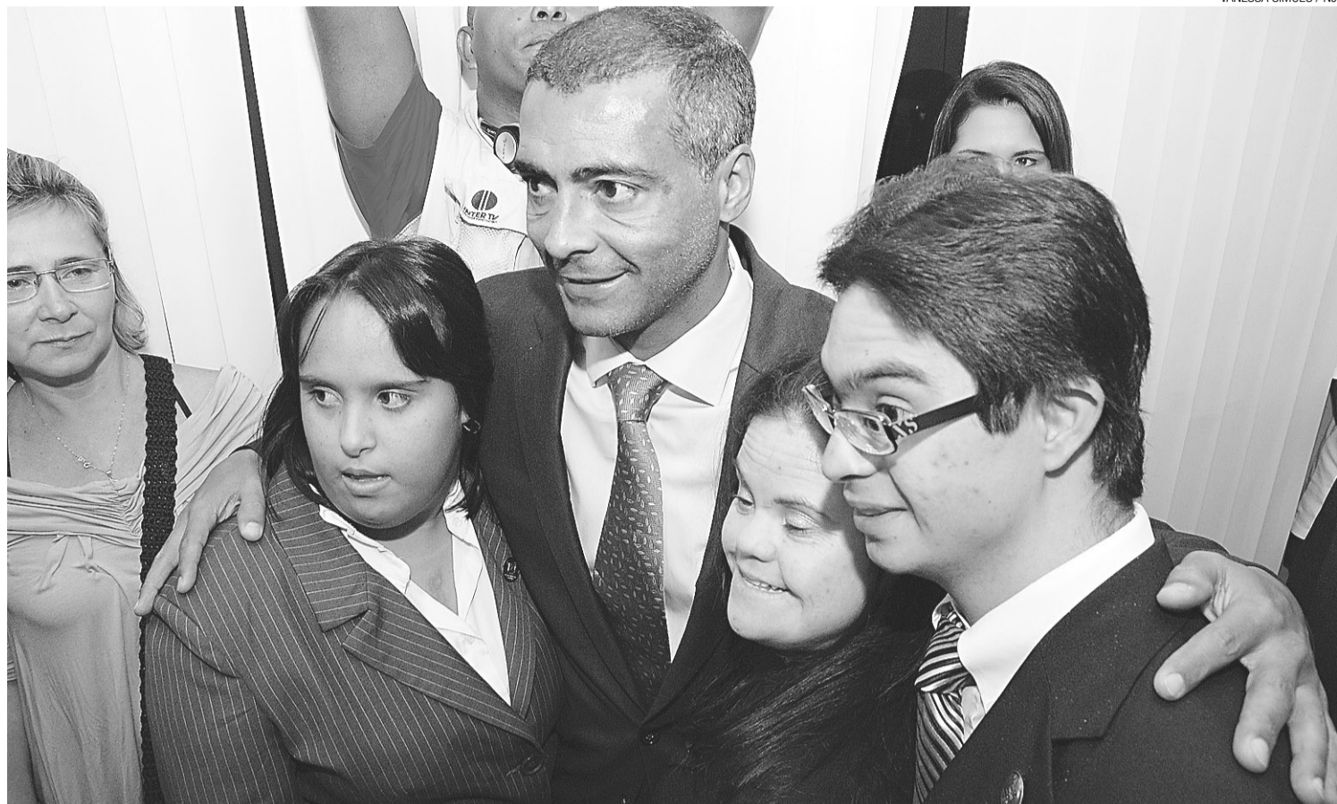
► Deputado federal Romário elogia iniciativa da Assembleia Legislativa do RN de contratar portadores de deficiência

No seminário, de prático, o deputado defendeu a união da classe política e se dispôs a ir à presidente Dilma Rousseff numa comissão articulada pelo deputado