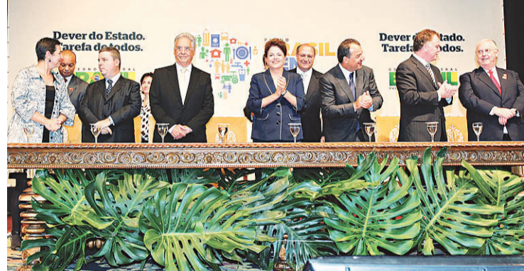
Dilma lança programa em São Paulo

Para atuar ao seu lado como anfitrião de Dilma, o governador Geraldo Alckmin, convidou o ex-presidente Fernando Henrique Cardoso -com quem ela já havia