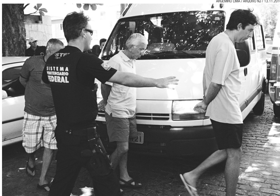
Antiga cúpula do DNIT foi presa em novembro do ano passado e estão soltas

da do cargo assim que as denúncias ganharam ares de escândalo foi indicada pelo deputado federal João Maia. Gledson, inclusive, é sobrinho do parlamentar potiguar. A denúncia encaminhada pelo Ministério Público chega à Justiça Federal menos de um mês depois do escândalo de corrupção no Ministério dos Transportes que acabou com a demissão de mais de 20 pessoas do órgão, incluindo o ministro Alfredo Nascimento.