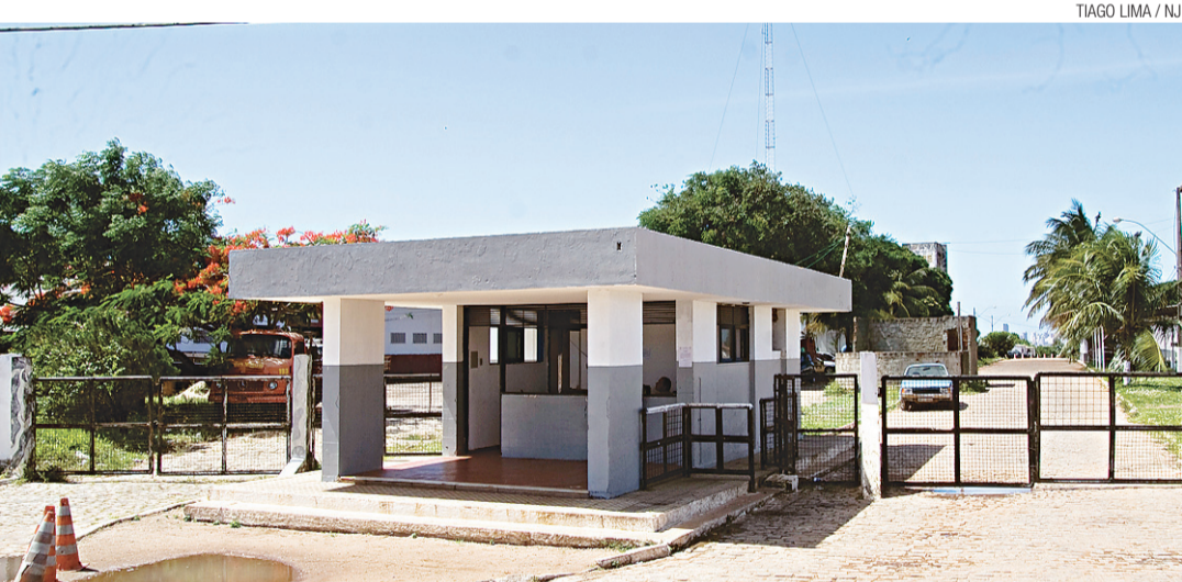
TIAGO LIMA / NJ

ENTRADA COMPLEXO POLICIAL NORTE DE CHOQUE E CAVALARIA, NA AVENIDA JOÃO MEDEIROS FILHO