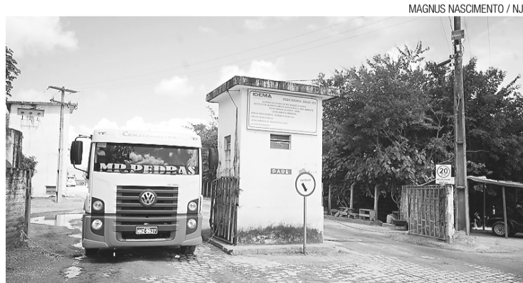
Pedreira Potiguar funciona em Macaíba

Recentemente, a Pedreira Potiguar se envolveu em outro escândalo de superfaturamento também sob investigação do Ministério Público Federal. Os contratos, no valor de quase R$ 20 milhões, foram firmados com o 1º Batalhão de Engenharia de Construção do Exército para obras no aeropórtio de São Gonçalo do Amarante e num trecho da duplicação da BR-101, especificamente a execução do serviço de drenagem urbana das marginais entre Natal e Parnamirim, ambos sob responsa-