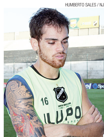
▶ Max assume vaga na zaga