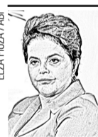
ELZA FIDUA / IBI

Mas, a existência do diálogo, e interesse, será possível acompanhar as primeiras mudanças. Inclusive na abordagem da questão salarial dos professores. Certamente que não existirá melhoria da educação sem a valorização do professor. A diferença será que esse reconhecimento aconteça sem a necessidade e medidas extremas como a greve, instrumento que vem sendo banalizado e só tem contribuído para agravar – ainda mais – um problema que já é muito grave. No esforço para recompor os prejuízos da última paralisação, bem que se pode tentar encontrar uma forma capaz de evitar sua repetição. Para o bem de todos e felicidade geral de mestres e alunos.