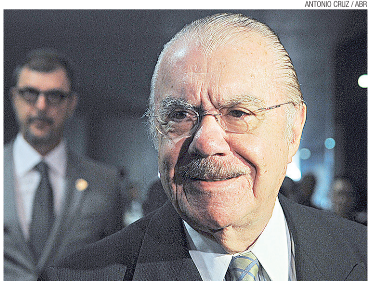
▶ Senador José Sarney

Para o líder do PSDB no Senado, Álvaro Dias (PR), apesar de não ser ilegal, o uso da aeronave para fins particulares não foi cor-