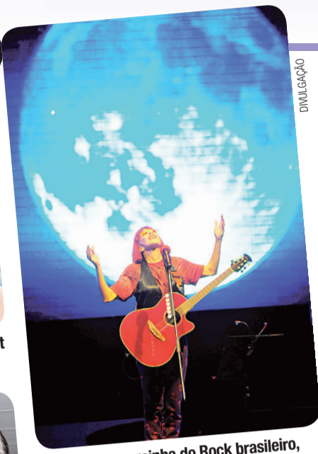
▶ Rita Lee, a rainha do Rock brasileiro, confirmando seu show ETC no Teatro Riachuelo em 16 de setembro