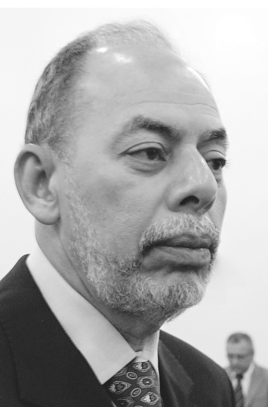
▶ Inácio Arruda, senador do PCdoB pelo Ceará

lhorar a mobilidade urbana nas cidades-sede, como Natal, disse Inácio Arruda. E é um momento especial porque o governo federal disponibilizou um aporte financeiro de R$ 15 bilhões para obras de mobilidade, fora os R$ 24 bilhões para as obras de mobilidade nos municípios. A Prefeitura de Natal e o Governo do Estado têm todo interesse em concluir essas obras que contam com o aval do Ibama e conselhos diversos para sua regulamentação, ponderou o senador.