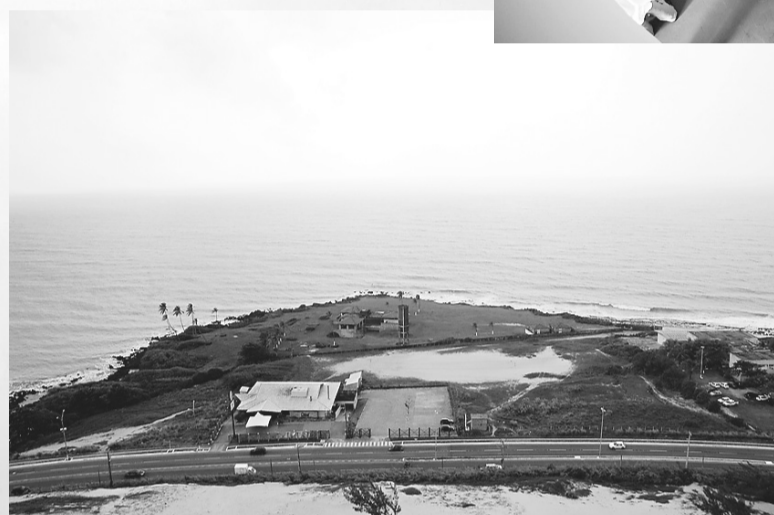
▶ Vista do alto do farol; alunos da Escola Estadual Senador Dinarte Mariz (acima)