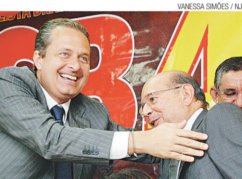
► Governador Eduardo Campos (PE) participou de evento do PSB; Iberê reapareceu após radiocirurgia