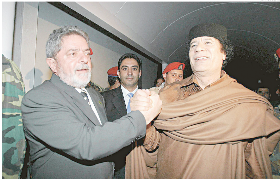
▶ Brasil apoiou ditador no governo Lula

Os rebeldes disseram que, até noite de ontem (horário local),