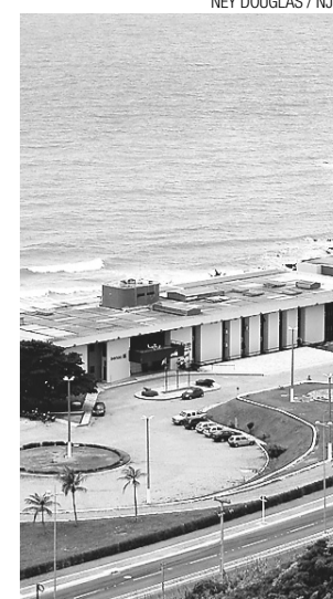
▶ Hotel Escola Barreira Roxa na Via Costeira, será ampliado