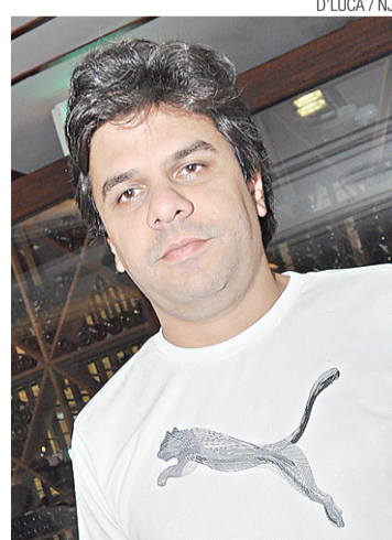
D'LUCA / NJ

Na hora de descer do veículo para entrar na praça esportiva, os jogadores foram "premiados" com mais um pouco da receptividade dos torcedores do adversário. "Lembro bem de cada jogador descendo e a comissão técnica também. Cada um que des-