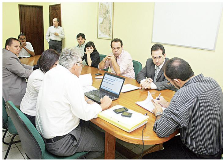
► Abertura de envelopes na Semob: homologação marcada para 4 de outubro