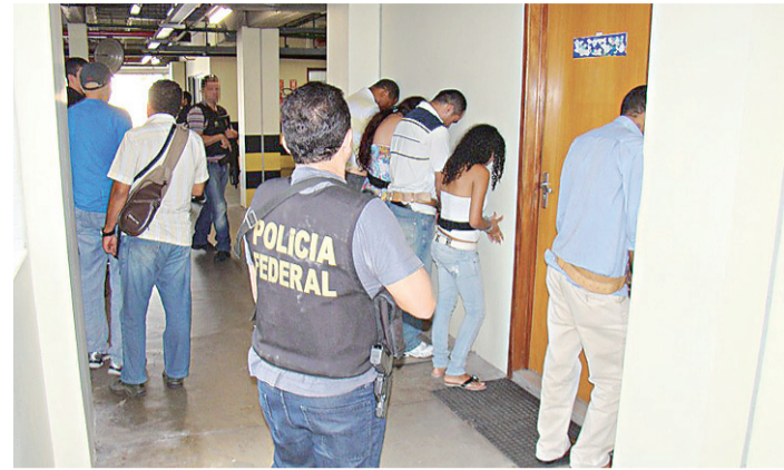
► Quadrilha foi presa na Paraíba e no RN