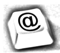
NEP/DOUGLAS / NU