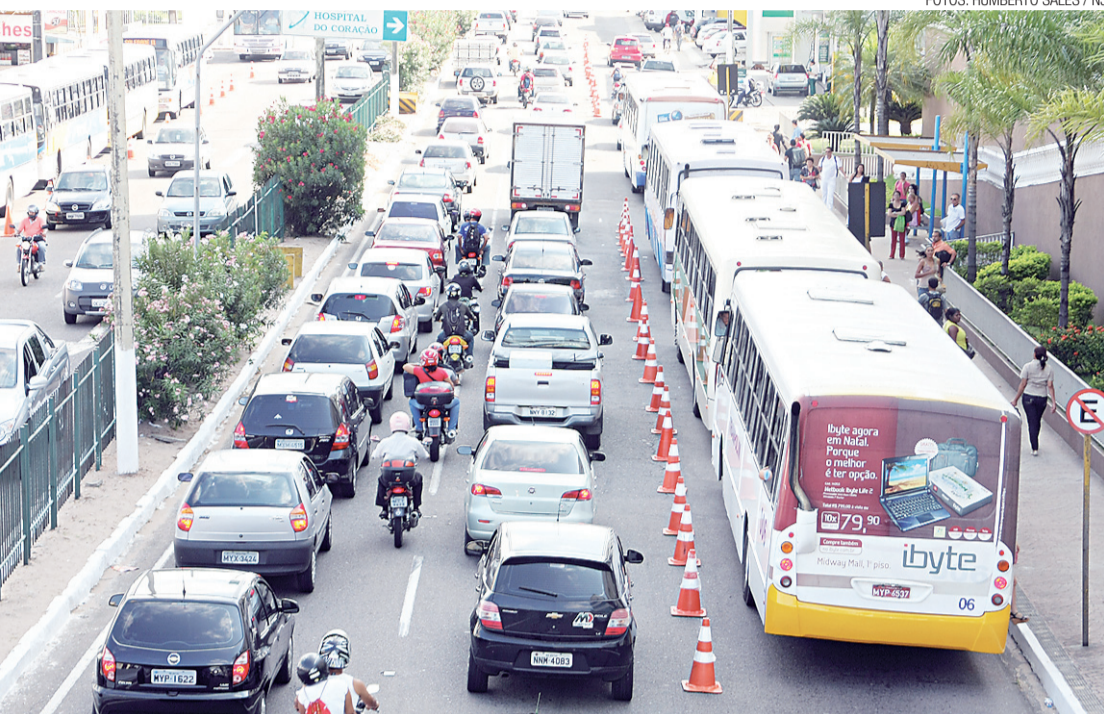
▶ Trânsito lento na avenida Salgado Filho com faixa exclusiva de ônibus, medida que a Semob pretende oficializar

ERA PARA TER sido um dia sem congestionamento no trânsito. Ou, digamos, um dia em que o tráfego fluísse com menos barreiras pela frente. Não foi. Ao contrário, em alguns pontos da capital, como nas avenidas Hermes da Fonseca e Salgado Filho, o engarrafamento foi ainda maior. Em Natal, o movimento "Na cidade sem meu carro", organizado pela Secretaria Municipal de Mobilidade Urbana (Semob), definitivamente não funcionou. Pior: a proposta de simular corredores exclusivos para ônibus, efetivada ontem pelo órgão, tumultuou mais ainda o trânsito.