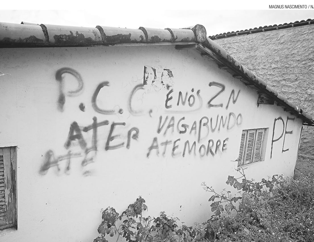
► Siglas de organizações criminosas presentes na comunidade Beira-Rio: casas desocupadas, vizinhos não falam