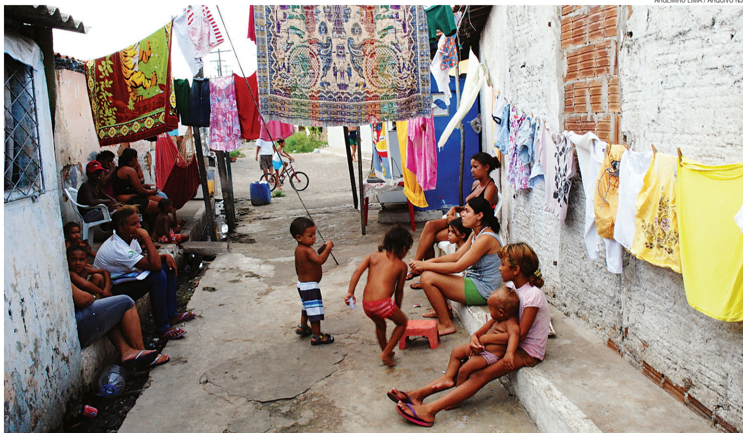
► Condições habitacionais: um dos quesitos analisados pelo Instituto de Pesquisa Econômica Aplicada