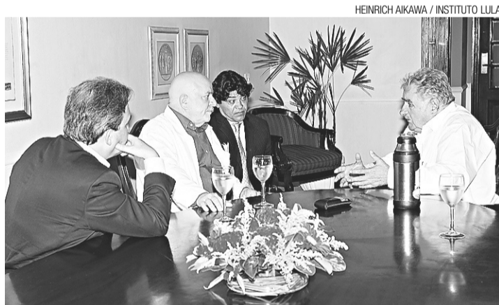
► Lula recebeu visita do presidente do Uruguai, José Mujica

O ex-presidente fez ontem, no hospital Sírio-Libanês, a décima das 33 sessões às quais será submetido. A radioterapia tem sido aplicada todos os dias, de segunda a sexta-feira.