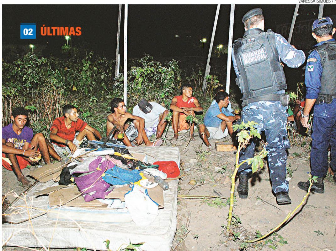
VANESSA SIMÕES / NU

MORADORES DE RUA SÃO RETIRADOS DA PRUDENTE