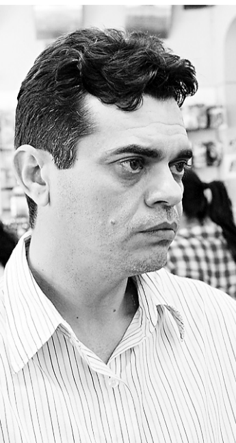
PEDRO VALE DO NOVO JORNAL

/ EDUCAÇÃO / CONSUMIDORES RELATAM PÉRIPO QUE REALIZAM PARA GARANTIR A COMPRA DO MATERIAL ESCOLAR PARA OS FILHOS