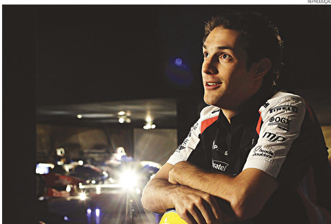
▶ Bruno Senna quer trazer lembranças do tio na Williams

O diretor-geral Frank Williams disse: "Bruno só começou a correr com 20 anos de idade, mas logo mostrou seu talento na Fórmula 3 e na Fórmula GP2. Em uma batalha apertada pelo título da Fórmula GP2 em 2008, Bruno terminou em segundo no campeonato com vitórias notáveis em Mônaco e Silverstone, esta última no molhado. As circunstâncias de suas duas primeiras temporadas na Fórmula 1 não lhe ofereceram a oportunidade ideal de ter uma performance consistente. Por isso, foi essencial passarmos o máximo de tempo com ele para compreendê-lo e avaliá-lo como piloto. Fizemos isso tanto na pista quanto em nosso simulador, condições em que ele se mostrou rápido, com bom entendimento técnico e, acima de tudo, capaz de aprender e aplicar esse aprendizado rápida e consistentemente.