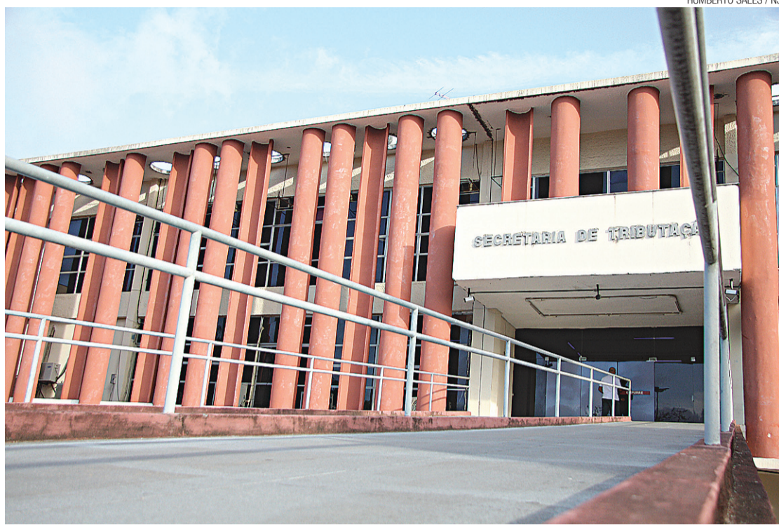
► Secretaria de Tributação conseguiu aumentar em 20,14% a arrecadação de ICMS no ano passado em relação a 2010

A mudança no recolhimento de impostos revogou cinco decretos que tratavam do regime especial para o setor atacadista e atendiam a setores específicos: alimentos, medicamentos, material de construção, importação e os produtos da chama-