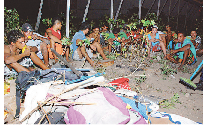
► Todo o pessoal recolhido na rua foi encaminhado para tratamento

UMA OPERAÇÃO DA Secretaria Municipal de Segurança Pública e Defesa Social (Semdes) recolheu ontem 21 moradores de rua, no bairro de Lagoa Nova. Eles atuavam como trabalhadores informais, limpando carros e pedindo esmolas, e foram denunciados por moradores da região devido a uma série de furtos e de um suposto esquema de tráfico de drogas na Avenida Prudente de Moraes, na área próxima ao Hipercar Bom Preço.