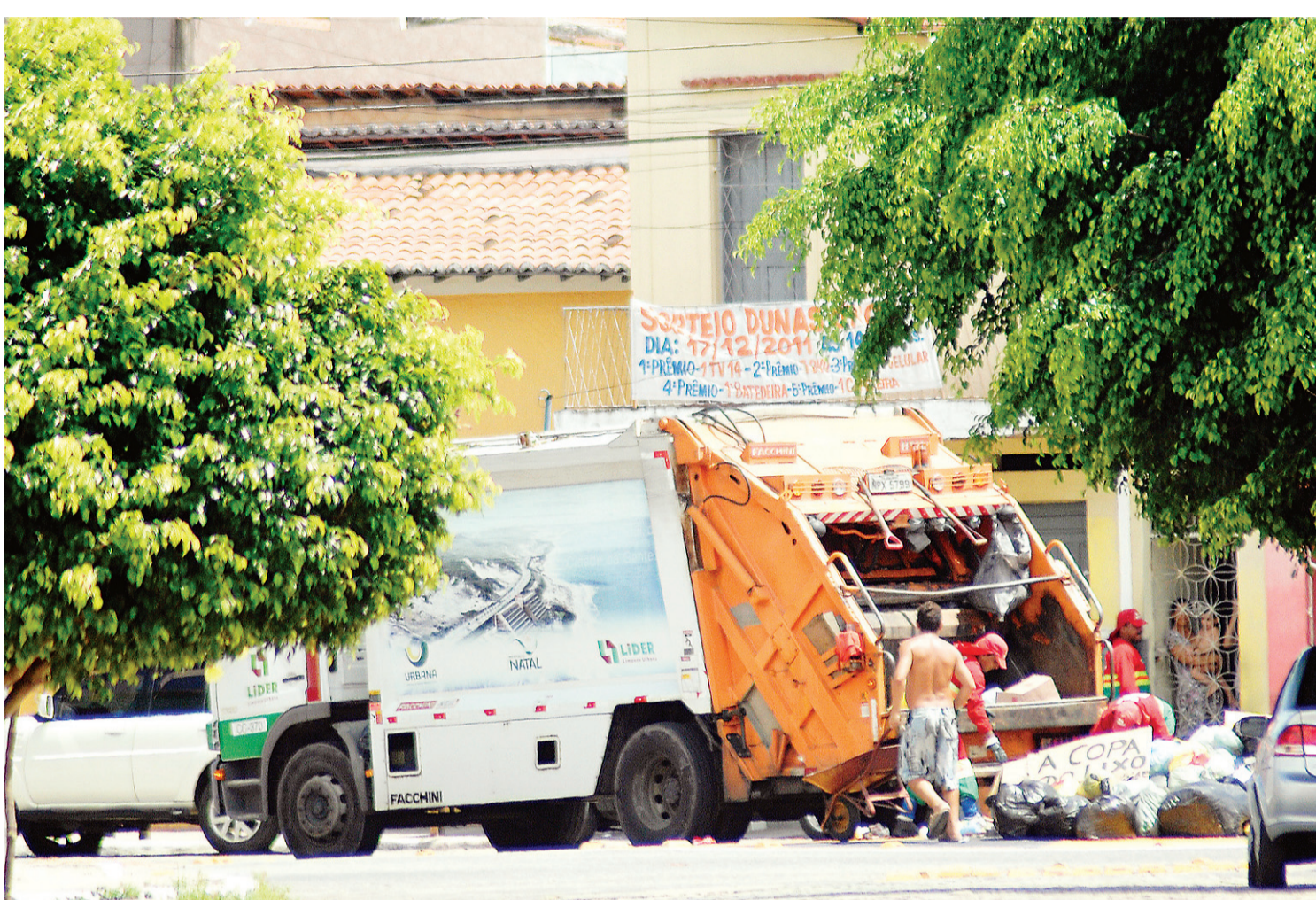
► Nova licitação do sistema de coleta de lixo deve acontecer em fevereiro

/ MEIO AMBIENTE / LISTA DA URBANA INDICA QUE MAIS DE 60 GRANDES GERADORES DE RESÍDUOS SÓLIDOS JÁ REALIZAM SUA PRÓPRIA COLETA; COM A POSSÍVEL REDUÇÃO DO TETO PARA 150 QUILOS POR DIA, COMPANHIA NÃO SABE QUANTAS NOVAS EMPRESAS SERIAM ENQUADRADAS NA NOVA LEI