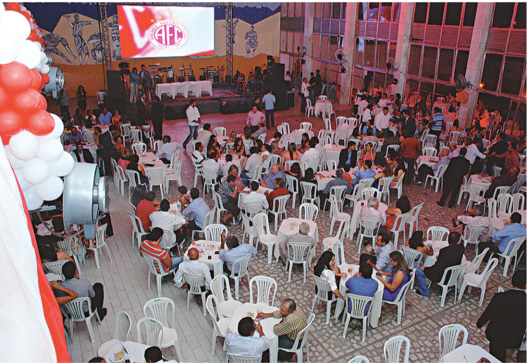
▶ Americanos marcaram presença no evento

que as coisas serão tratadas com objetividade, pois no mundo de hoje, tem que ser assim, mas ao mesmo tempo, sem a emoção que tem o futebol. Será uma gestão com a razão”, assegurou.