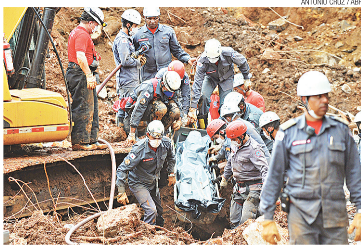
▶ Bombeiros retiram corpo soterrado no deslizamento da rodoviária de Ouro Preto

As outras duas mortes registradas hoje ocorreram no dia 3. As vítimas são dois homens, de 81 e 42 anos, ambos de Guidoal, cidade da zona da mata, que foram arrastados pela enxurrada. Com eles, subiu para oito o número de