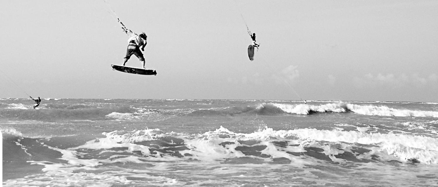
► Situado no litoral norte, município de São Miguel de Gostoso é point de turistas estrangeiros e um dos melhores locais para a prática de esportes como o kite-surf

Segundo ele, o traçado desta rodovia federal foi feito com o objetivo de não passar por uma única cidade ou conglomerado urbano do litoral norte potiguar. A estrada passa a uma distância em torno de 5Km destas cidades, o que ajuda a preservar as praias do litoral norte. Trata-se de um modelo de traçado de estrada que virou referência de bom planejamento de rodovia no país.