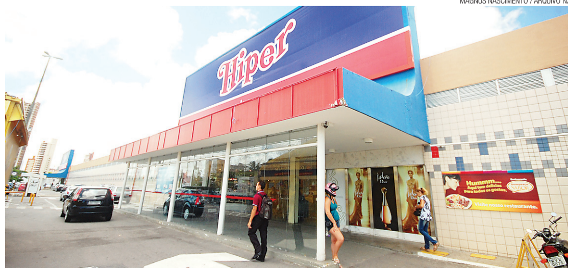
► Algumas lojas do Hiper, onde fica a lotérica, chegaram a fechar temendo assalto

No local, os policiais que atenderam a ocorrência informaram que nesses casos, o melhor a fazer é manter a calma e tentar pedir auxílio a alguém que esteja próximo.