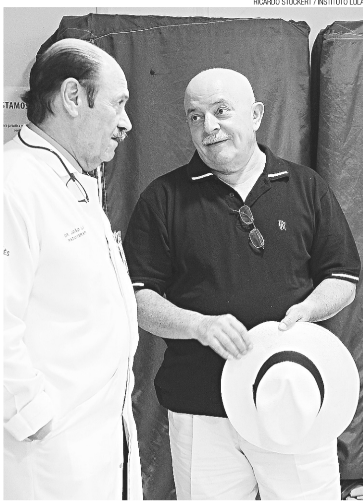
Lula conversa com o médico antes da sessão

Ele afirmou ainda que Lula tem trabalhado com uma fonoaudióloga para evitar complicações como o uso de uma sonda alimentar. "Vamos trabalhar e torcer para que isso não seja