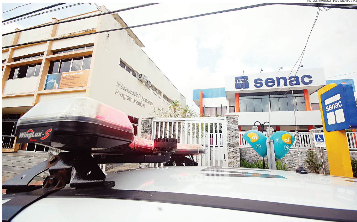
► Caixa eletrônico do Banco do Brasil, localizado no Senac do Alecrim, na Avenida Alexandrino de Alencar, foi arrombado

Enquanto o reforço não cai em campo, resta noticiar o que a bandidagem já vem fazendo. Quanto ao arrombamento do caixa eletrônico no Senac, a polícia informou que quatro homens fortemente armados com pistolas e espingardas usaram um maçarico para saquear o terminal. Este tipo de empreita-