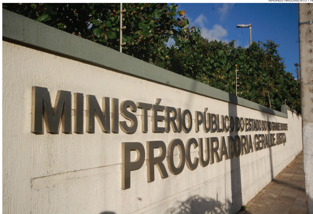
► Ministério Público aguarda decisão judicial

teve 59 denúncias de peculato em seu nome, outras 59 para falsidade ideológica, e apenas uma por formação de quadrilha.