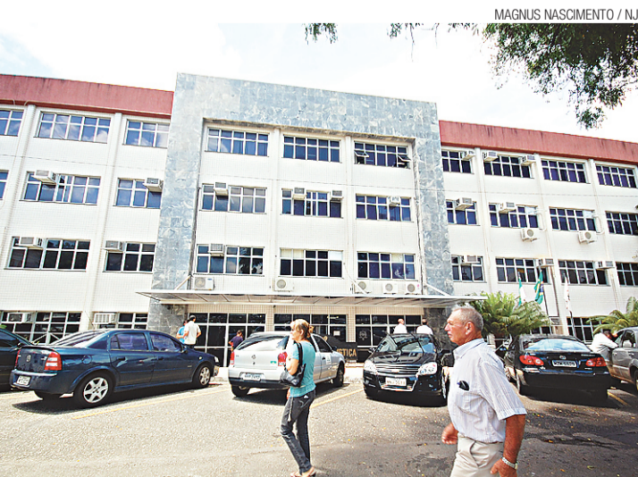
► TJ reabriu setor está sob investigação