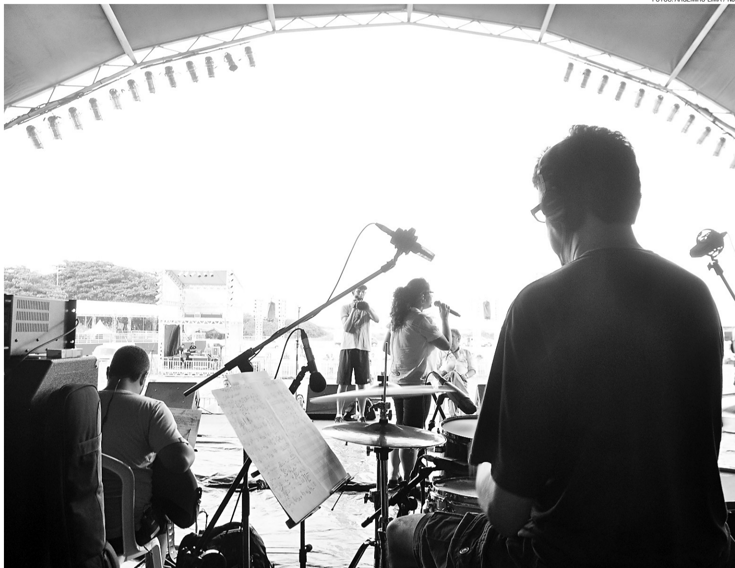
▶ Ensaio geral na tarde de ontem, na Arena da Fé, Praia do Forte