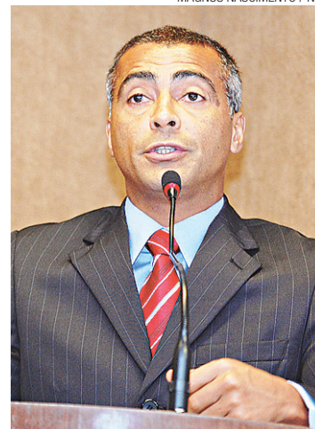
▶ Romário, na ofensiva

O deputado disse acreditar que seja por "falta de objetividade e de sensatez que algumas coisas lamentáveis" ocorram no país. "Tem coisas que só acontecem na política. E hoje, mais do que nunca, tenho certeza disso."