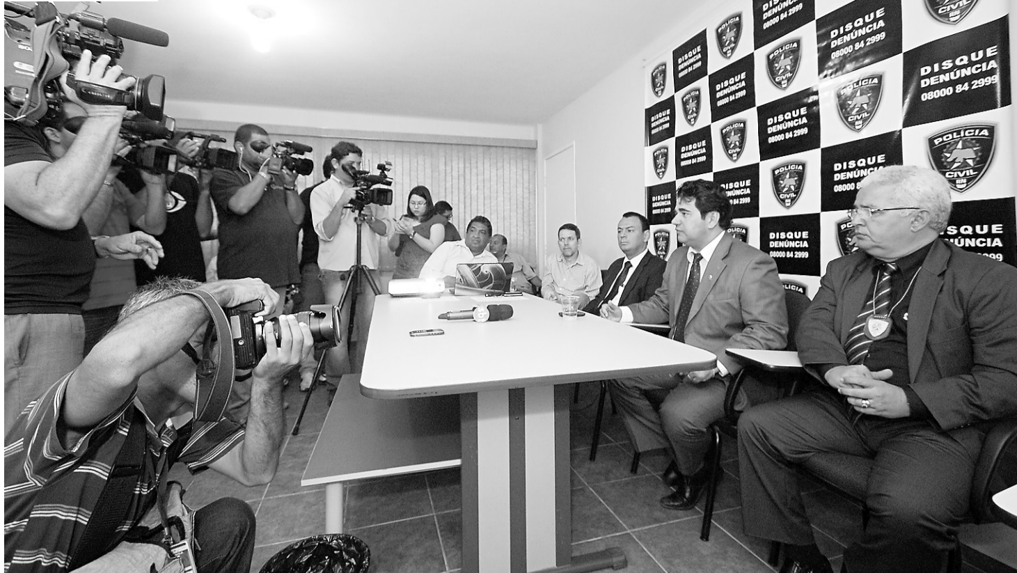
► Entrevista coletiva concedida na manhã de ontem para apresentar o resultado da Operação Curinga