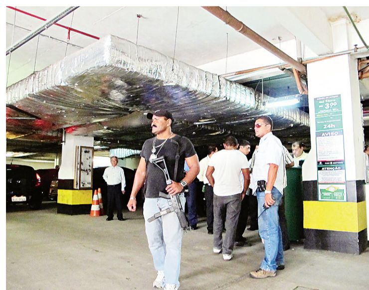
► Polícia analisa sistema interno de câmeras do Natal Hospital Center

O Natal Hospital Center tem um sistema interno de câmeras que pode ter flagrado o assalto. Para não interferir na investigação, a Polícia Civil preferiu não divulgar detalhes, mas as imagens do circuito interno de vigilância serão usadas na tentativa de identificar o assaltante. Até o fechamento desta edição, a polícia não tinha pistas do bandido. Muito menos havia recuperado o Civic roubado. (Felipe Galdino)