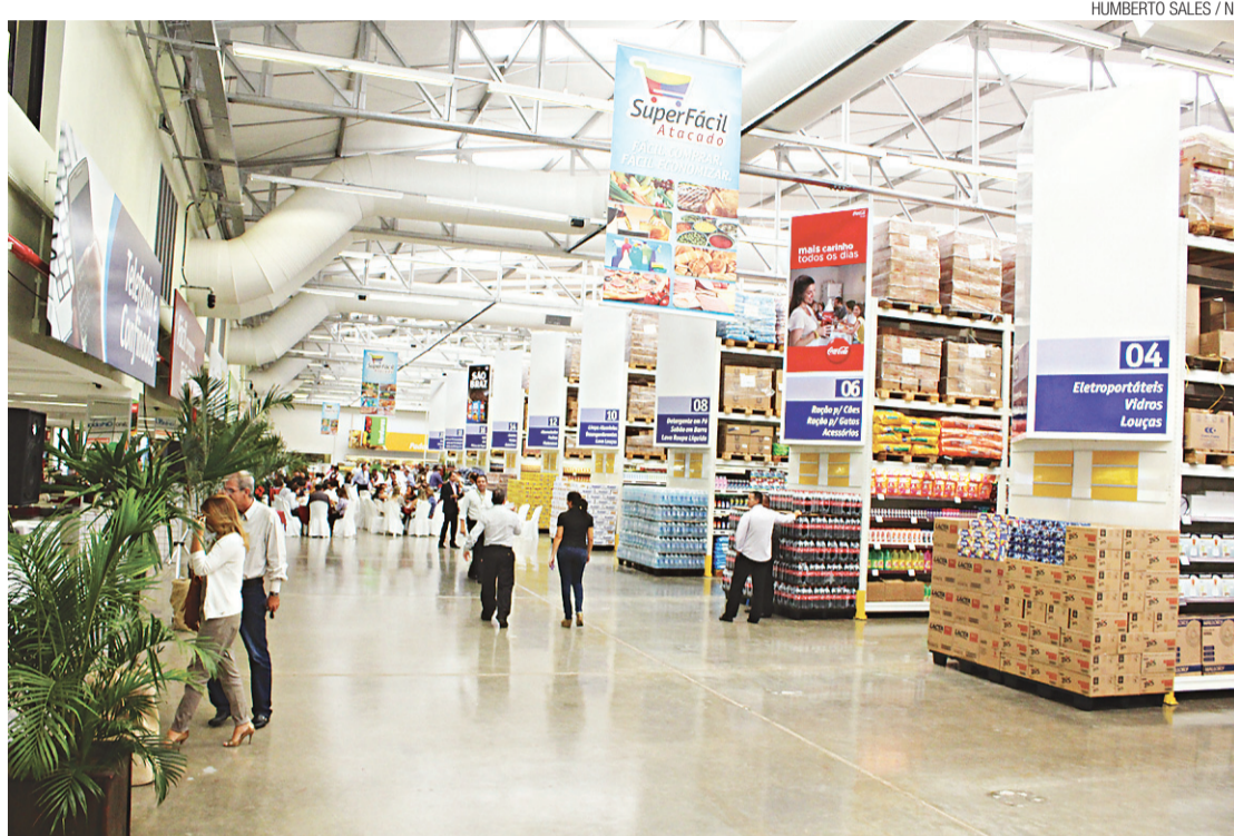
Loja SuperFácil do Nordestão é resultado de um investimento de R$ 10 milhões