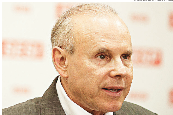
▶ Guido Mantega pediu garantias de que empregos serão mantidos

alíquota de IPI zerada. A alíquota cobrada do papel de parede foi reduzida de 20% para 10%, e o imposto de luminárias e lustres cairá de 15% para 5%.