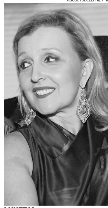
LUXERIA Sovânia Monte confere as novidades da expansão do Natal Shopping Center em festa no Ocean Palace.

O Nóbile Suítes, em Ponta Negra, é, desde ontem, ponto de convergência de designers potiguares em torno da Semana de Artes Gráficas. O evento é realização do Sindicato das Indústrias Gráficas do Rio Grande do Norte (Singraf-RN) e a Associação Brasileira de Tecnologia Gráfica (ABTG).