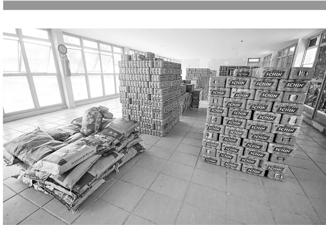
▶ Mais de duas mil caixas de bebidas alcoólicas também foram apreendidas na casa de um integrante da quadrilha