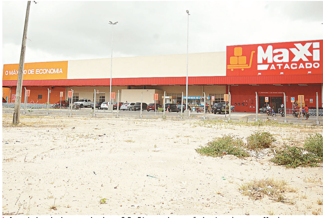
▶ Aumento do poder de compra das classes C, D e E tem gerado expansão dos atacarejos, como o Maxxi

caixa no perfil atacadista tradicional, conhecido em inglês como cash&carry. Tem foco direcionado para os transformadores de alimentos - hotéis, restaurantes, cafeterias, pequenos varejis-