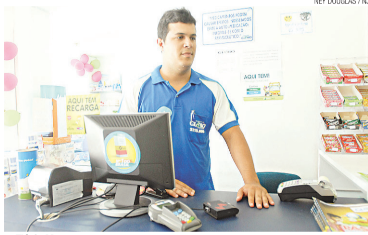
NEY DOUGLAS / NJ

► Cartões do Natal Card poderão ser recarregados fora da sede da empresa