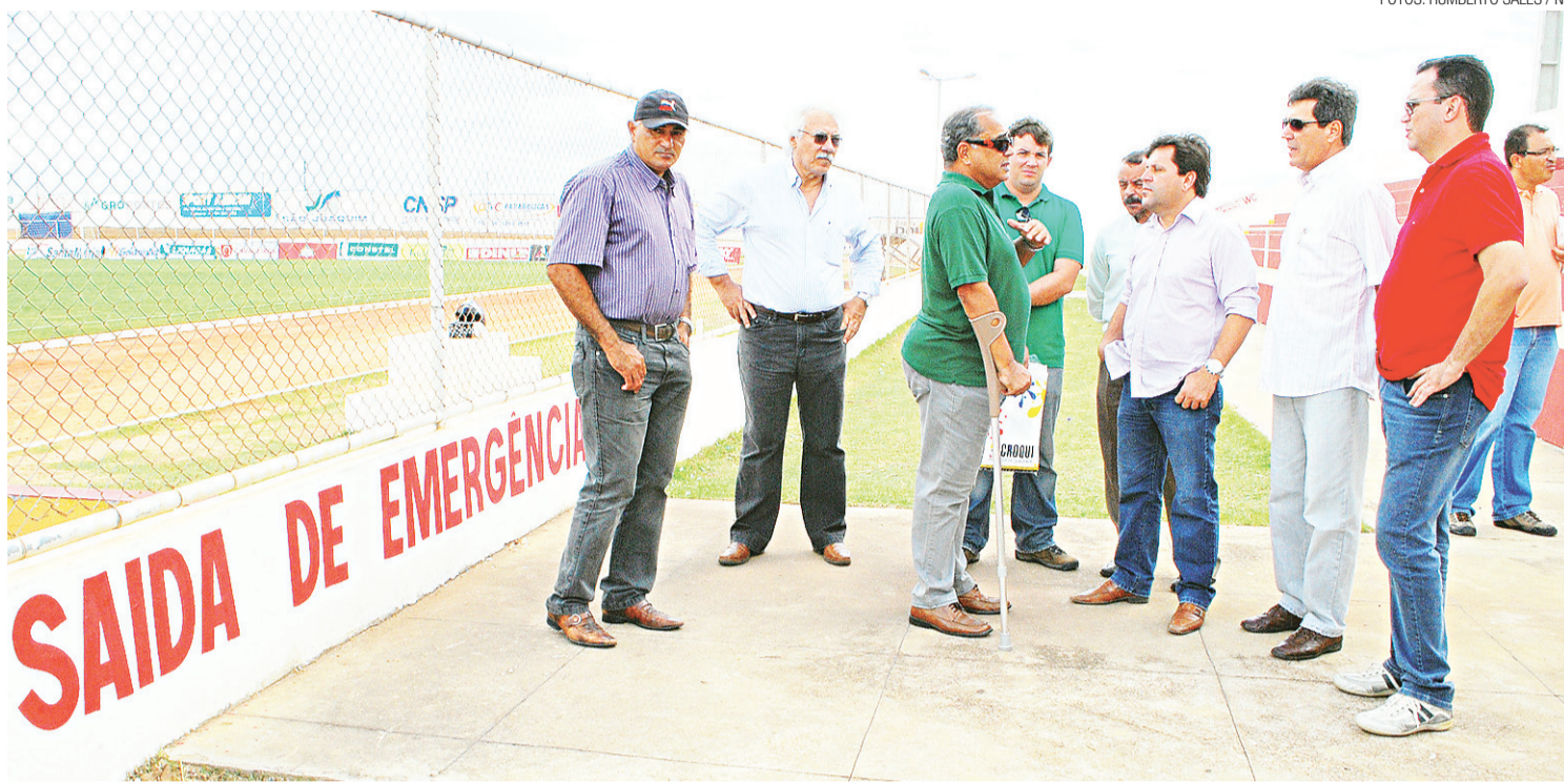
► Vistoria percorreu todas as instalações do Nazarenão

Para que um estádio seja qualificado para sediar os jogos do campeonato, é preciso que sua capacidade de lotação seja, no mínimo, de 10.500 pessoas. A capacidade máxima de público sentado no Nazarenão é de aproximadamente 3.800, de acordo com o padrão da CBF e