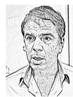
NEY DOUGLAS / NU

“Competitividade é uma plantinha muito frágil. Se ela morrer quem sofre é o trabalhador”