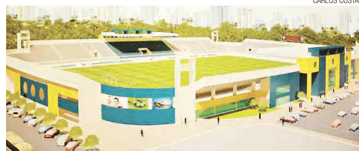
▶ Maquete mostra como ficará o novo Nogueirão