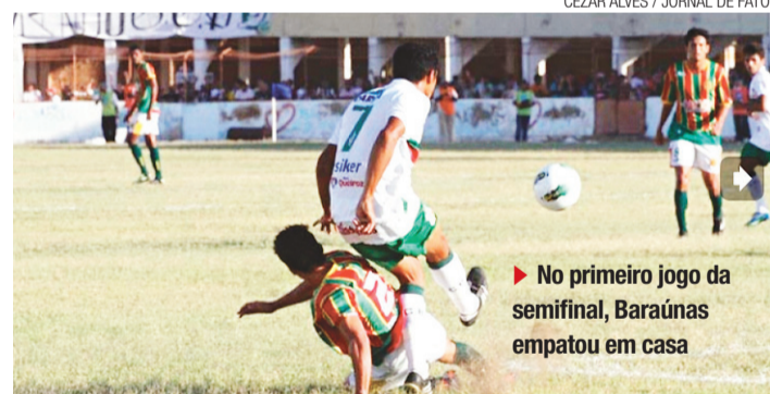
▶ No primeiro jogo da semifinal, Baraúnas empatou em casa