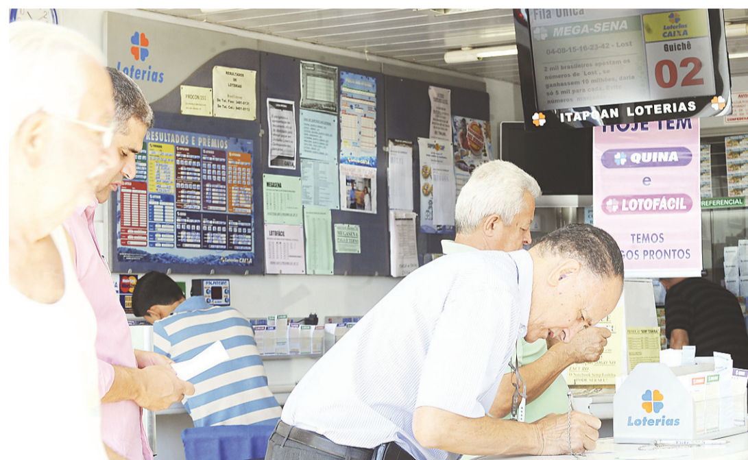
► Com a medida, chegam ao fim os problemas causados em apostas conjuntas

No Bolão Caixa, o número mínimo de cotas é dois e o máximo pode chegar a 100, dependendo da modalidade escolhida. O valor mínimo para