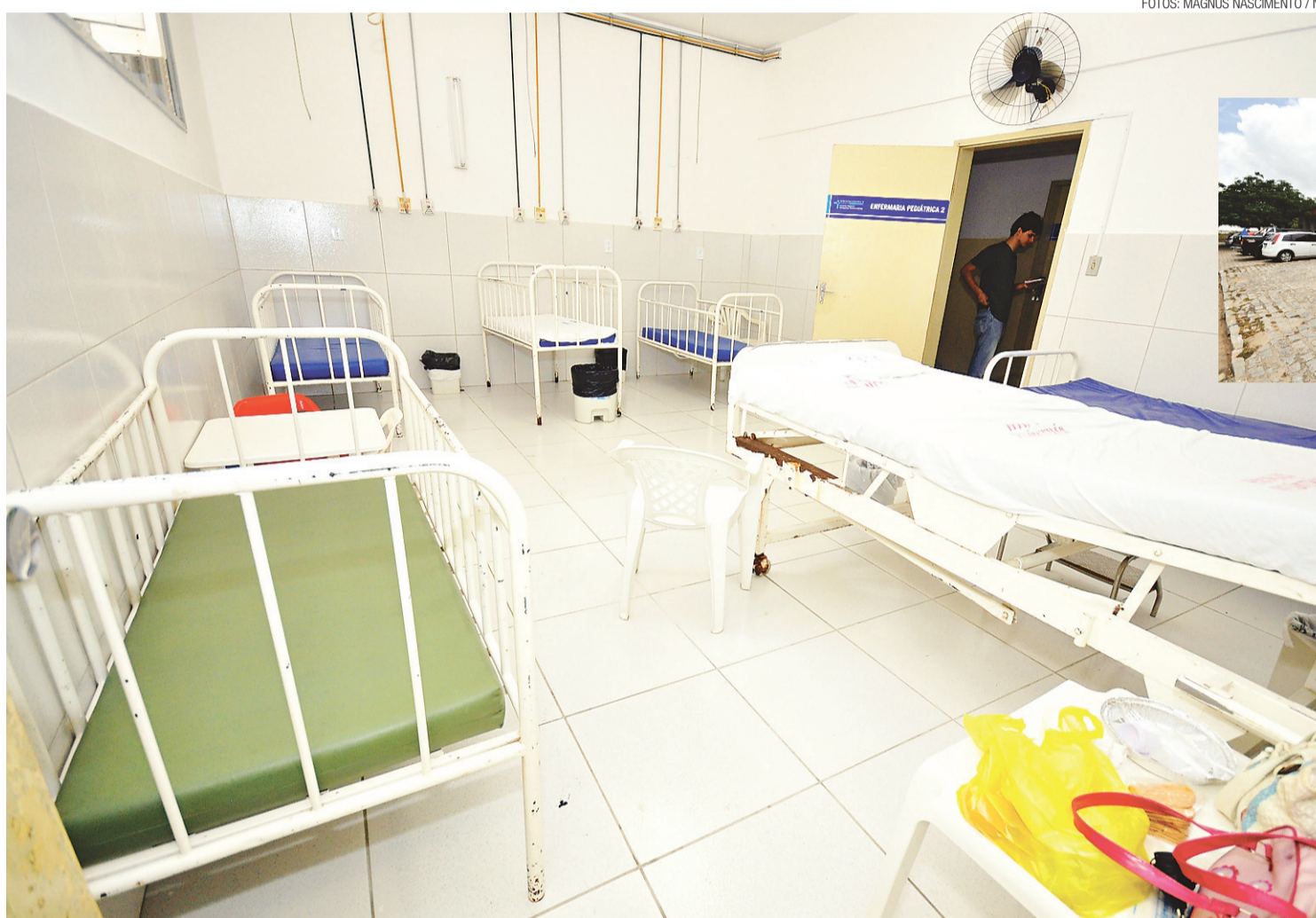
▶ NOVO JORNAL constatou que no Hospital Regional Monsenhor Antônio Barros, na quinta-feira passada, 18 dos 50 leitos disponíveis estavam desocupados

Inaugurado no dia 17 de setembro de 1996, o hospital Antônio Barros presta serviços nas áreas da pediatria e clínica geral, realiza cirurgias eletivas (operações programadas e relativamen-