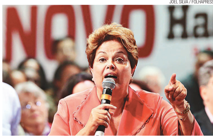
▶ Dilma: "Não tem como dirigir o Brasil sem meter o bico em São Paulo"

Ela citou dois programas federais, Minha Casa Minha Vida e Pró-Infância, para defender o voto em Haddad, a quem chamou de "companheiro de fé". Lula e Haddad também marcaram seus discursos por ataques a Serra. "Depois de ouvir a presidente, eu, se fosse um certo candidato, ficava de bico fechado. Vai falar mal da Dilma?", disse o candidato a prefeito. "O meu bico não é tão grande como o dos tucanos, mas não é de predador", afirmou Lula, depois de dizer que Serra "não tá afim de ser prefeito de São Paulo."