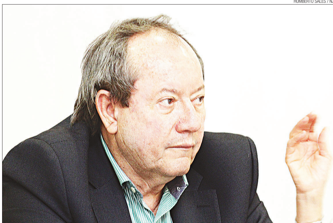
► Sílvio Torquato, secretário estadual de Desenvolvimento Econômico: "Queremos reerguer o Centro Industrial Avançado"

Ele compartilha da visão do diretor regional do IBGE, Aldemir Freire. O economista disse acreditar que os PIBs relativos aos anos de 2011 e 2012 serão ainda menores do que os já constatados, e que se destacaram negativamente.