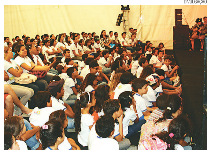
► Festival Literário de Pipa: uma edição mais infantil