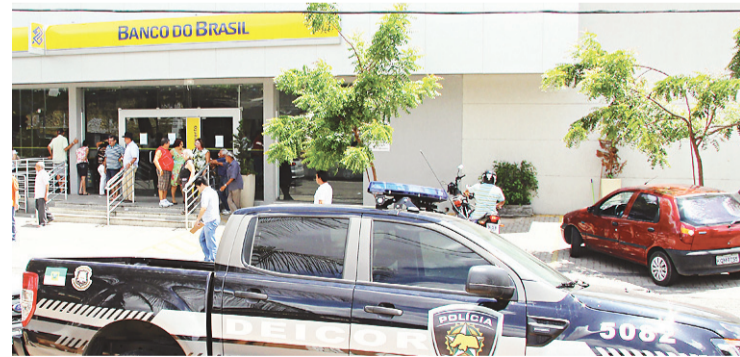
Assalto à agência do Banco do Brasil da avenida Jaguarari no dia 5