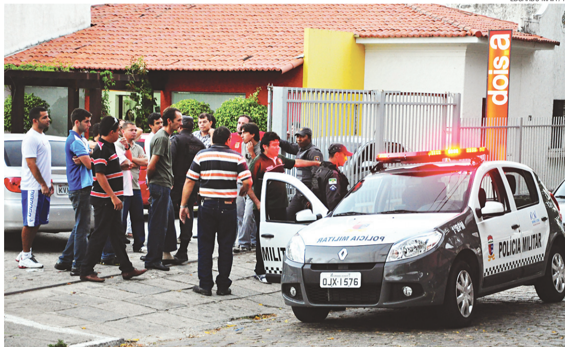
Assalto à agência de publicidade DoisA na última terça-feira: pânico entre as vítimas

Uma semana depois, outra joalheria tornou-se alvo, dessa vez em um supermercado da Zona Sul. Nesse mesmo dia, cerca de uma hora antes, bandidos haviam invadido a agência do Banco do Brasil localizada na Avenida Jaguarari.