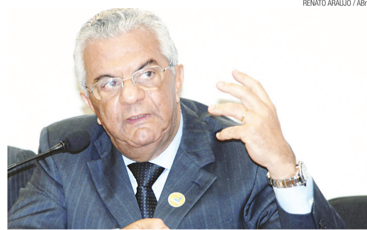
► Segundo Hermes Chipp, usinas a óleo serão as primeiras a serem desligadas