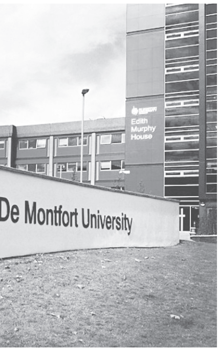
sete estudantes brasileiros, sendo uma potiguar