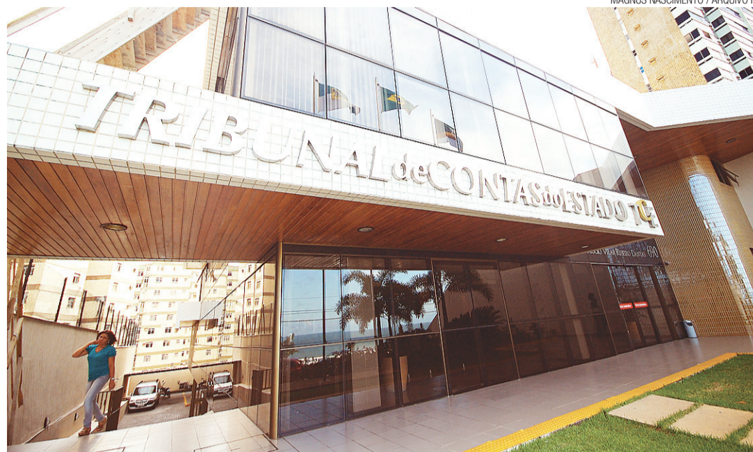
► TCE oferece salário de R$ 24.117,62 a um conselheiro e mais cinco assessores à sua disposição