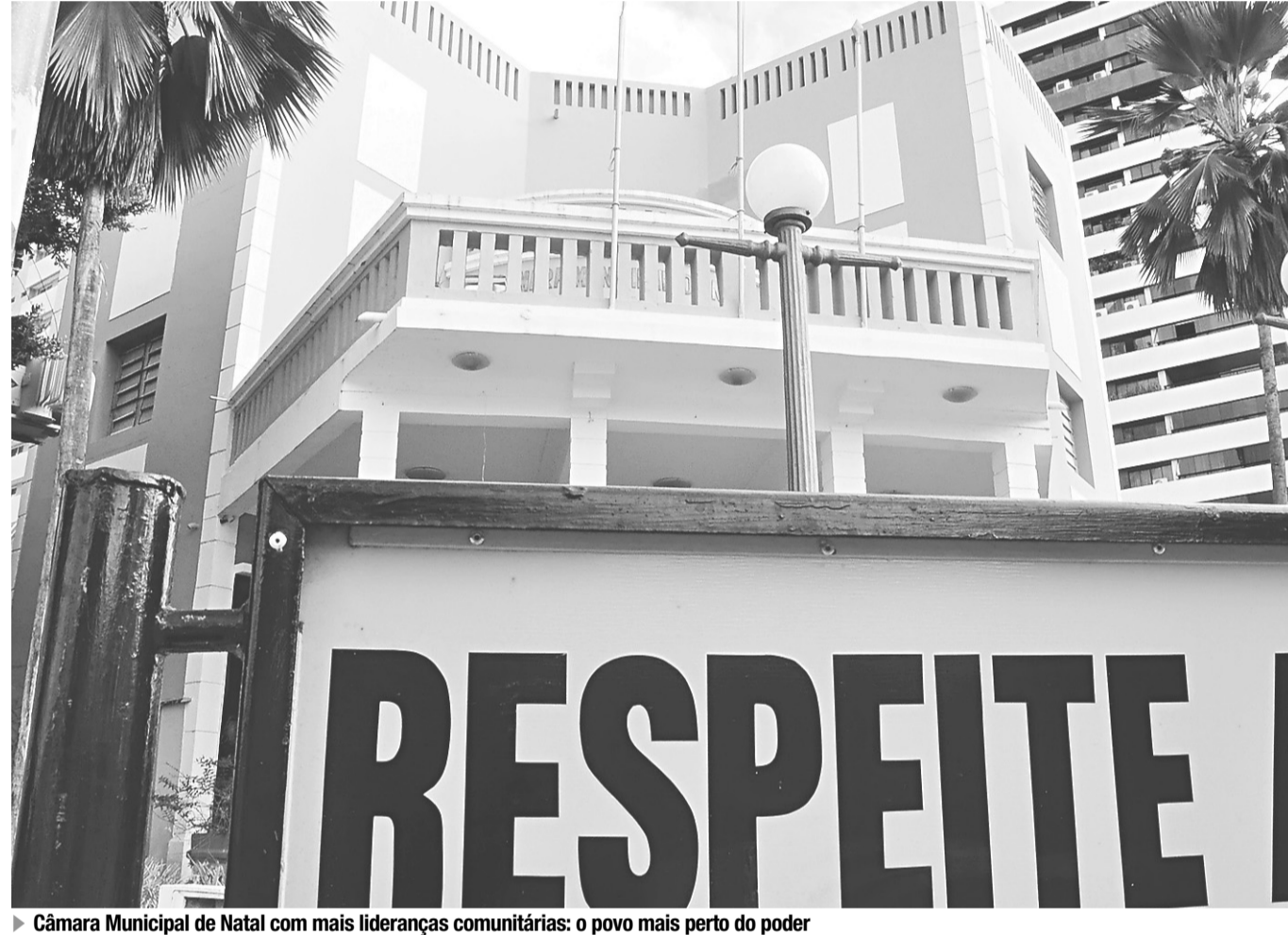
► Câmara Municipal de Natal com mais lideranças comunitárias: o povo mais perto do poder