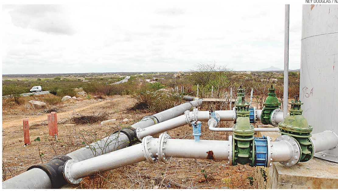
► Adutora Sertão Central Cabugi, em Angicos, é uma das que sofre com os desvios de água

As informações foram repassadas ontem durante coletiva de imprensa na sede da Secretaria de Meio Ambiente e dos Recursos Hídricos (Semarh). De acordo com o presidente da Caern, Yuri Tasso, o problema se repete em toda a malha de adutoras. As maiores preocupações estão no Sistema Adutor Monsenhor Expedito, por ser o maior, abastecendo 23 cidades e 184 comunidades rurais, e a Sertão Central Cabugi. Os detalhes das operações não são divulgados porque o objetivo é autuar os responsáveis pelo "gato" em flagrante. "Nós queremos impedir que eles desmontem o desvio e depois montem novamente", ressaltou. O autor