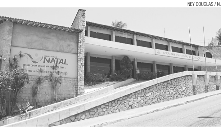
▶ Prédio do antigo Novotel teve contrato renovado por seis meses; imóvel onde funciona a Semtas teve reajuste no valor do aluguel