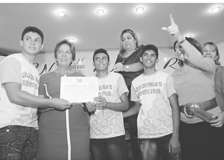
► Grupo recebe certificado da governadora em homenagem à conquista científica

Os três também estão iniciando os estudos para a produção em larga escala. A ideia, inicialmente, é comercializar para os produtores agrícolas da região de Apodi. O custo do produto é outra vantagem para a comercialização. O quilo da fruta utilizando a cera é apenas R$ 0,40 mais caro que o da produção normal. "Temos de avaliar melhor como iremos comercializar a cera, mas temos certeza que será um sucesso", comenta o estudante.