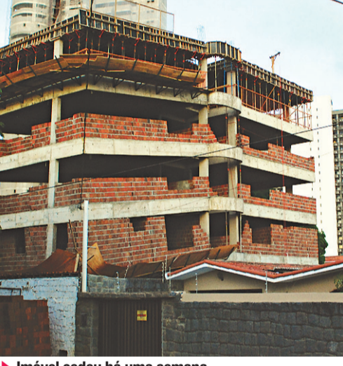
► Imóvel cedeu há uma semana