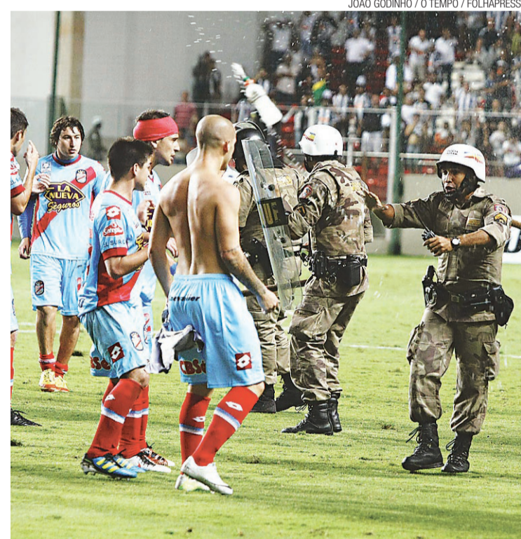
▶ Jogadores do Arsenal enfrentaram policiais militares no estádio Independência

Um defensor público também estava presente, assim como um representante do consulado argentino. Os agressores foram identificados também com a aju-