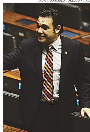
► Deputado Marco Feliciano

tos que cobram sua saída do cargo. “Não posso concordar com o fechamento das comissões como regra, como norma permanente. Fechamento só por excepcionalidade”, disse.