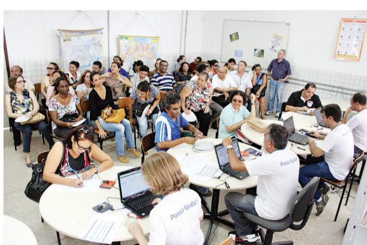
► Docentes aguardam na fila para receber os dispositivos

o ensino e compartilhamento da informação, principalmente porque são portáteis e de fácil manuseio. São mecanismos de interação e de inclusão digital. Servem para pesquisas e criação de práticas mais eficientes ao ensino”, aponta.