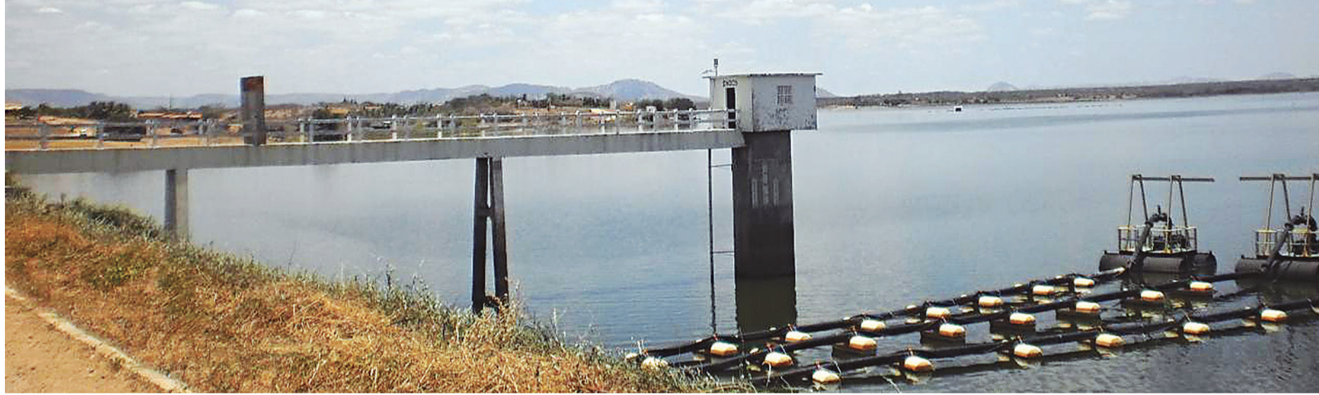
▶ Barragem de Pau dos Ferros está com apenas 16,7% da sua capacidade

de 50% do volume atual, não apresenta preocupações quanto à interrupção de fornecimento.