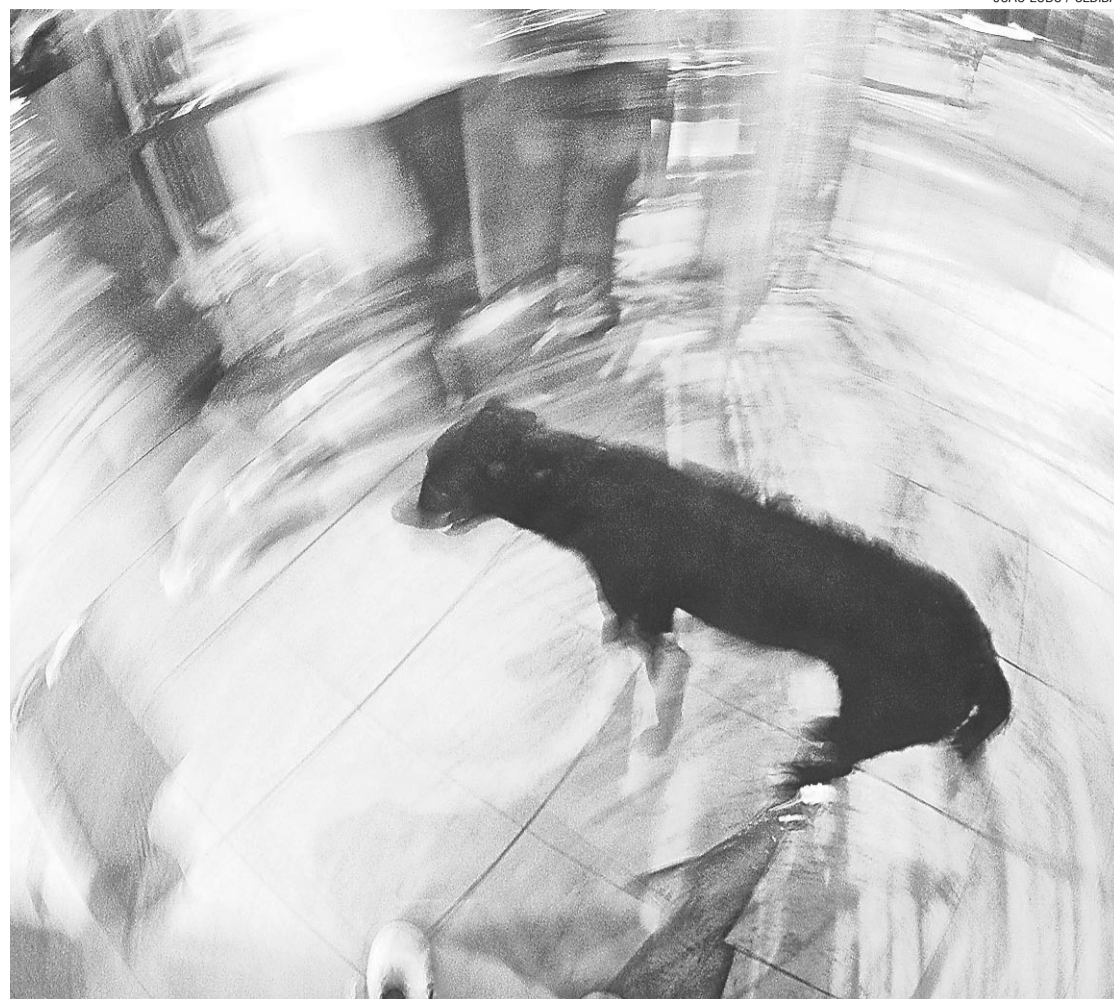
► "Fiel", o melhor amigo do homem na visão contemporânea de João Lobo

Os filmes do projeto também seguem a mesma linha de desconstrução. Com duração de seis minutos cada, promovem uma interação entre imagens congeladas e imagens em movimento, além de realizar inserções das