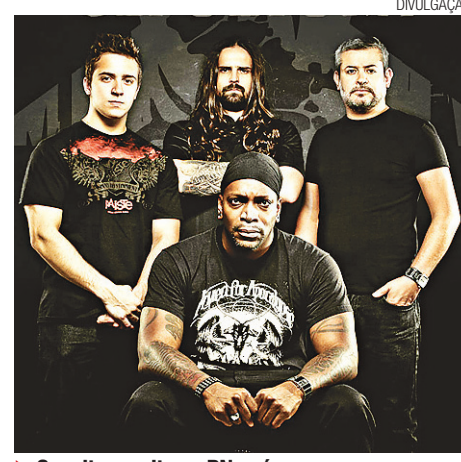
Sepultura volta ao RN após nove anos

Praia mais badalada do litoral sul promove a partir de hoje o primeiro "Pipa Rock Festival", com atrações nacionais e locais.