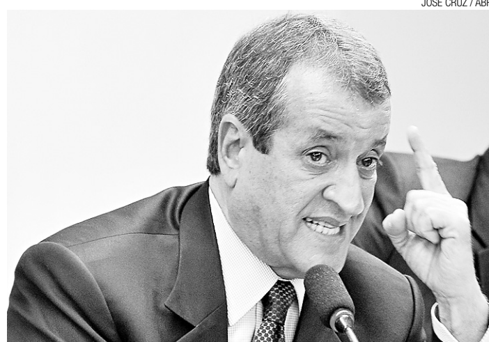
▶ Valdemar Costa Neto renuncia pela segunda vez por causa do mensalão

As duas estavam presas num Batalhão da Polícia Militar dentro do complexo penitenciário da Papuda e haviam sido levadas recentemente para o Presídio Feminino do Distrito Federal, conhecido como Colmeia. A polícia não informou quando fará a transferência.