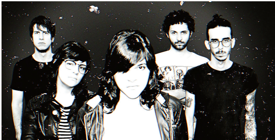
▶ A banda potiguar Far From Alaska está entre os participantes da primeira noite do evento