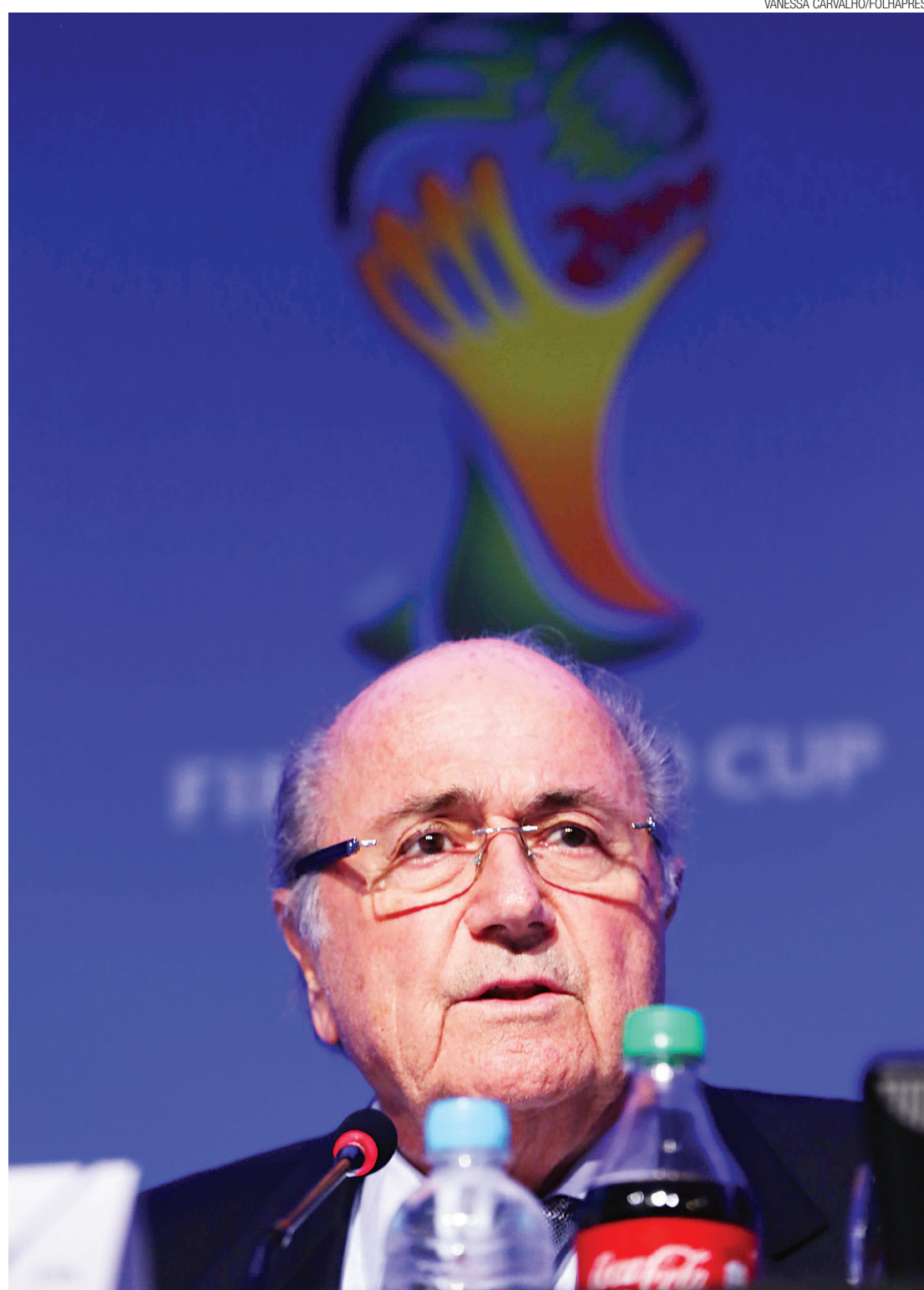
► Joseph Blatter, presidente da Fifa, comanda sorteio na Bahia