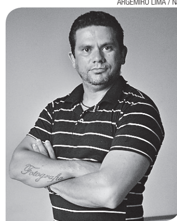
► Ney Douglas, fotógrafo do NOVO, recebendo o Prêmio FIERN de Jornalismo

Tudo pronto para a realização do Pipa Rock Festival, que acontece hoje e amanhã, e promete transformar a praia mais famosa do litoral potiguar em um espaço dos amantes do Rock. A estrutura conta com dois palcos, pavilhão de bares, lojas e camarotes. Outra novidade será o “Ecoponto” de reciclagem e a tenda com jogos interativos. O local é o estacionamento dos ônibus na entrada do centro da Pipa e os shows terão início às 19h em virtude do evento estar mais próximo de hotéis e residências.