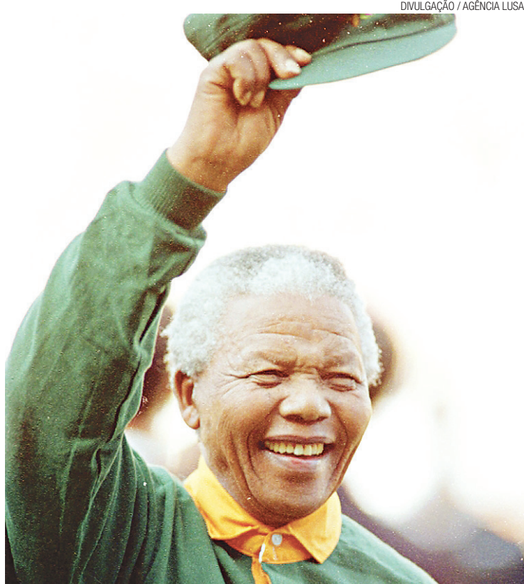
► Maior líder da África do Sul, Mandela morreu de infecção pulmonar

não foi tão brilhante como sua trajetória até ali. O apartheid foi extinto, e o país não embarcou numa guerra civil, mas a desigualdade de renda continuou alta e o governo não conseguiu conter os índices de violência nem obter grandes avanços na