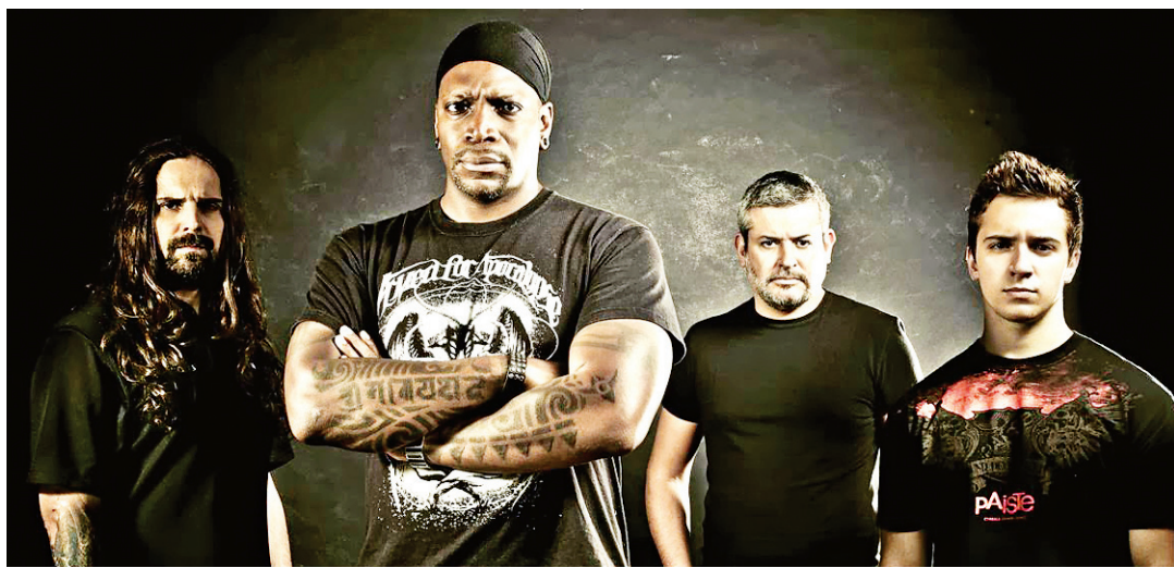
▶ Banda Sepultura apresenta o álbum mais recente "The Mediator Between Head and Hands Must Be The Heart"