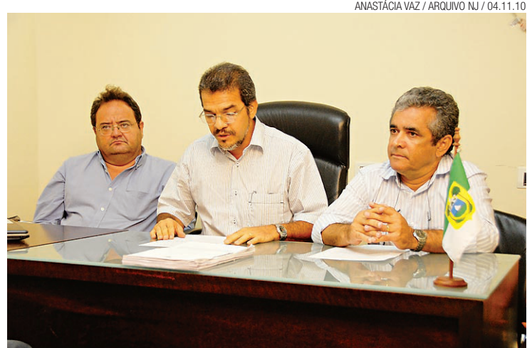
▶ O desânimo da comissão de licitação, à espera de uma proposta que não veio

além do prazo anterior da Federação Internacional de Futebol, que era o último trimestre de 2010.