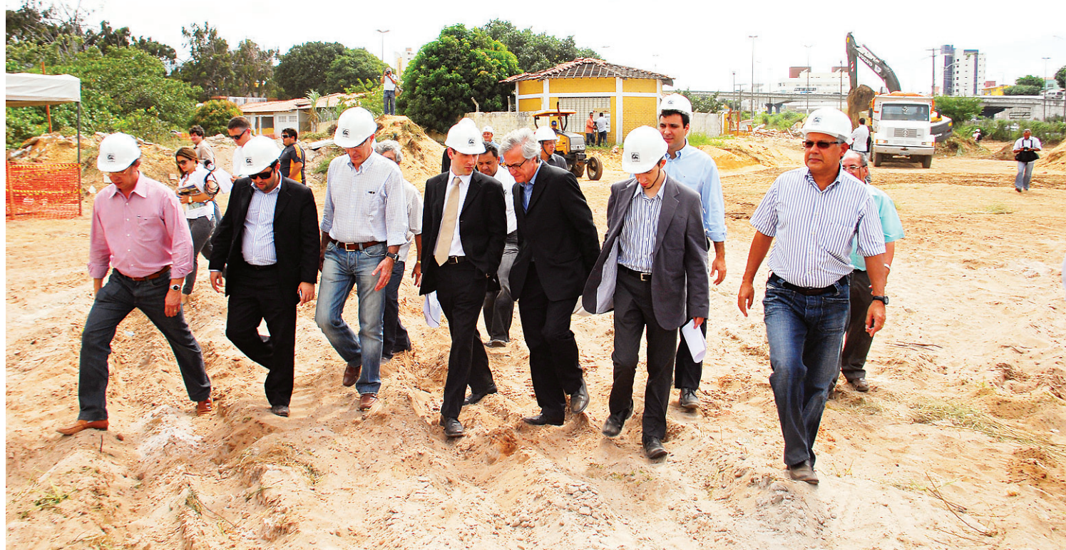
▶ Comissão do Comitê Organizador Local e da Fifa durante primeira visita a Natal: nada além de um terreno

Sem muita coisa para ver além da demolição da creche Kátia Gar-