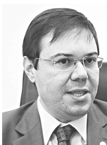
▶ Jovino Pereira, procurador-geral de Justiça em exercício: medidas para evitar que protestos desse tipo se repitam

Os artigos constam no Código Penal Brasileiro e preveem penas que vão de multa à detenção, com variações definidas entre seis meses (menor pena) a cinco anos. Também é pedido que seja observado o artigo 253 do Código Brasileiro de Trânsito, que prevê sanção contra quem bloquear via com veículo, infração gravíssima e que deve ser punida com apreensão do veículo e multa.