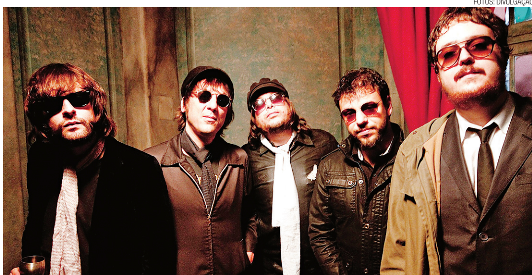
▶ A banda gaúcha Cachorro Grande é o destaque de encerramento da primeira noite do Festival de Rock de Pipa

A partir de hoje, os ingressos estão sendo vendidos exclusivamente em Pipa, na bilheteria do festival ou na Loja Ecológica. Hoje, a entrada custa R$ 30 (meia), amanhã R$ 50 (meia) e o passaporte para os dois dias sai a R$ 70.