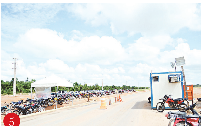
1 Placa instalada na Via Costeira mostra distância para Aeroporto Aluizio Alves 2 A iluminação na avenida próxima ao aeroporto foi instalada no fim de semana 3 No “gancho” de Igapó placa bilíngue indica novo terminal 4 Na BR-406, viaduto em construção no caminho que leva ao novo aeroporto 5 Portão de segurança fica a 2 Km do novo aeroporto