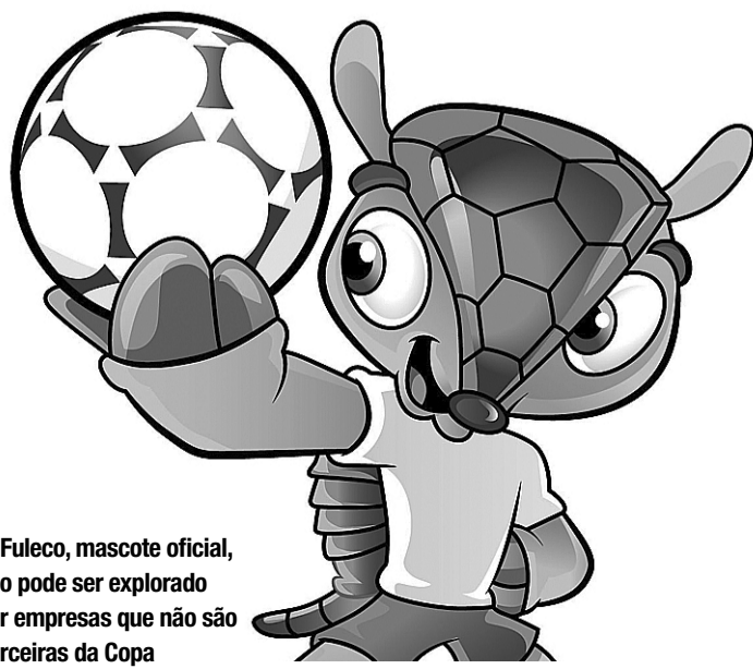
► Fuleco, mascote oficial, não pode ser explorado por empresas que não são parceiras da Copa