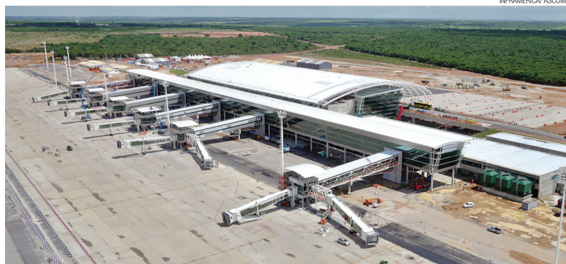
▶ Caminho para chegar ao novo aeroporto, em São Gonçalo, ainda está longe de ter “o padrão FIFA”

O Departamento de Estradas e Rodagens (DER) definiu a entrega dos 11 quilômetros do acesso norte para o dia 22 de maio. Já o viaduto, com 24 vigas e três pilares centrais, só ficará pronto em julho. Por conta disso, um desvio será construído de forma paliativa. Com relação ao acesso sul, com 17 quilômetros, que liga a cidade de Macaíba ao novo aeroporto; a via ainda não come-