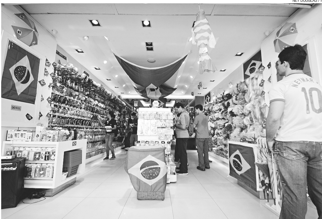
Lojas irão funcionar normalmente nos dias de jogos do Mundial da Fifa disputados na capital potiguar

A Prefeitura de Natal já tem seu calendário definido desde o fim do ano passado. Em todos os jogos da seleção e na arena o pon-