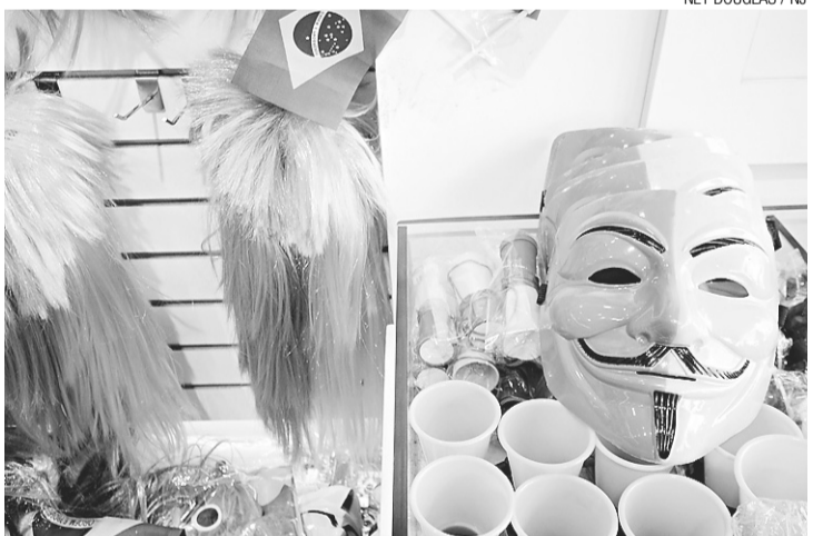
Projeção é baseada em dados de anos anteriores

“Projetando esta mesma perda e considerando que, entre junho e julho, em um ano normal, o setor de comércio varejista potiguar fatura cerca de R$ 6 bilhões, podemos dizer que deixaremos de vender algo em torno de R$ 42 milhões, nos meses de junho e julho, em virtude deste funciona-