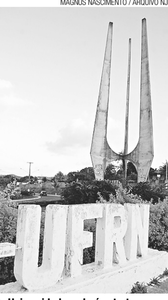
Universidade cederá estrutura para treinamentos e estacionamento

As escolas particulares deverão suspender as aulas no dia 12 de junho.