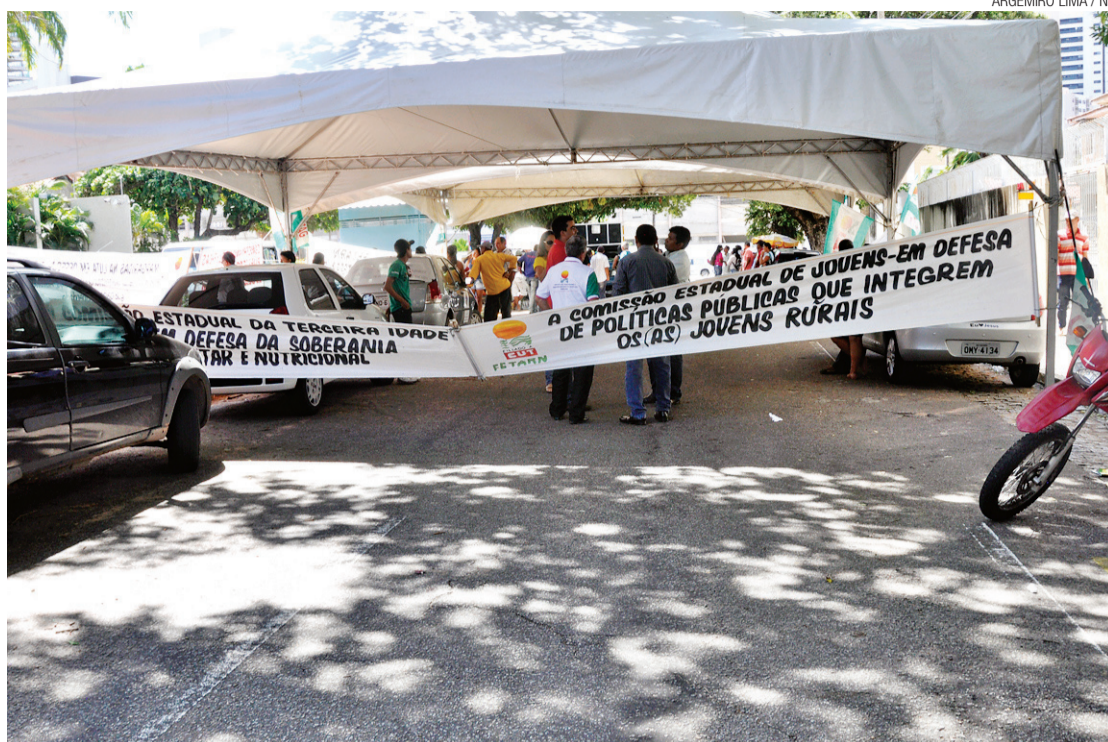
► Acampamento de trabalhadores rurais em frente à sede do Incra tem pouca representatividade

Os integrantes estão alojados em barracas e dispõem de três ba-