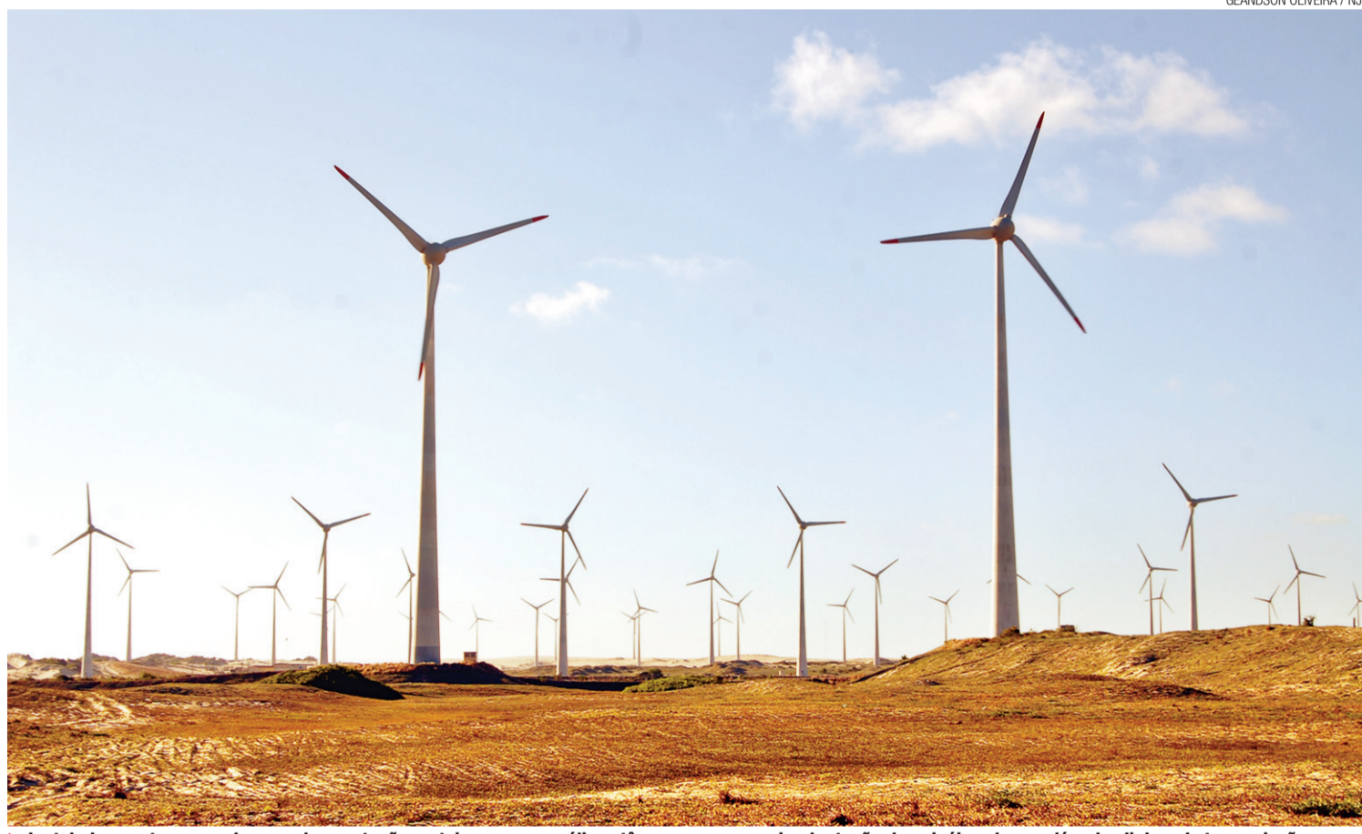
► Instalados em terrenos planos e de vegetação rasteira, parques eólicos têm espaço para a implantação de painéis solares, além das linhas de transmissão

Sem detalhar o que exatamente está sendo negociado, o diretor