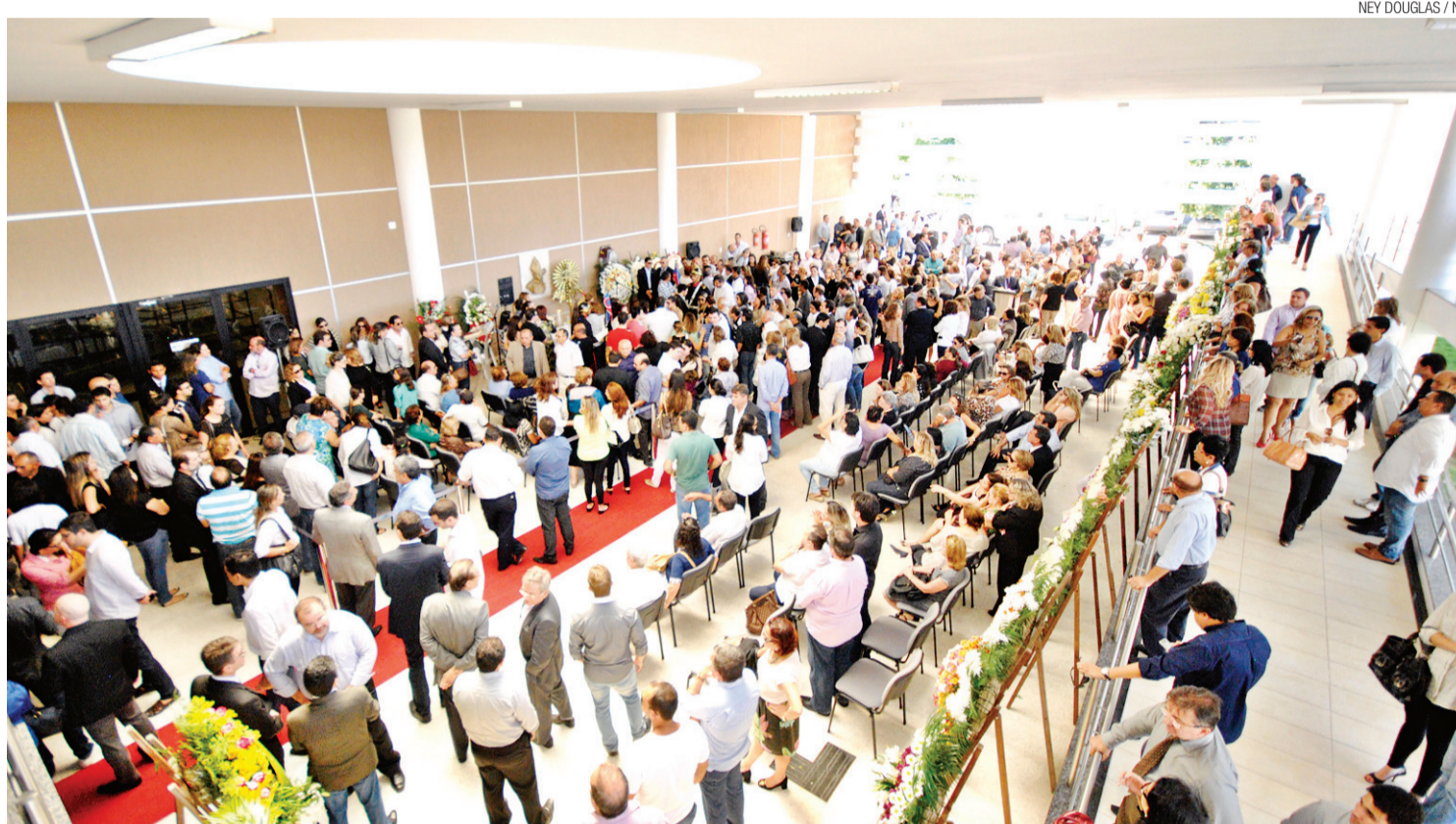
► Centenas de pessoas lotaram a Escola de Governo para, no velório, dar um último adeus ao advogado, vítima de acidente doméstico