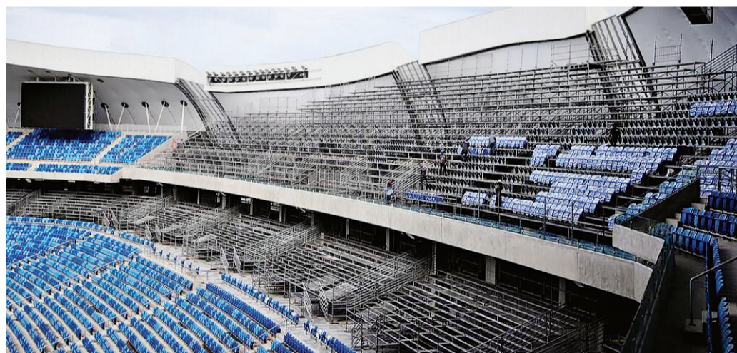
► Fotografia postada no Twitter pelo secretário da Fifa mostra setor de cadeiras incompleto