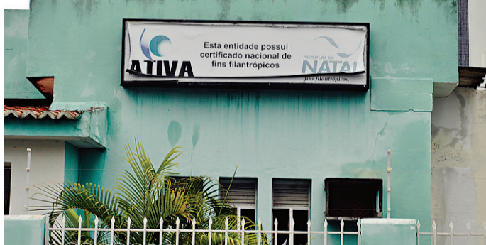
► Associação deixa, no mínimo, R$ 42 milhões em dívidas