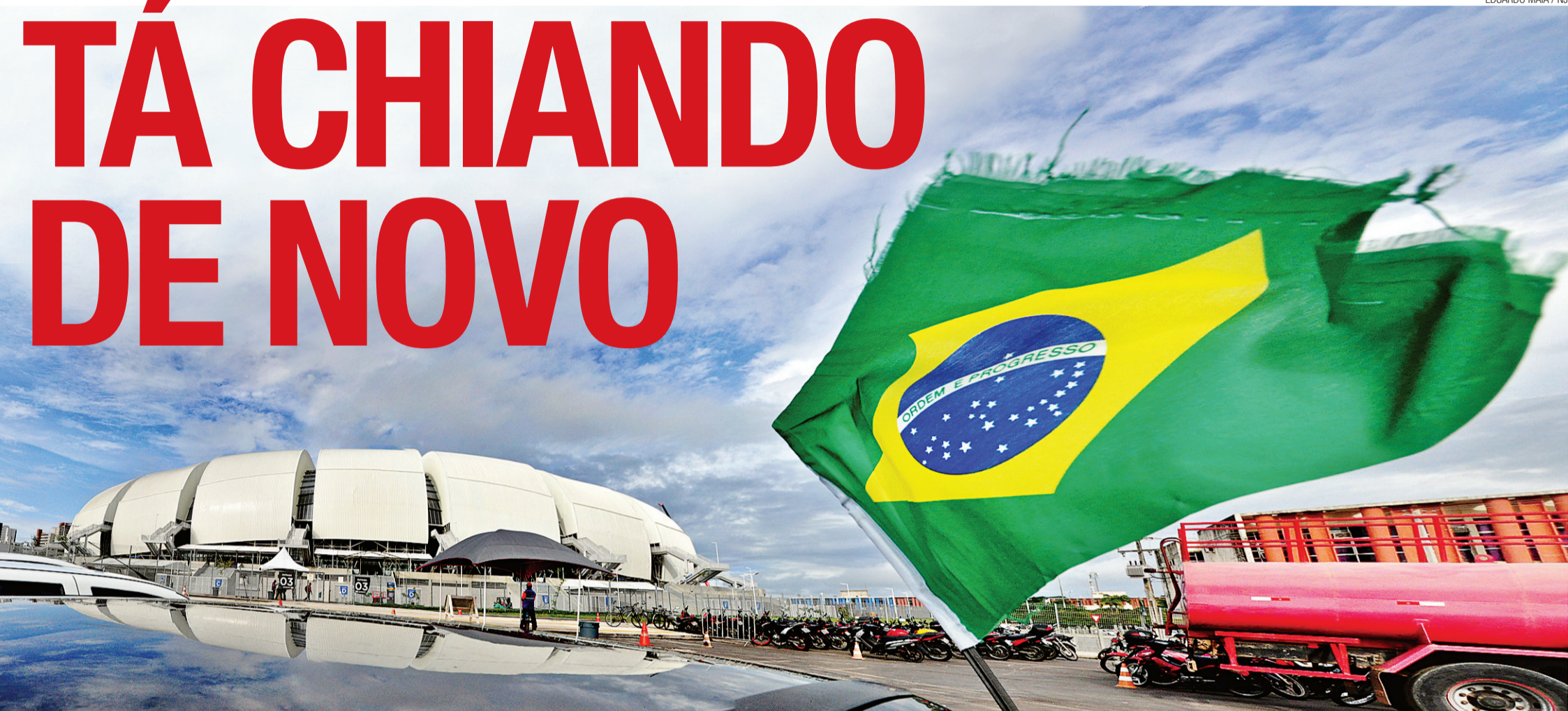
► Acesso ao interior da Arena das Dunas, sob poder da Fifa, está fechado, mas em fiscalização surpresa feita ontem, equipe da entidade constatou que ainda há etapas a serem cumpridas para a conclusão