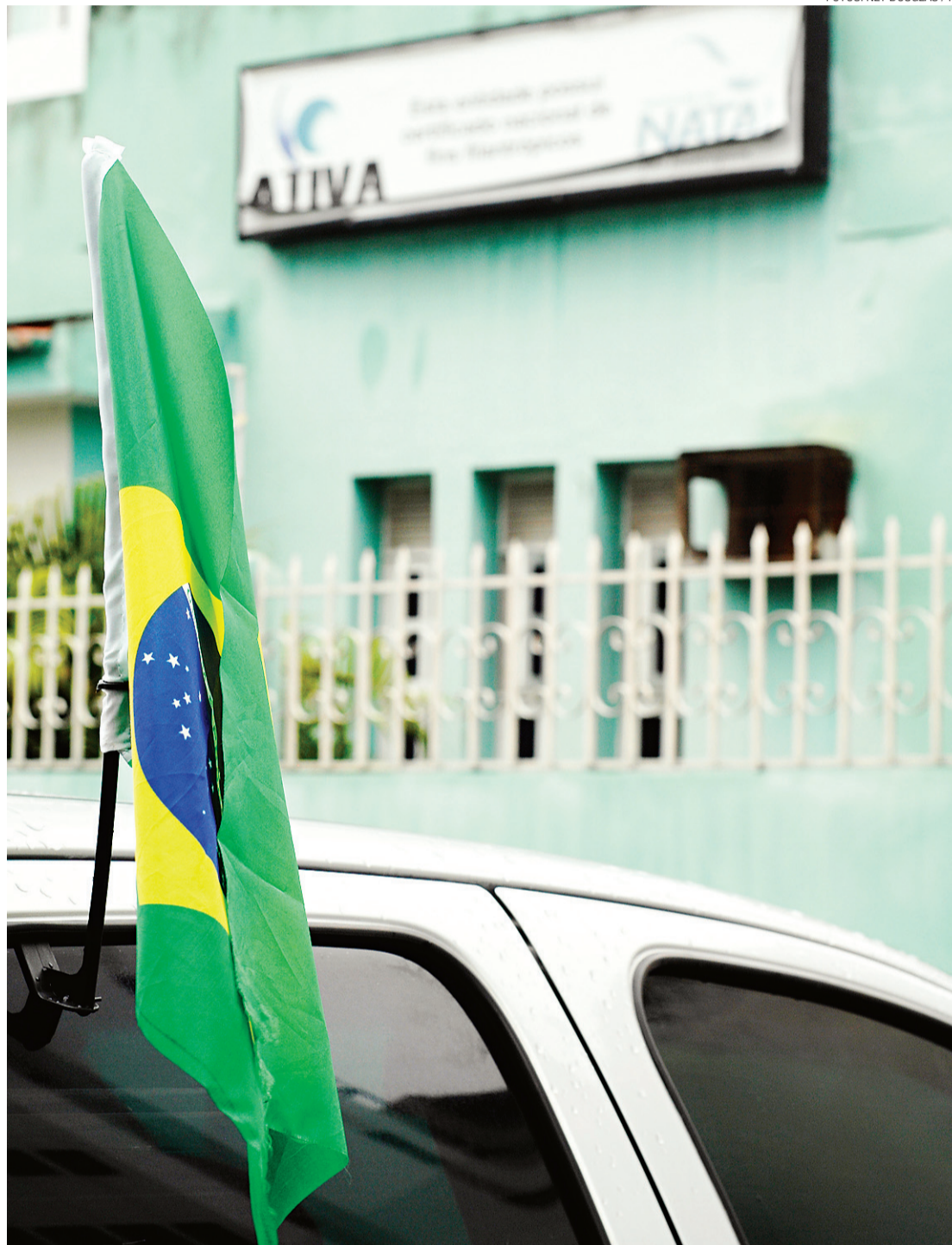
► Sede da Ativa, no bairro do Tirol: extinção definitiva no dia 19 de dezembro

“O setor (de Serviço Social) certamente será impactado, mas a Prefeitura já sinalizou para a abertura de um processo seletivo simplificado objetivando preencher as vagas remanescentes com o encerramento das atividades na Ativa”, declarou.