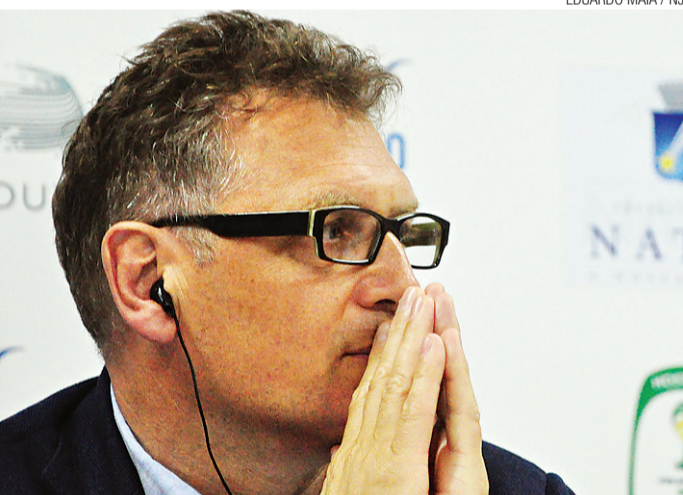
► Jérôme Valcke esteve por quatro horas em Natal em “visita surpresa”