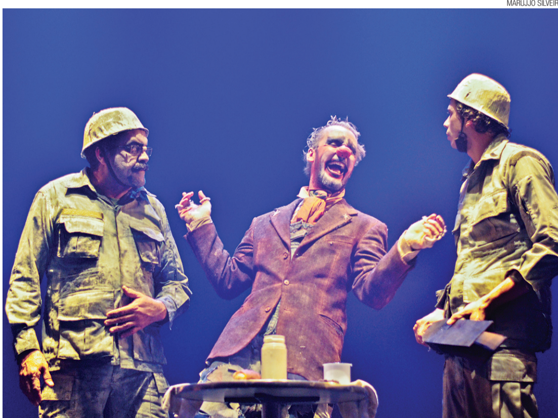
▶ Guerras, Formigas e Palhaços, peça criada a partir de texto do ator Cesar Ferrário