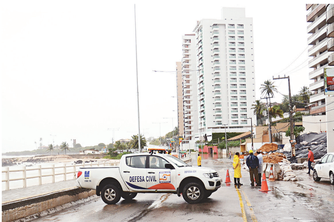
▶ Defesa Civil interditou avenida preventivamente e mantém monitoramento no local

O primeiro deslizamento em Mãe Luíza aconteceu no dia 13 de junho, soterrando cinco carros e interrompendo o tráfego na avenida Sílvia Pedrosa. A terra cedeu novamente nos dias seguintes o estado de calamidade pública foi decretado pela Prefeitura no dia 16 de junho.