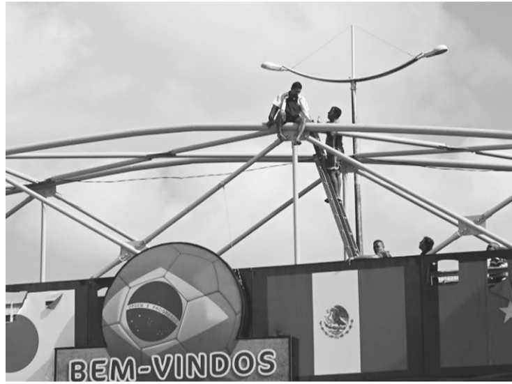
► Caso aconteceu no domingo e terminou após ação de policiais e bombeiros