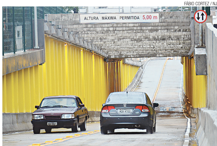
▶ Túnel da Avenida Raimundo Chaves: via dupla

Embora esse tenha sido o último túnel liberado, dos seis que compõem o complexo viário, resta ainda para a Prefeitura concluir o viaduto da marginal da BR 101. As passarelas da avenida Prudente de Moraes e Rua Moraes Navarro foram liberadas para os pedes-