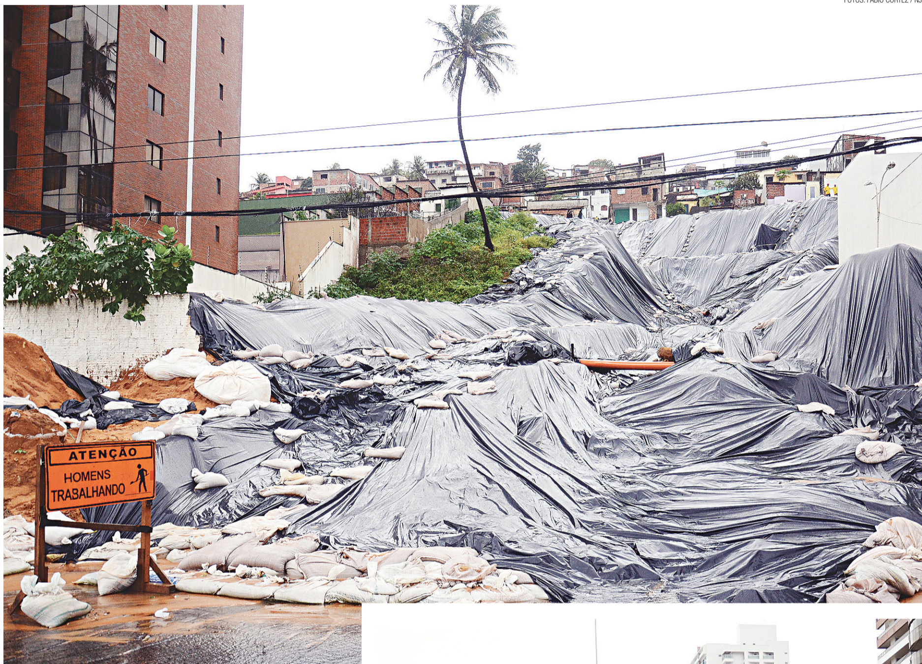
▶ Área de deslizamento em Areia Preta ainda é muito instável