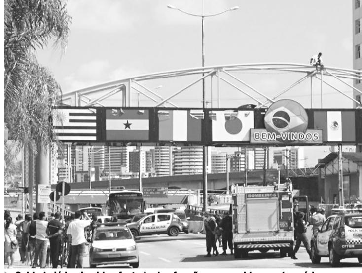
► Soldado já havia sido afastado das funções por problemas de saúde

A moto de 650 cilindradas é o modelo mais simples produzida pela fábrica alemã, famosa por seus veículos de luxo. A diferença no preço, de acordo com o Coronel Araújo, deve-se à instalação de equipamentos adicionais, como rádio de comunicação, sirene e luminoso, além da pintura e adesivagem com as cores da Polícia Militar. "É uma moto BMW transformada. Quando você soma tudo isso, aumenta o valor", assinalou Araújo.