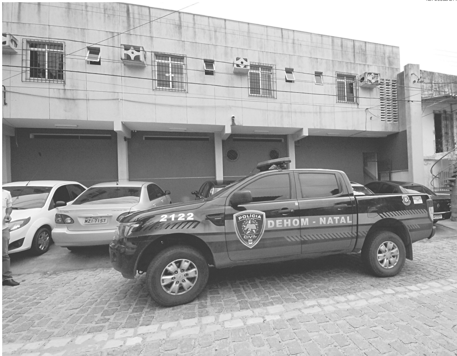
► Delegacia terá recursos humanos ampliados, mas local de funcionamento ainda não foi revelado