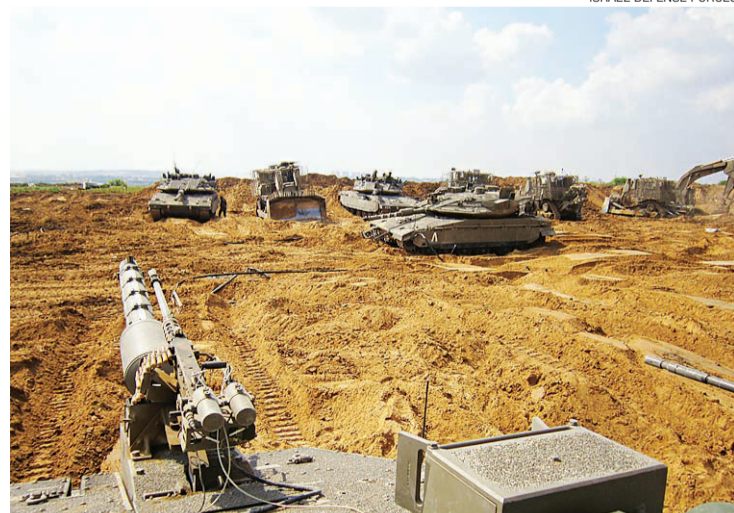
► Nove soldados israelenses morreram ontem nos confrontos

“Nós precisamos estar preparados para uma campanha prolongada. Nós continuaremos a