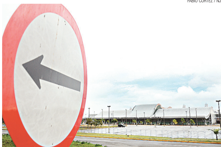
▶ Aeroporto Internacional Augusto Severo: espaço para uso militar

Neste local, o aluno recebe as primeiras experiências na aviação. O aprendizado é encerrado quando o oficial atinge 125 horas de voo de instrução. Por fim, o militar é enviado à Base Aérea de