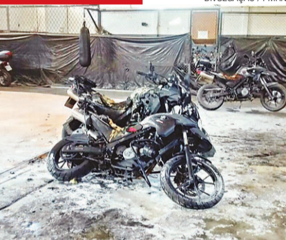
► Motos BMW sofreram perda total

APÓS SURTO, SOLDADO TOCA FOGO EM TRÊS MOTOS BMW