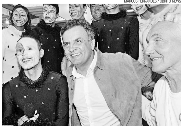
► Empiricus nega qualquer ligação com Aécio Neves (PSDB)

A coligação de Dilma entrou na sexta-feira como uma representação junto ao TSE acusando a Empiricus, o Google e a coligação de Aécio Neves de fazer pro-