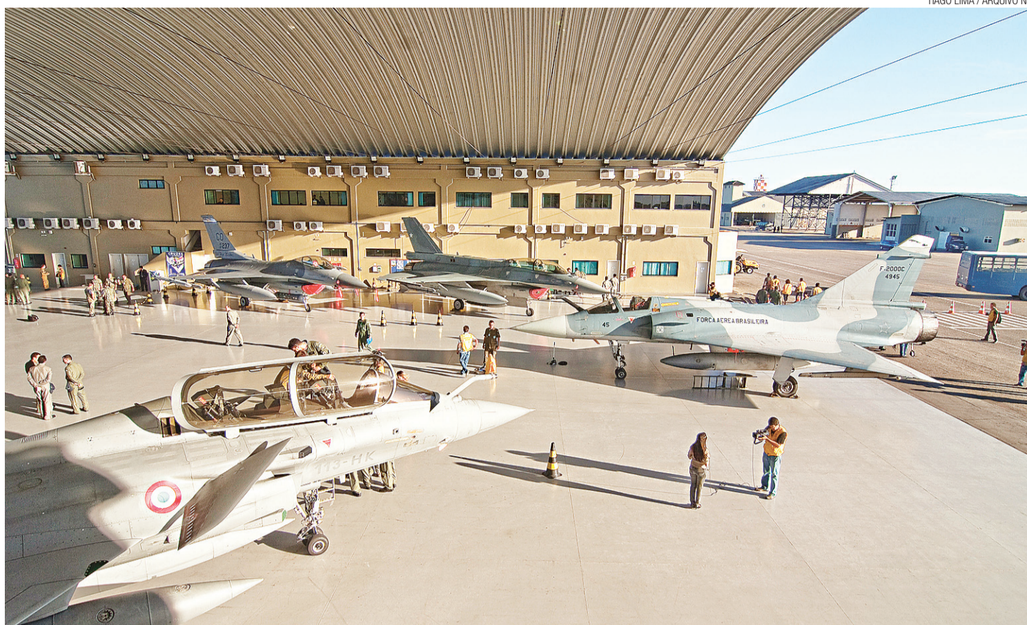
▶ Base Aérea de Natal: estrutura pode ganhar mais status com a instalação do Centro de Treinamento Operacional da FAB no antigo aeroporto de Parnamirim

As informações sobre a nova estrutura ainda são mantidas em sigilo pelo alto comando da Aeronáutica. Segundo a assessoria de imprensa da FAB, o centro vai ser ajustado à estrutura da Base Aérea de Natal (BANT), que opera na vizinhança do antigo Augusto Severo, fechado para a aviação comercial no último dia 31 de maio. A base potiguar é usada hoje para finalizar a formação do piloto aéreo militar brasileiro, sendo responsável