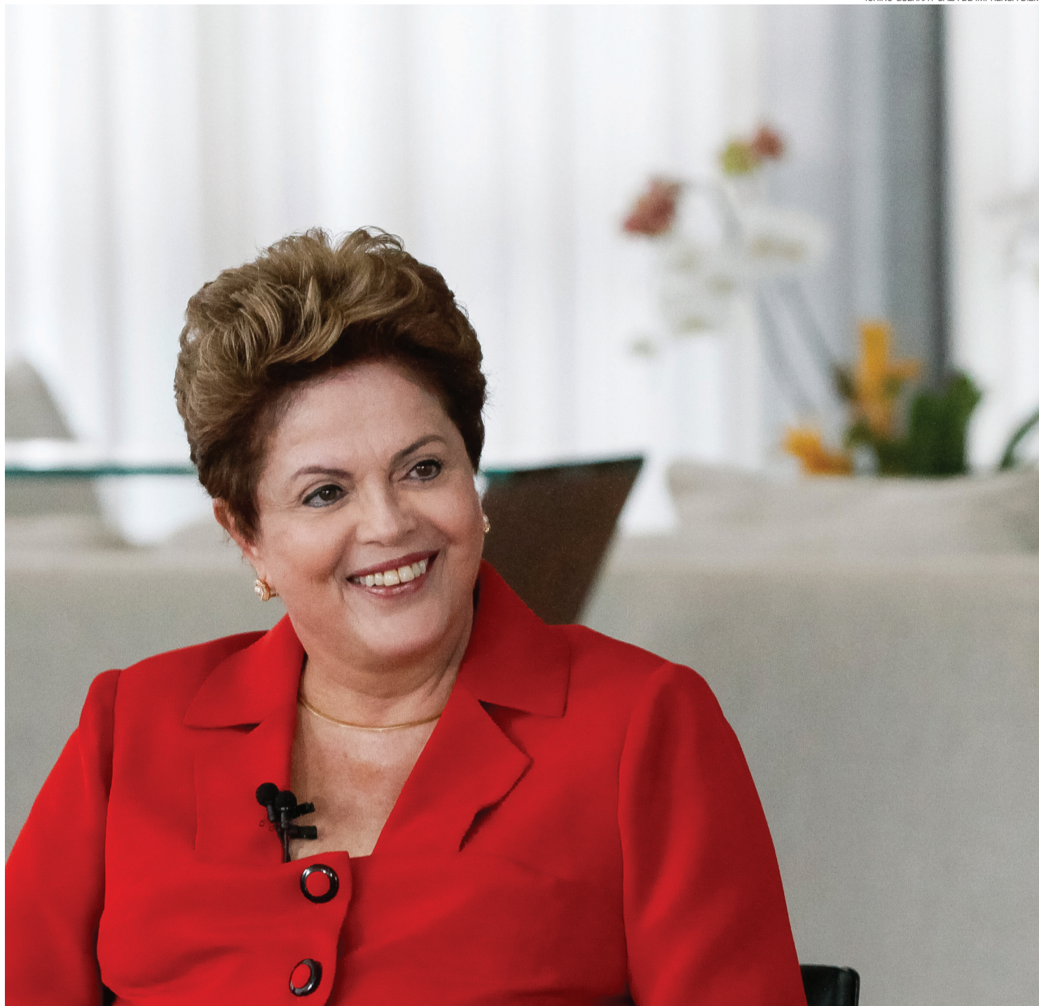
► Dilma Rousseff foi sabatinada por jornalistas da Folha de S.Paulo, portal UOL, SBT e rádio Jovem Pan

Dilma, nesta segunda, reconheceu que era uma avaliação equivocada. “Está havendo o mesmo pessimismo que aconteceu com a Copa com a economia brasileira. E com a economia é mais grave, porque economia é feita com expectativa”, argumentou.