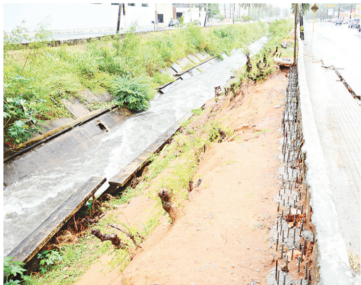
▶ Canal do Baldo está danificado, mas tem obra em andamento

Vários pontos da cidade foram afetados pela chuva gerando engarrafamento e lentidão no trânsito. Um alagamento próximo ao supermercado Nordeste da Zona Norte deixou a avenida João Medeiros Filho com apenas uma faixa de trânsito. O excesso