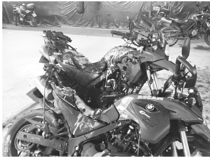
► Veículos incendiados custaram, cada, R$ 38,5 mil ao Estado