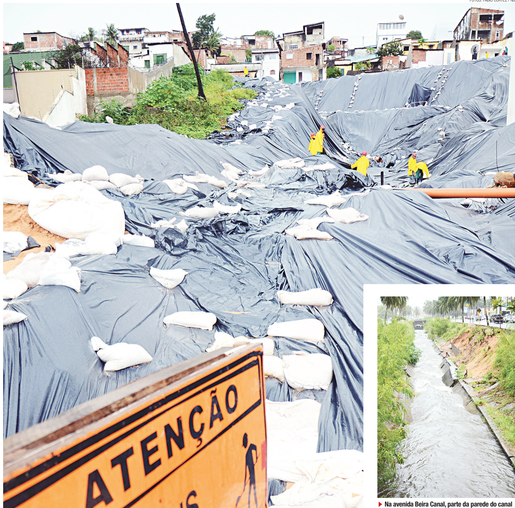
► Em Areia Preta, avenida só será liberada se o tempo melhorar, o que não deve ocorrer hoje, segundo as previsões de especialistas