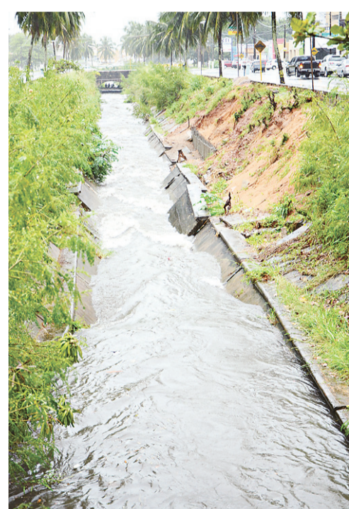
► Na avenida Beira Canal, parte da parede do canal do Baldo está danificada