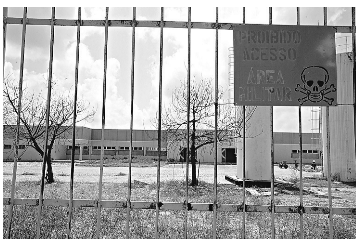
► Estrutura deveria ser entregue há, no mínimo, cinco anos

O extrato do contrato foi publicado no DOU de 1º de agosto de 2006 e a ordem de serviço, emitida em 25 de julho de 2006.