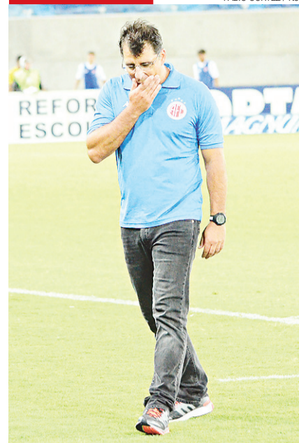
► Martelotte: cinco jogos, nenhuma vitória

/ SAÚDE? / BASE AÉREA DE NATAL POSSUI OBRA DE HOSPITAL QUE SE ARRASTA HÁ OITO ANOS; É INVESTIGADA PELO TRIBUNAL DE CONTAS DA UNIÃO E AINDA TEM 15% PARA SER CONCLUÍDA