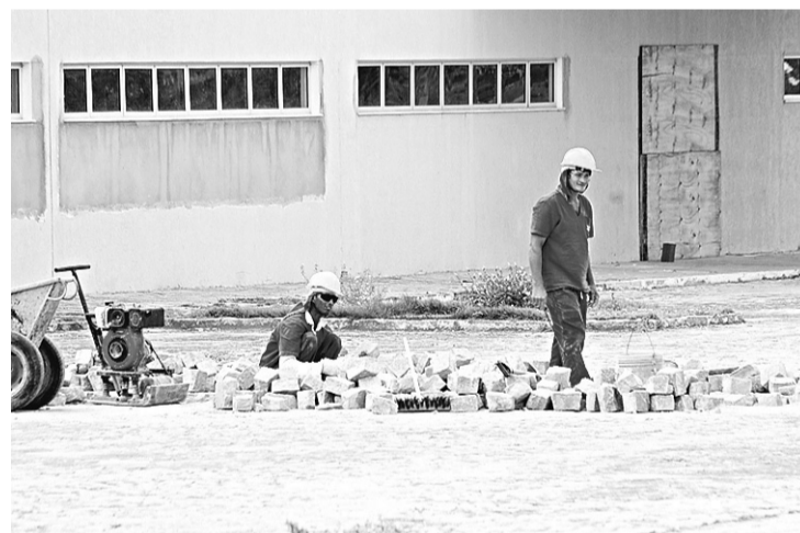
► Atualmente, alguns funcionários trabalham na área externa

No relatório da representação do TCU contra a Aeronáutica e a Prescon consta qualidade deficiente das obras e inexistência ou inadequação de estudo preliminar comprovando a viabilidade técnica, econômica e ambiental