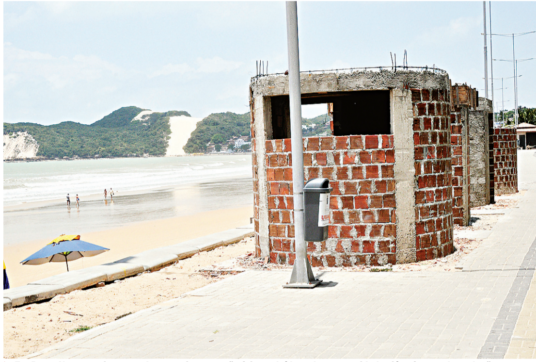
Em Ponte Negra, maior parte dos 29 quiosques não foi concluída e algumas unidades já sofreram depredação

Mas, dos itens anunciados pelo prefeito até agora, somente a iluminação pública em Ponta Negra e na orla da Praia dos Artistas ao Forte (que não faz