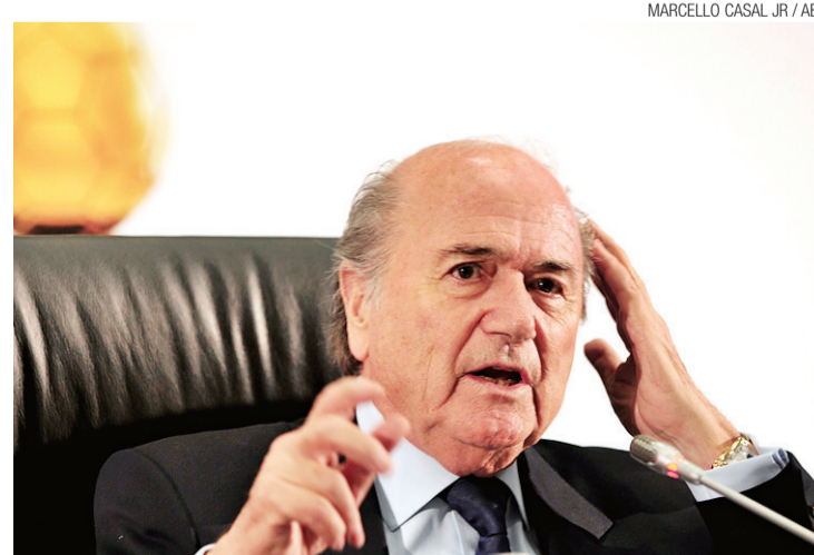
► "As terceiras partes devem ser banidas", disse Joseph Blatter

A mudança não é imediata. Segundo a Fifa, a alteração será implementada em até quatro anos para que os mercados do futebol se adaptem. Esse prazo deve ser definido entre dezembro de 2014 e março de 2015 por uma comissão de trabalho.