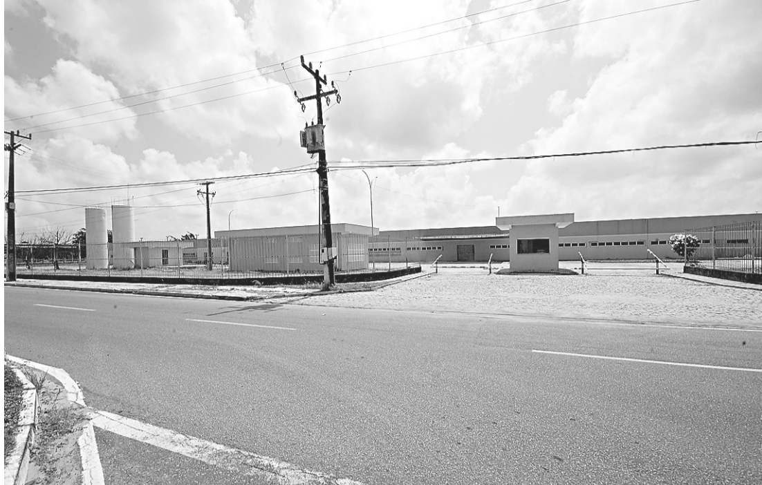
Segundo e-mail da assessoria da Aeronáutica ainda resta 15% da obra para ser concluída

O Comando da Aeronáutica não quis comentar sobre as denúncias de superfaturamento e outras irregularidades na obra, inclusive, com participação de militares de alta patente da Força citados em relatório do Tribunal de Contas da União. “Quanto aos demais questionamentos, sugerimos que sejam encaminhados ao Tribunal de Contas da União, órgão responsável pela fiscalização quanto ao cumprimento dos termos contratuais”, respondeu por e-mail, o Centro de Comunicação Social.