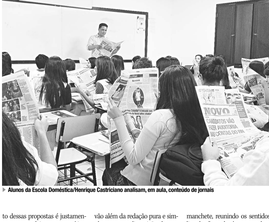
▶ Alunos da Escola Doméstica/Henrique Castriciano analisam, em aula, conteúdo de jornais

“Essa geração quer tudo pronto, rápido, simples. O intuitivo