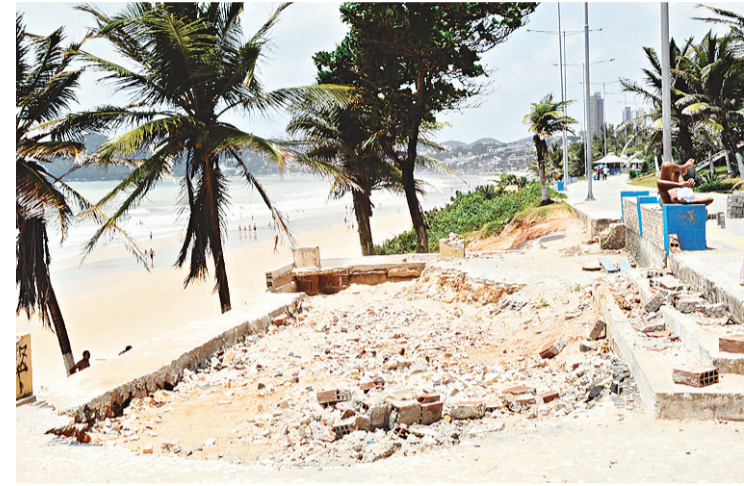
Acesso à praia está sendo feito de forma improvisada

Do Forte à Praia dos Artistas, a mureta (guarda corpo) de pro-