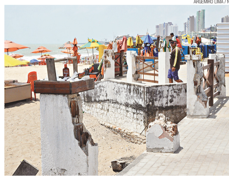
Na Praia do Meio o atraso é maior, com vários equipamentos deteriorados