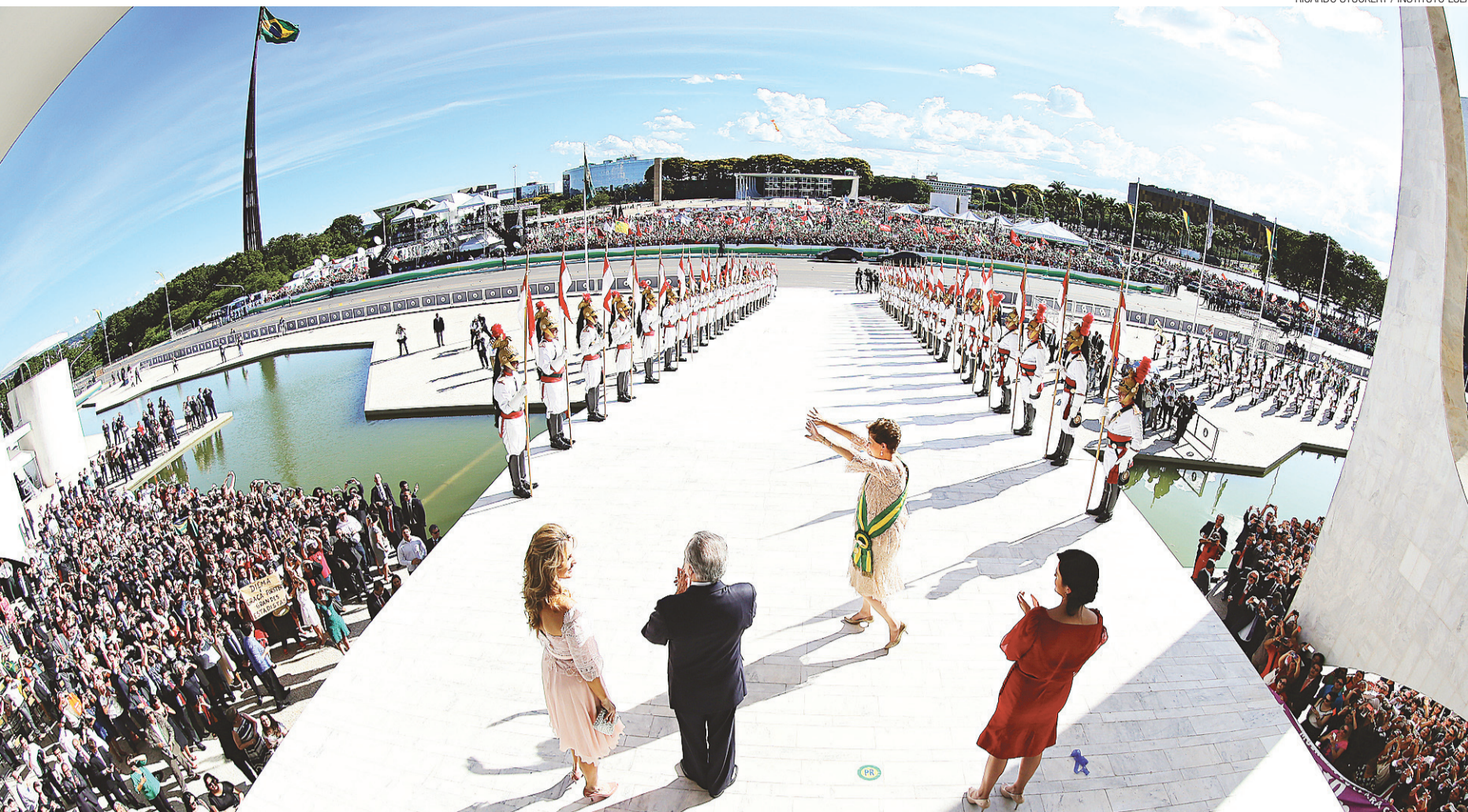
► Presidente iniciou discurso de posse no Congresso Nacional destacando o que considerou um feito histórico: a superação da extrema pobreza durante seu primeiro mandato