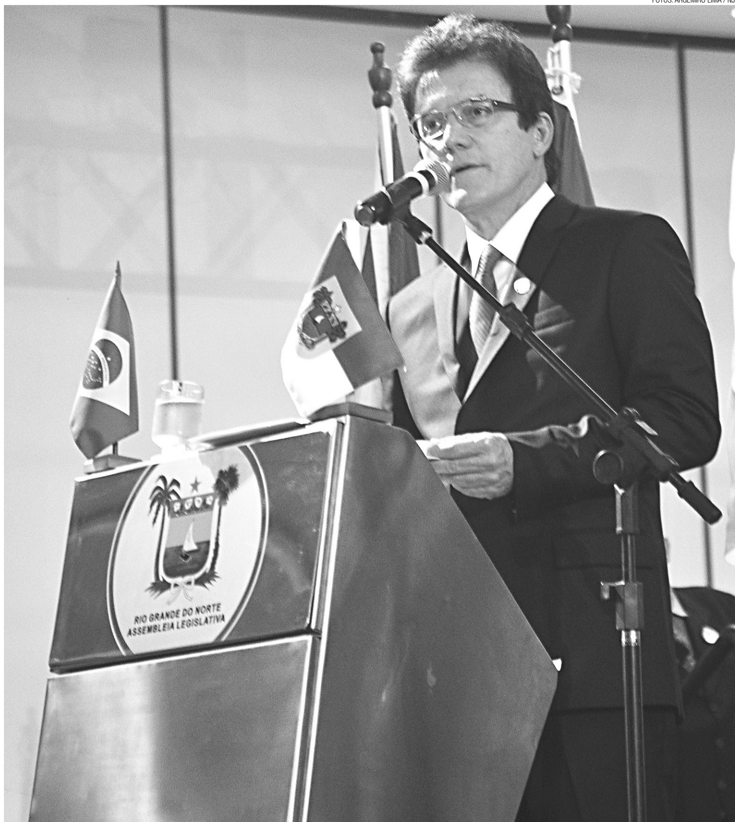
► Discurso do governador Robinson Faria durou quase uma hora em sessão solene da Assembleia Legislativa, no Centro de Convenções da Via Costeira

O governo também não vai descuidar do avanço do crack nas cidades e no campo. Para isso, buscará parcerias com empresas para reinserção social de viciados em drogas. Logo depois, citou Santo Agostinho: "Mesmo que já tenha feito uma longa caminhada, sempre haverá mais um caminho a percorrer". Encerrou seu discurso dizendo se inspirar em São Francisco de Assis, que disse: "Devemos aceitar com serenidade as coisas que não podemos modificar, ter coragem para modificar a que podemos e sabedoria para perceber a diferença".