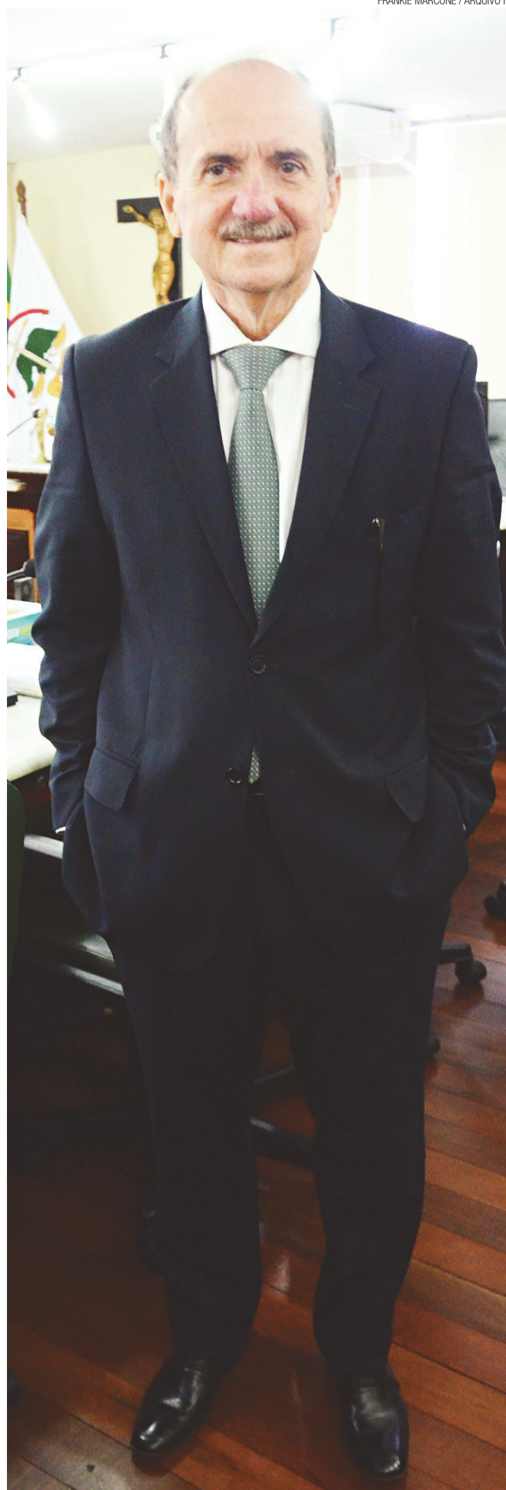
▶ Cláudio Santos, desembargador: gestão para o biênio 2015 e 2016