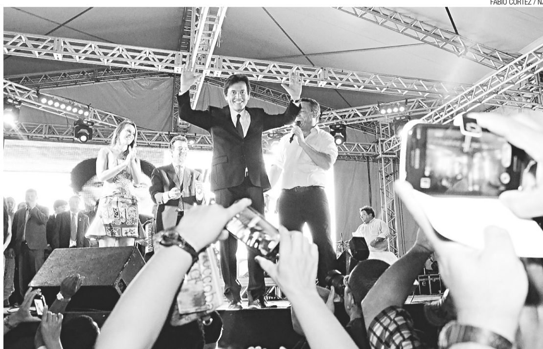
FÁBIO CORTEZ / NJ