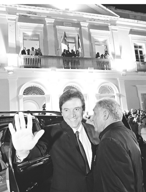
FÁBIO CORTEZ / NJ