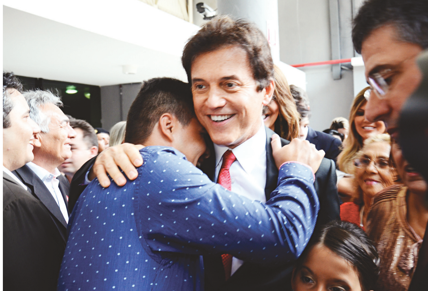
► Governador Robinson Faria na solenidade de posse realizada no Centro de Convenções: alegria e emoção divididas com amigos e correligionários

"Sinto que esse governo será de grande avanço e quebra de tabus na cultura do estado, de preconceitos e apadrinhamentos, dando mais oportunidades a todos. A escolha do secretário de Cultura foi feliz para nossa área e deve proporci-