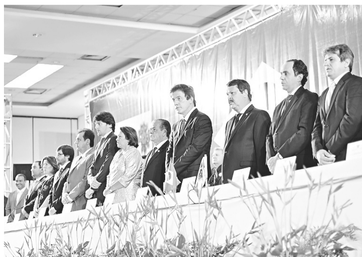
► Cerimônia no Centro de Convenções estava marcada para as 16h, mas começou com uma hora e meia de atraso; somente às 17h30, o governador iniciou seu discurso