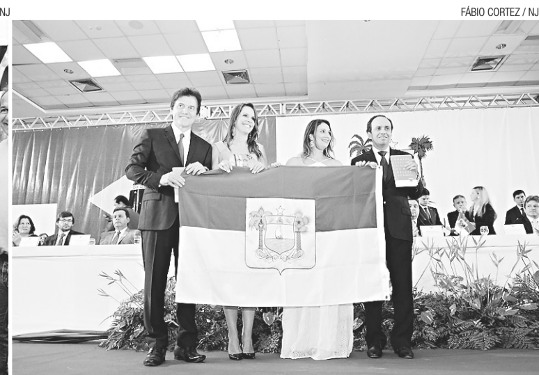
FÁBIO CORTEZ / NJ