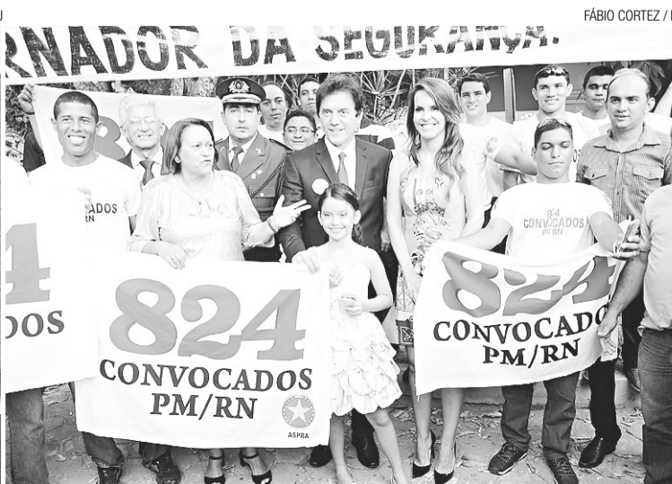
FÁBIO CORTEZ / NJ