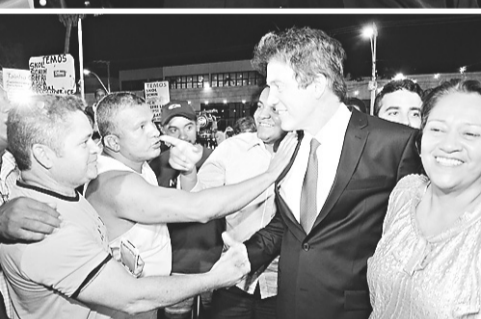
FÁBIO CORTEZ / NJ