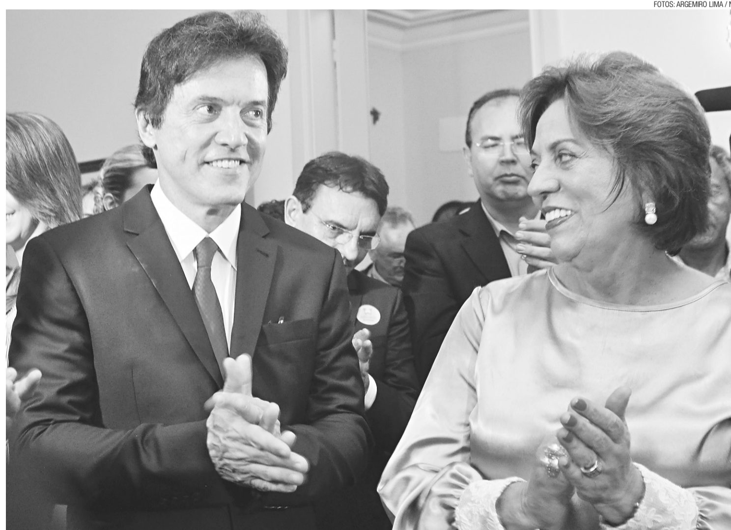
▶ Ex-governadora disse que voltará a ficar à disposição da Secretaria de Estado da Saúde Pública (Sesap), de onde é servidora concursada