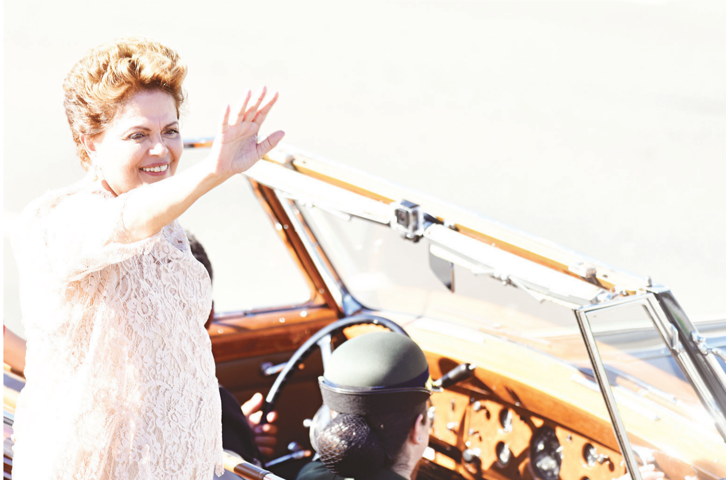
► Petista afirmou ser necessário um ajuste nas contas públicas para que o país volte a crescer

“Os primeiros passos dessa caminhada [para voltar a crescer] passam por ajuste nas contas públicas e aumento da poupança interna. Ela aumentará com o sacrifício possível para a população. Vamos, mais uma vez, derro-