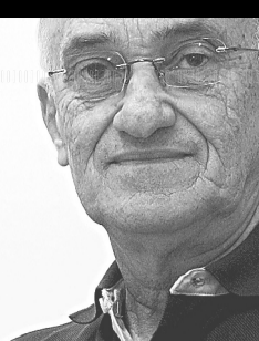
Albimar Furtado escreve nesta coluna às sextas-feiras