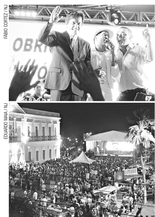
FÁBIO CORTEZ / NJ