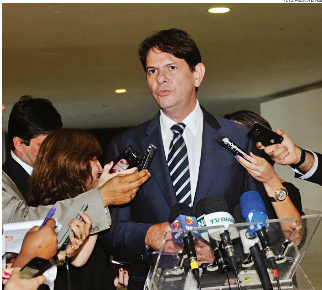
► Cid Gomes, ministro da Educação: não há um prazo para colocar em prática o novo modelo

tificar o ensino médio. Em 2014, mais de 6,2 milhões de candidatos fizeram o Enem em mais de 1,7 mil cidades.