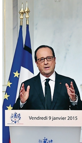
► François Hollande reconheceu ontem que seu país ainda vive sob ameaça terrorista, que não foi sanada com a morte dos irmãos suspeitos do atentado de quarta-feira à sede do 'Charlie'