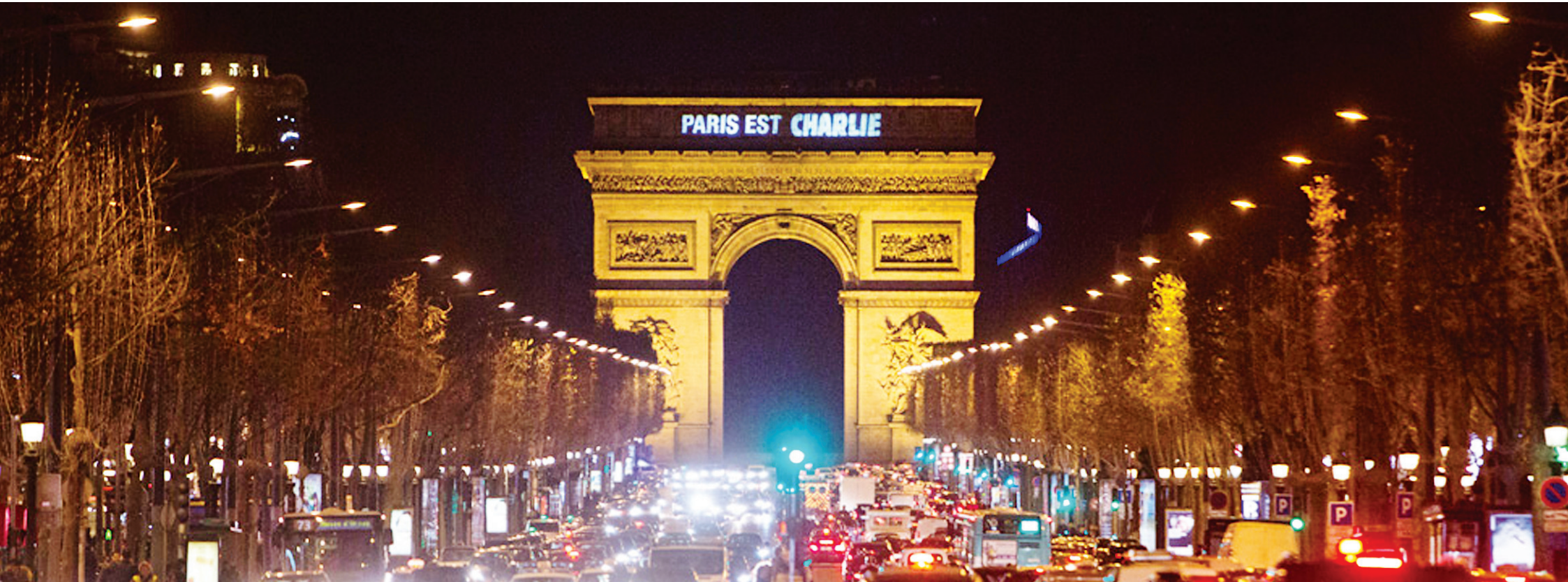
► Frase "Paris é Charlie" ficou projetada sobre o Arco do Triunfo durante a noite de ontem, em homenagem às vítimas do ataque ao jornal