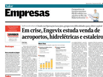
► Matéria do Valor Econômico que gerou os rumores da venda

quota do imposto chega em um momento delicado para o consórcio Inframérica, quando o aeroporto foi definido como "pouco atrativo para o mercado" na imprensa nacional. Em matéria recente do jornal Valor Econômico,