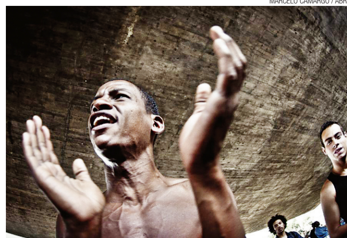
► Estudo de vulnerabilidade juvenil à violência e desigualdade

Após a decisão de Lewandowski, a ANJ divulgou nota dizendo que um princípio constitucional foi preservado e que Lewandowski agiu no sentido de proteger «um dos pilares da liberdade de imprensa».