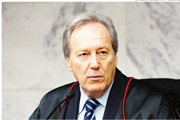
► Ricardo Lewandowski, presidente do Supremo Tribunal Federal

Segundo Cid Gomes, o objetivo é expandir experiências bem-sucedidas para todo o Brasil e buscar a melhoria da qualidade da educação básica. Entre 2011 e 2013, o estado subiu 17 posições no ranking desta etapa do ensino.