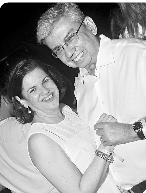
► Denise e o ministro pé-de-valsa Garibaldi Alves

A construtora Capuche celebrou a entrega de 644 apartamentos em 2014, o que corresponde à quase o triplo do volume de entregas do ano anterior, que foi de 213 imóveis. Dentre as metas realizadas, está a conclusão de mais uma importante obra, o Viver Bem, primeiro empreendimento comercializado dentro do programa do Governo Federal, Minha Casa Minha Vida.