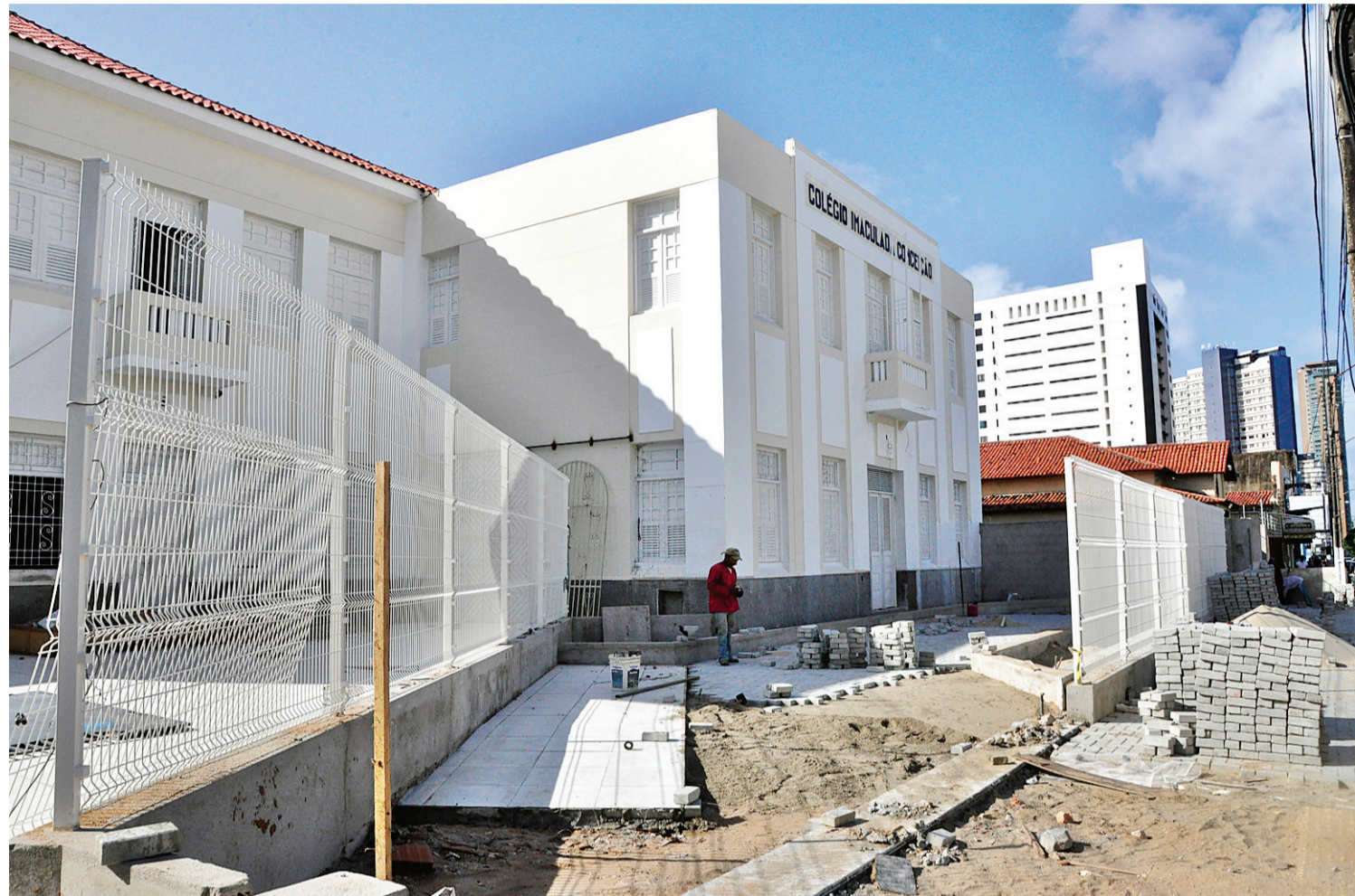
▶ Reformas mantiveram arquitetura original no prédio do antigo Colégio Imaculada Conceição, mas no interior conceito é moderno, segundo direção da Unifacex

Devido à drástica redução no número de alunos nos últimos anos – o CIC chegou a contar com mais de 3 mil alunos nos tempos áureos, mas restaram apenas 280 em 2012, último ano de atividades – algumas salas receberam divisórias, para acomodar melhor o número reduzido de estudantes. O projeto original foi retomado pela reitoria da Unifacex, resultando