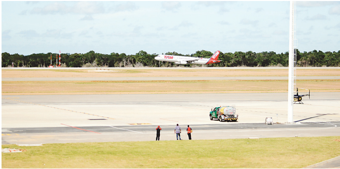
▶ Quantidade de voos pode aumentar ainda mais se Estado der incentivo tributário para o combustível de aviação

A Inframérica iniciou a operação do novo aeroporto no dia 31 de maio de 2014. Nestes 7 meses de operação, o aeroporto