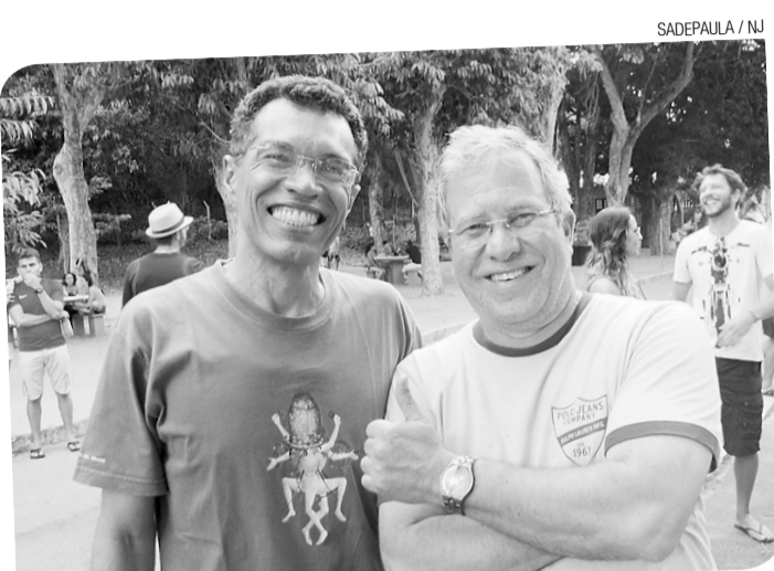
SADEAPULA / NU