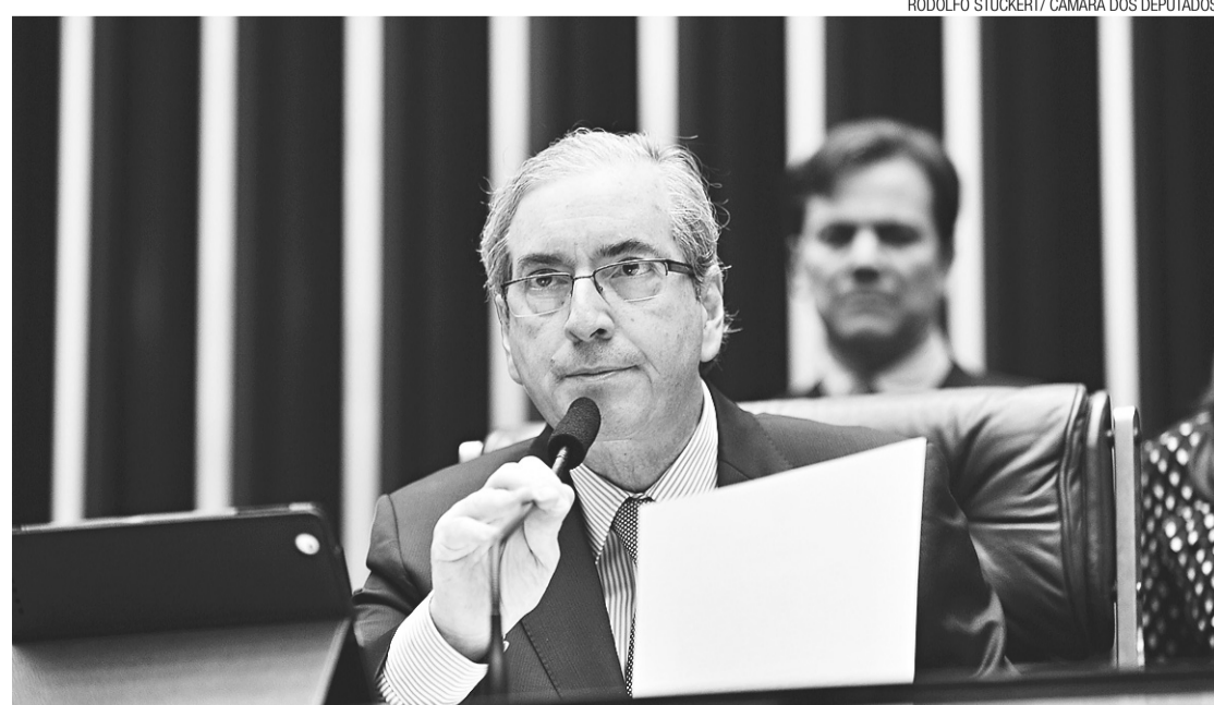
► Eduardo Cunha, presidente da Casa, prometeu a aprovação da proposta no primeiro mês desta legislatura