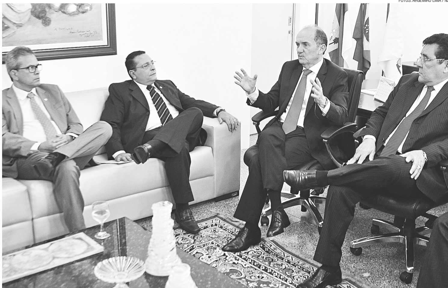
► Comissão de sete parlamentares teve encontro na manhã de ontem com o presidente do Tribunal de Justiça do RN, desembargador Cláudio Santos

Outra atividade que deverá ser discutida ainda essa semana na Assembleia Legislativa é a formação das comissões e dos blocos parlamentares, quando serão