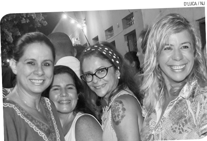
D'LUCA / NU