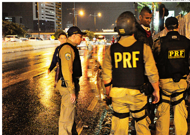
▶ No Brasil, acidentes diminuíram de 186.698, em 2013, para 168.593, em 2014

(motocicletas e automóveis) representam 57% dos casos de óbitos. O maior número de óbitos ocorre na faixa de condutores entre 25 e 38 anos. Passageiros e pedestres, juntos, somam 43% das mortes.