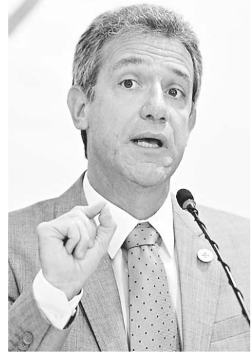
► Arthur Chioro, ministro da Saúde

O edital será aberto amanhã (10), no site do ministério, e ficará aberto durante o mês de fevereiro. Segundo Chioro, amanhã também será anunciado no site o resultado do edital do Programa Nacional de Bolsas para Residência em Área Profissional da Saúde (Pró-Residência em Saúde-2015) que ofereceu 1.048 bolsas para candidatos ao primeiro ano, sendo 25% delas para a área de família e comunidade. Até o momento foram disponibiliza-