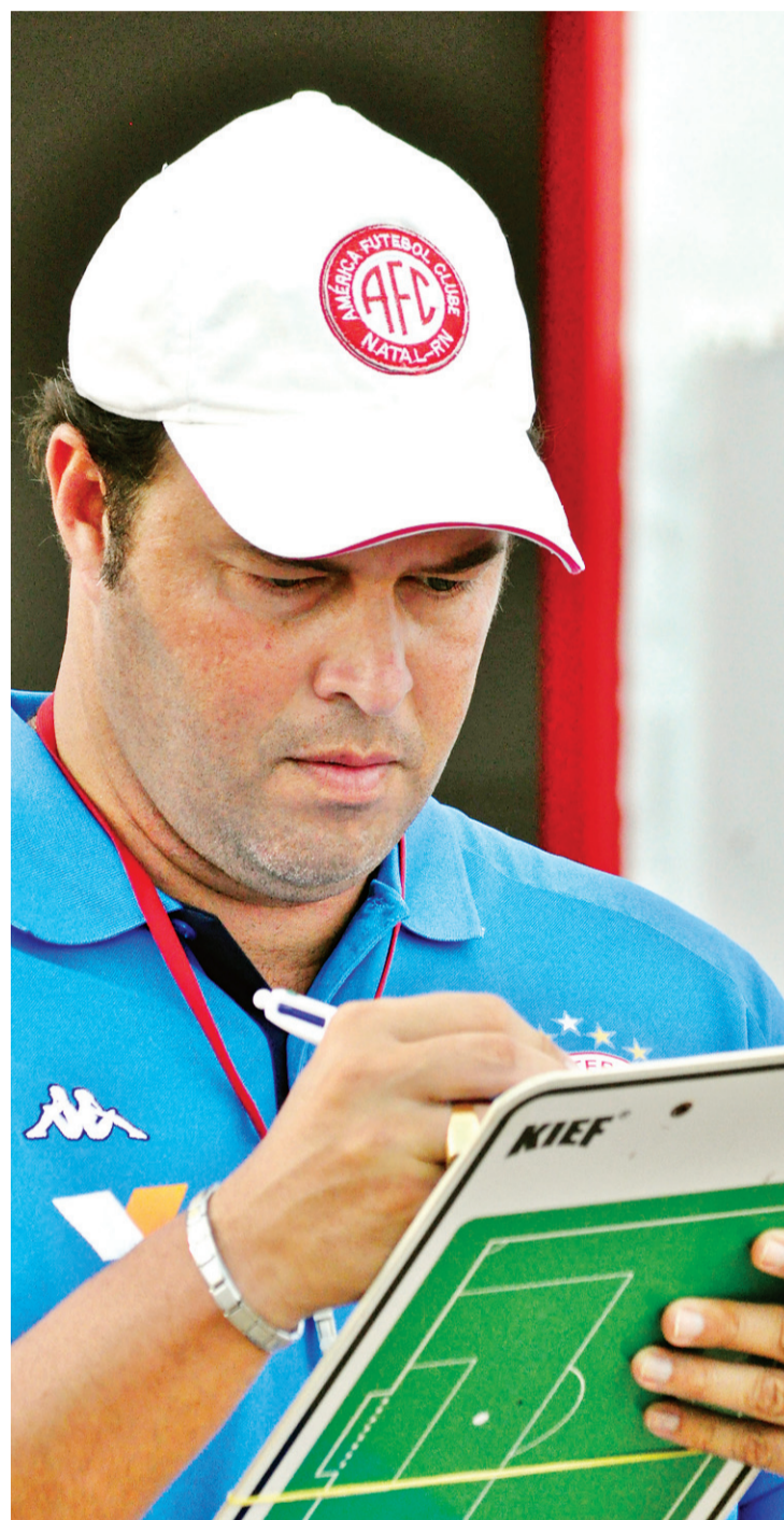
► Técnico quer trocar presença no campo de ataque por gols

O América tentava fazer com que a partida voltasse às data e hora originais – quinta (12), às 19h. Todavia, até o fechamento desta edição o jogo continuava marcado para amanhã, às 16h30 (horário de Natal), na Arena das Dunas.