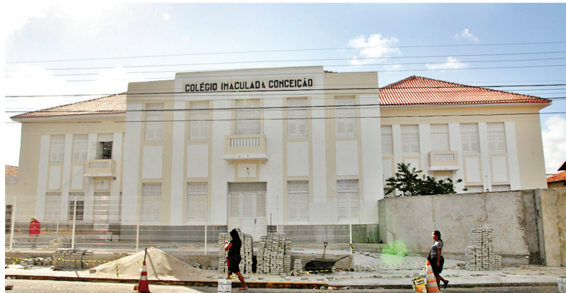
▶ Nova unidade, após reestruturação interna, terá 25 salas de aula com capacidade para 60 alunos cada

“Precisamos implantar todo um sistema de rampas, devido às exigências de acessibilidade para pessoas com dificuldades de locomoção. Também foi preciso criar rotas de fuga e aprimorar o sistema de controle de pânico, por conta das condições impostas pelo Corpo de Bombeiros. Tudo isso já foi incluído no projeto que está sendo executado”, ressaltou Paiva Campos.