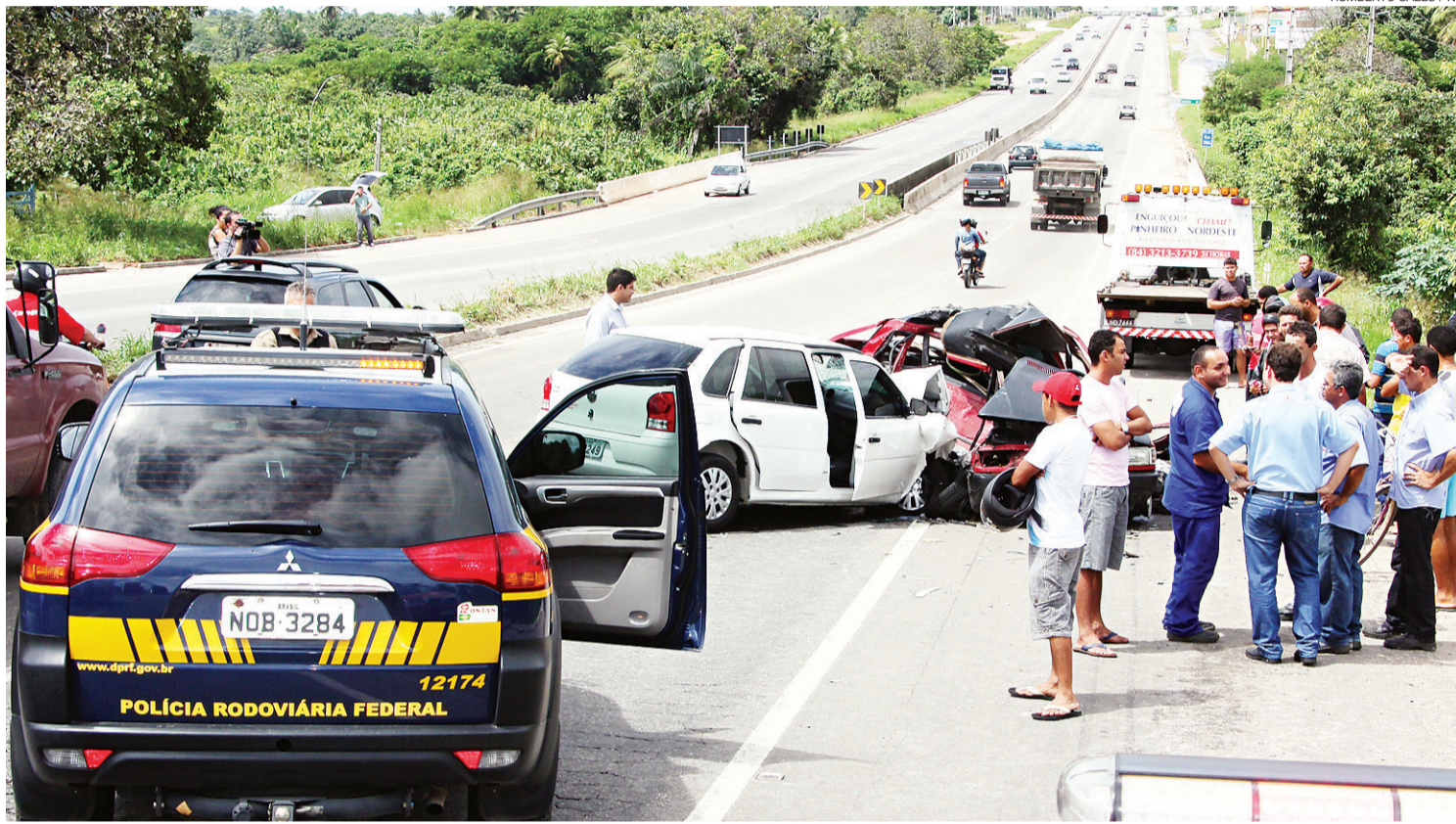
▶ Segundo o relatório da Polícia Rodoviária Federal, o número de acidentes no RN caiu de 3.971 para 3.662 entre 2013 e 2014