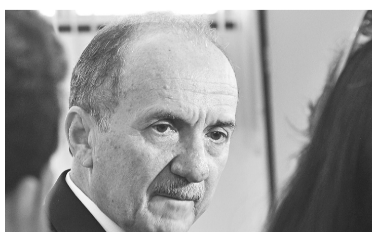
► Presidente do TJ tratou sobre gratificação dos servidores cedidos ao Poder