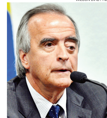
WILSON DIAS / ABR

De acordo com relatório do Conselho de Controle de Atividades Financeiras (Coaf), no dia 16 de dezembro Cerveró sacou R$ 500 mil de um fundo de previdên-