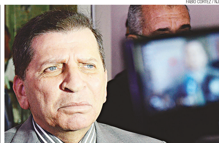
► Vereador pretende trabalhar para fortalecer o partido na capital