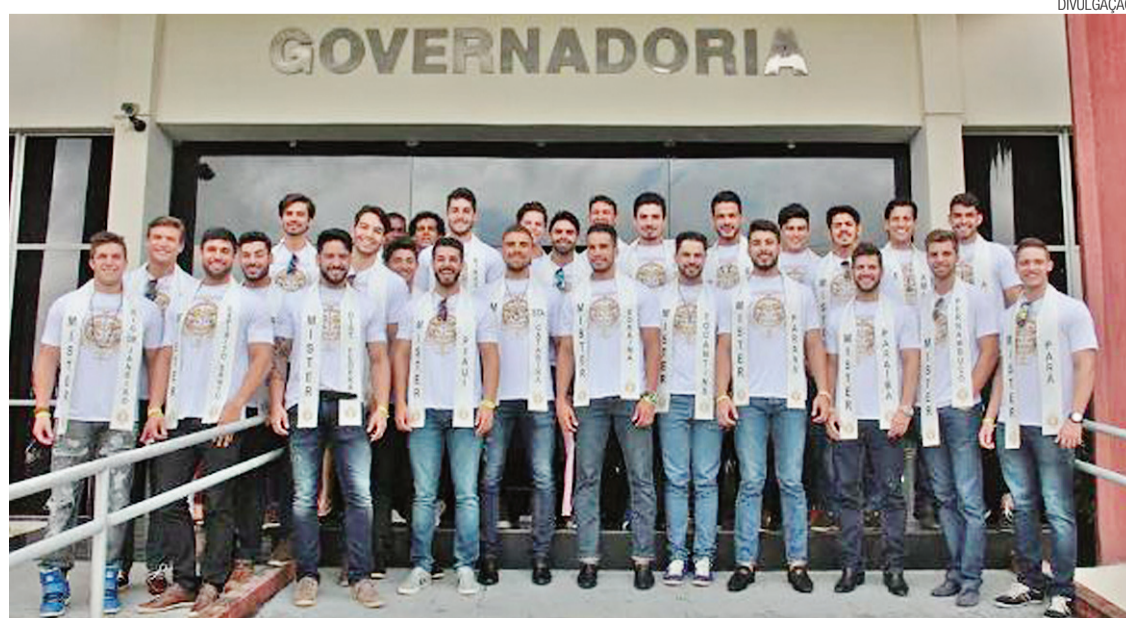
► Concorrentes do Brasil ao título Mister Brasil Universo, hoje à noite em Natal