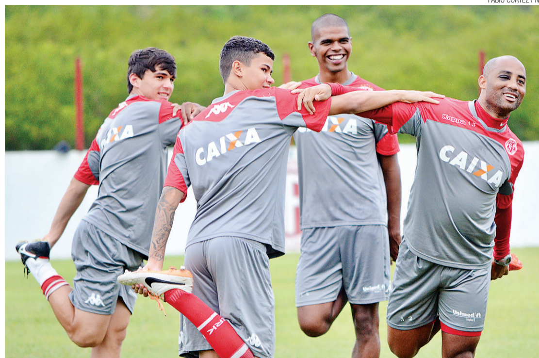
▶ Treinando em clima descontraído, América poderá jogar final em território amigável, com combinação de resultados

A VITÓRIA POR 3 a 2 sobre o Potiguar de Mossoró, na última quarta-feira, em jogo atrasado da primeira rodada do segundo turno, manteve as esperanças do América de terminar a Copa Rio Grande do Norte com a melhor campanha na classificação geral do campeonato. Desta forma, a equipe ganharia o direito de fazer a partida decisiva da grande final contra o ABC na Arena das Dunas.