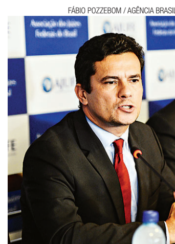
Juiz federal Sérgio Moro

Ontem (22), Moro pediu à Polícia Federal que um laudo seja feito para identificar a pessoa que aparece nas imagens fornecidas pelo banco. Os delegados informaram que a perícia