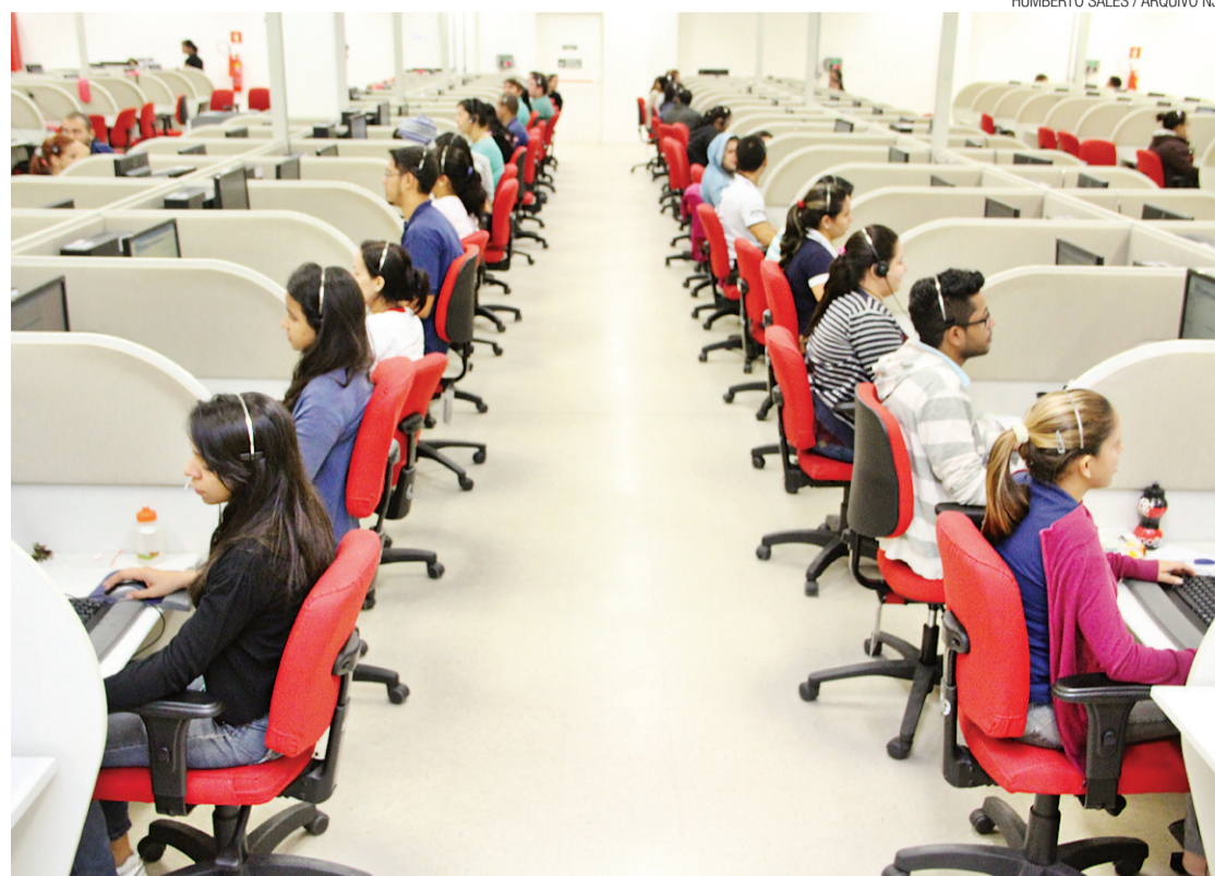
Em todo o Brasil, retomada de empregos foi influenciada pelas contratações do setor de serviços

No resultado consolidado do país, depois de três meses consecutivos em queda, a geração de empregos formais no país voltou a crescer em março, com a criação de 19.282 postos de trabalho