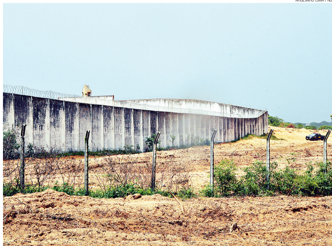
▶ Penitenciária Estadual de Alcaçuz, em Nísia Floresta: duas fugas em pouco mais de duas semanas