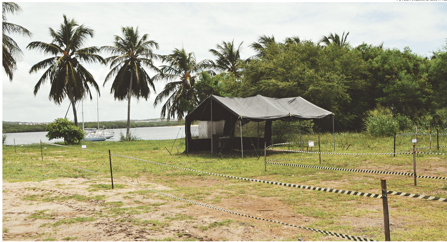
▶ Uma tenda foi armada pelo Exército, próximo ao rio, mas ontem não havia ninguém fazendo uso da estrutura

Como consequência da devolução do terreno, o clube teve que transferir para a lagoa do Bom Fim um curso de velas que seria realizado esse mês. Na lagoa pertencente ao município de Nísia Floresta, no litoral sul, há uma sede campestre do clube. "Não sei o que eles estão fazendo lá na área, só sei que eles disseram que querem porque querem e acabou. Parece que vão fazer um negócio de lazer ou algo do tipo", afirma o comodoro.