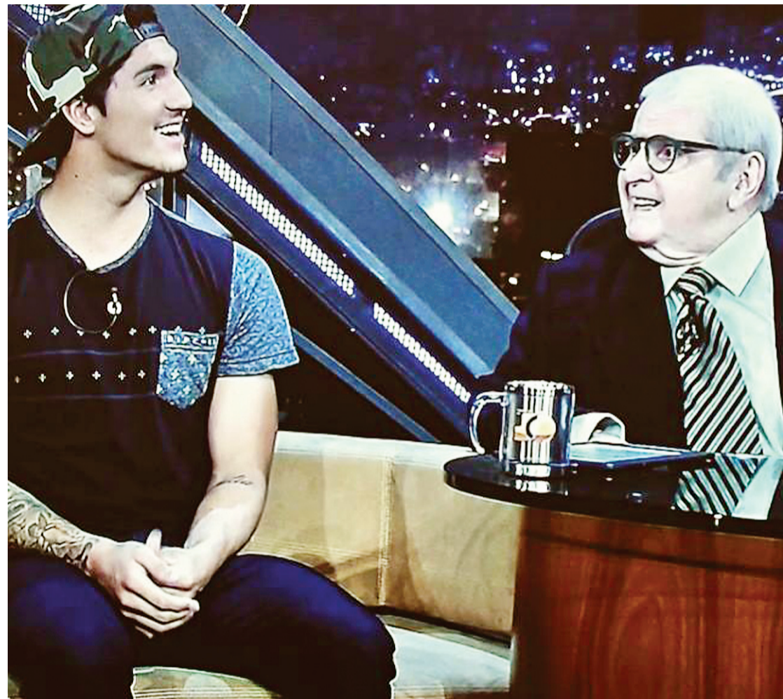
► Gabriel Medina, entrevistado por Jô Soares, na terça-feira, elogiou o novo visual sem barba do apresentador

“Por isso que tenho meu pai para me corrigir. Tenho treinado bastante, conversando com ele sobre meus erros. Tem de estar preparado para ganhar e para perder. Campeão tem de saber se sair bem de momentos difíceis”, disse.