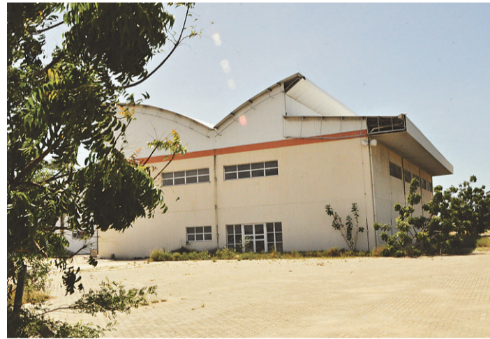
▶ Em operação, o Terminal Pesqueiro deverá gerar 12 mil empregos