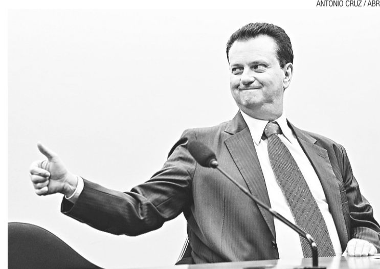
▶ Gilberto Kassab sinalizará hoje possibilidade de quitar 100% dos débitos