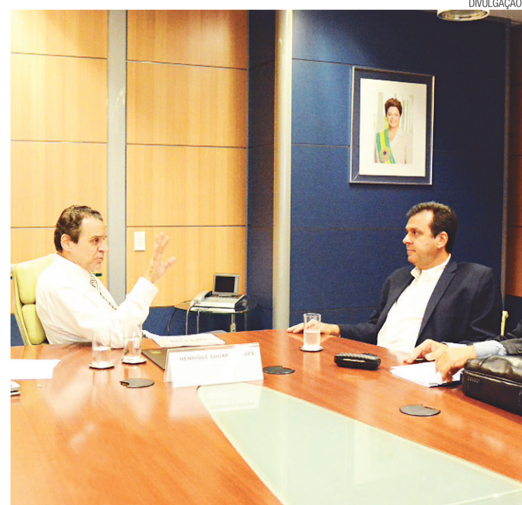
▶ Henrique Eduardo Alves, ministro, e Carlos Eduardo, prefeito: parceria