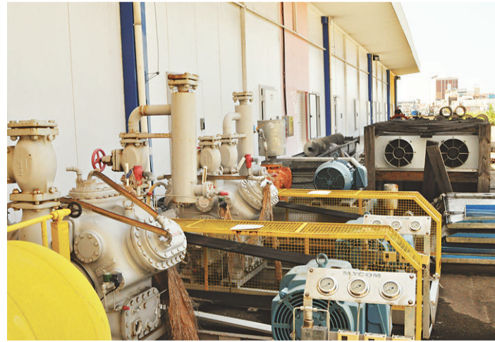
▶ Maquinário acondicionado no pátio apresenta sinal de deterioração