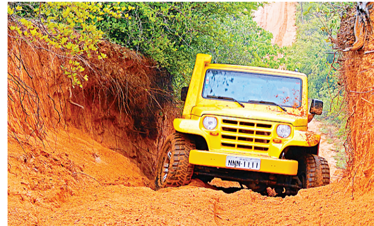
► Comboio vai de Natal até o município de Areia, na Paraíba

Para esta trilha, é esperada a participação de alguns dos novos sócios que foram “batiza-