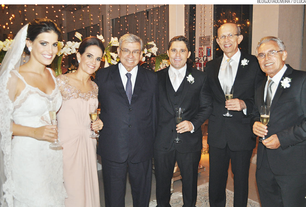
BLOG.JOTAOLIVEIRA / D/LUCA