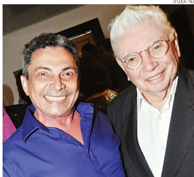
D/LUCA / NU