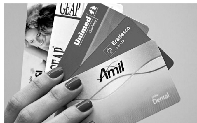
▶ Objetivo é facilitar a compreensão e eliminar dúvidas dos clientes

Em uma análise regional, os dados revelam que o Centro-Oeste (83,8%) registrou, em 2013, a maior proporção de acesso ao celular, seguido das regiões Sul (79,8%) e Sudeste (79,5%). O Norte (66,7%) e o Nordeste (66,1%), embora tenham registrado as menores proporções, são as regiões onde mais cresceu o acesso a um celular na comparação com os dados de 2005, quando o Norte tinha 26,4% da população com acesso a celular e o Nordeste, 23,9%.