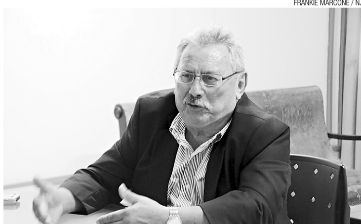
▶ Desembargador Expedito Ferreira: decisão mantida

atos administrativos da atual Presidência do TJRN não são passíveis de apreciação naquela ação, tendo em vista que o presidente do TJ não foi demandado como autoridade coatora, e seus atos foram postos apenas e seus atos suposta consequência do ato apontado como coator, não podendo serem analisados de forma autônoma.