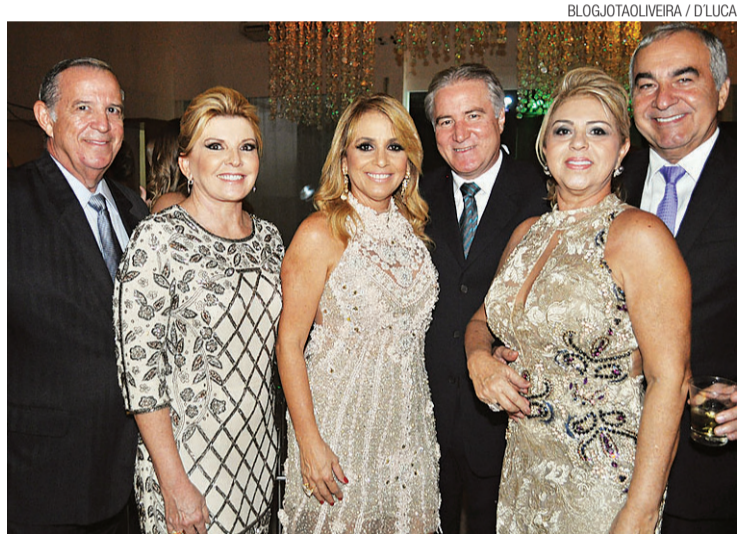
BLOG.JOTAOLIVEIRA / D/LUCA

Produtor do documentário sobre Ayrton Senna, cineasta britânico Asif Kapadia, vai lançar um filme