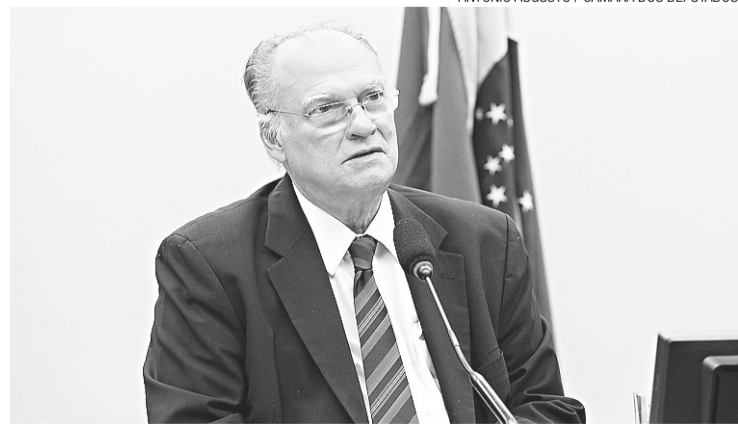
▶ Deputado federal Roberto Freire: “história de lutas em comum”

Segundo Roberto Freire, as duas legendas começaram a discutir o processo de fusão na pré-campanha de Eduardo Campos à Presidência da República. “Temos muito em comum com o PSB, estivemos juntos em muitas lutas, mas esta não é uma homenagem ao passado, mas sim ao futuro, pois o Brasil atravessa uma crise grave e busca alternativas; queremos construir