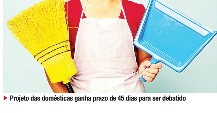
► Projeto das domésticas ganha prazo de 45 dias para ser debatido

O projeto começou a tramitar há dois anos, logo depois da aprovação da Emenda Constitucional 72, que estendeu às domésticas todos os direitos dos demais trabalhadores. A emenda, no entanto, só poderá ser plenamente implementada quando o projeto de regulamentação for aprovado.