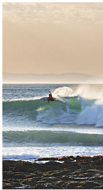
► Jeffrey's Bay, pico de tubarões

A onda em J-Bay é longa, forte, rápida e perigosa, com espaço para manobras e tubos pelo caminho. As paredes amplas favorecem os surfistas regulares, que surfam com o pé esquerdo na frente da prancha. Os “goofys” (pé direito na frente), como o atual campeão mundial Gabriel Medina, precisam surfá-la de costas, exigindo um maior grau de dificuldade, mas nada impossível para os melhores do mundo.