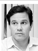
DO PRESIDENTE DA CAERN, MARCELO TOSCANO, SOBRE AS RESTRIÇÕES AO CONSUMO D'ÁGUA NO ESTADO

É muito difícil para o cidadão comum entender que, num momento de crise como o que está sendo vivido pelo Governo do Rio Grande do Norte, exista uma parte deste mesmo Governo que não tem problema financeiro e que se mostra acima da realidade comum, proclamando possuir os recursos para prévio pagamento do confisco da propriedade privada, segundo avaliação feita por uma outra repartição pública, embora aparentemente, o Brasil ainda vive uma economia de mercado, sem o estado ispor de poderes para impor sua vontade na avaliação de uma propriedade privada, como se está fazendo neste caso. O estado democrático de direito, como reconhece a nota do Tribunal de Contas, garante essas manifestações, mas torna difícil a prática de atos de força como está sendo conduzido a tentativa de confisco de uma propriedade privada.