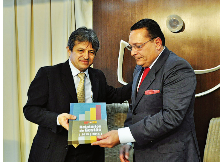
► Rinaldo Reis, procurador-geral de Justiça, e o deputado Ezequiel Ferreira

Os dados da gestão orçamentária mostram um crescimento na arrecadação do Fundo de Reaparelhamento do Ministério Público. Desde 2012, quando Rinaldo assumiu, a arrecadação saltou de R$ 5,6 milhões em 2012 para cerca de R$ 7,8 milhões em 2014. A evolução se deve, segundo ele, a uma modernização nos instrumentos de arrecadação.