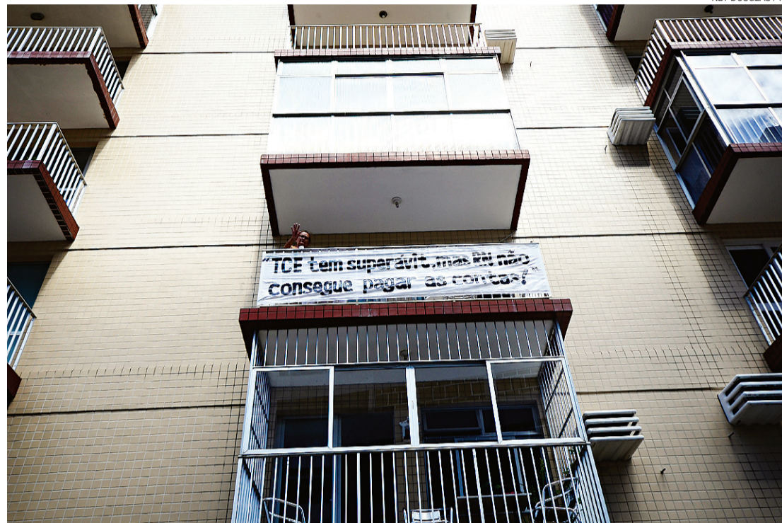
► Faixas de protesto contra o TCE no edifício Luciano Barros, cujos moradores lutam para manter área em questão

De acordo com a nota, a escritura do terreno foi divulgada "para repor a verdade e comprovar a titularidade do terreno". "O terreno foi comprado e todas as taxas (IPTU e outras) estão em dia, quitadas religiosamente, durante todo este tempo. O terreno é fundamental para o condomínio. É usado como estacionamento, sa-