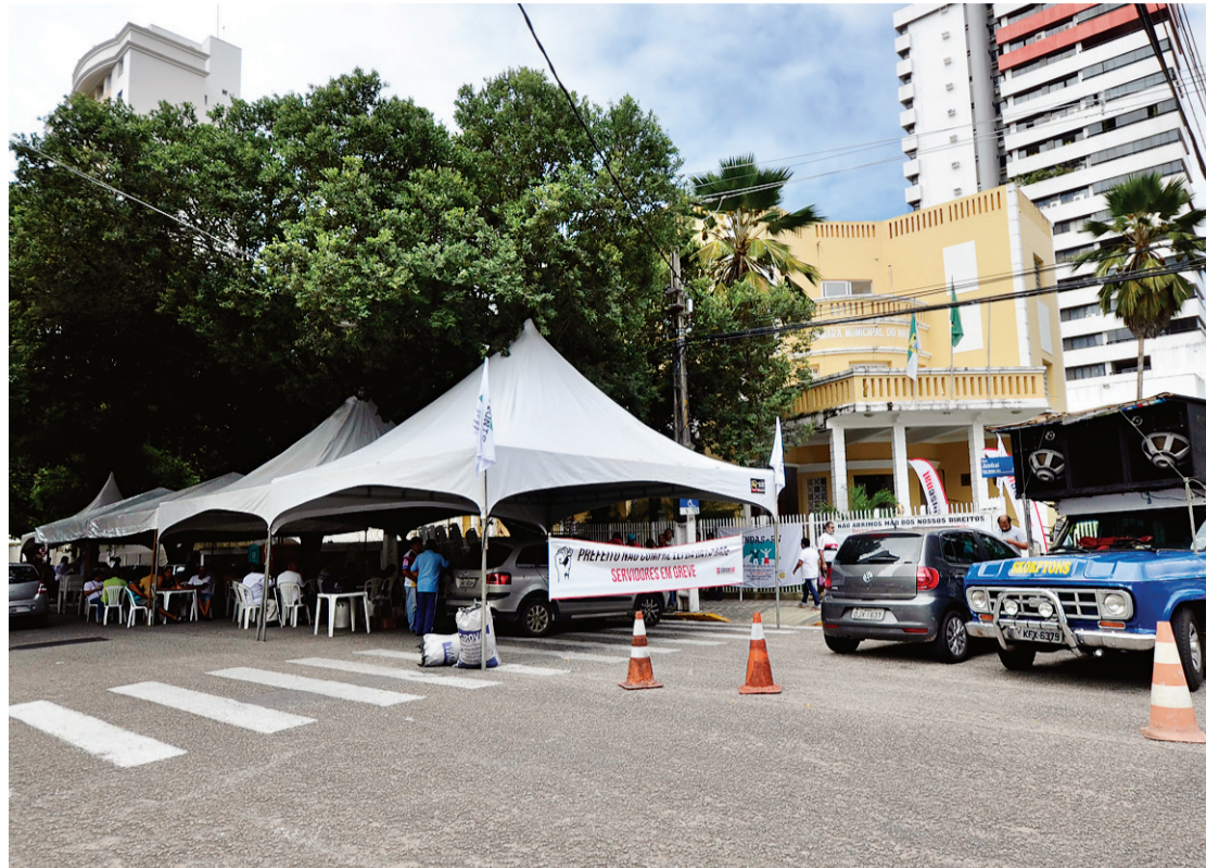
► Servidores em greve desde o dia 22 de junho montaram acampamento ontem na frente da Câmara Municipal