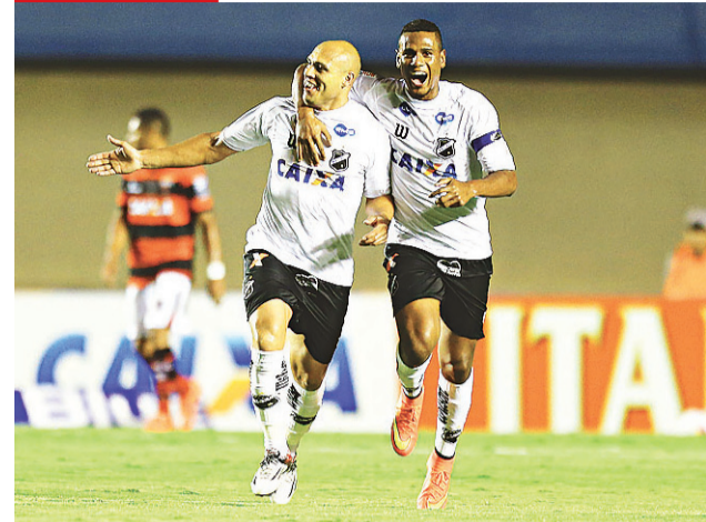
Edno (e) marcou duas vezes e já é festejado pela torcida