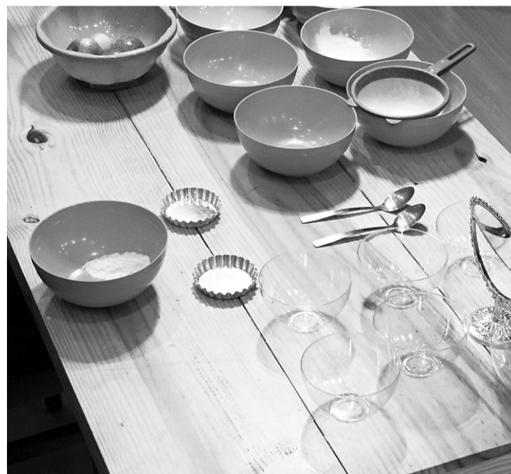
▶ Peça proporciona ao público uma experiência gastronômica inusitada