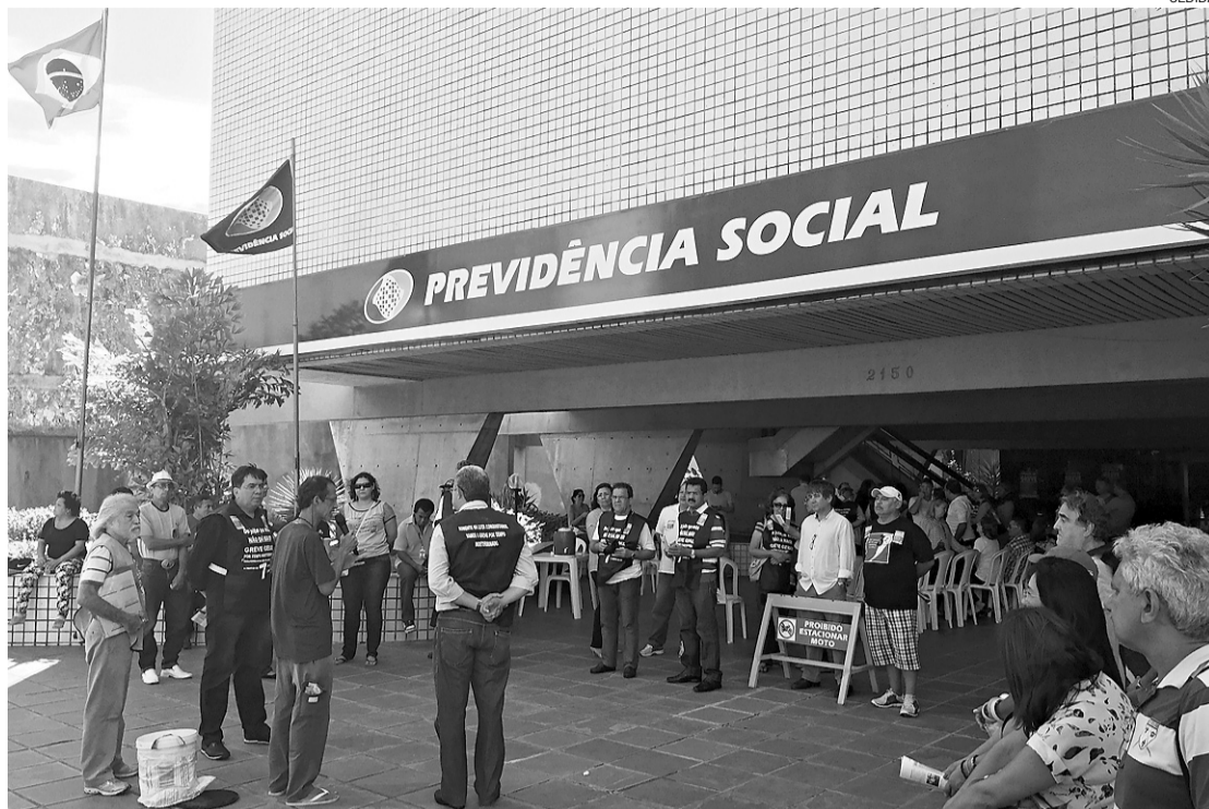
► Sindicato dos Trabalhadores Federais em Previdência, Saúde e Trabalho do Estado realizou ato em frente à sede do INSS

"Há uma tentativa antiga de diálogo com o governo federal,