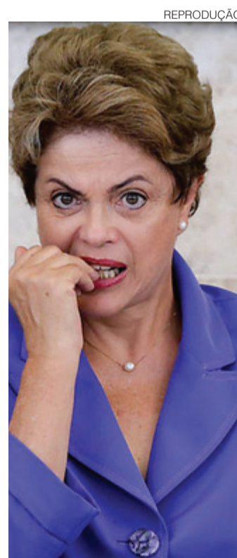
// Dilma: vaiada em Palmas

Além do chefe dos terrenos, outra liderança dos xavantes, ao microfone, pediu a presidente que não seja aprovada a PEC 215 e que o gover-