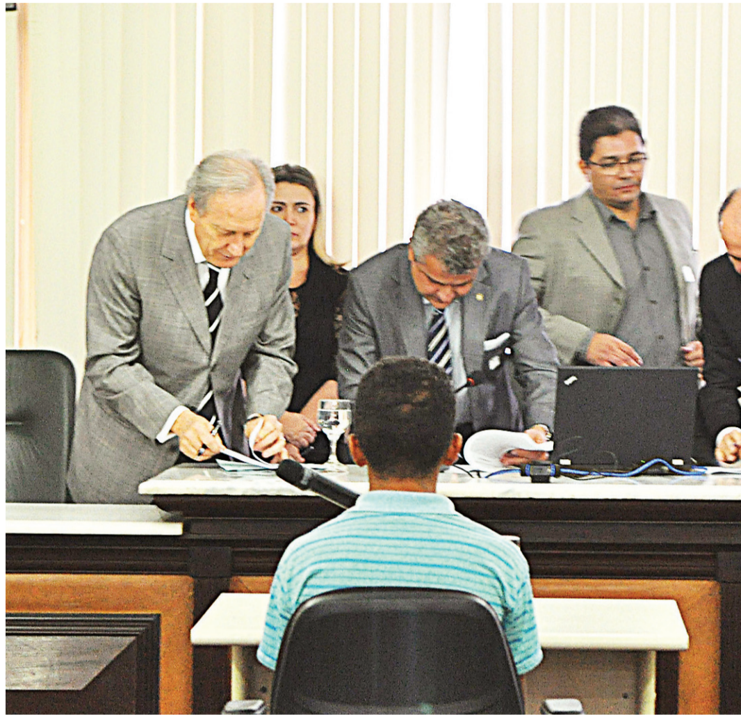
// Primeira audiência no RN foi presidida pelo ministro Ricardo Lewandowski, presidente do STF

Agora, depois da conclusão dos trabalhos pelo delegado, a pessoa detida é levada até a Central de Flagrantes, tem o processo analisado pela secretaria instalada no local e a audiência marcada. "Os casos que chegam até o meio da tarde têm audiência marcada ainda para o mesmo dia", acrescenta a magistrada, afirmando que em al-