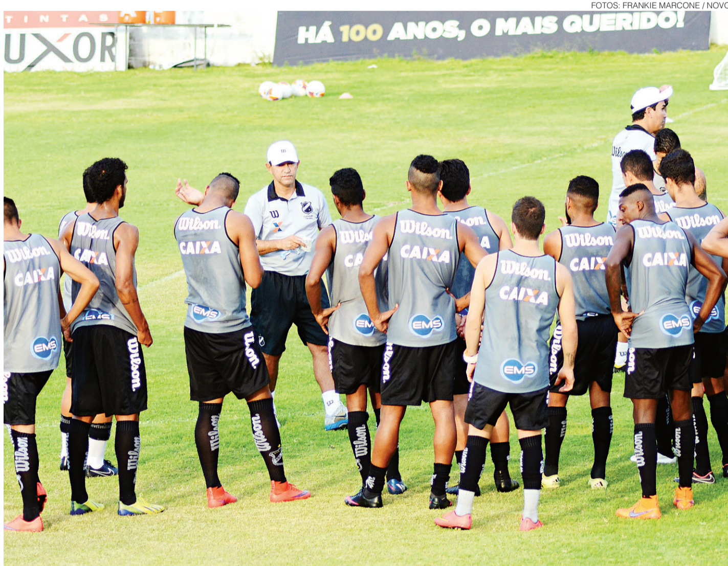
// Time viajaria na tarde de ontem para a capital paranaense, mas voo acabou sendo remarcado sucessivas vezes