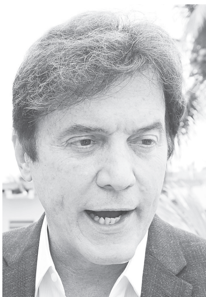
// Governador do RN, Robinson Faria, quer mudança na economia

“Isso gera emprego e renda para o povo. Com isso, o governo arrecada mais”, apontou.