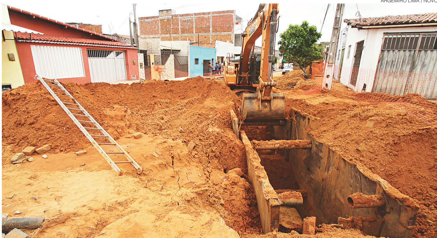
ARGEMIRO LIMA / NOVO

Transtorno é provocado pela obra de recuperação da rede de esgoto, que requer a interrupção do abastecimento realizado pela Caern; oito bairros são afetados pela medida até o dia 31. Cidades#9