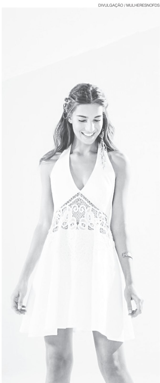
// Farm lança a coleção Flor de Sal, exclusiva para o fim de ano