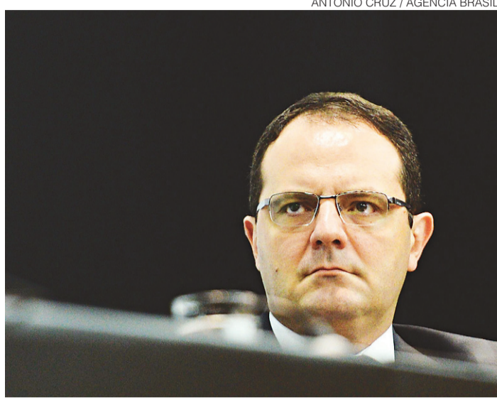
// Nelson Barbosa: “pagar o quanto mais a gente puder”

Barbosa explicou que o Ministério da Fazenda e o Tesouro Nacional têm mantido contato com os três bancos públicos - Banco do Brasil, Caixa Econômica Federal e Banco Nacional de Desenvolvimento Econômico e Social (BNDES)-, além do fundo do FGTS, para acertar detalhes operacionais desse pagamento. Sobre o impacto desses pagamentos na liquidez do sistema bancário, Barbosa dis-