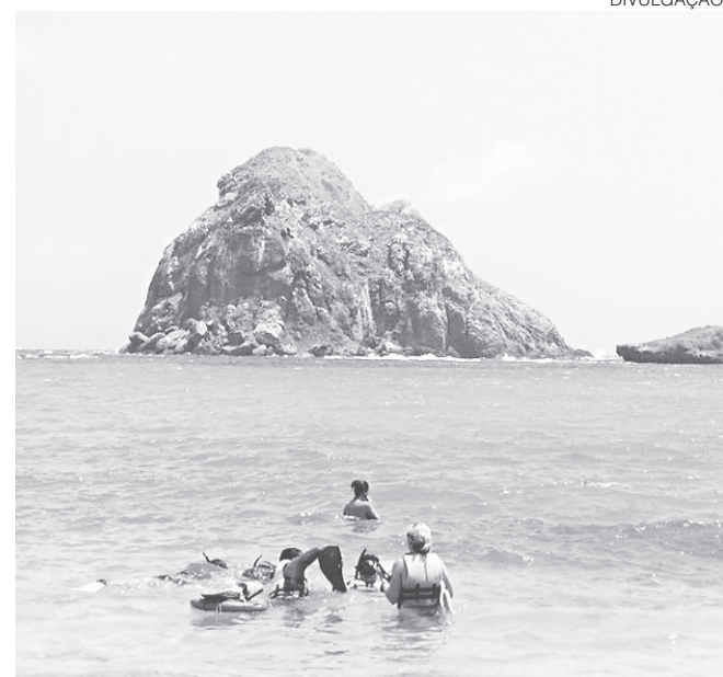
// Baía do Sueste ficou interdita para banho