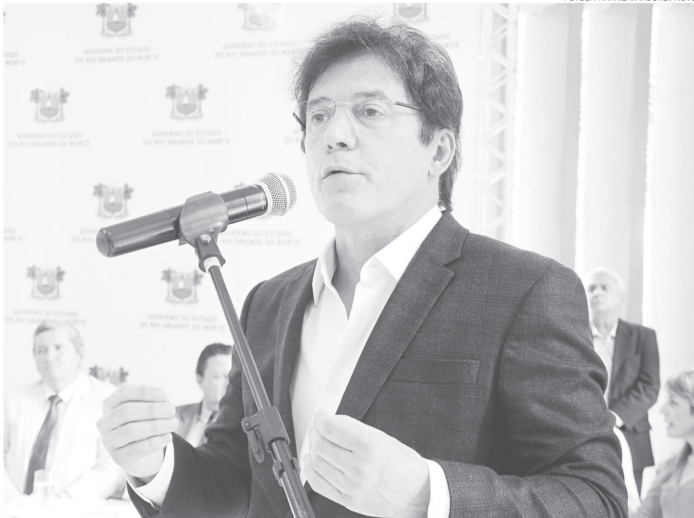
// Robinson Faria passou todo 2015 falando em política mas a uma semana para término do ano, disse que só fala sobre o assunto em 2016

Nesta semana, a menos de 10 dias para 2016, a afirmativa foi outra: “eu só vou falar de política no próximo ano. Nesse ano eu só vou falar de trabalho. A população não quer