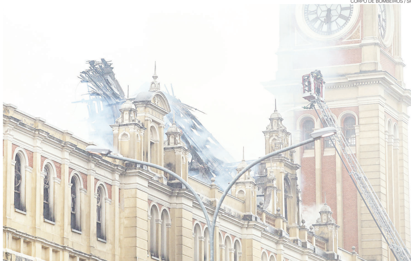
//Incêndio destruiu 75% de um dos lados do museu, na região central de São Paulo; brigadista morto intoxicado foi enterrado ontem

Por isso, a circulação dos trens das linhas