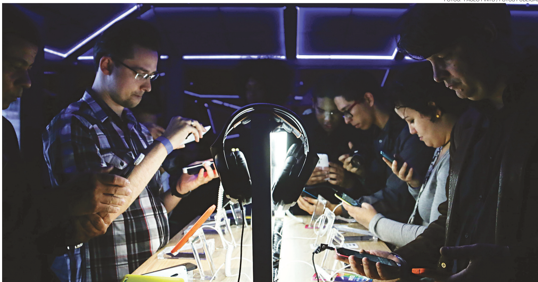
// Ano passado foram vendidos 54 milhões de smartphones e a previsão dos fabricantes para 2015 é vender 48,8 milhões de aparelhos celulares por causa da crise econômica

Os smartphones também estão mais caros: o preço médio dos aparelhos sal-