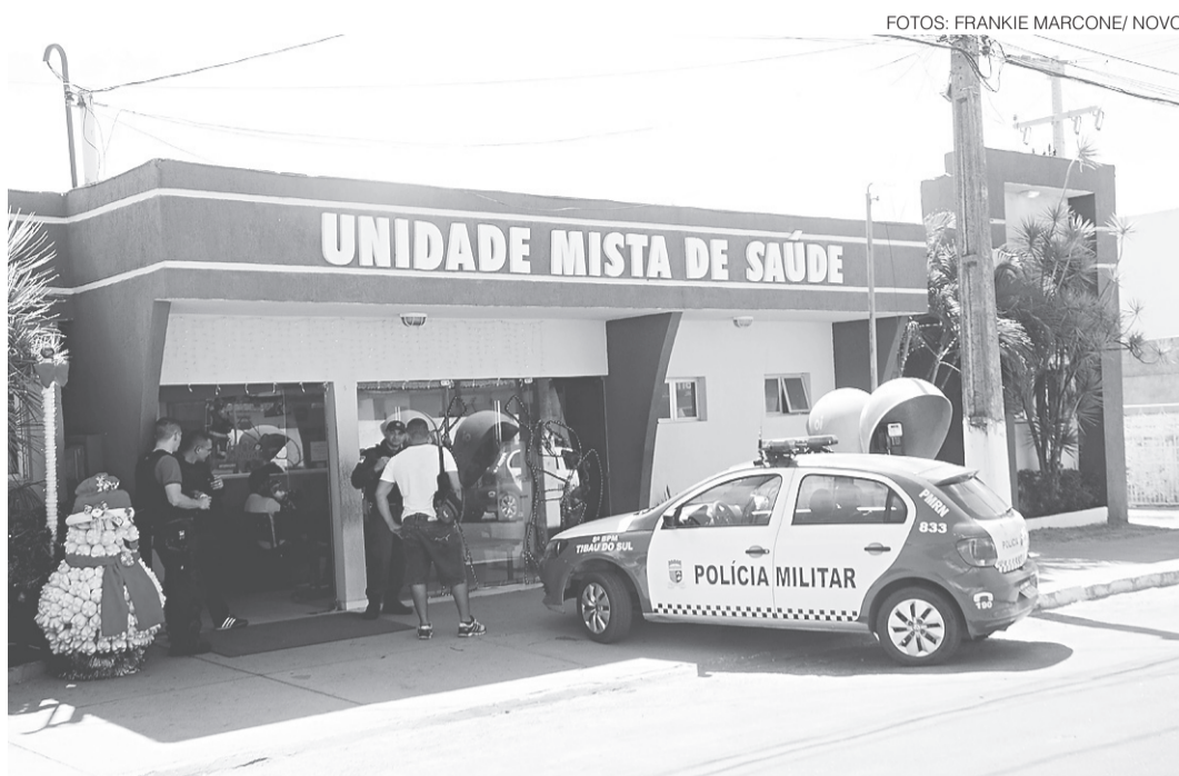
// Unidade de Saúde de Tibau do Sul, local da ocorrência de agressão no início desse mês