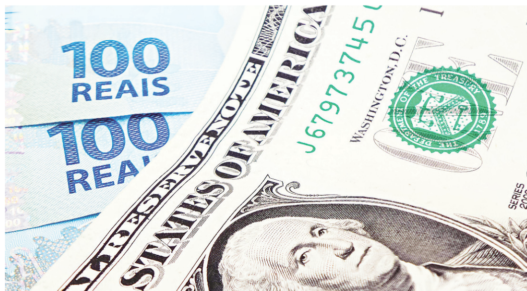
// Cotação de moedas e informações do mercado de capitais parece algo distante da maioria da população

Márcio ainda comenta sobre como é passar para os mais de 5000 clientes que a empresa tem em todo o país,