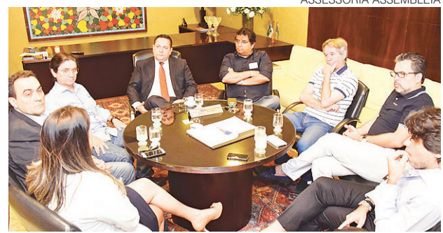
Reunião com presidente da Assembleia Legislativa

“A despeito do rebaixamento da nota, os bônus brasileiros continuam sendo um investimento muito bom e confiável”, disse, ao reafirmar que o País continua sendo atrativo aos investidores, sejam financeiros ou operacionais. Ele deu como exemplo a recente rodada de leilão de geração elétrica, que atraiu vários interessados. “Mesmo com esse período econômico e político, há investidores vindo para o Brasil”, declarou.