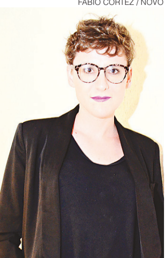
FÁBIO CORTEZ / NOVO

Por que o ex-governador Fernando Freire precisou enfrentar exame de corpo de delito? #6