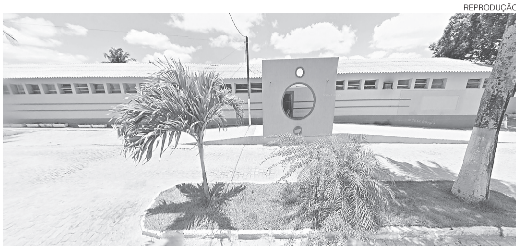
// Hospital Municipal de Goianinha: novo palco de mais uma agressão contra profissionais da área de saúde

“O médico disse que se ele estava com dor desde ontem, devia ter ido ao hospital na noite passada [no domingo] e que ele esperasse para ser atendido na sua vez. Foi aí que o idoso deu um soco na boca do médico”, contou Renato Dias. Após a agressão, seguranças do hospital foram acionados para apaziguar a situação e evitar maiores tumultos no interior da unidade de saúde. A Polícia Militar chegou em seguida.