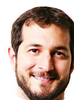
Jornal de [ Carlos Fialho ]

Sem grandes alardes ou fogos de artifício, a vida segue. E nós vamos com ela. Construindo histórias. #4