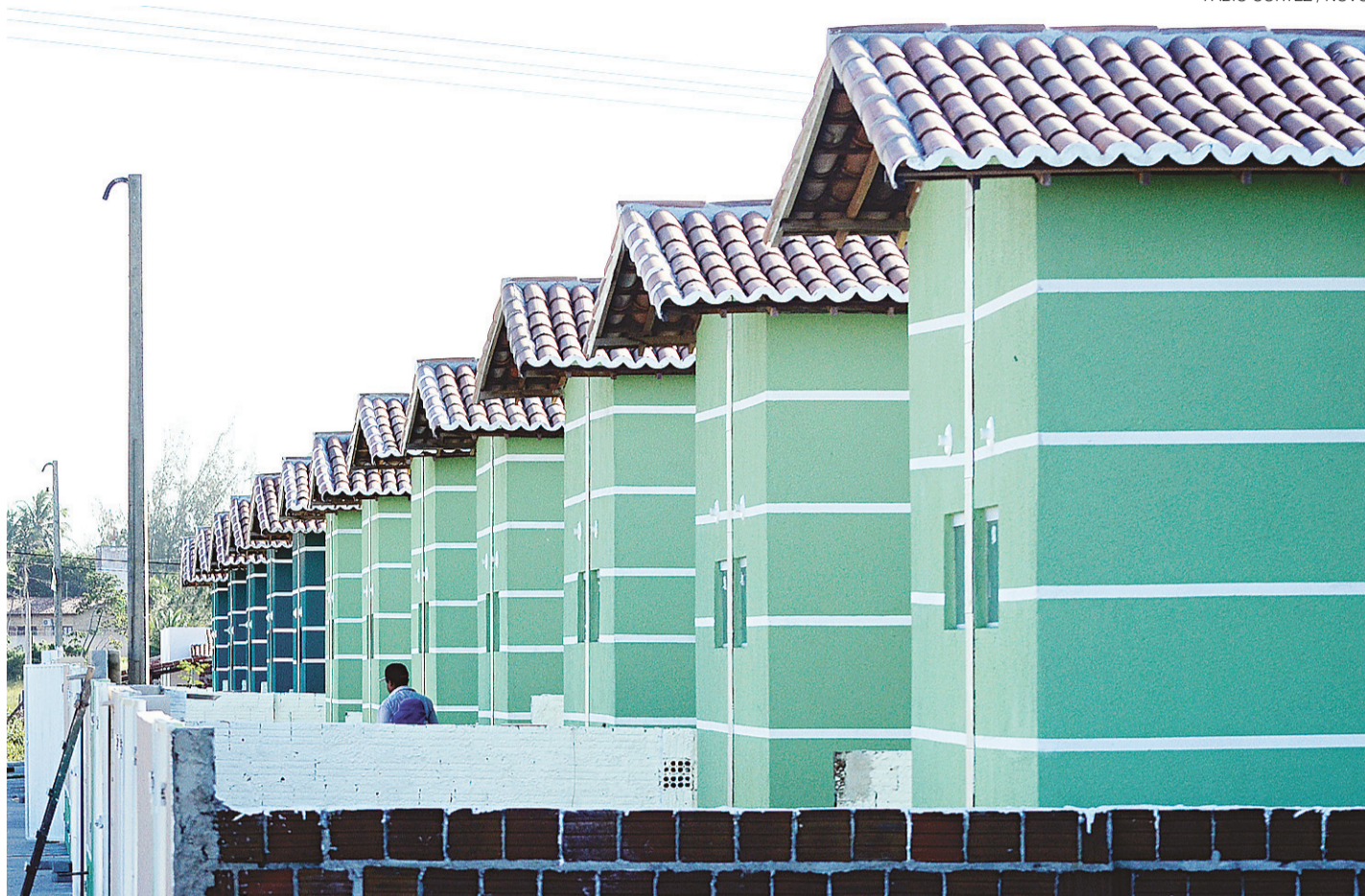
// Em 2014 foram contratadas 515 mil moradias, 46% inferior do recorde de 2013 quando o programa lançou 1 milhão de casas em todo o país

O MCMV só não parou este ano porque contou com os recursos do FGTS. Para a chamada faixa 1, foram direcionados R$ 3,3 bilhões para pagar as obras de 80 mil moradias que estavam em construção, mas paralisadas por causa dos atrasos do pagamento do governo às construtoras. O FGTS foi autorizado a custear até 80% do