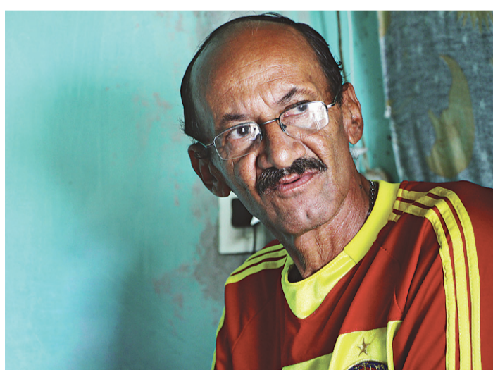
// Pescador revela que estava perdendo a esperança quando foi resgatado

Os oito estavam de mãos dadas e com um cabo amarrado na bóia. "Porque se um descesse sozinho pro fundo,