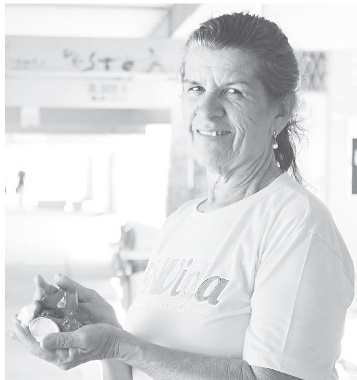
Silaneide, a queridinha das trufas que encantou a UFRN.