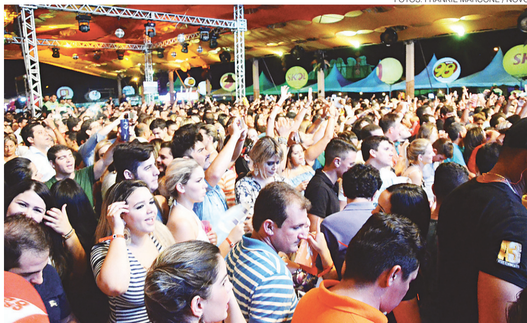
// Arena Ecomax, em Pirangi, recebeu grandes nomes da música nacional nos dois últimos fins de semana

O público aprovou a diversidade das músicas está aprovada. "Eu acho