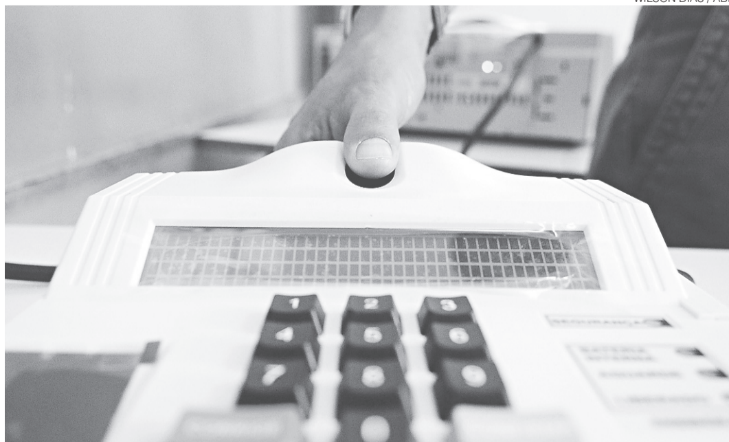
// Aqueles que não comparecerem à revisão biométrica terão os seus títulos eleitorais cancelados

Em Parnamirim, o TRE vai montar o espaço de revisão