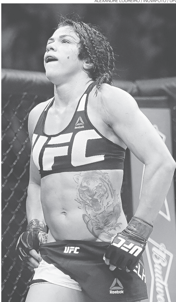
// Lutadora vai comandar time no The Ultimate Fighter 23

O atacante começou a carreira no Santos em 2008, mas nunca se firmou no time da Vila Belmiro. De lá, foi nego-