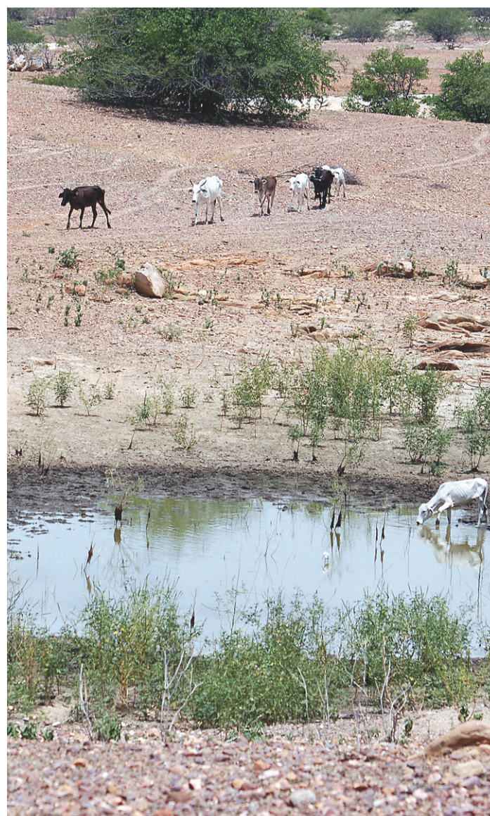
// Início do plantio no semiárido depende de prognósticos do clima

De acordo com ele, as chuvas deste final de semana no RN são resultado de fenômeno transientes (passageiros) como os vórtices ciclônicos.