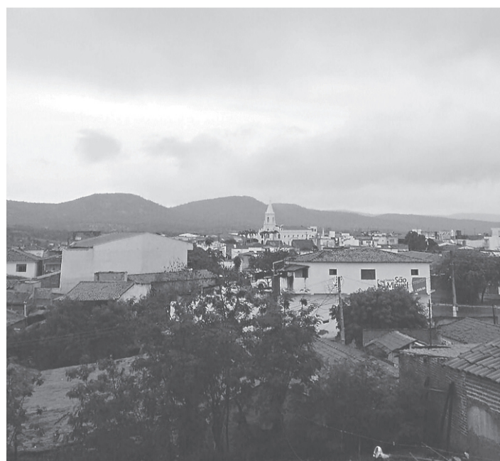
// Leitora Leticia Batista enviou esta foto de Currais Novos