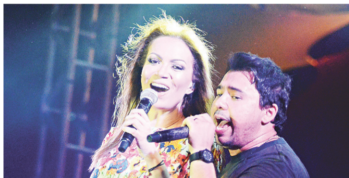
//NOVO promoveu ações de marketing durante os shows em Pirangi