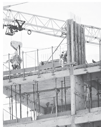
"Hoje, o governo deve faturas de agosto de 2015", diz Sindusconstrutoras.