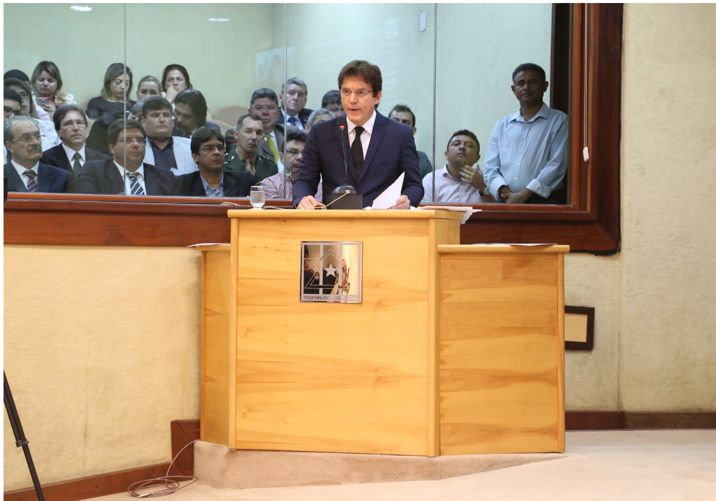
// Governador Robinson de Faria durante discurso de abertura do ano na Assembleia Legislativa

Na Assembleia, governador revela que estado já registrou queda no comprometimento da despesa de pessoal de 53,11% para 51,57%