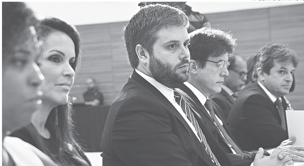
// Luiz Guilherme Mendes de Paiva, secretário Nacional de Políticas sobre Drogas: seminário em Natal

voltado para educandos do 1º ao 5º anos do ensino fundamental; o outro é o #Tamojunto, para estudantes do 7º e 8º anos do ensino fundamental, e o terceiro trata-se do Programa Fortalecendo Famílias, para famílias de crianças e adolescentes entre 10 e 14 anos de idade.