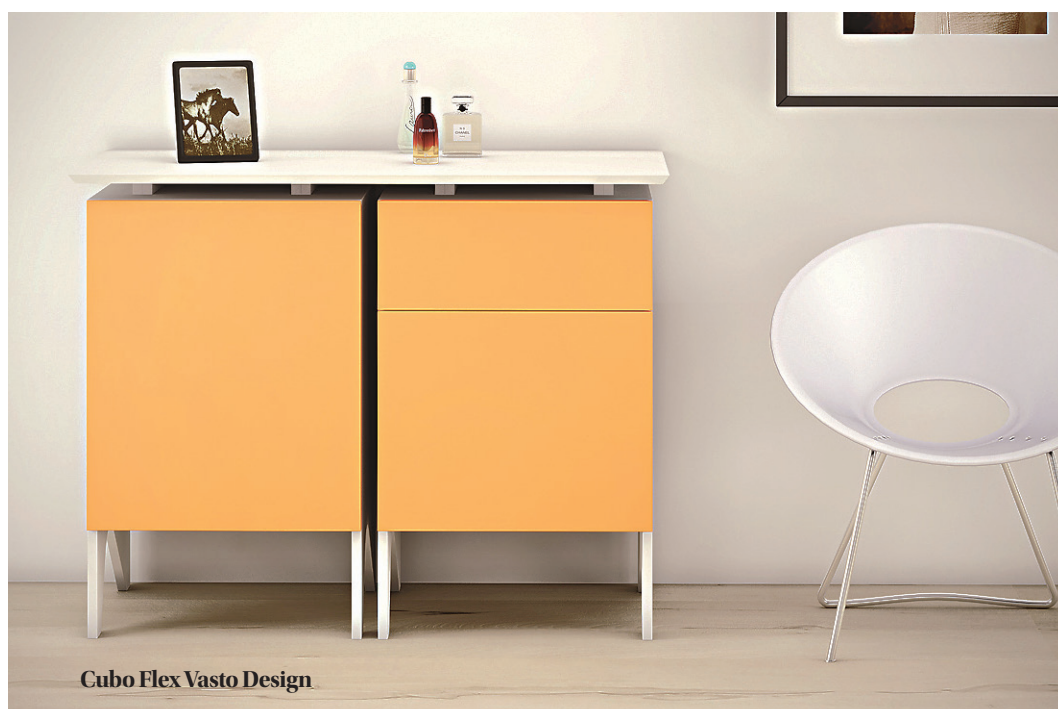
Cubo Flex Vasto Design