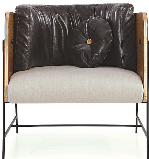
Poltrona Vip por Bruno Fauz