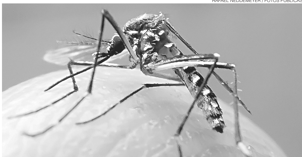
// Agente poderá solicitar auxílio de autoridade policial para ter acesso a imóveis fechados

O pesquisador afirma que são necessários mais estudos para a confirmação científica da relação entre o vírus e a microcefalia. “Não sabemos quanto tempo vai levar até comprovarmos essa relação”, disse. Segundo a diretora-geral da OMS, a relação entre a infecção por Zika na gravidez e a microcefalia não é cientificamente comprovada, mas é “altamente provável”.