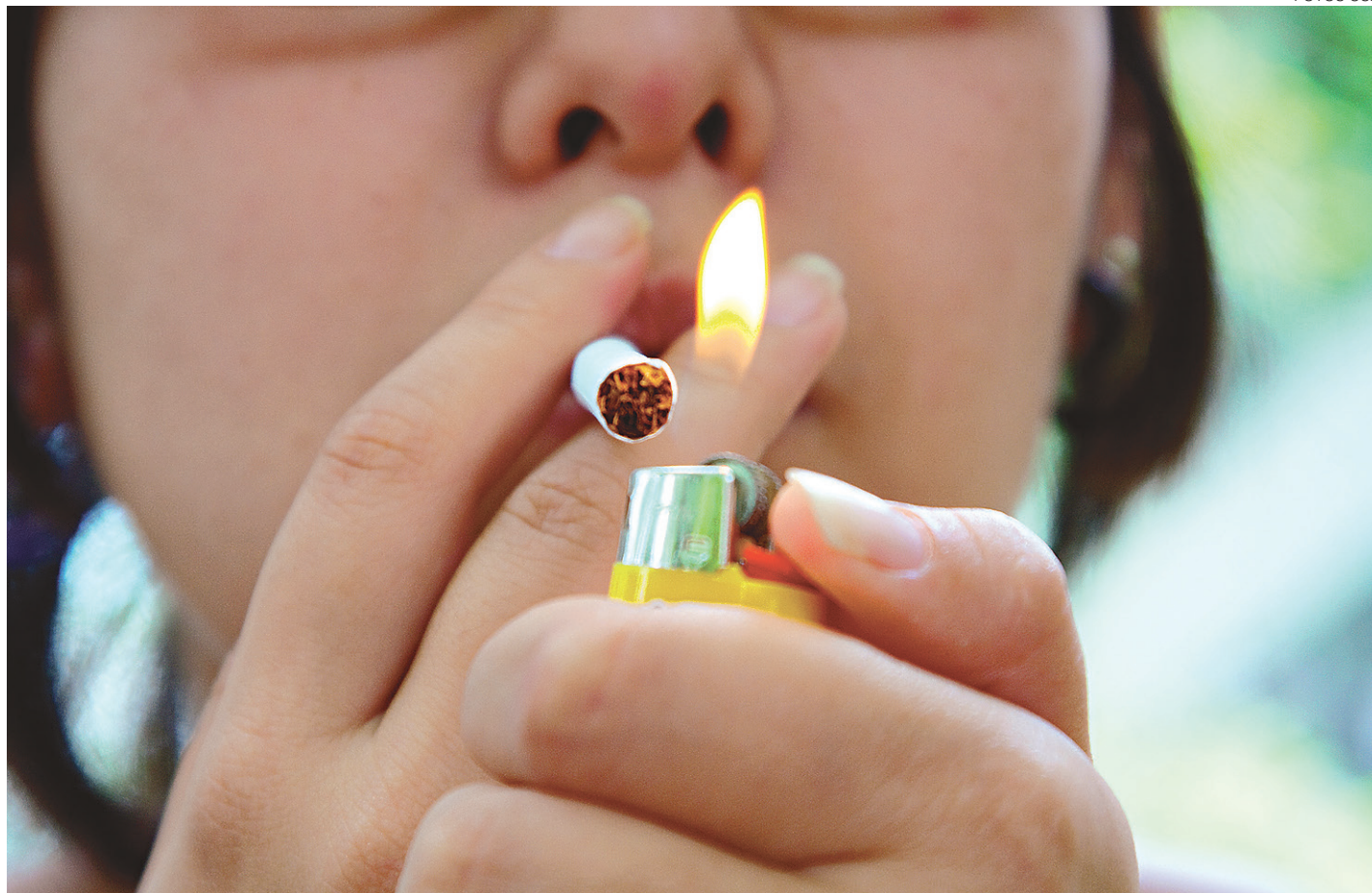
// Medidas na cobrança do IPI elevarão arrecadação para R$ 641 milhões para este ano; 1,06 bilhões em 2017; R$ 1 bilhão em 2018

De acordo com a Receita Federal, a nova sistemática de cobrança sobre o percentual da venda, além de ser mais transparente e justa, pois depende do preço efetivamente praticado, põe fim à necessidade de se editar decretos sempre que fosse necessário