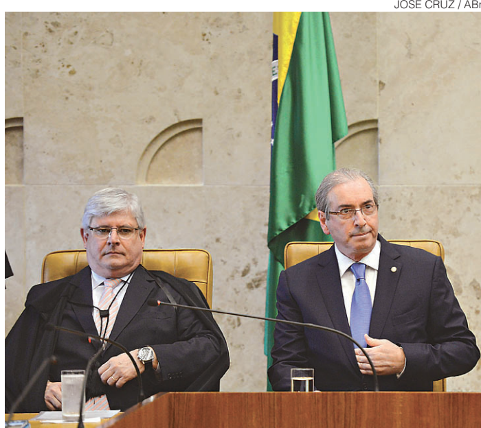
// Rodrigo Janot e Eduardo Cunha, lado a lado

Na abertura do ano legislativo, o presidente do Supremo Tribunal Federal (STF), Ricardo Lewandowski, destacou as ações do Judiciário em 2015 e falou em “severa crise política e econômica” enfrentada no ano passado. Sem citar o processo de impeachment da presidente da República, Dilma Rousseff, que teve o seu rito definido pela Corte no ano passado, Lewandowski afirmou que coube ao Judiciário garantir “a estabilidade das instituições republicanas”. “Esta Suprema Corte, por seu turno, acionada em diversas oportunidades para dirimir questões das mais destacadas relevâncias, sempre atuou de modo tempestivo, firme, sereno e responsável, no sentido de garantir a estabilidade das instituições republica-