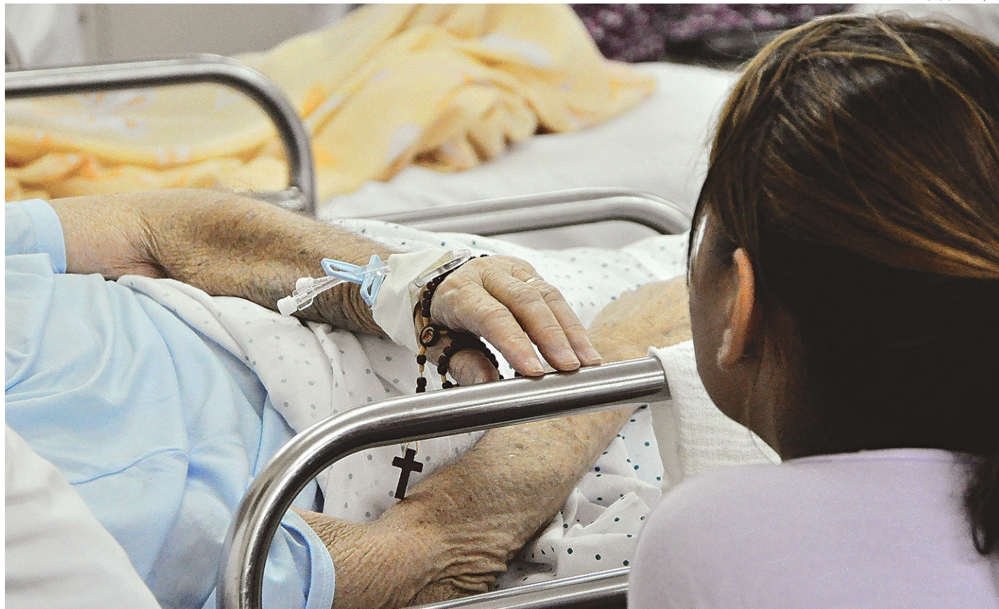
// Hospital Walfredo Gurgel, maior referência no atendimento de trauma no estado, pode voltar a funcionar hoje com o quadro médico completo