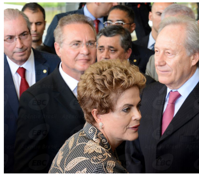
// Dilma Rousseff na abertura dos trabalhos do Congresso

Ele salientou que a parceria entre os poderes deve visar também este aspecto. “No meu entendimento particular, a crise só pode ser enfrentada a partir de uma proposta de reformulação da estrutura do poder pública do estado, que hoje consome bastante recurso público de forma a não atender as áreas essenciais. Precisamos corrigir essas distorções que existem hoje na estrutura do poder público brasileiro”, apontou.