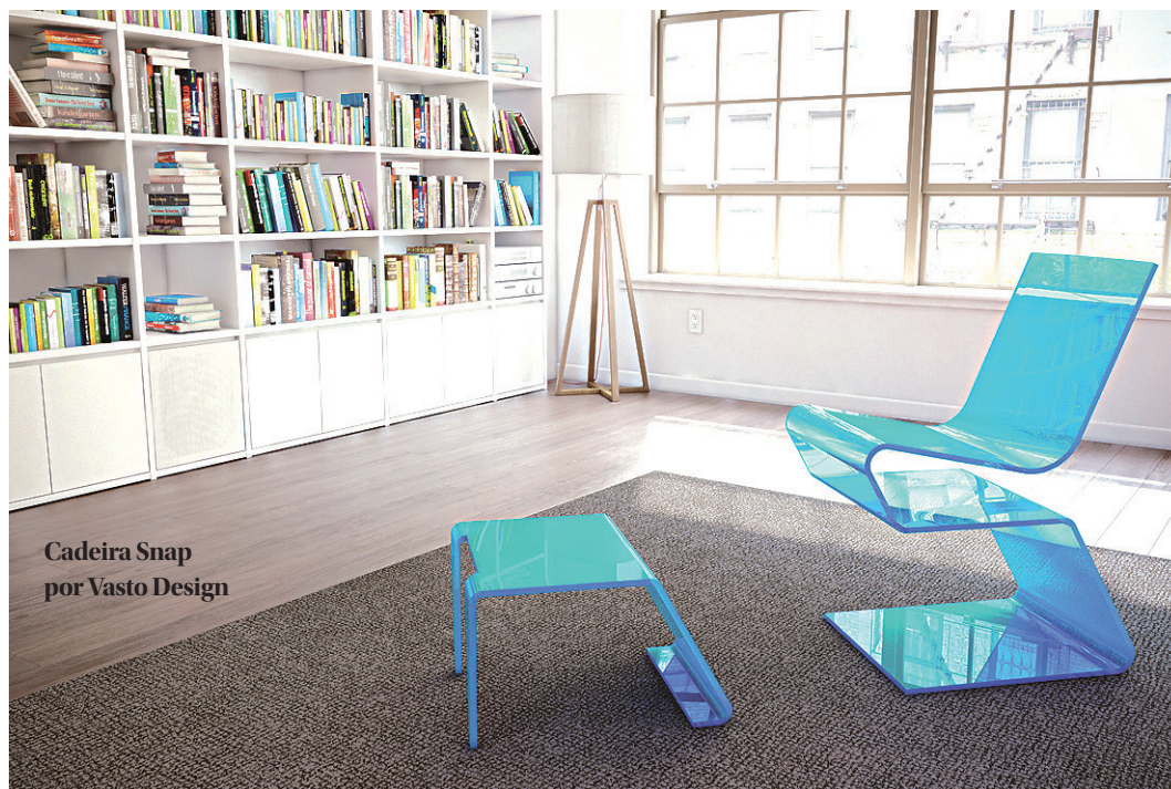
Cadeira Snap por Vasto Design

Principal evento de negócios em mobiliário e design, a Paralela Móvel realiza, de 15 a 18 de Fevereiro, no MuBE (Museu Brasileiro de Escultura), em São Paulo, a 6ª edição da feira que é ponto de encontro entre criadores, grandes marcas e compradores de todo país. Na Paralela Móvel, as principais tendências e inovações do mercado mobiliário, de novas formas a novos métodos os de criação são apresentados anualmente pela Ota Design, responsável pela realização do evento, e também organiza duas vezes ao ano a Paralela Gift, feira de design e decoração. Neste ano, a Paralela Móvel já tem confirmados expositores como Ameise Design, 80e8, Estúdio Rika, Moora Móvel Brasileira, OQ da Casa, Prodomo Design, Studio Sérgio Matos, Regina Misk, Vasto Design, Urutu Movelaria, Pedro Petry, Wood Lock, Roberto Romero, Kiokawa Design, entre outros nomes que são referência no segmento. O encontro de gerações de criadores é uma das apostas para quem deseja conhecer novas reflexões sobre o tal tema essencialidade pensada para o Brasil.