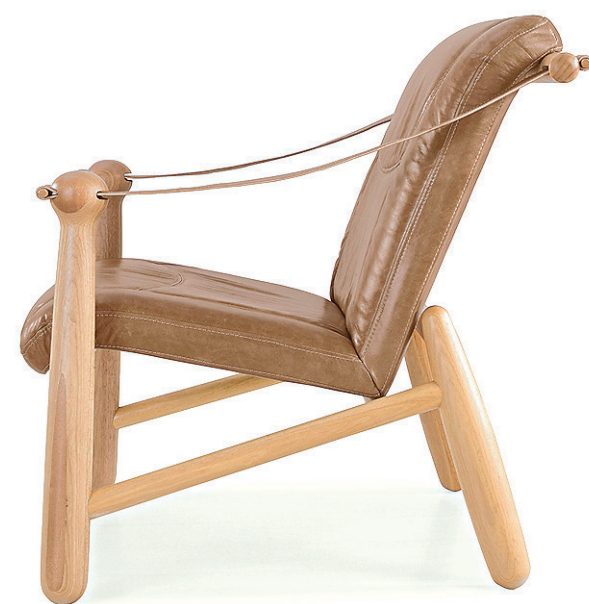
Poltrona Pilão por Bruno Fauz