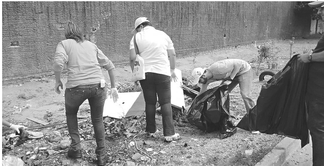
// Secretaria Municipal de Saúde (SMS) tem insentivado as ações de combate ao mosquito