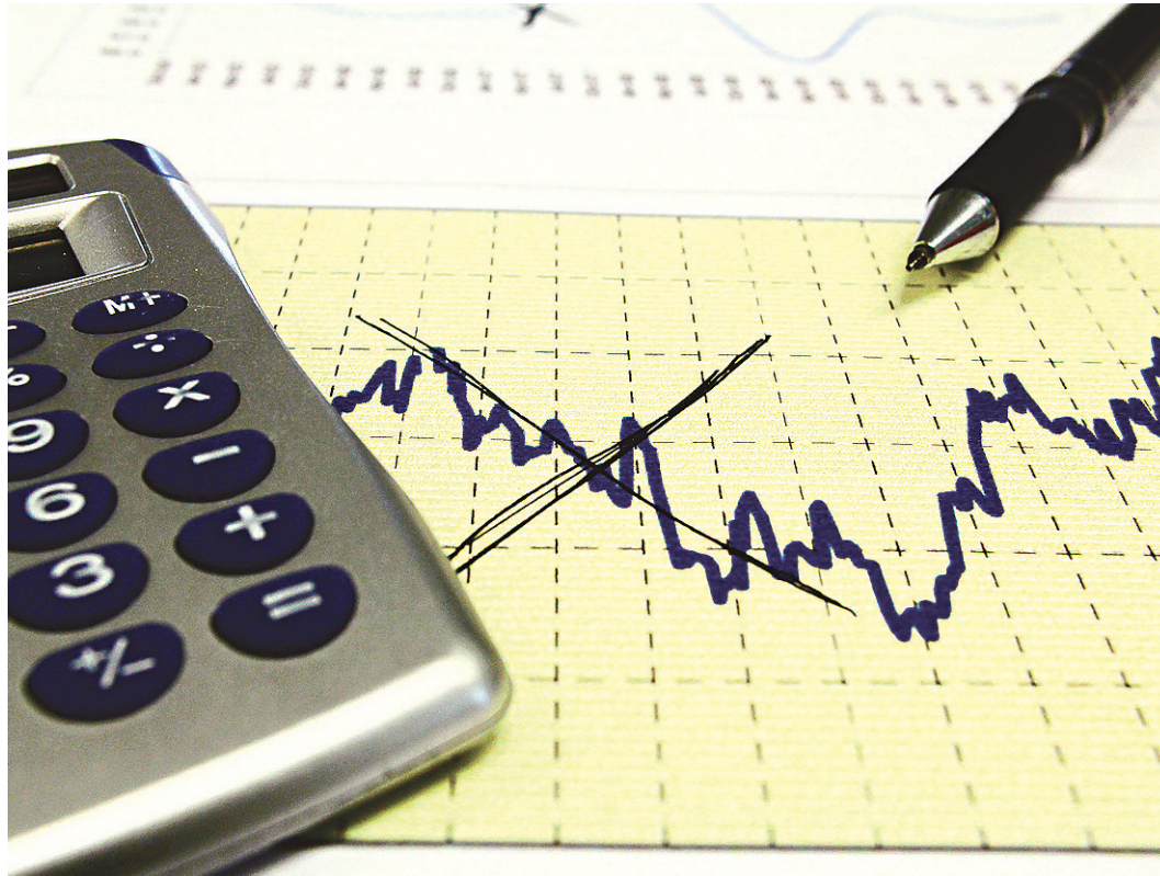
// Estimativas do BC se baseiam nas instituições financeiras que preveem inflação de 5,8% em 2017

A projeção para a cotação do dólar subiu de R$ 4,30 para R$ 4,35, ao final de 2016, e foi mantida em R$ 4,40, ao fim de 2017.