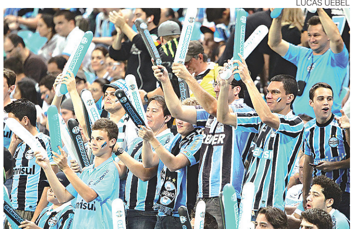
// Decisão não passou pelo Conselho Deliberativo do clube

O Grêmio, curiosamente, era um dos clubes que reclamava da divisão de cotas da emissora. Dizia-se prejudicado e pedia revisão. Mas optou pela melhor oferta. "A outra proposta não chegou ao que esperávamos", finalizou o presidente.