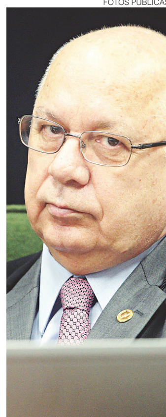
// Teori Zavascki: ministro do Supremo Tribunal Federal

Ao assumir o Ministério da Casa Civil, o ex-presidente passa a ter foro privilegiado e o processo contra ele sai