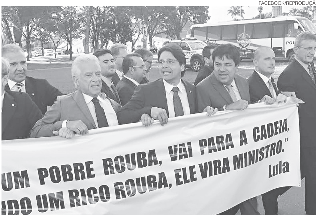
// Deputado Felipe Maia protestando contra Lula ministro, ontem, em frente ao Palácio do Planalto