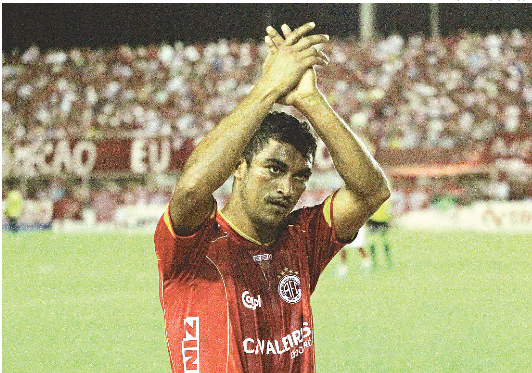
// Salário do atacante será bancado por um grupo de conselheiros rubros

mente na Segunda Divisão, ele foi negociado com o futebol da Coréia do Sul, onde permaneceu por duas temporadas. Lá, mudou suas características de jogo. De centroavante goleador, passou a atuar como se-