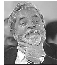
“Eu sou a única pessoa que poderia incendiar esse país. - Eu não quero fazer como Nero”

Os organizadores do “Ato em defesa da Democracia dos Direitos Sociais e Contra o Golpe”, programado para a tarde de hoje, resolveram ocupar um dos principais