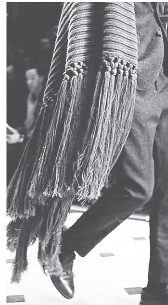
// E a Burberry já vem apostando aos poucos na pegada country das franjas e da cor camelo há tempos. Em 2014 foi só o que deu na passarela

e Y-3 apostaram, mas sobretudo a Burberry roubou a cena e começou a orientar muitas outras redes, inclusive as fast-fashion. A marca conhecida por seu icônico padrão xadrez também destacou o verde esmeralda. O desfile foi uma joia.