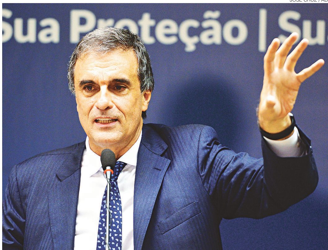
// José Eduardo Cardozo, ministro-chefe da Advocacia-Geral da União: ausência de imparcialidade objetiva

De acordo ele, "não existe" na ação popular a demonstração de uma lesividade e também "em hipótese nenhuma" o desvio de poder ou finalidade.