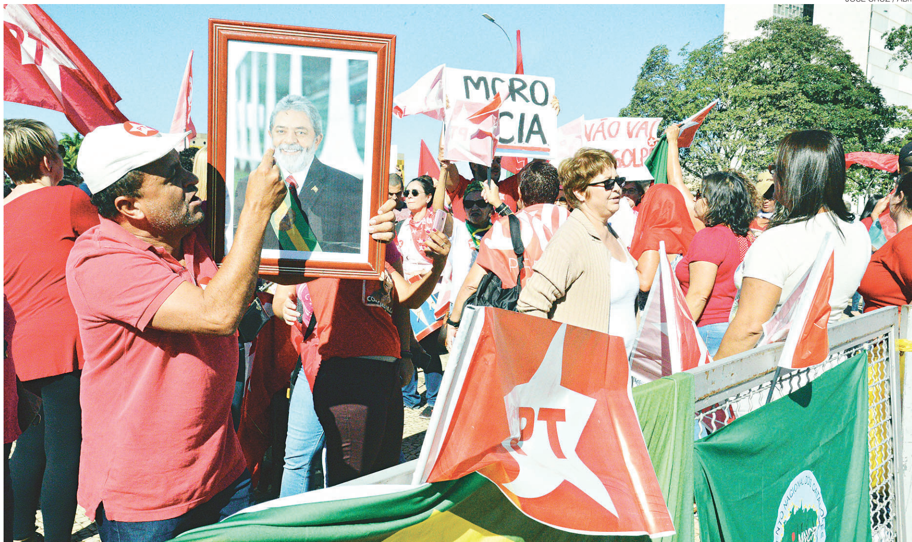
// Ato, semelhante ao que vem acontecendo em outras cidades, está marcado para iniciar às 15h no cruzamento das avenidas Bernardo Vieira e Salgado Filho, no Tirol