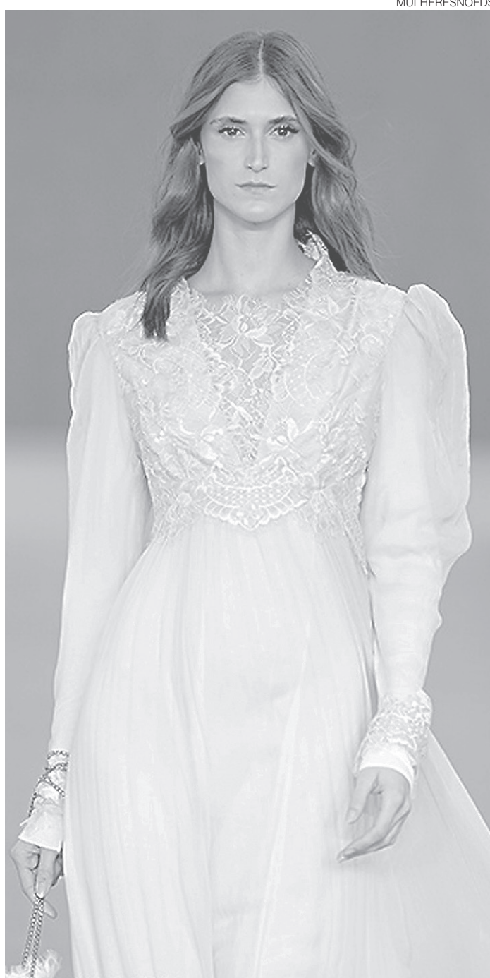
// Desfile Vivaz no Minas Trend Inverno 2016