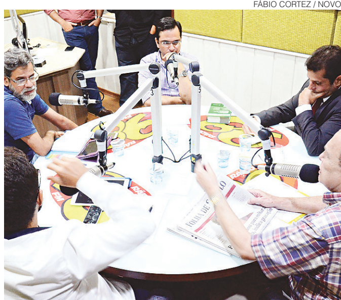
// Convidados discutiram questões jurídicas no Repórter 98