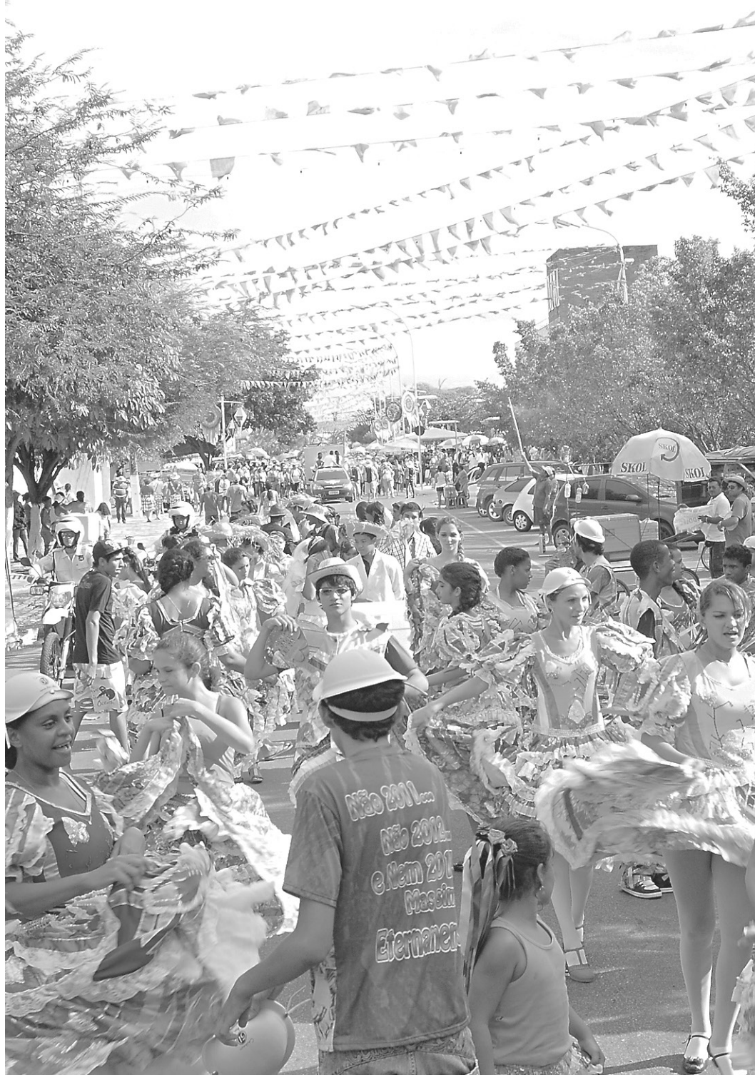
// Maior evento junino do estado, o 'Mossoró Cidade Junina' tinha contratos fraudados, segundo o MPRN

O modus operandi da organização criminosa consistia na fraude ao processo licitatório, em consórcio com