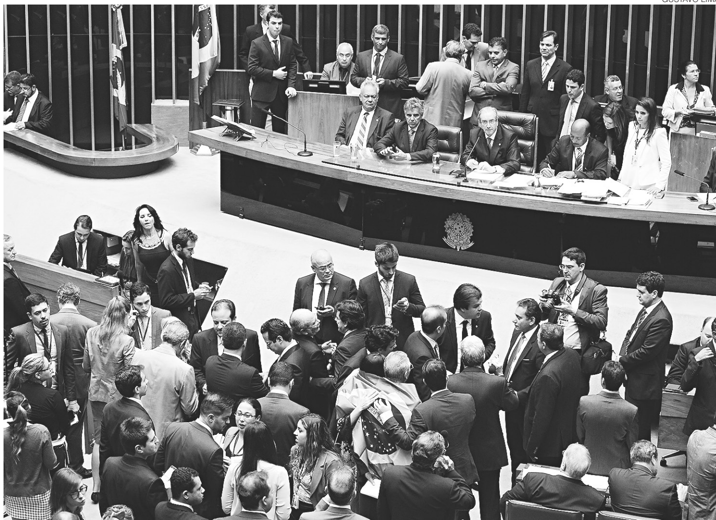
// Câmara dos Deputados formaliza a criação da comissão que irá analisar o processo de impeachment da presidente da Dilma