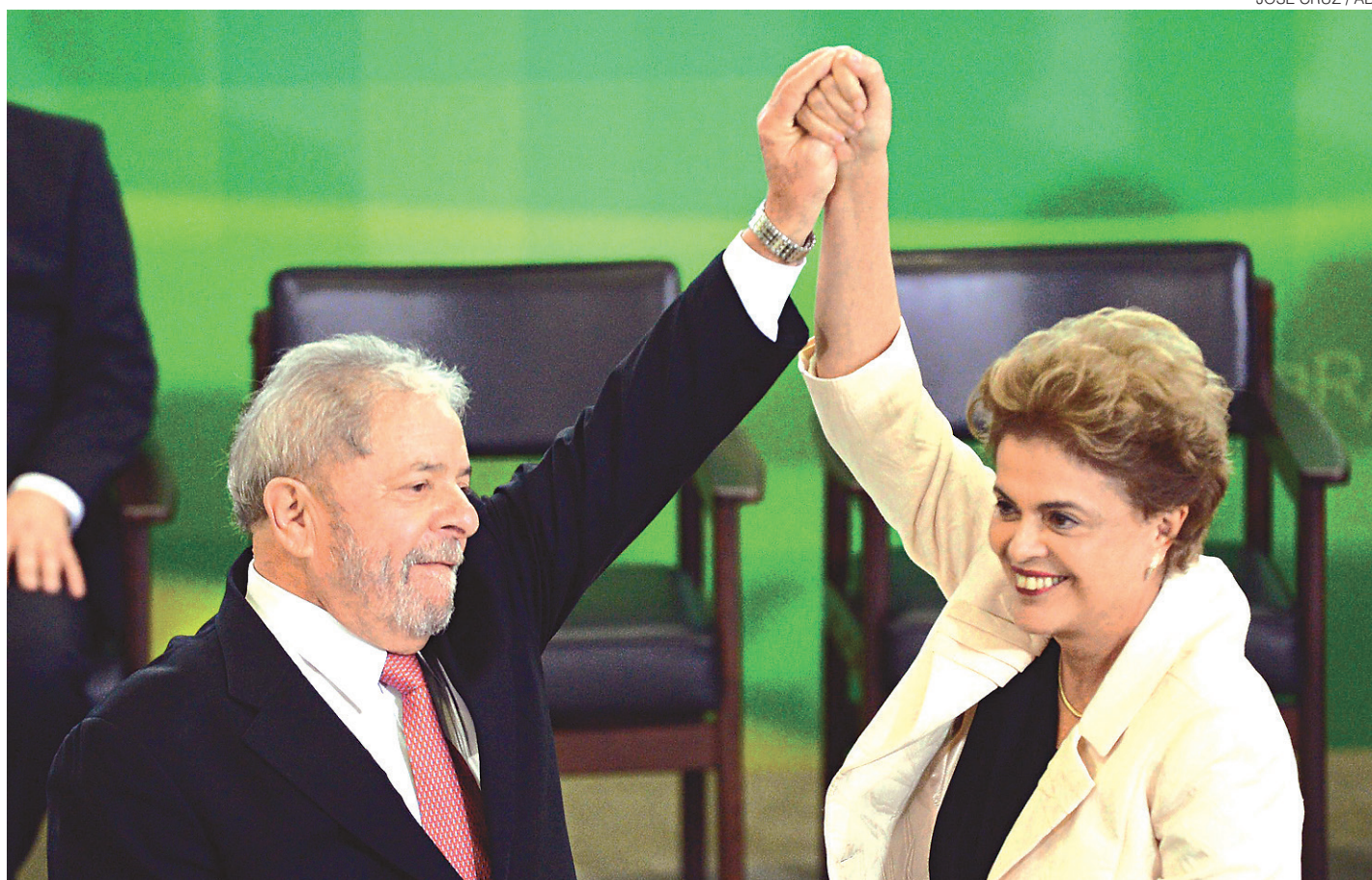
// Dilma Rousseff sobre Lula, durante a posse: "Tem a grandeza dos estadistas e a humildade dos verdadeiros líderes"

Não há justiça quando as próprias garantias da Presidência da República são violadas. O Brasil não pode se tornar submisso a uma conjuração que invade garantias constitucionais da Presidência da República, não por que a presidente seja diferente de outros cidadãos. Mas se se fere essas prerrogativas, o que farão com as prerrogativas do cidadão? A justiça e o combate à corrupção sempre são mais fortes e dignos quando respeitam os princípios constitucionais. A justiça será tão mais forte e digna de respeito quanto mais seus agentes agirem com retidão e qualificarem suas decisões com imparcialidade. A justiça deve estar centrada na produção de provas, sem ceder sua natural preponderância por outros instrumentos.