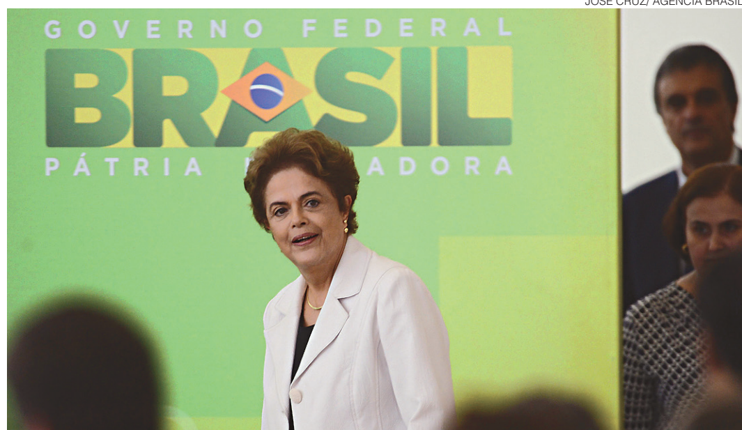
// Dilma Rousseff, presidente: acusada de atuar para interferir na Lava Jato por meio do Judiciário