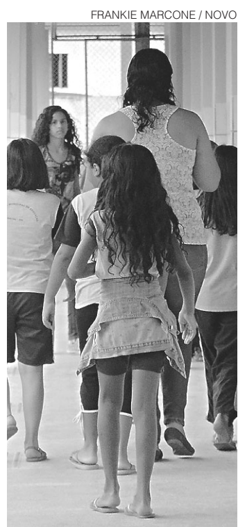
// Reposição das aulas: ponto de divergência entre SME e Sinte