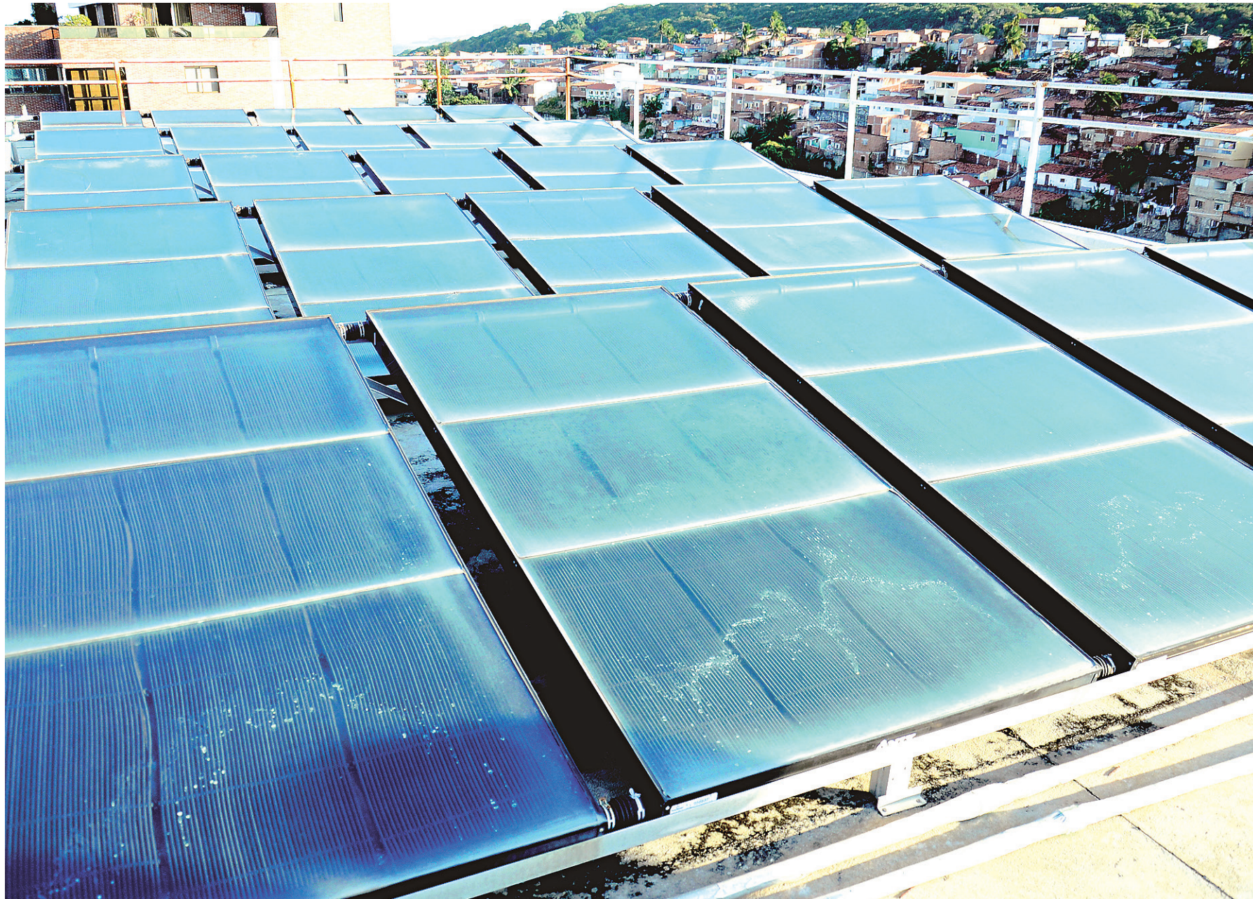
// Em Natal, empresas já instalam placas fotovoltaicas para geração de energia solar em condomínios, residência e empresas

Também foi autorizado pela Aneel que o consumidor gere energia em um local diferente do consumo. Por exemplo, a energia pode ser gerada em uma casa de campo e consumida em um apartamento na cidade, desde que as pro-