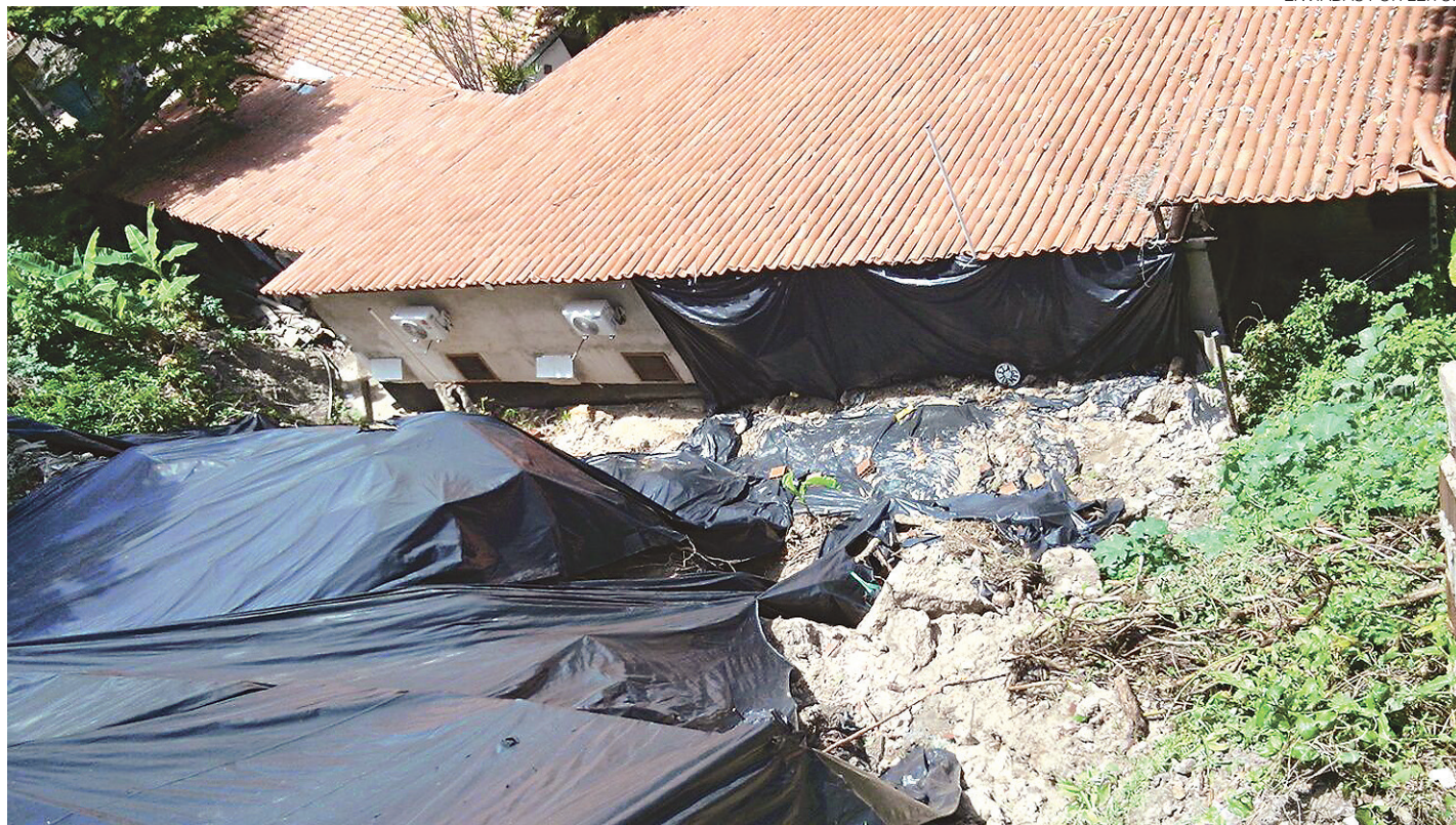
// A área de encosta com risco de desmoronamento está quase à beira mar em uma região conhecida por Morro do Mirante

O desenvolvimento da Praia de Pipa é muito recente e tem ocorrido de forma muito rápida. Nas últimas décadas Pipa está sendo conhecida mundialmente por seu povo, pelas belezas naturais como a de suas praias, das águas límpidas e mornas, as enseadas e falésias. Esse crescimento e reconhecimento vêm sendo acompanhado pela ocupação do seu solo também e, conseqüentemente, pelo desmatamento da sua mata atlântica que está trazendo preocupação aos próximos moradores, já que o relevo local é acidentado com