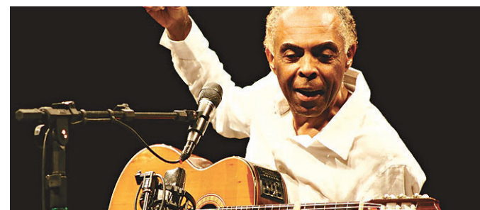
// Músico baiano está internado há 11 dias

O autor não nega seu sucesso mundial. Segundo ele, foram 185 milhões de livros vendidos. No total, estima que 600 milhões de pessoas o teriam lido no mundo, quase 10% da população do planeta.