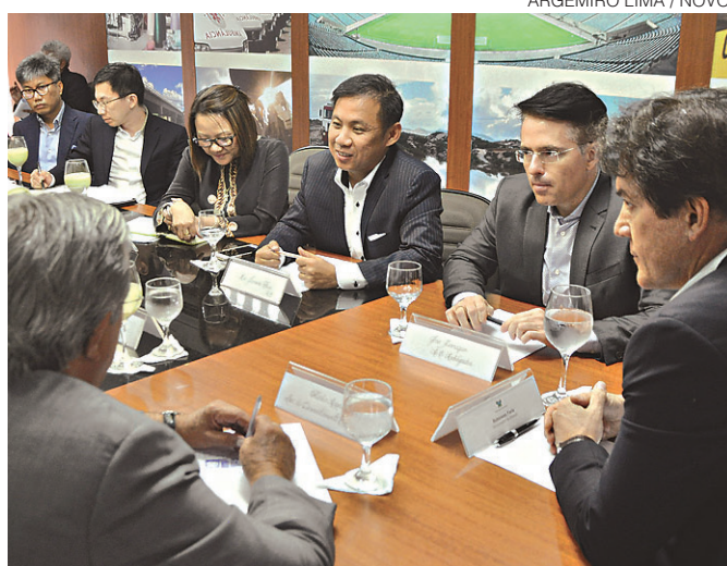
ARGEMIRO LIMA / NOVO

nos estão sendo desmatados sem que o município tome as providências. Várias construções ilegais, dizem eles, contribuem para aumentar os riscos de acidentes, o que pode resultar em prejuízos para a atividade turística. Cidades #10