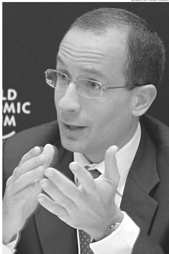
// Marcelo Odebrecht, empresário: 19 anos e quatro meses de prisão

O magistrado lembra ainda que as propinas envolviam não só a Odebrecht, mas também a Braskem, empresa pertencente ao grupo, o que “remete à responsabilidade pelos fatos de executivo com controle não só sobre a primeira, a Construtora Norberto Odebrecht, mas também sobre a segunda, a Braskem, ou seja, ao Presidente da Holding”, aponta o juiz em referência a Marcelo Odebrecht.