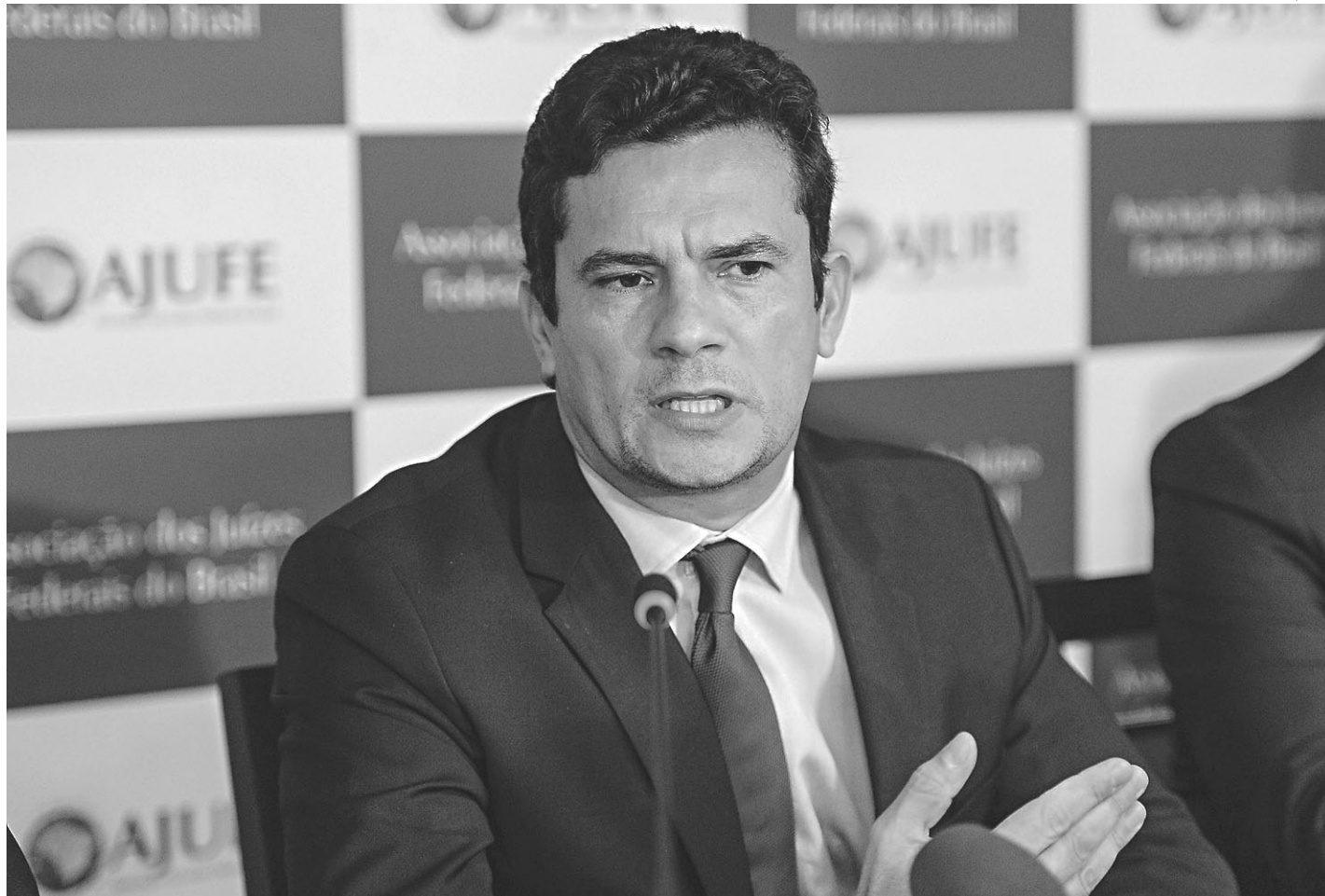
// Sérgio Moro, juiz federal da Operação Lava Jato, citou crimes de corrupção, de lavagem e de associação criminosa

Chamou a atenção do magistrado não apenas os altos valores dos contratos suspeitos com a Petrobras, todos acima de R$ 1 bilhão, como ainda o complexo sistema de engenharia financeira rastreado por autoridades brasileiras e suíças, com o apoio de delatores que admitiram contas não