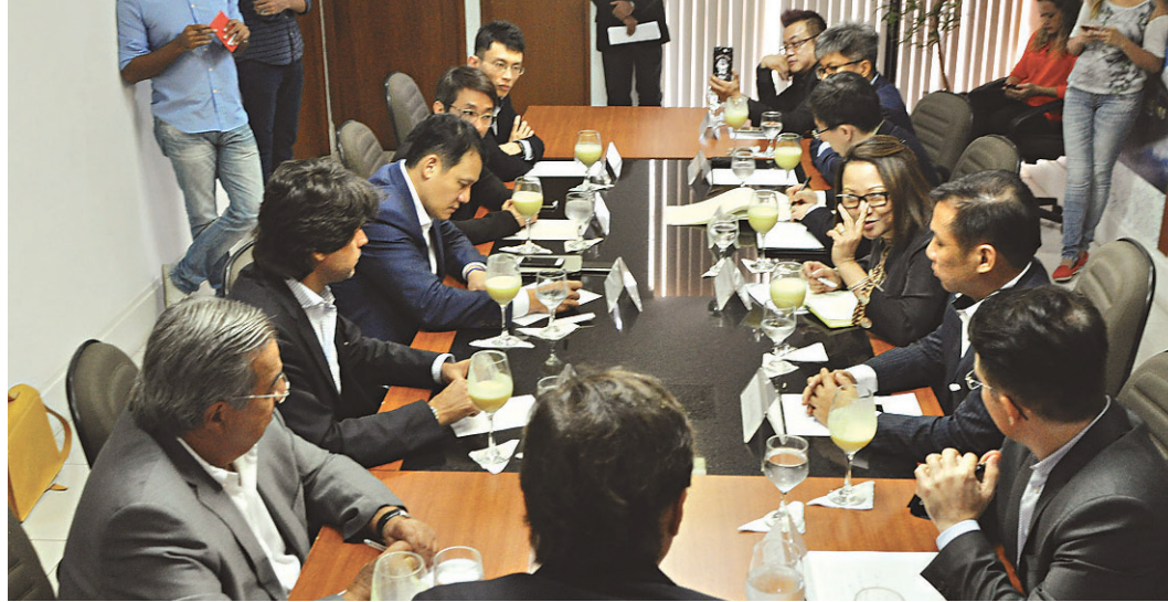
// Investidores do grupo Ritz-G5 apresentaram 11 projetos de condomínios ao governador Robinson Faria

Os investidores ouviram do governador informações a respeito de incentivos esta-