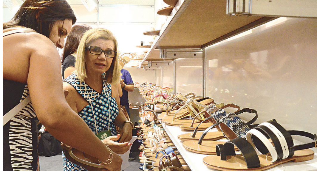
// A '40 Graus - Feira de Calçados e Acessórios' termina hoje no Centro de Convenções da Via Costeira

filial em Sergipe e expandiu a produção e distribuição para capitais e cidades interioranas do Nordeste. "Detectamos que a região tem crescido mais que outras partes do país e consumindo em um número maior também. Temos obtido ótimos resultados com nossos investimentos", garantiu Edivaldo Rocha.