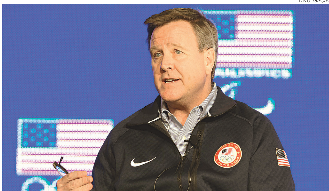
// Scott Blackmun, chefe-executivo do comitê olímpico norte-americano

Blackmun explicou que os dirigentes norte-americanos estão cientes dos perigos do vírus e acompanhando o desenvolvimento do assunto para determinar quais medidas tomar. Entre elas, o país trará médicos voluntários para proteger a delegação de doenças infecciosas durante a estadia no Rio. No entanto, o dirigente fez questão de explicar que o papel dos Estados Unidos neste caso é