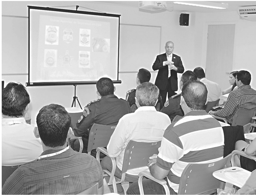
// Curso de Prevenção à Fraude de Documentos de Viagem, Detecção de Impostores na Escola de Governo

Geralmente, os documentos mais fraudados são comprovante de renda, contra