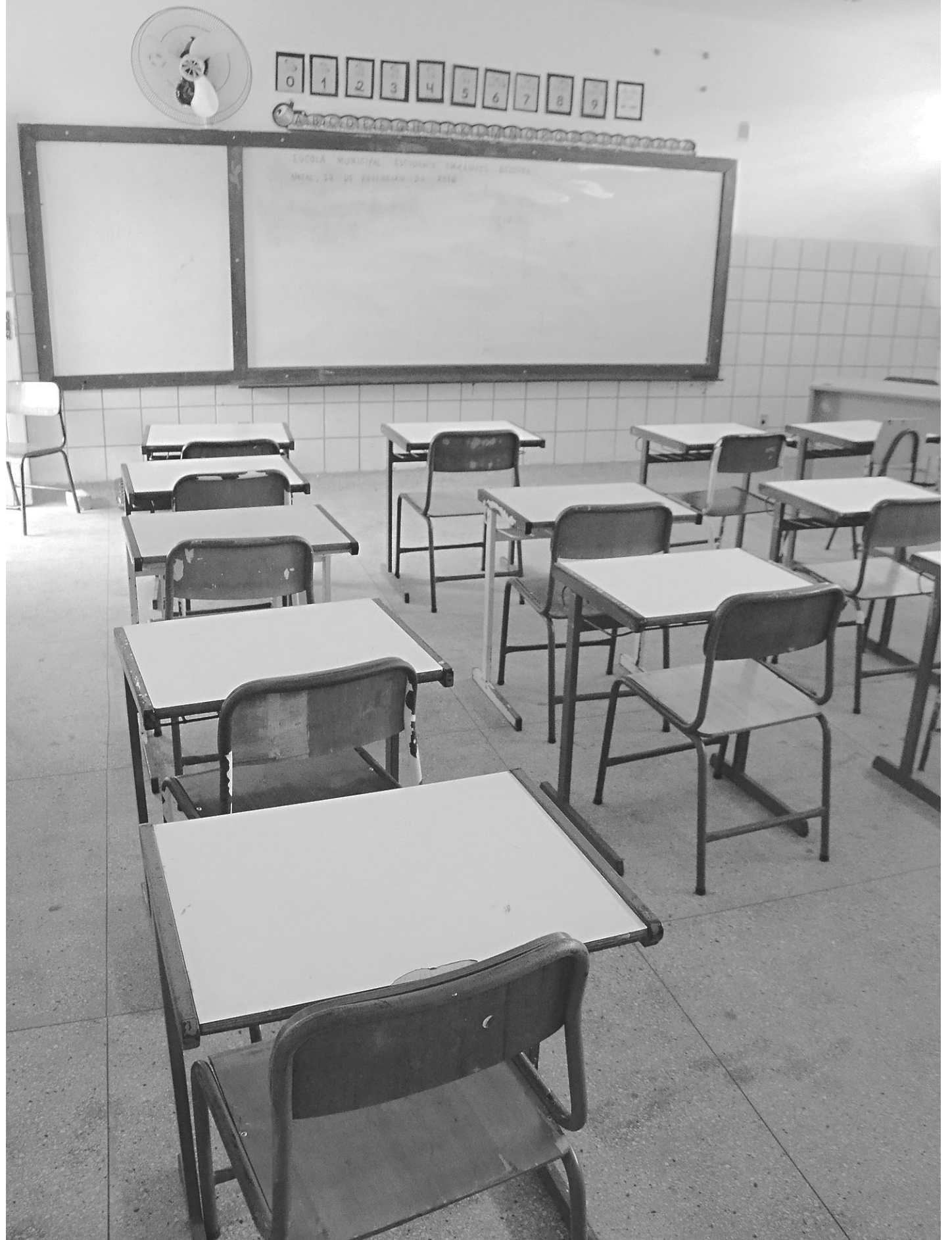
// Greve completa 17 dias e, de acordo com a Secretaria de Educação, 79 instituições de ensino sofrem com paralisações total ou parcial

Segundo assessoria da SME, os benefícios começam