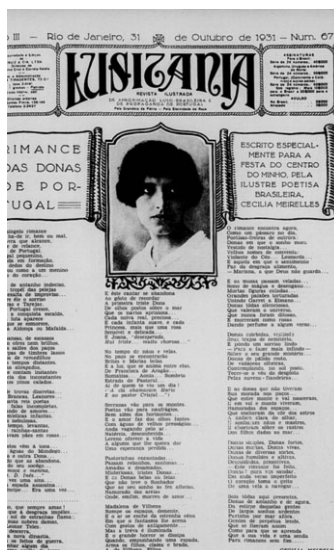
// Reprodução da revista Lusitânia, de 1931