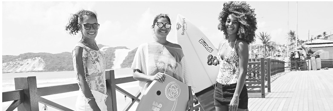
// Grupo planeja campeonato de surfe e bodyboard voltado apenas para as mulheres