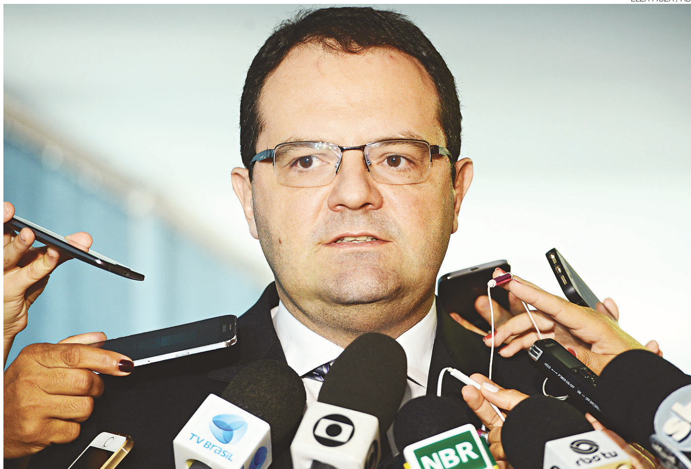
// Ministro da Fazenda Nelson Barbosa disse que correção do IR será compensada por elevação na receita

Segundo o ministro, os países mais desenvolvidos têm tributação sobre herança e doações. Para ele, as novas