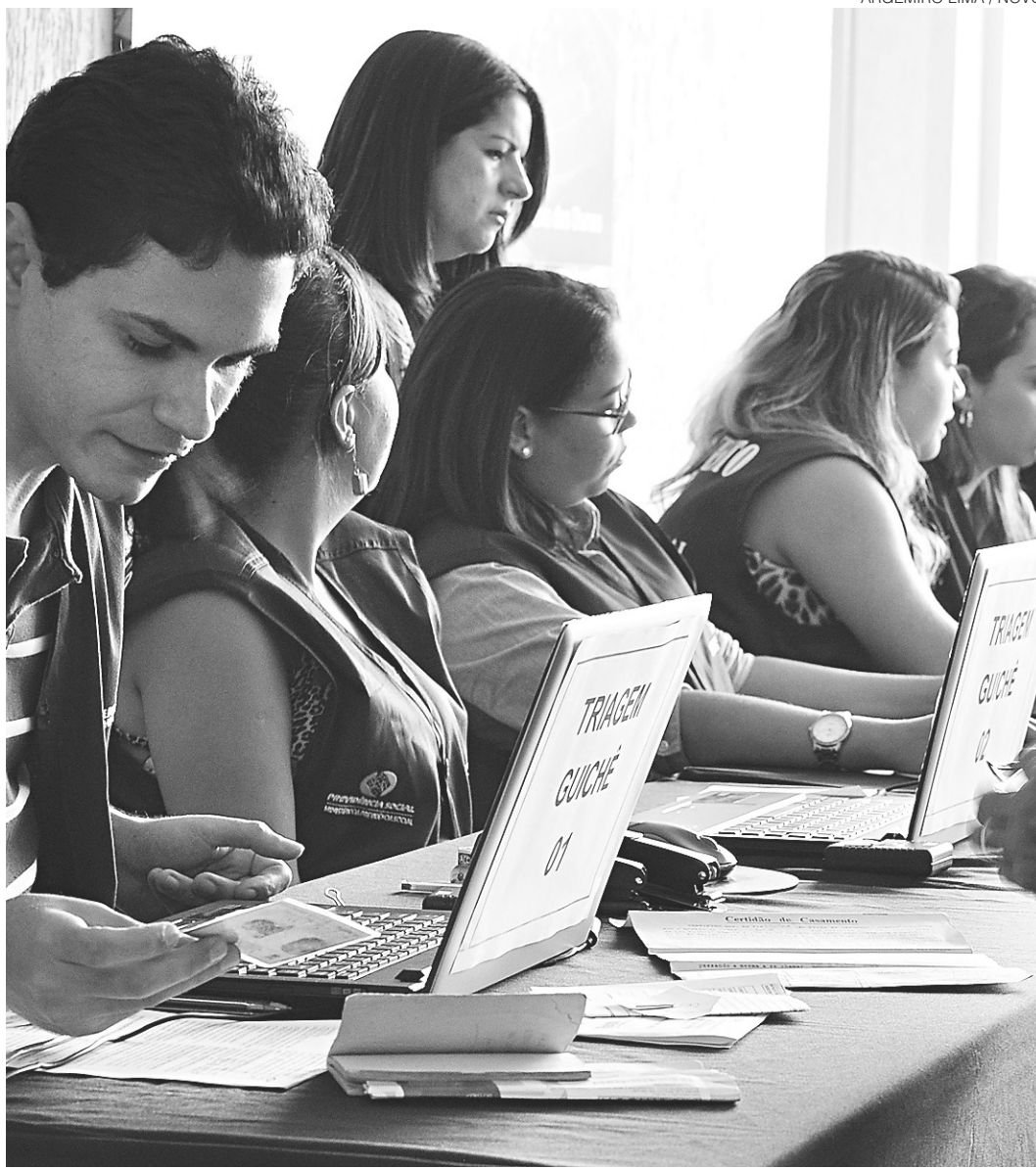
// Comparecer ao censo é condição fundamental para continuar recebendo salários no Estado

Os quase 4,5 mil servidores tiveram seus salários bloqueados porque deveriam ter realizado o recadastramento no período de 26 de outubro de 2015 a 11 de março último, conforme prevê o Decreto Nº 25.518, que regulamentou a