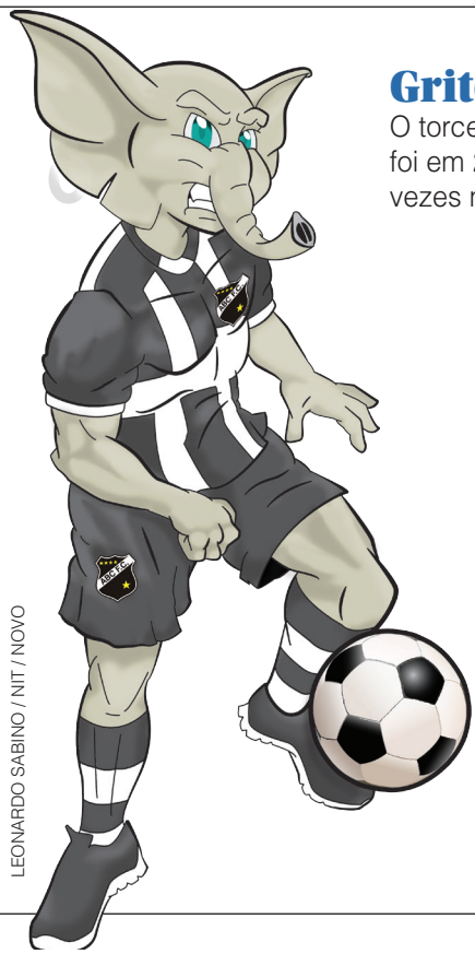
LEONARDO SABINO / NIT / NOVO