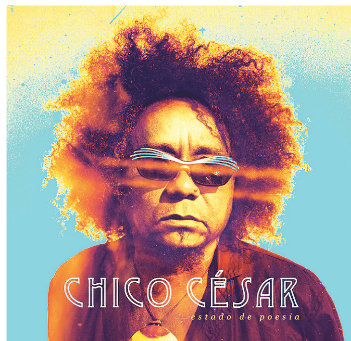
// O disco “Estado de Poesia”, primeiro de inéditas em oito anos

Com a banda paraibana, o cantor e compositor pré produziu o disco ainda em João Pessoa, e depois levou “todo mundo” para gravar as sessões em São Paulo, misturando em um mesmo registro samba, forró, frevo, toada e reggae.