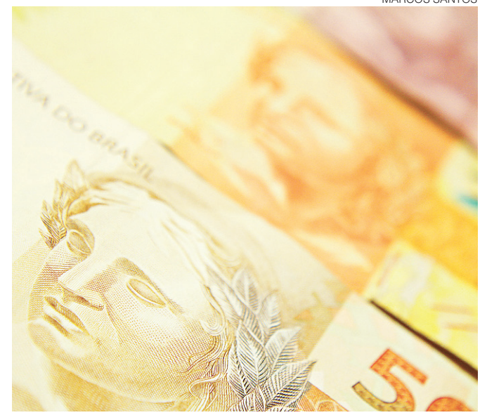
// Expectativa para tributação de doações é de R$ 494 milhões

1969, com atendimento em consultório, numa casa situada em uma das principais avenidas da cidade naquela época. Em 1971 a unidade foi transferida para Avenida Afonso Pena, atendendo em consultório e iniciando Pronto Socorro e internamento pediátrico, com apenas 06 (seis) leitos. Onze anos depois foi concluída a construção do hospital após a aquisição em um terreno vizinho. Até 1986 foi mantido um Plano de Saúde, dirigido a crianças, denominado Plano de Assistência Permanente a Infância. Ao longo dos anos, o atendimento foi ampliado e passou a ter capacidade para atender a todos os tipos de procedimentos, com exceção de cirurgias cardíacas.