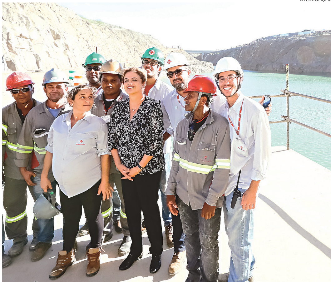
// Segundo Dilma, “um governo deve ser julgado sempre pelas escolhas que fez”

Em mais uma tentativa de trazer a opinião pública para o seu lado, a presidente aproveitou discurso em uma pequena cidade do interior de Pernambuco para reafirmar que o impeachment é golpe e ressaltar seus programas sociais. “Esse golpe tem um motivo. E o motivo é que o Brasil nesses 13 anos mudou: as pessoas ganharam autoestima e dignidade”, falou, dando ênfase ao Bolsa Família, às universidades federais, às as-