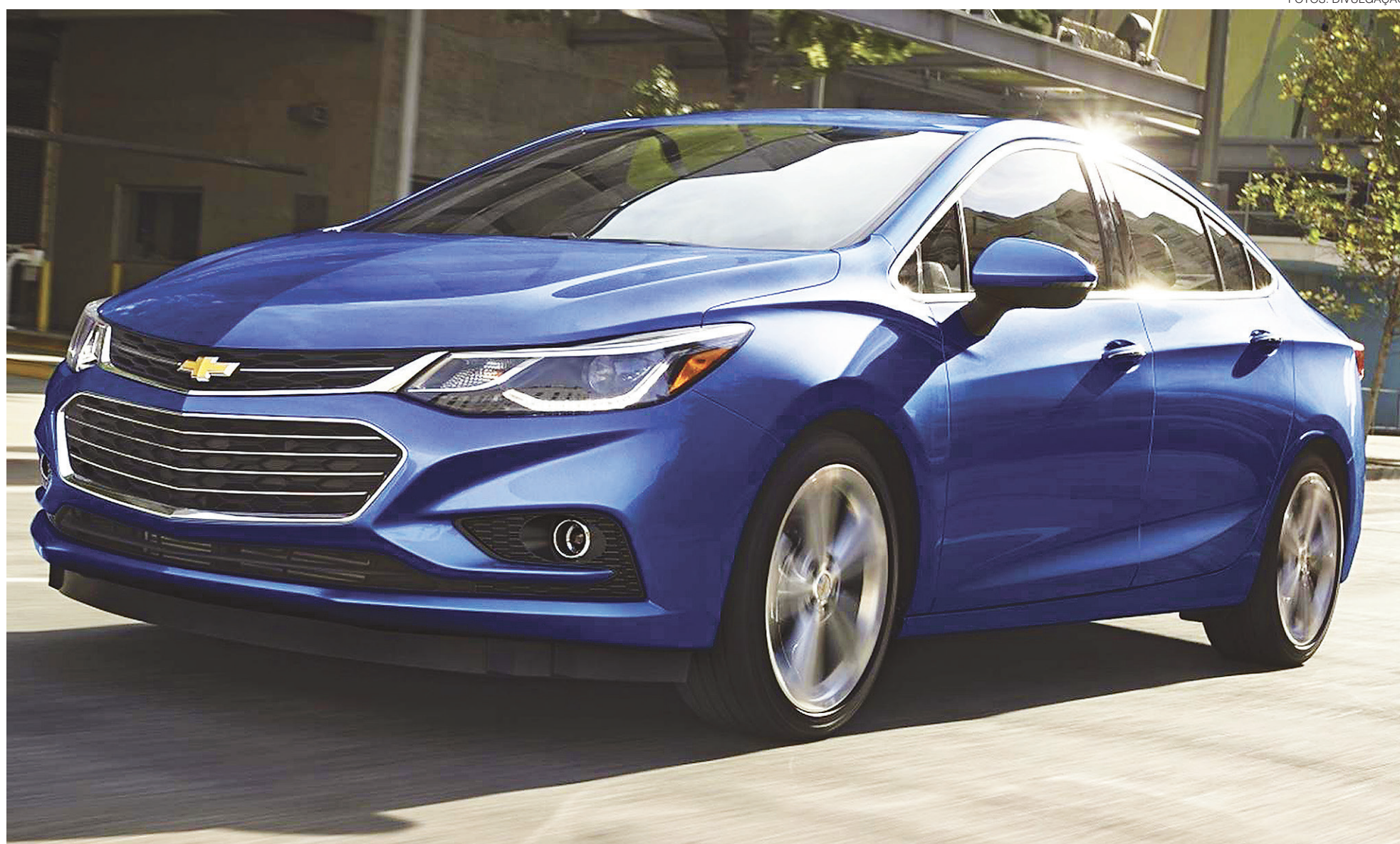
// O novo Cruze cumpre bem o papel de ser o porta-voz da nova GM: modelo terá motor com tecnologia flexível, conjunto de suspensão estável e imponente central multimídia