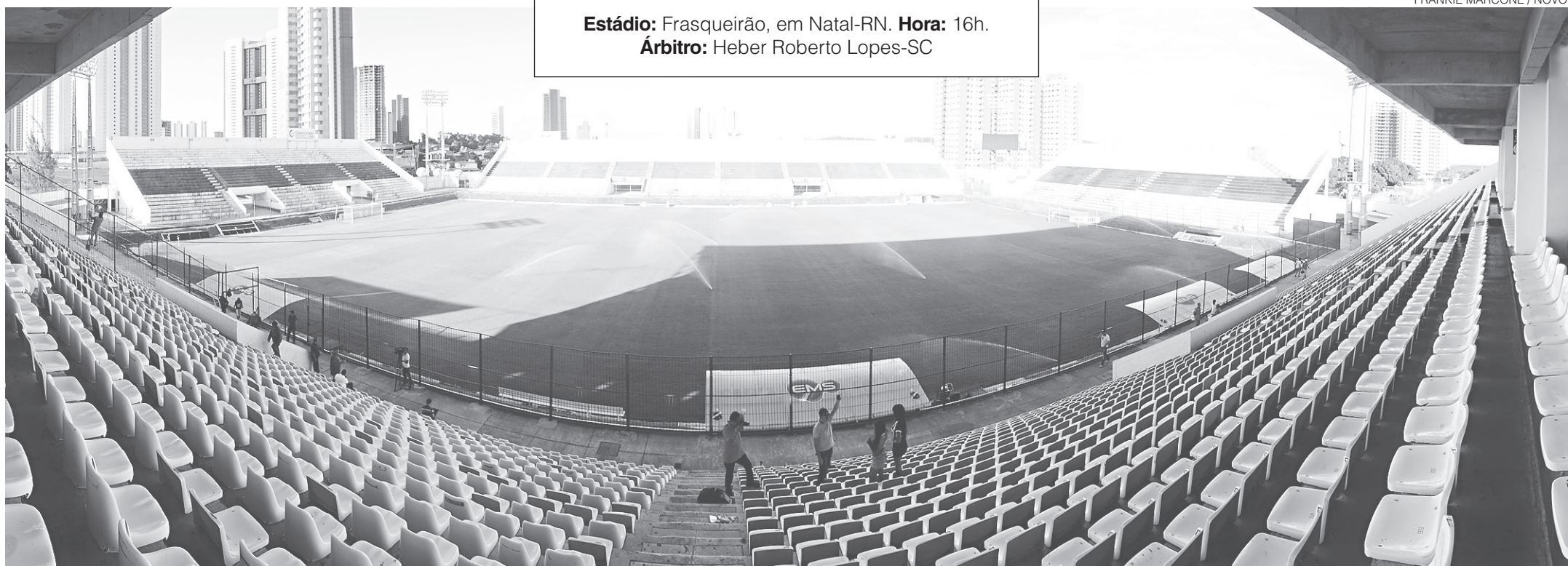
FRANKIE MARCONE / NOVO

Assim que o jogo acabar, o NOVO disponibilizará em todos os seus canais na internet o pôster digital do campeão. No domingo, um especial multimídia será disponibilizado no app "NOVO digital". Na terça, compre o NOVO e ganha um pôster colorido impresso.