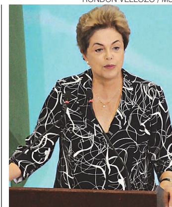
RONDON VELLOZO / MS

Dilma: "Não vou ficar debaixo do tapete"