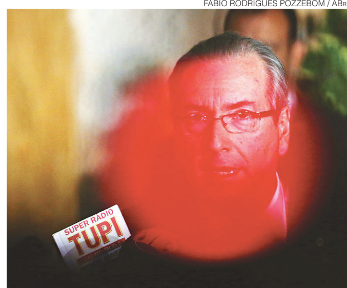
// Segundo analistas, Cunha sabe que não voltará mais ao cargo

Antonio Anastasia afirmou que esperava um debate acalorado. O relator disse que os impasses são naturais, mas avaliou que a base aliada extrapolou.