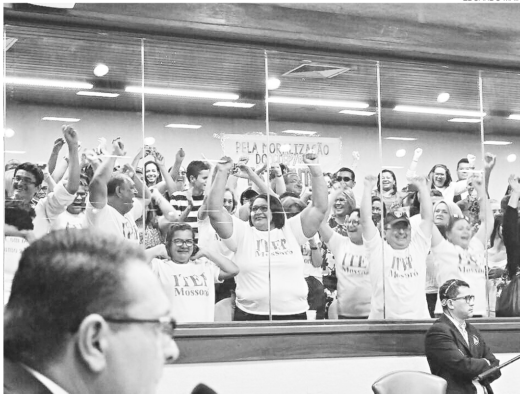
// Servidores do Itep esperavam há anos aprovação do projeto e celebraram conquista na Assembleia

"O estatuto é um poderoso instrumento de valorização do ITEP, que vem sendo debatido há três governos. Chegou ao Legislativo potiguar pelas mãos do governador em exercício, Fábio Dantas, que no governo Wilma presidiu o instituto e iniciou as discussões do estatuto. Respeitando o regimento interno, votamos em regime de urgência e agora a