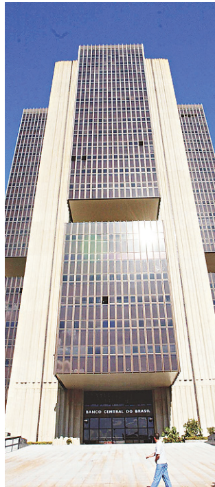
// Banco Central: dívidas