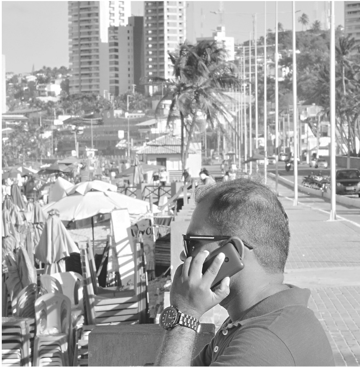
// Média de roubos de celulares, por exemplo, caiu de 25 para 3 na orla da zona Leste