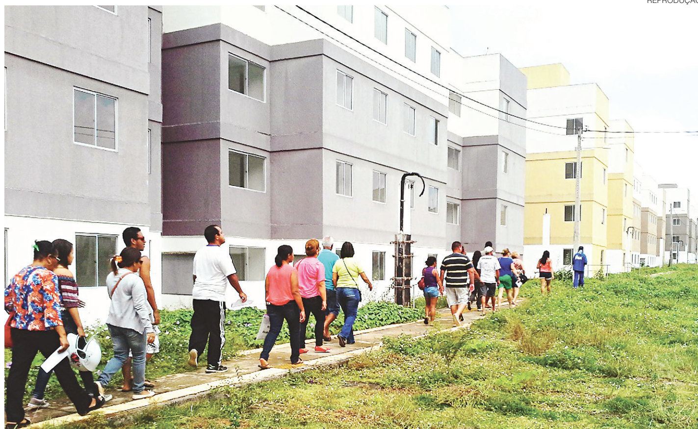
// Governo ficou de revisar a meta da presidente afastada Dilma Rousseff de contratar 2 milhões de moradias até 2018

Proposta das construtoras foi entregue aos ministros Henrique Meirelles, da Fazenda, e Bruno Araújo, das Cidades