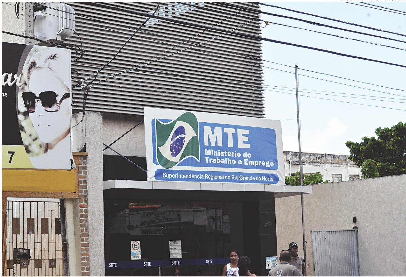
// Ministério do Trabalho e Emprego (MTE), sediado no Alecrim, Natal: local que recebe trabalhadores em busca do seguro-desemprego