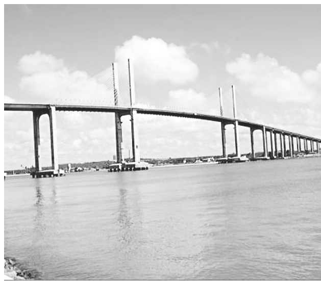
Lindo registro do nosso Rio Potengi e da ponte Newton Navarro, um dos pontos turísticos da grande Natal.