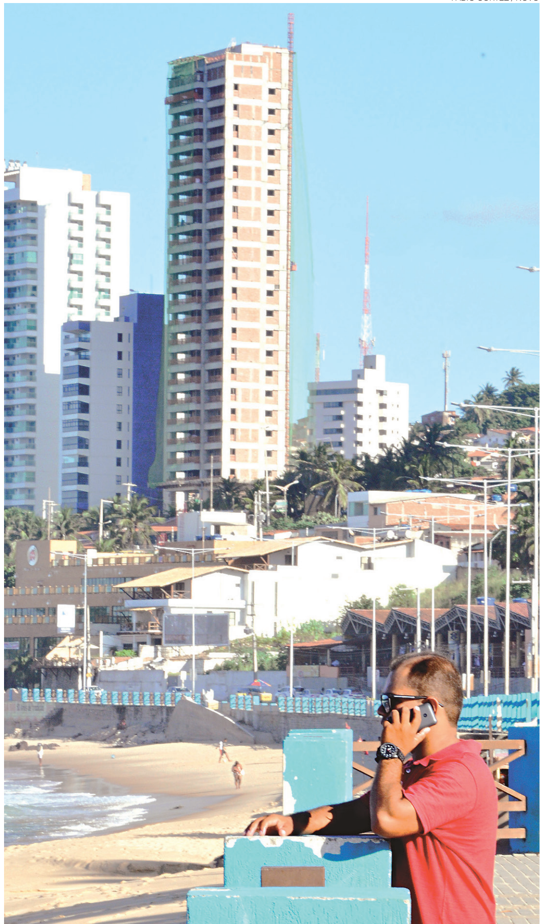
// Na orla da zona Leste, assaltos reduziram drasticamente em comparação a 2015