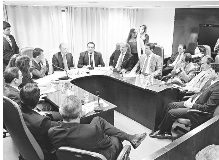
// Ideia da nova unidade foi apresentada em reunião na Assembleia

Outro ponto em discussão, que deverá ser alvo de apreciação pelos deputados na aprovação do projeto de Lei que vai reger a aplicação