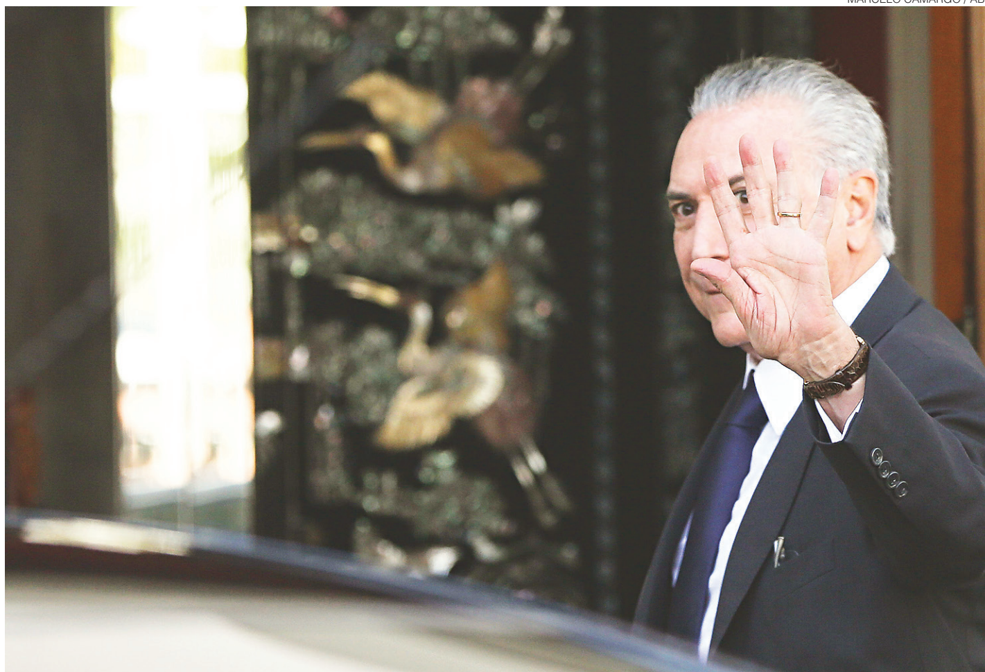
// Presidente em exercício Michel Temer se reuniu com base aliada para pedir mais defesa ao seu governo

O ministro da Secretaria de Governo evitou comentar os áudios gravados pelo ex-presidente da Transpetro Sérgio Machado e que provocaram a queda de dois ministros de Temer em menos de 20 dias de governo. "Ele foi presidente da Transpetro por 13 anos no governo deles (do PT), nomeado por eles", afirmou.