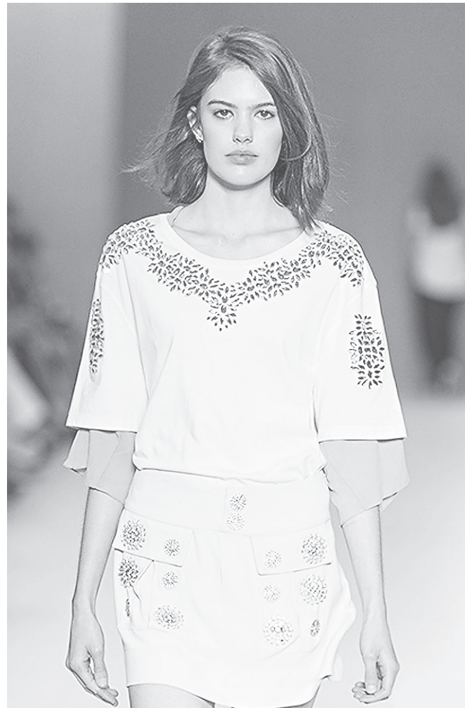
// Verão 2017 no desfile Viva por Vivaz no Minas Trend