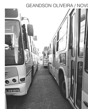
// Decisão pela greve foi praticamente unânime

Hoje, os motoristas recebem R$ 1.712,70 e os cobradores R$ 1.027,62. Os vales alimentação estão estipulados em R$ 230 e R$ 170 para motoristas e cobradores, respectivamente.