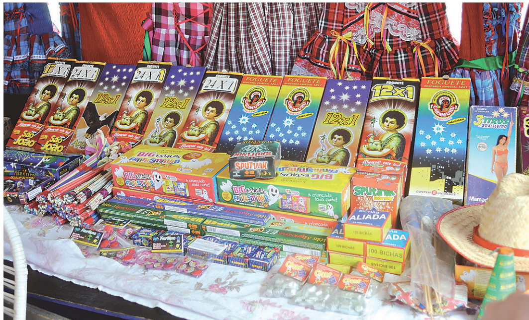
// Nas barracas espalhadas pelos canteiros centrais da capital, a maior venda é a de chumbinhos