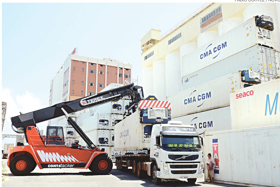
// Pelo terminal marítimo de Natal passaram 288,3 mil toneladas nos cinco primeiros meses deste ano