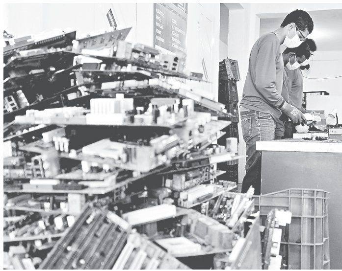
// Potiguares produzem 5 mil toneladas de lixo eletrônico por ano

Segundo Nunes, o Eco Point da Natal Reciclagem, que fica na Cidade da Esperança, foi aberto em janeiro desse ano e recebe em qualquer dia todos os tipos de material de descarte do lixo eletrônico. “Podem deixar aqui qualquer quantidade que recebemos. Há ainda um valor pago para o quilo de material”, diz.