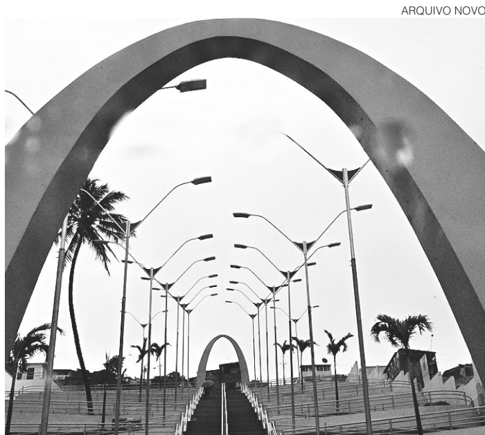
// Cratera deu lugar a escadaria, mas problema com esgoto ainda existe

Carros foram soterrados, a Via Costeira foi interditada, dois prédios evacuados, 30 casas desabaram desalojando 30 famílias. Ao todo, 78 famí-