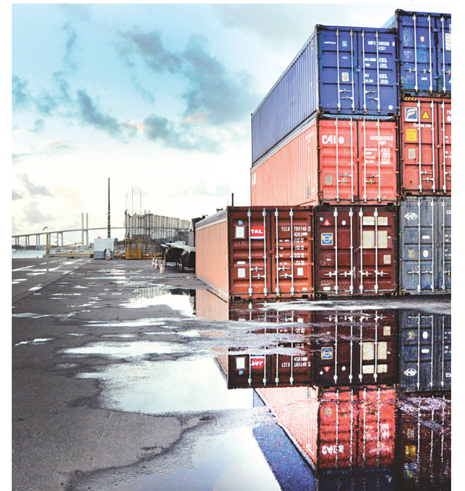
FÁBIO CORTEZ / NOVO

Exportações atingem volume de US$ 81,7 milhões comercializados no primeiro quadrimestre de 2016. As importações não tiveram desempenho igual e caíram 16,9%, movimentando US$ 41,9 milhões. O saldo da balança comercial potiguar encerrou os