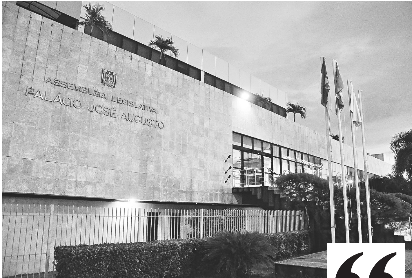
// Ato da mesa diretora deve oficializar exoneração dos envolvidos no caso hoje

Ele relatou que a Assembleia não tinha conhecimento sobre servidores que recebiam o benefício, tampouco se estavam ilegais porque, no ato da contratação, não se apura essas particularidades. "Tomamos conhecimento por meio do Ministério Público e imediatamente fomos verificar. Nem todos os citados são titulares do benefício,