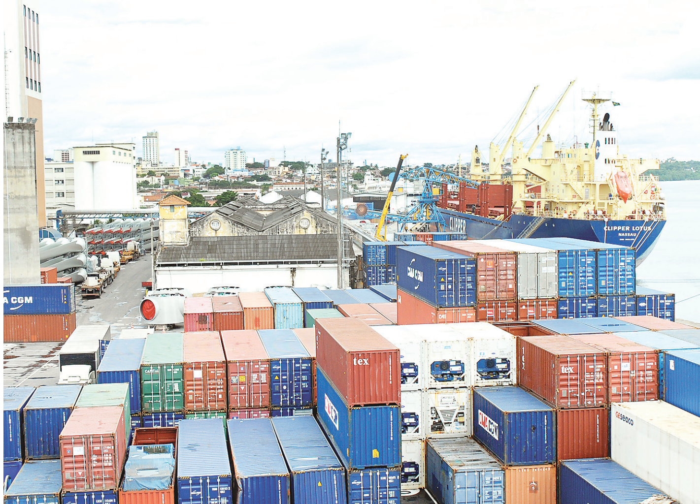
// Pauta de exportações do Rio Grande do Norte tem poucos produtos da indústria de transformação; maior parte tem baixo valor agregado

Apesar da retomada do crescimento, Alinne Dantas ainda ressalta que o es-