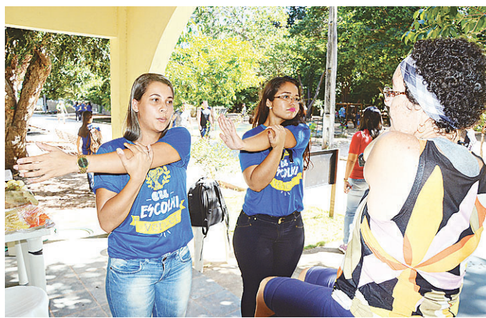
// Estudantes do quarto período do curso de fisioterapia da faculdade