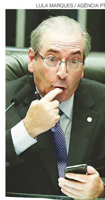
// Cunha pode ser condenado a devolver R$ 20 milhões

Cunha seja condenado a devolução de R$ 20 milhões, montante referente a valores movimentados em contas não declaradas no exterior, além da suspensão dos direitos políticos por dez anos. Se condenada, a mulher de Cunha deverá devolver o equivalente R$ 4,4 milhões por ter sido beneficiada por valores depositados em uma das contas. O pedido de abertura da ação de improbidade questão não foi decidida pelo juiz. A questão será decidida após manifestação da defesa de Cunha.