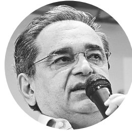
PDT/PMDB Álvaro Dias