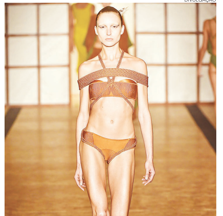
// SPFW: Lenny Niemeyer Verão 2017