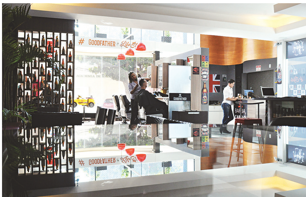
// Na Goodfather, os planos são oferecer também serviço de lavagem de motos

serviço prestado, aliada a um bom preço. O corte da barba custa R$ 40 e do cabelo, o mesmo preço. "E o cliente ganha um chope", assinala.