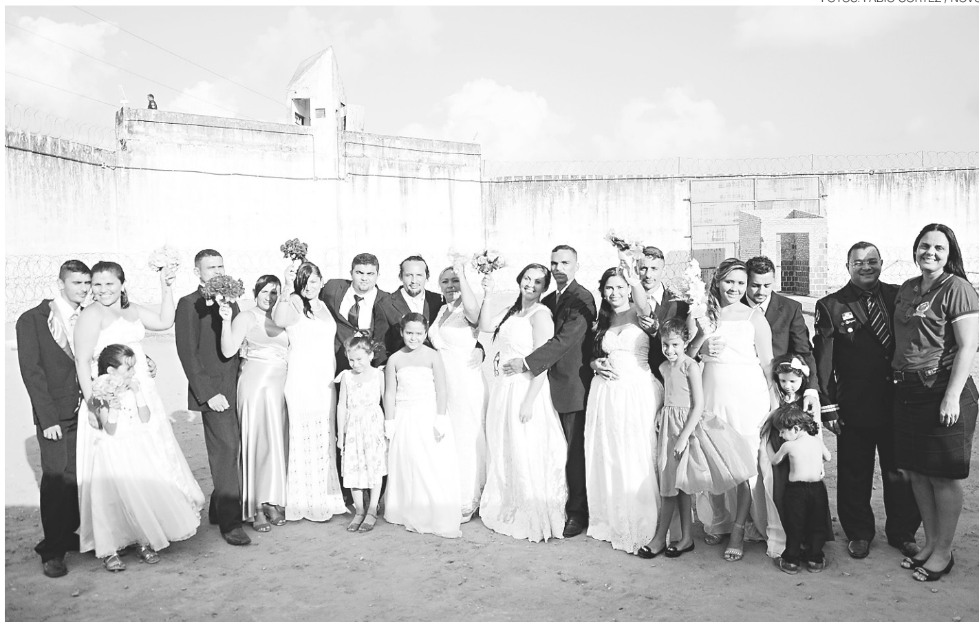
// Oito casais foram unidos pelo matrimônio em cerimônia coletiva realizada no pátio da Penitenciária Estadual de Alcaçuz