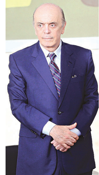
// Ministro das Relações Exteriores José Serra