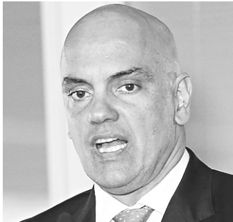
// Alexandre de Moraes, ministro da Justiça e Cidadania

dou com a ideia”, disse o ministro. “Porque não tem nenhum sentido a polícia apreender armamentos pesados, como uma .50, um fuzil AK-47 e não poder utilizá-los. Vocês imaginam o absurdo que é apreender armamentos pesados e ter que encaminhar este armamento para que o Exército o destrua”, criticou. Com a mudança da lei por decreto, o armamento apreendido poderá ser requisitado pela polícia, catalogado e utilizado no combate aos traficantes. Além da mudança na destinação das armas apreendidas, outro decreto vai facilitar a compra de armamentos pesados pelas polícias e também deve entrar em vigor este mês,