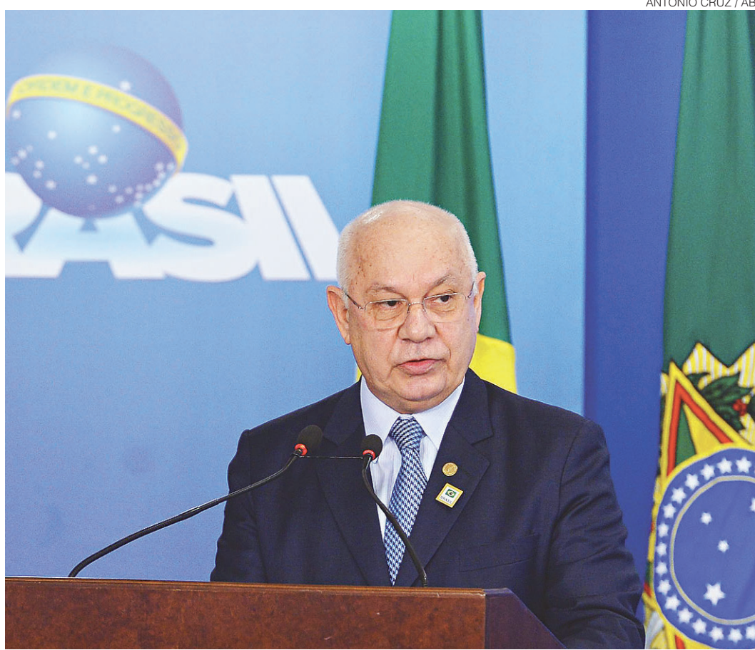
// Teori Zavascki, relator da Lava Jato no STF, autorizou diligências segunda-feira recente

No áudio gravado, e considerado inválido por Teori, Dilma promete entregar ao ex-presidente o termo de posse como ministro para que Lula usasse "em caso de necessidade". A conversa é vista por investigadores como indicativo de que a nomeação para o ministério tinha a intenção de conferir ao ex-presidente foro privilegiado e, por isso, evitar