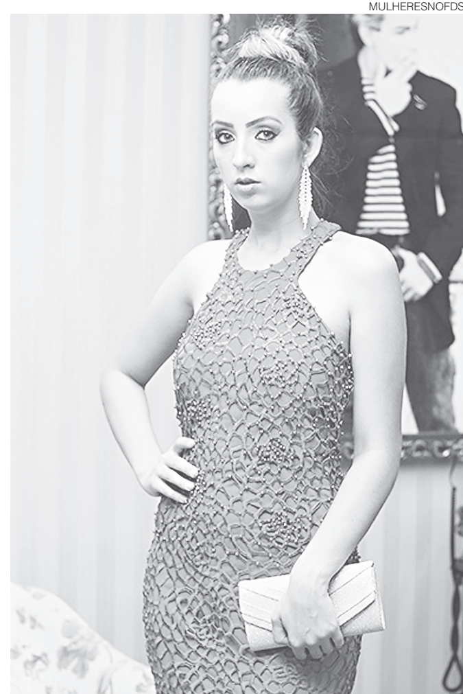
// Coleção Festas Tetê Modas

Foi aprovada nesta terça-feira (16) pela comissão mista do Senado a medida provisória que extinguiu 10.462 cargos comissionados no Poder Executivo. Destinados a funções de direção, chefia e assessoramento, eles são de livre nomeação e exoneração pelas autoridades responsáveis, sem a necessidade de concurso público. A MP 731/2016 também permite que o Executivo substitua esses cargos por funções de confiança privativas de servidores efetivos. Ela segue para a Câmara dos Deputados.