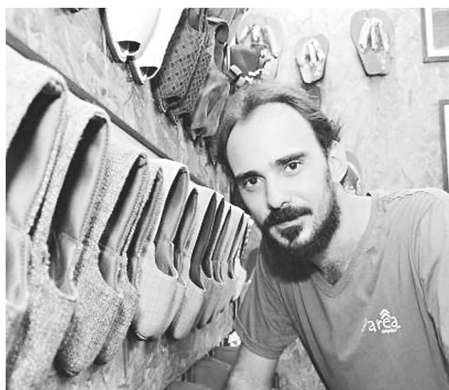
Um potiguar está entre os vencedores da quarta edição do Prêmio Sebrae Top 100 de Artesanato.