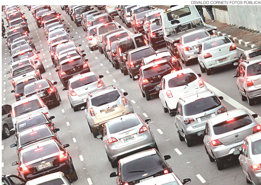
// Governo volta a discutir com setor automotivo retomada do programa de renovação da frota nacional