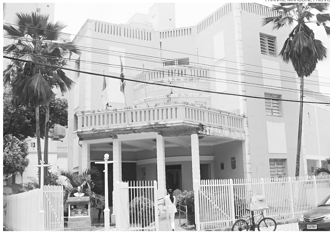
// Câmara Municipal de Natal teve pedidos de candidatura feitos por 579 pessoas