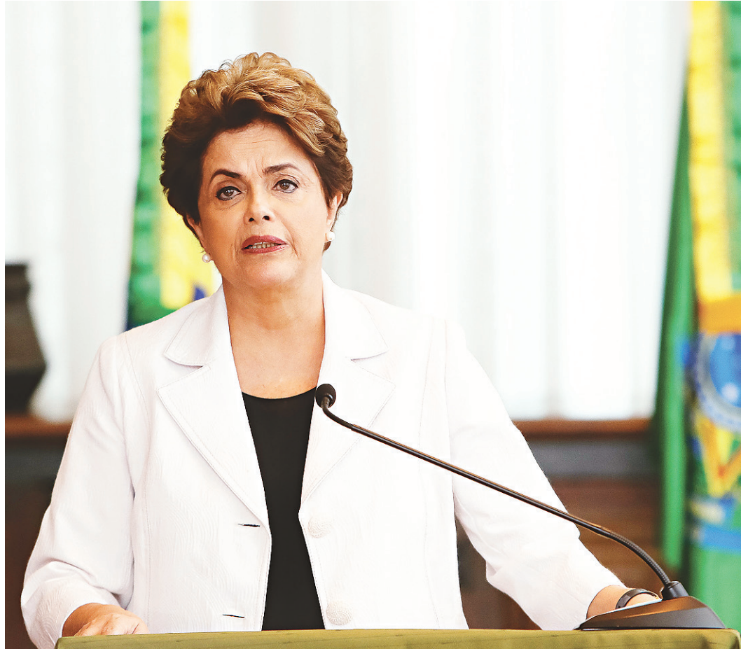
// Em carta aos senadores, Dilma Rosseff admite erros, pede para voltar e anuncia plebiscito sobre eleições

A presidente afastada afirmou ainda esperar que o Senado encerre o processo de impeachment "reconhecendo diante das provas irrefutáveis que não houve crime". "Sou inocente", afirmou. Dilma disse que seu afastamento definitivo "seria um inequívoco gol-