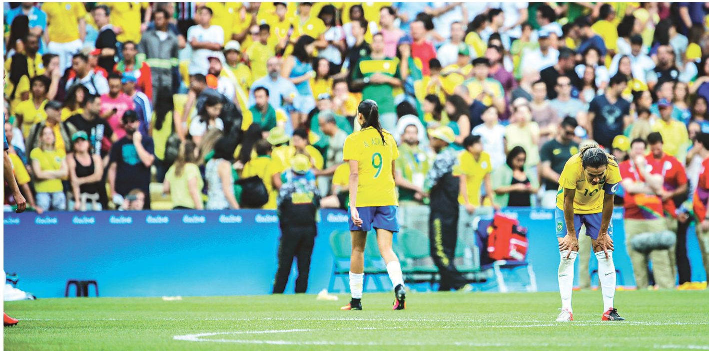
// Dez dias depois de golear a própria Suécia por 5 a 1, time feminino protagonizou um novo 'Maracanazo' do futebol brasileiro

Da fria Suécia veio a típica catimba sul-americana. Demora para bater tiro de metas, atrasos para cobranças de laterais e uma postura defensiva sem vergonha alguma de de-