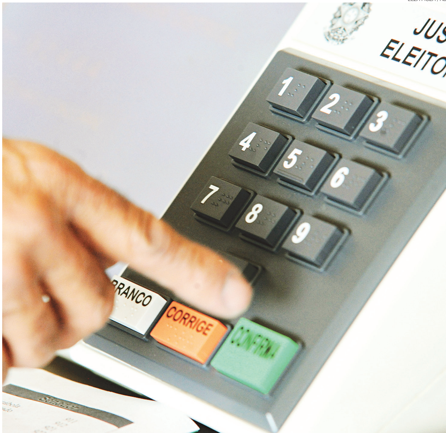
// Em 2000, o índice de abstenções nas eleições foi de 14,99% oscilou até 14,50% em 2012 e chegou ao maior percentual neste primeiro turno

"Quando as pessoas se abstêm, elas não precisam justificar. Se o TSE quiser avançar nessa questão deveria criar um pequeno formulário