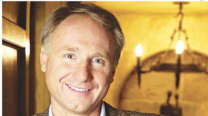
// Origin: novo livro do autor está previsto para setembro de 2017

Prometido para 26 de setembro de 2017, Origin dá sequência à série que já publicou, além de O Código Da Vinci, Anjos e Demônios, O Símbolo Perdido e Inferno. De acordo com a editora, o livro será escrito com os