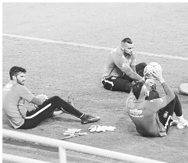
Treino da seleção brasileira na Arena das Dunas.