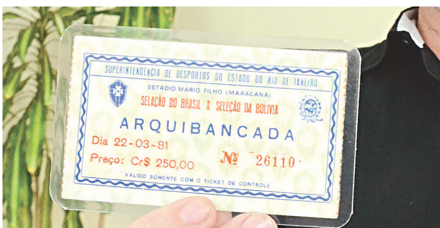
// Na coleção de Alexandre Gurgel, ingressos dos jogos do Brasil nas décadas passadas

Pressionada diante da Copa do Mundo na Rússia em 2018, a Fifa quer demonstrar que está agindo contra o racismo. Na semana passada, porém, o presidente da entidade, Gianni Infantino, decretou o fim de um grupo de trabalho que havia sido criado para lutar contra o racismo no futebol.