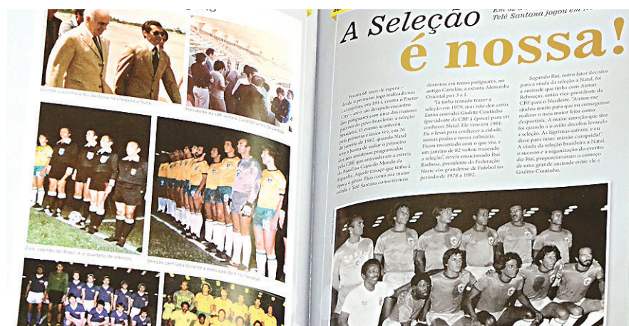
// Publicação de revista com reportagens sobre a passagem do Brasil por Natal