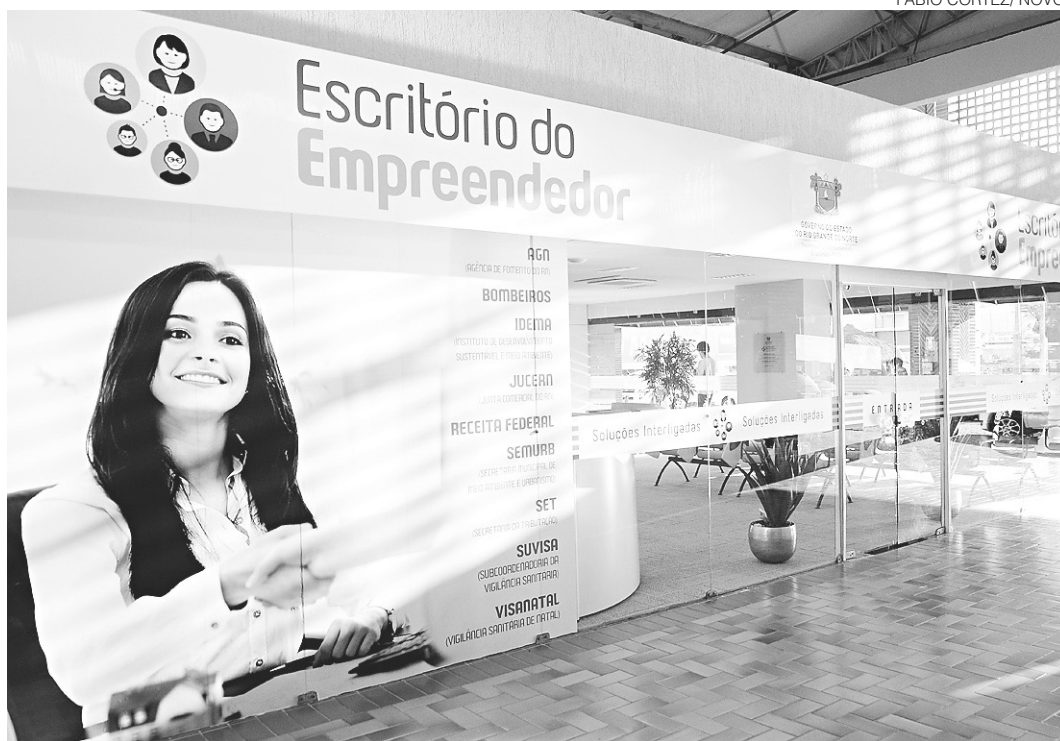
// Escritório do Empreendedor funcionará de segunda a sexta-feira de 11h às 19h no shopping Via Direta