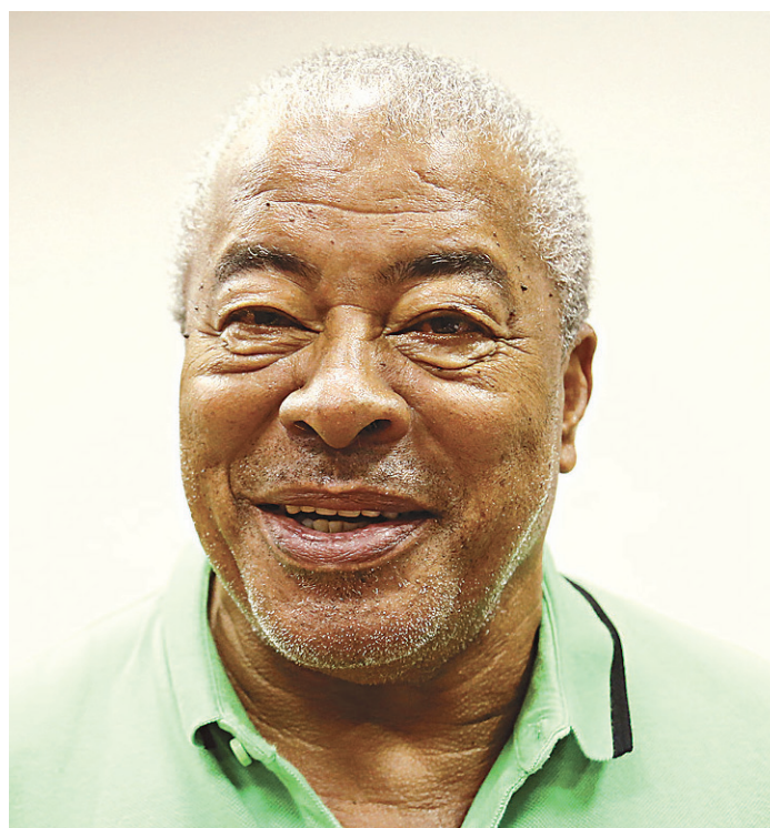
// Jair Ventura, o Jairzinho: 44 gols pela seleção brasileira

Ainda assim, Jairzinho conseguiu atuar profissionalmente durante 23 anos. O atacante vestiu a camisa da Seleção Brasileira 105 vezes e marcou 44 gols. Ele ainda foi o artilheiro do Brasil na Copa do Mundo de 1970, conquistada pelo selecionado canarinho, com sete gols marcados.