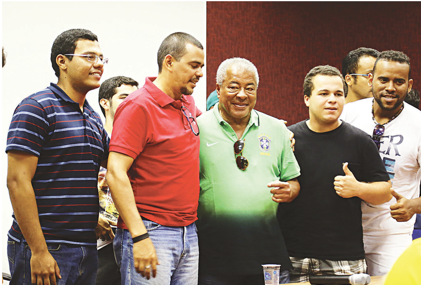
// Furacão da Copa de 70: ex-jogador debateu com alunos de educação física da UFRN a redução de lesões nos campos de futebol

O instrutor detalhou o "Fifa 11+", programa voltado à aplicação prática entre educadores físicos, fisioterapeutas e médicos ligados ao futebol, e apresentou dados elaborados pela CBF sobre o número de lesões e os tipos específicos de traumas que acometem os jo-