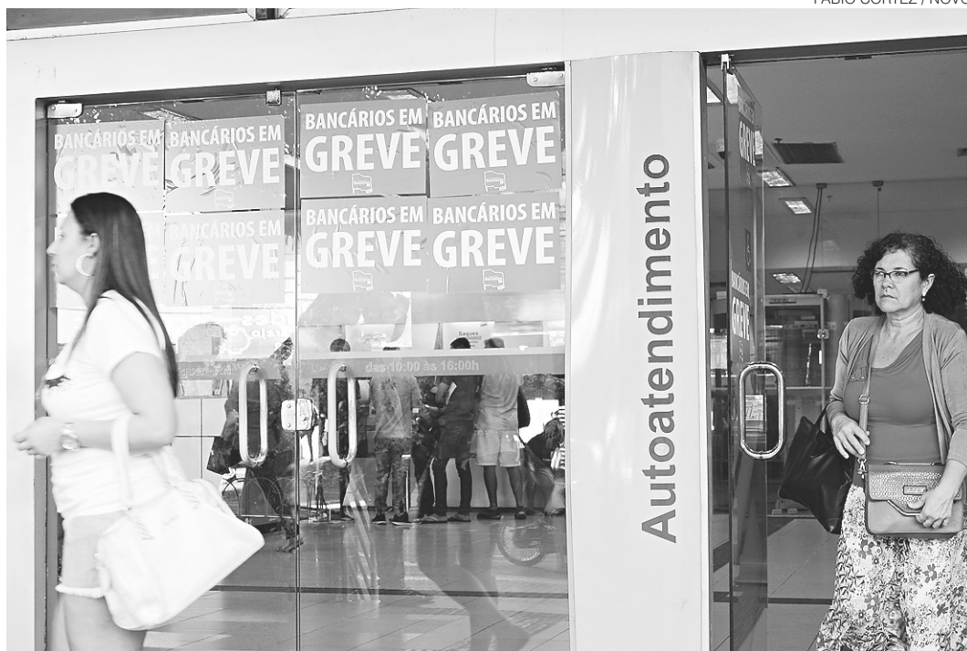
// Portas fechadas: 86 agências bancárias estão fechadas em todo o Rio Grande do Norte

“Muitas pessoas estão tendo dificuldades de pagar suas contas por causa da falta de acesso a alguns canais ou mesmo pelo fato de que, em virtude da greve, estão tendo