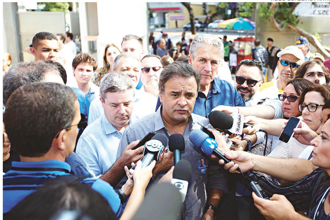
// Aécio Neves, do PSDB, avaliou que o Partido dos Trabalhadores sofreu um duro golpe nas urnas

"Essas eleições demonstram a clara derrocada do PT, do falacioso discurso do golpe, do oportunista discurso da vitimização que o PT alardeou por todo o País. Não fomos nós do PSDB, a população rechaçou esse discurso. O PT vai ter que encontrar novo caminho para se reconciliar minimamente com setores da sociedade que deles já estiveram próximo. A grande verdade é que o PT, em várias regiões do País, foi simplesmente