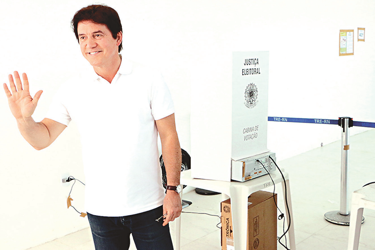
// Robinson Faria comemorou resultado obtido por seu partido nas eleições 2016

Os dados deste ano consideram o resultado em 5.507 cidades em que a disputa foi finalizada no primeiro turno. Em 55 municípios, o pleito foi para o segundo turno e, em seis, o resultado depende ainda de decisão judicial.