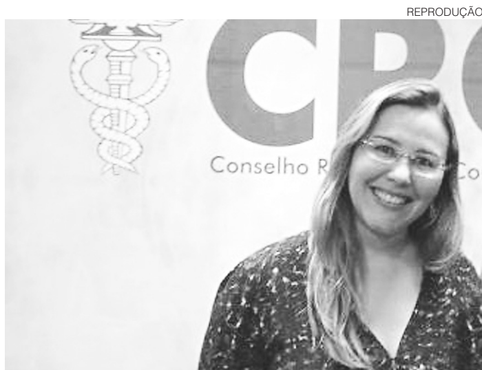
// Sâmia Aby Faraj, presidente da Junta Comercial: sistema online

esforço conjunto para facilitar abertura de novas empresas. O Escritório do Empreendedor deve complementar o trabalho realizado pela Redesim, que simplifica o levantamento da documentação necessária para abrir uma empresa de forma virtual.