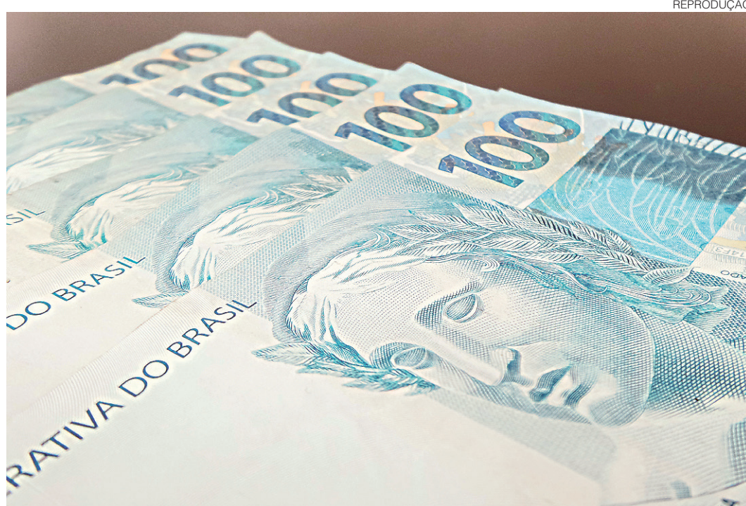
// Segundo a Pnad, o rendimento médio do trabalhador passou de R$ 1.950 para R$ 1.853 em 2015

Quando se considera as demais faixas de renda, a metade da população que ga-