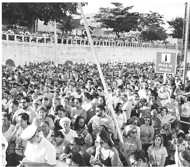
Missa da Padroeira de Natal, Nossa Senhora da Apresentação, na Pedra do Rosário.