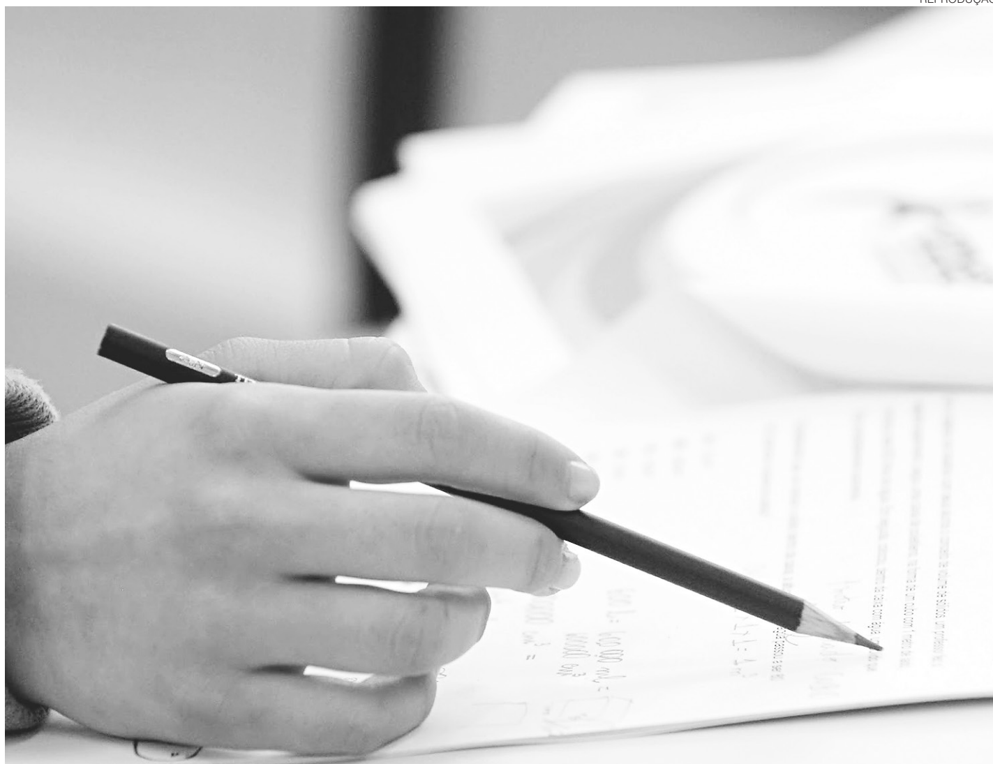
// No ENEM 2016, segundo o MEC, 1,2 milhão de candidatos que obtiveram a isenção de taxa sequer abriram a notificação de local de prova

Medidas fazem parte de pacote do Ministério da Educação para diminuir os custos da prova, que neste ano superaram R$ 650 milhões; objetivo é tornar exame "mais sustentável"