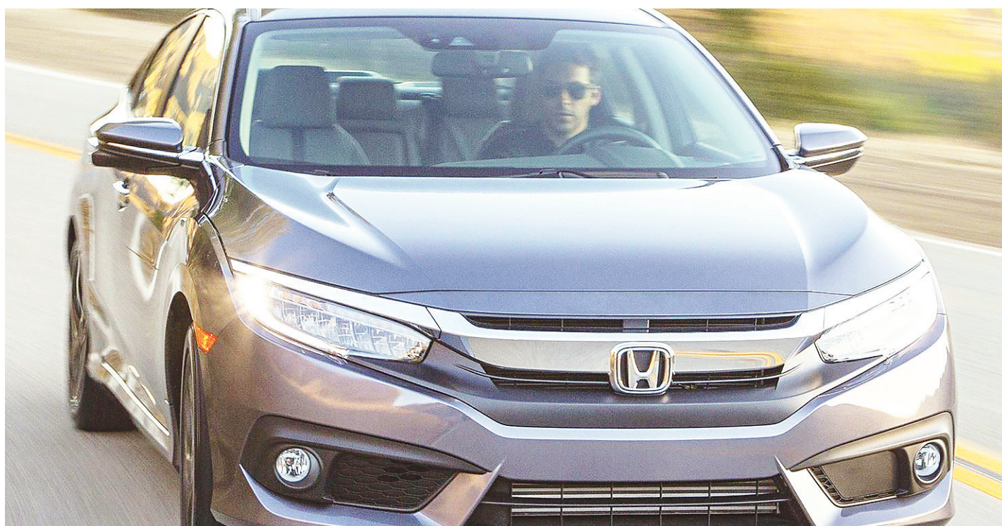
// Novo Honda Civic Touring custa R$ 124.900, tem motores turbo 1.5 e 173 cavalos de potência