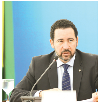
// Ministro do Planejamento Dyogo Oliveira

Para o ministro, a prorrogação antecipada resolve um importante dilema no setor de concessões: a redução de investimentos no final do prazo do contrato. "O concessionário que já está próximo do final da concessão tem poucos incentivos para fazer investimentos, porque sabe que não pode amortizar esses investimentos até o fim