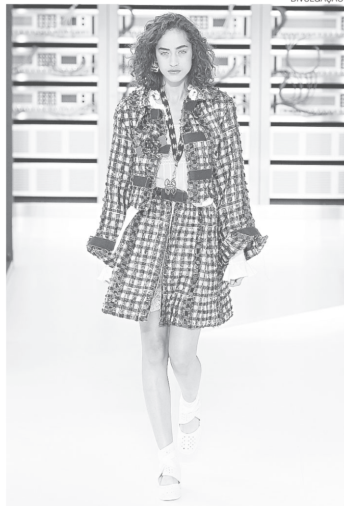
// Desfile Chanel em Paris para o Verão 2017