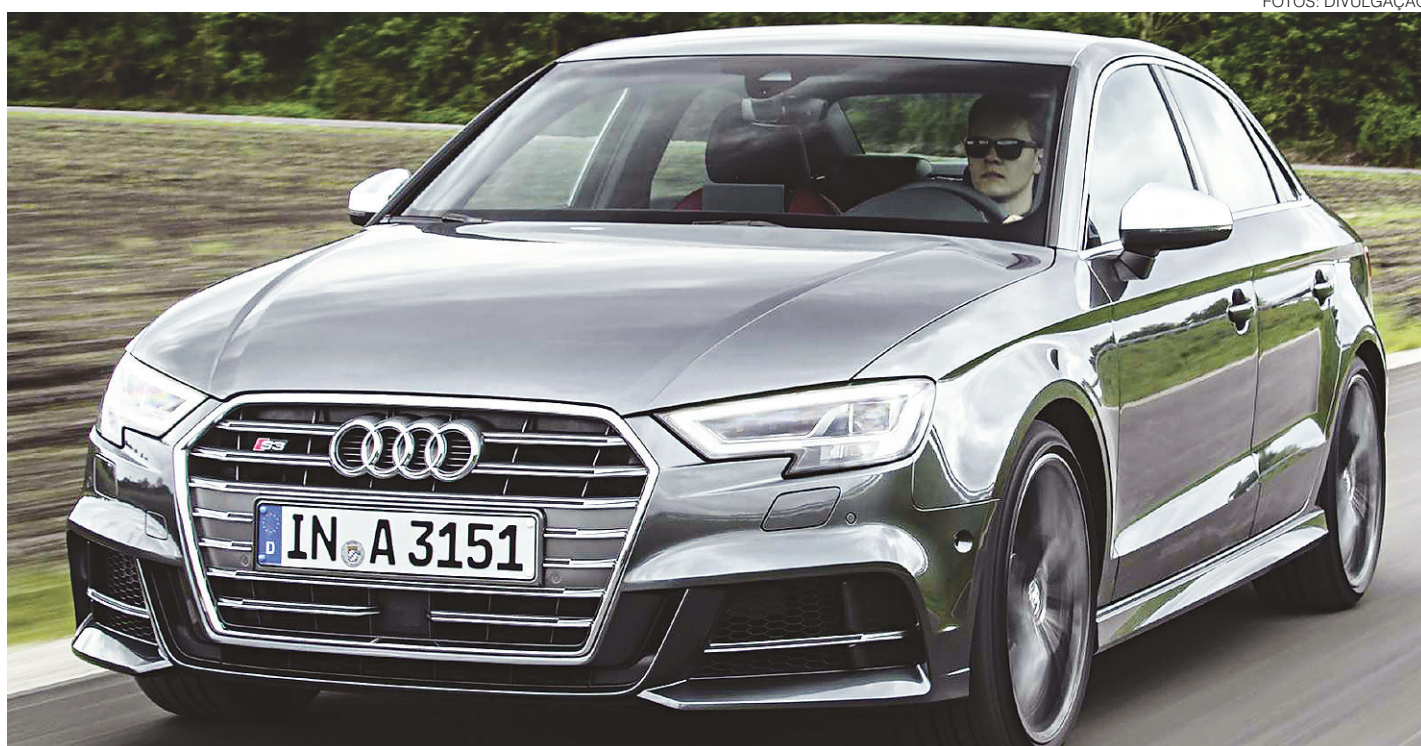
// Novo Audi A3 é um sedã clássico, com linhas tão elegantes, e sai a partir dos R$ 117.990

Em termos de conforto e espaço, o Honda volta a se destacar, especialmente no banco traseiro. O Civic tem 18 cm a mais no comprimento (4,64 m) e 6 cm na distância entre-eixos (2,7 m). O porta-malas é maior (519 litros, ante 425 l do A3). Ambos têm motores turbo, mas o 1.5 do Honda é bem mais potente (173 cv, contra 150 cv do A3). Só o Audi aceita etanol, e apenas o Honda tem suspensão independente na traseira.