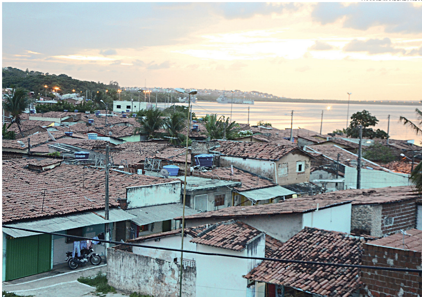
// Suspeitos são ligados ao Sindicato do Crime, organização criminosa que tem forte domínio sobre a região ribeirinha

Os sete detidos atuavam em conjunto na realização dos assassinatos. Todas elas foram identificadas pela polícia e tiveram prisão decretada. Dois dos integrantes já cumpriam pena em unidades carcerárias do sistema penitenciário do Rio Grande do Norte.