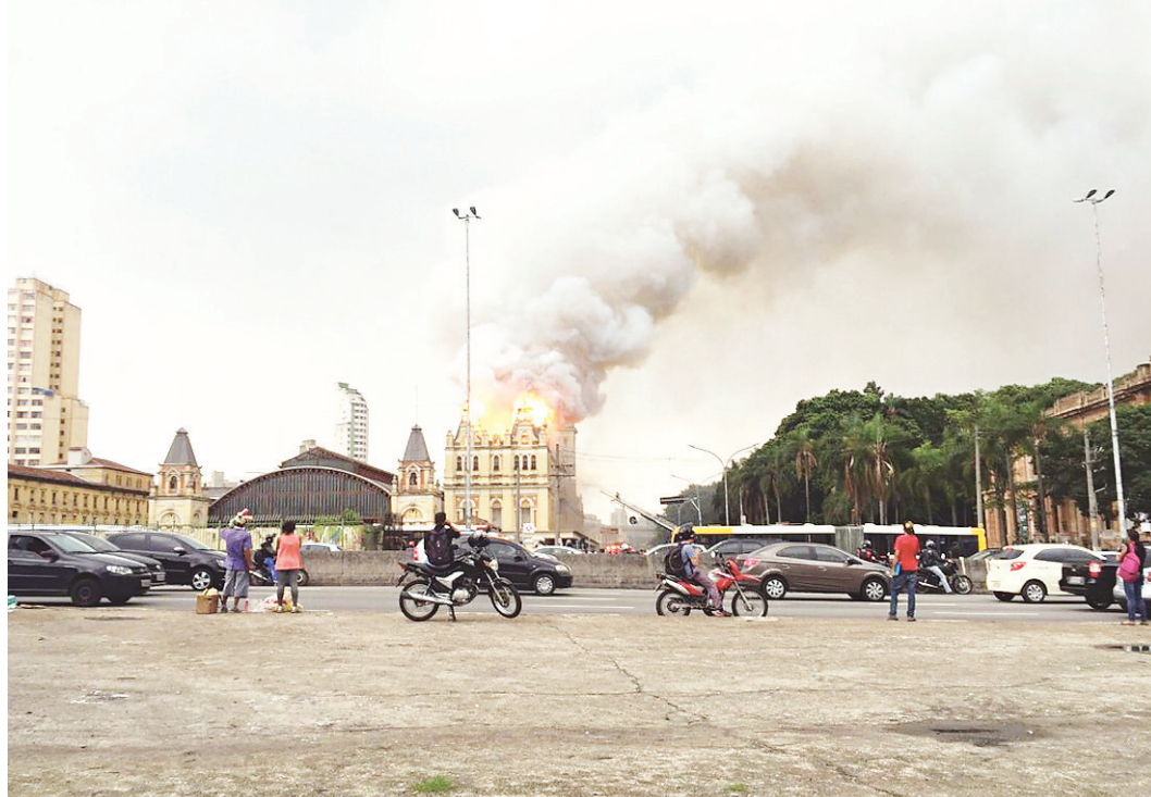
// Antes do incêndio, em 2015, museu abrigava mostra sobre o folclorista potiguar Câmara Cascudo

O projeto de restauração das fachadas e esquadrias foi aprovado pelos três órgãos do patrimônio histórico – Instituto do Patrimônio Histórico e Artístico Nacional (Iphan); Conselho de Defesa do Patrimônio Histórico, Arqueológico, Artístico e Turístico (Condephaat), órgão de âmbito estadual; e Conselho Municipal de Preservação do Patrimônio Histórico, Cultural e Ambiental da Cidade de São Paulo (Conpresp). Em paralelo à restauração das fachadas e esquadrias, já estão em desenvolvimento o projeto da estrutura da cobertura, de climatização, elétrica, hidráulica e combate a incêndio, revestimento da cobertura em zinco e consultoria ambiental - o projeto foca na obtenção do selo LEED (Leadership in Energy and Environmental Design), certificação para construções sustentáveis,