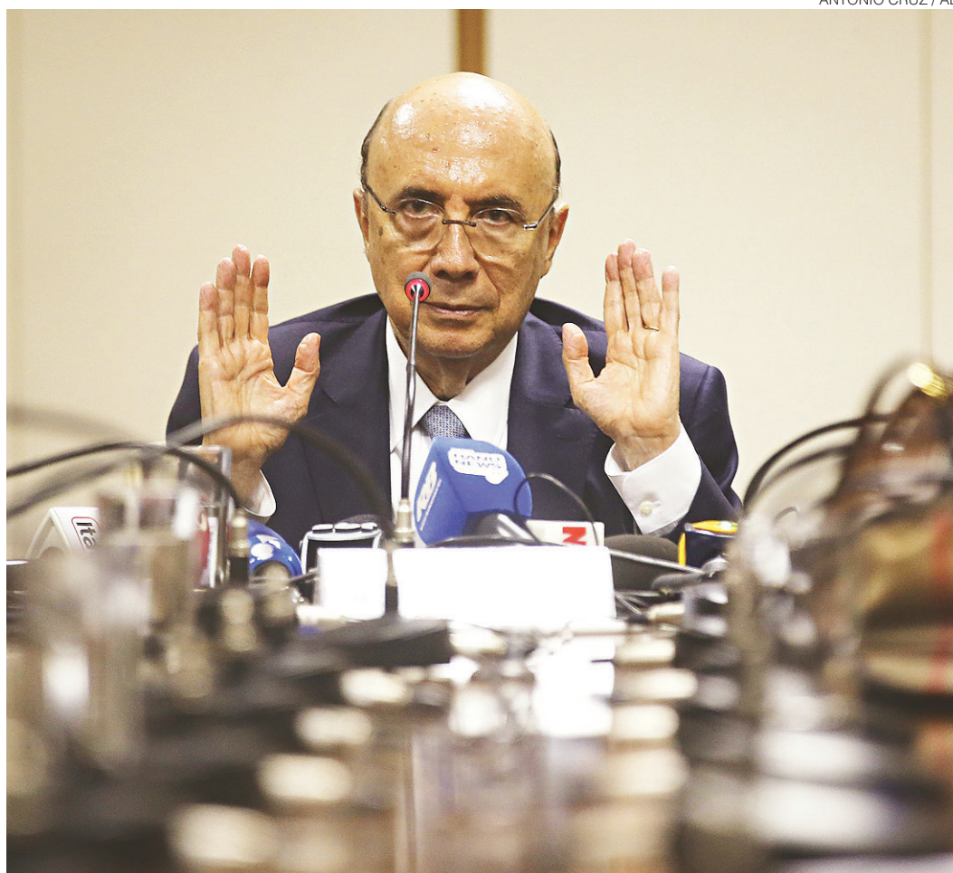
// Henrique Meirelles disse que reforma da Previdência é fundamental para limite do teto de gastos

Segundo o ministro, as mudanças nas regras da Previdência Social são fundamentais para que o limite de despesas imposto pelo teto de gasto seja sustentável no longo prazo para garantir que todos recebam a sua aposentadoria. "É importante garantir que a Previdência será solvente", afirmou, destacando que a necessidade da reforma é uma realidade e não uma opinião.