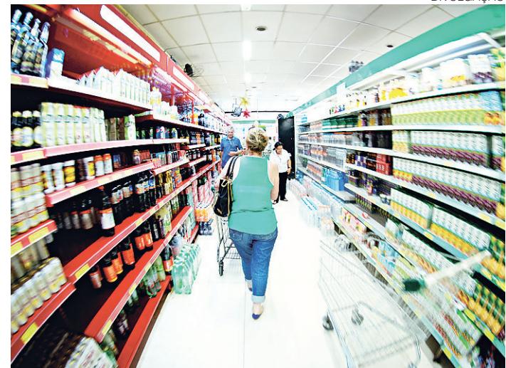
// Vendas em supermercados sobem 5% no penúltimo mês do ano

Após o resultado das vendas em novembro surpreender positivamente o setor, a Abras já admite que o resultado do ano pode ficar acima da proje-