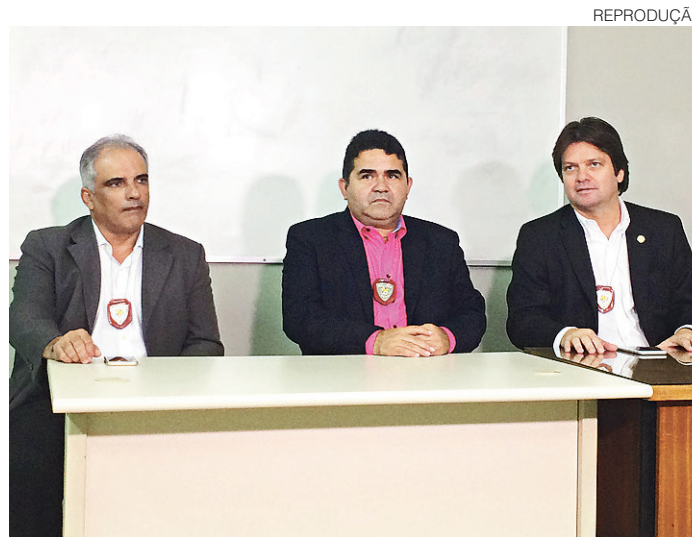
// Delegados detalharam ontem atuação do grupo criminoso