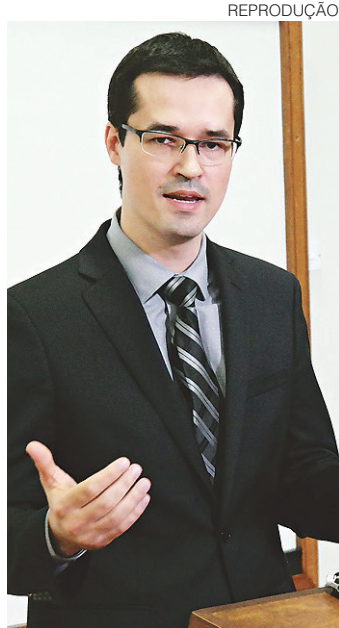
// Deltan Dallagnol, procurador

A Braskem se comprometeu a pagar valor equivalente, na data de assinatura do acordo, a R$ 3.131.434.851,37. Desse montante, aproximadamente R$ 2,3 bilhões serão devidos ao Brasil, para fins de ressarcimento das vítimas.