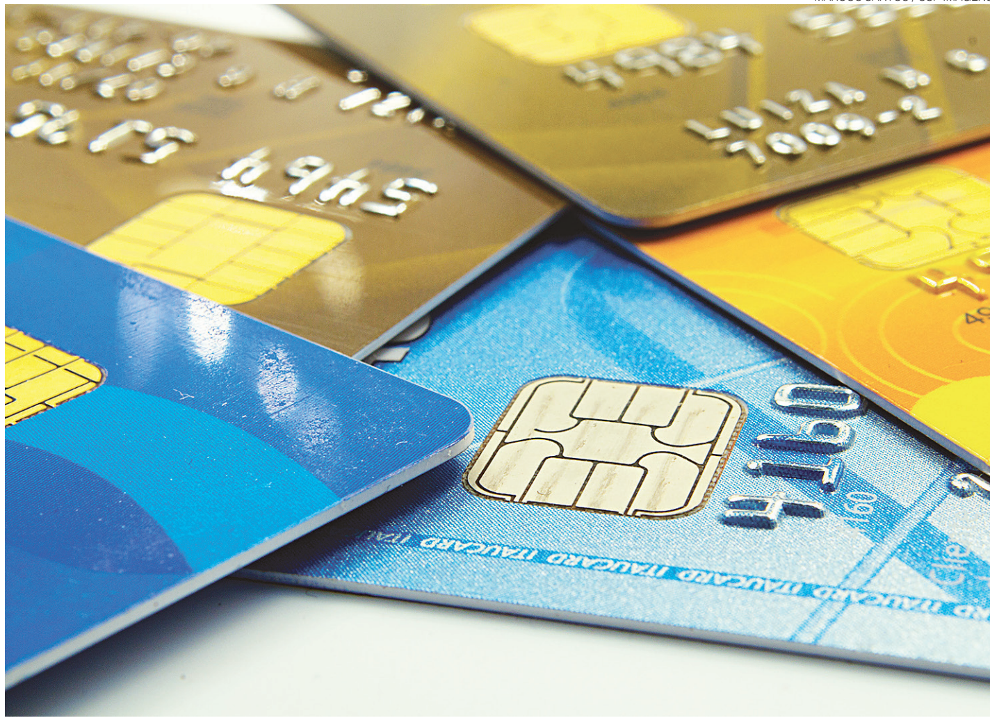
// Redução no prazo de repasse do valor das compras de cartão para os lojistas faz parte do pacote de medidas microeconômicas do governo

Na semana passada, ao anunciar o pacote de medidas