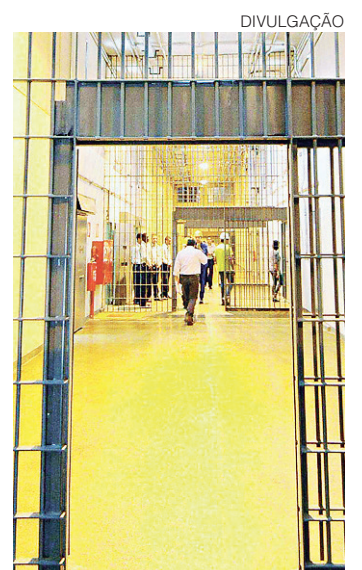
// Presídio terá capacidade para abrigar 603 presos

las cada, em uma área construída de 5.753,10 m 2 . A área também contará com alguns módulos especiais para ensino, saúde, visitas íntimas, tratamento de dependência química e carceragem adaptada para pessoas com deficiência física.