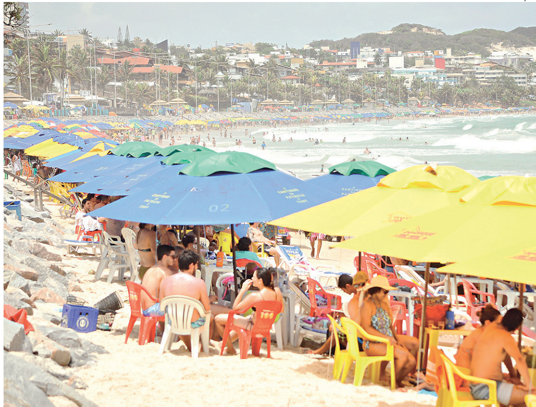
// Ponta Negra, uma das mais badaladas de Natal, ontem já registrava grande fluxo de turistas

Segundo o ministro do Turismo, o esperado crescimento do número de turistas estrangeiros é, em parte, fruto do fato de o Brasil ter sediado a Copa do Mundo e, principalmente, as Olimpíadas.