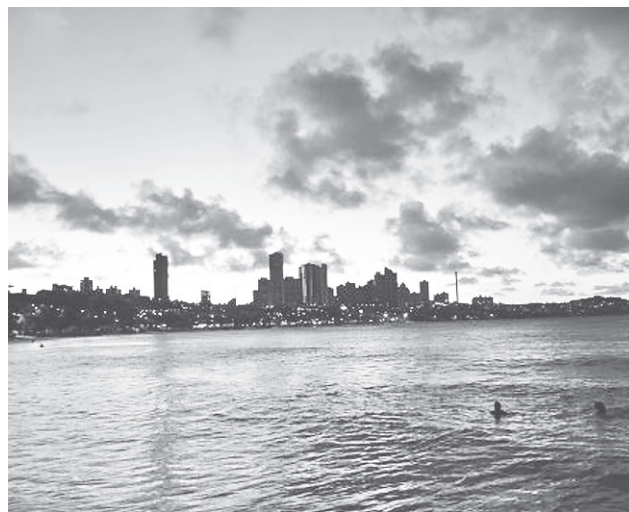
Fim de tarde em Ponta Negra, Natal - RN.