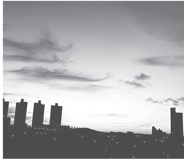
O lindo entardecer visto de Ponta Negra pelo leitor Petterson Santos.