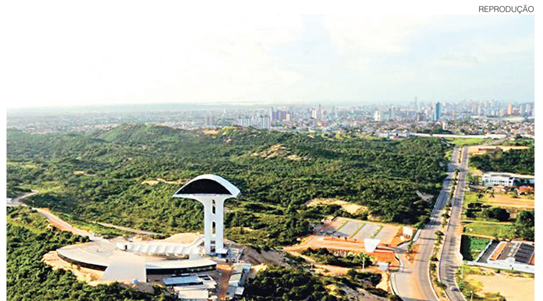
// Legenda Us, quia sam rae lat. Ellabora dolum voluptas vit ariam as sum unt aut et haria volupti od es ene

O GUAP é formado por um grupo de artistas integrantes da comunidade universitária (professores e alunos, ativos e aposentados) voltados para as artes visuais, alguns consagrados, outros iniciantes. Todos buscam experimentar diferentes suportes, técnicas e produções artísticas, que interpelam vasto público, principalmente aquele formado por crianças e jovens em idade escolar.