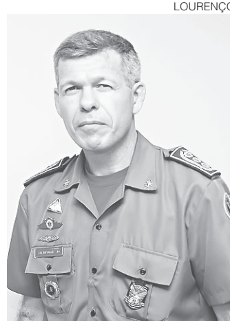
//CAICOENSE - Coronel Ulisses Vale dos Anjos é o novo subcomandante do Corpo de Bombeiros do Rio Grande do Norte