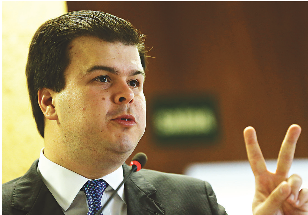
// Fernando Coelho Filho afirma que a intenção é expandir oferta de energia renovável

deve realizar, no segundo semestre, o leilão de seis distribuidoras da Eletrobras que estão sendo avaliadas por consultorias contratadas pelo Banco Nacional do Desenvolvimento Econômico e Social (BNDES).