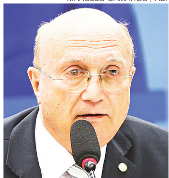
// Osmar Serraglio, ministro da Justiça: reunião sobre o tema

No caso da delação, por exemplo, Serraglio defendeu a mudança para criar uma es-