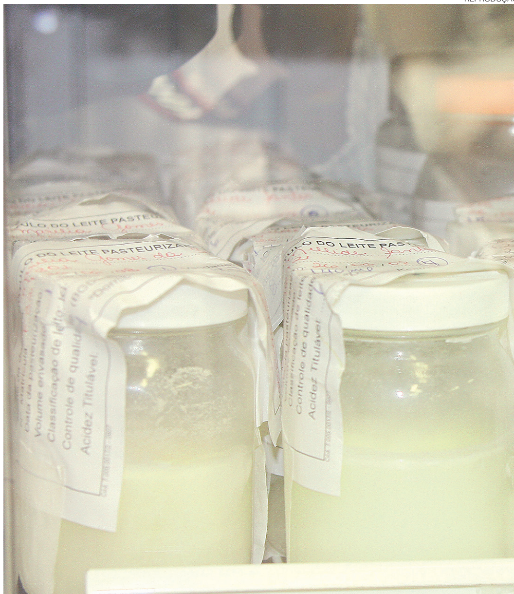
// Pesquisas mostram que aleitamento materno reduz em até 13% a morte de crianças menores de 5 anos

A doação de leite humano também representa uma economia de R$ 180 milhões com a diminuição da necessidade de compra de fórmulas artificiais nas maternidades do Sistema Único de Saúde (SUS).