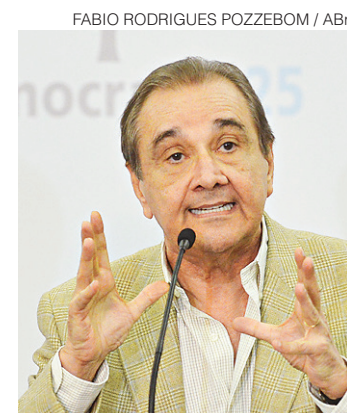
// José Agripino, senador: erro do relator da peça

De acordo com fontes, a indicação da deputada paulista para presidir os trabalhos foi promessa de campanha de Rodrigo Maia (DEM-RJ) na eleição da Mesa Diretora deste ano em troca do apoio do PTN. Agora, há um temor de que a deputada prejudique o andamento dos trabalhos, o que ela nega. "Temos de conduzir para um acordo", pregou Renata Abreu.