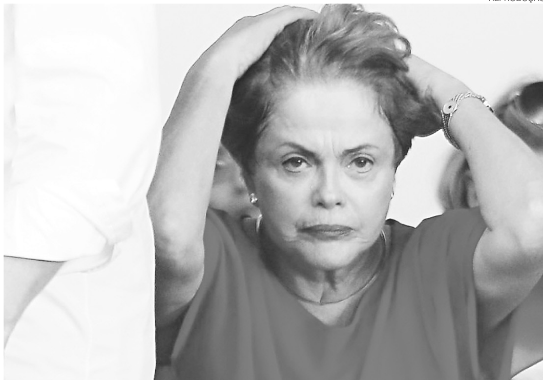
// De acordo com Mônica Moura, Dilma e ela criaram conta de e-mail que serviu à comunicação secreta

Perguntado sobre o assunto, o Google afirmou em nota