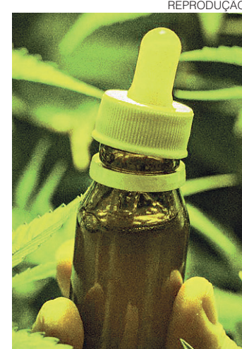
// Planta pode ser utilizada para extratos medicinais

Segundo o neuropediatra Eduardo Faveret, as pesquisas serão utilizadas para saber as concentrações é importante para o tratamento.