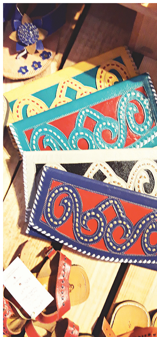
// Acessórios assinados pelo Mestre Espedito Seleiro viram febre entre fashionistas do DFB2017