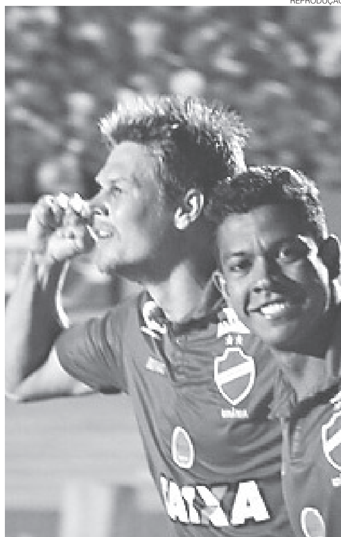
// Atacante hoje é um dos destaques do Vila Nova (GO)