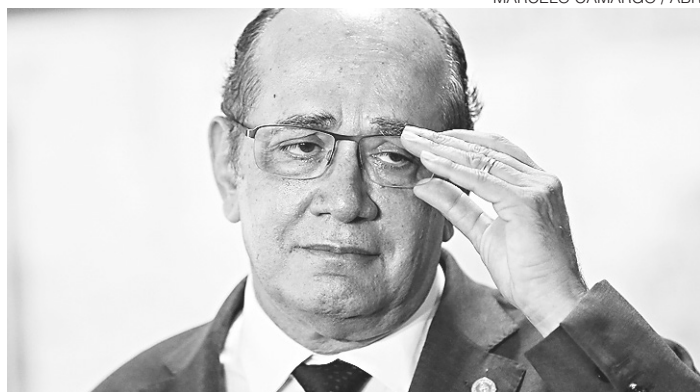
// Gilmar Mendes, ministro do Supremo Tribunal Federal

Na terça (23), o ministro Marco Aurélio disse durante