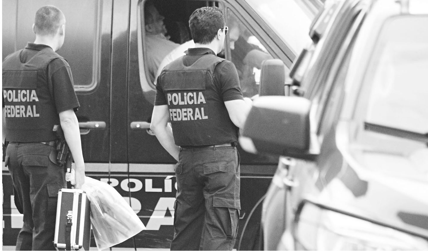
// 41ª fase da Operação Lava Jato, batizada de Poço Seco, investiga propina que teria sido negociada no contrato de Benin

Os investigadores ainda irão apurar por que motivos os suspeitos receberam os valores: se atuaram no fe-