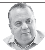
Artigo Rogério Marinho Deputado Federal

O que Meirelles vê como pessimismo o povo tem visto como realidade. E não adianta discurso ou propagando para se falar de progresso enquanto só o povo for obrigado a continuar trabalhando de forma honesta em prol do país.