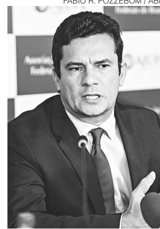
// Sérgio Moro, juiz federal da Operação Lava Jato