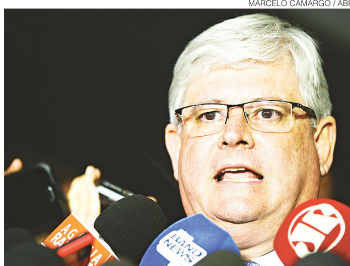
// Rodrigo Janot, procurador-geral da República

"Conjugando o regime preconizado pelo Código de Processo Penal e pelo Regimento Interno do Supremo Tribunal Federal, a Polícia Federal tem o prazo de 10 dias, contados da realização da prisão, para finalizar as investigações e remeter o inquérito para o Ministério Público Federal, que, por sua vez, possui o prazo de 5 dias