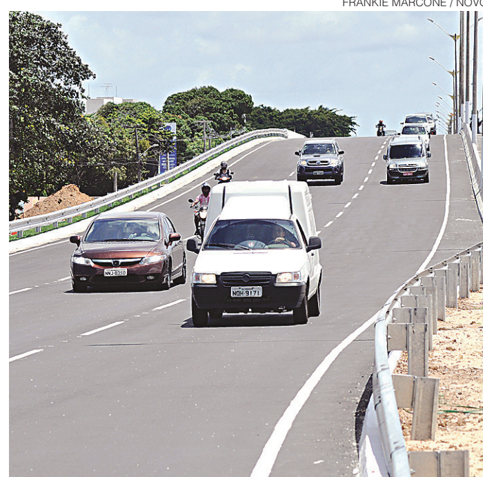
// A segunda via do retorno será liberada na sexta-feira, dia 02

A obra foi realizada pelo consórcio Natal-Parnamirim (A.Gaspar/IM/Geotec),