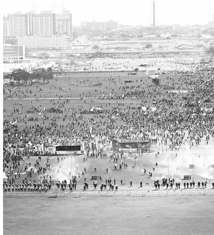
// Protestos em Brasília pediam a saída do presidente Michel Temer