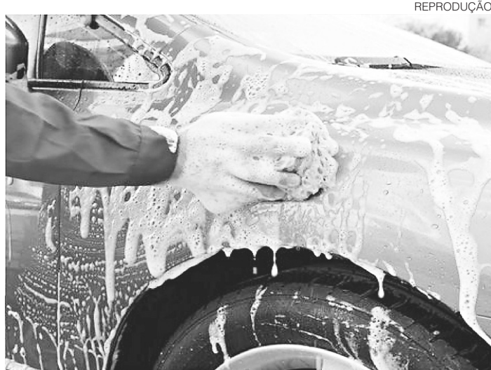
REPRODUÇÃO // Empresas têm 180 dias para iniciar programa de reuso d'água

Em tempos de recessão econômica, as pessoas tentam aproveitar recursos e habilidades para se manter financeiramente. Dessa forma se espalham negócios informais e foi assim que o município de Parnamirim, região metropolitana de Natal, viu crescer o número de lava jatos. Os estabelecimentos de lavagem de veículos têm como característica o impacto ambiental gerado pelo grande consumo de água. Com o objetivo de reduzir os danos, a prefeitura vai exigir a construção de sistemas de captação e armazenamento de água das chuvas seja obrigatória no momento de licenciar os lava jatos.