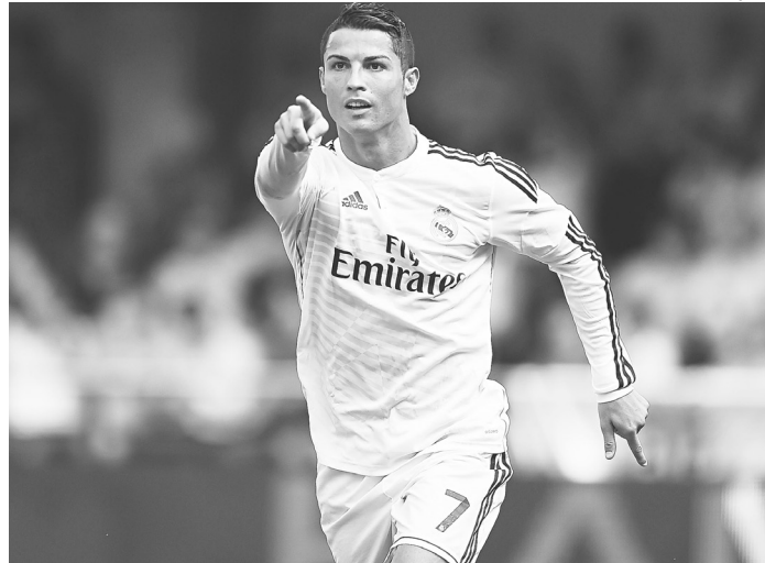
// Cristiano Ronaldo não gosta das provocações do brasileiro

Ainda na Suíça, o lateral brasileiro voltou a cutucar o português após o anúncio de