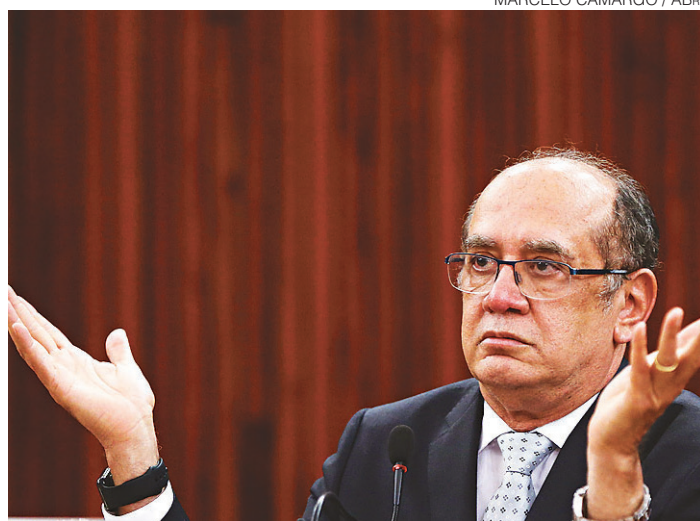
// Gilmar Mendes, ministro do STF: castrar iniciativas do STJ

“Esse inquérito vai chegar a provar a obstrução de Justiça desses magistrados? É obviamente que não. Não vai provar. Mas o inquérito está lá”, afirmou Mendes.