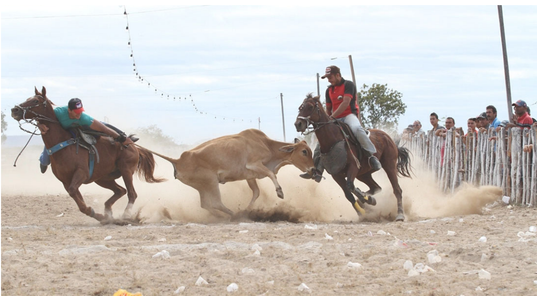
// Tradicional na região Nordeste, a vaquejada é prática na qual dois vaqueiros montados a cavalo têm de derrubar um boi, puxando-o pelo rabo

Durante a votação em primeiro turno, o relator da PEC na comissão especial, deputado Paulo Azi (DEM-BA), rebateu a tese do STF. Para Azi, se a vaquejada fosse banida, além da cultura de um povo, teria prejuízo injustificável para toda uma cadeia produtiva, condenando cidades e microrregiões ao vazio da noite para o dia.