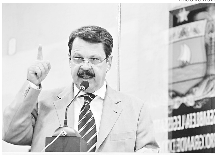
// Ricardo Motta, deputado estadual: "Exposição diária de inverdades"

O deputado reiterou o seu compromisso com os melhores interesses do Rio Grande do Norte, agradeceu os eleitores e as inúmeras manifestações de apoio e orações e encerrou seu pronunciamento parafra-seando o jurista Miguel Rea-