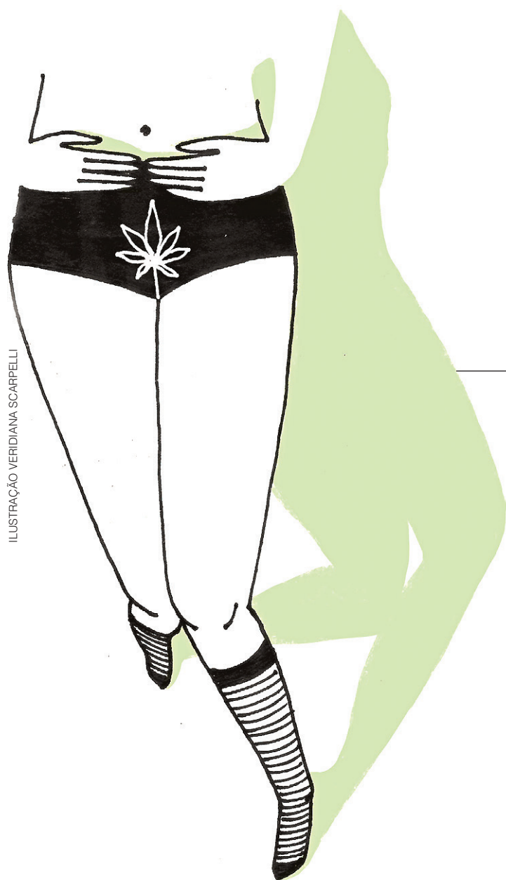
ILUSTRAÇÃO VERIDIANA SCARPELLI