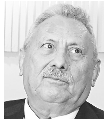
// Desembargador Expedito Ferreira, presidente do TJRN

A Procuradoria do Estado informou que vai aguardar decisão do pleno do CNJ,