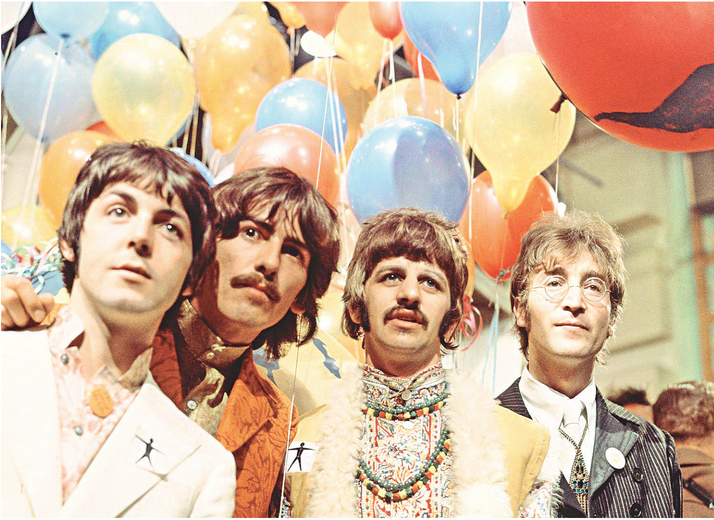
// Paul McCartney, George Harrison, Ringo Starr e John Lennon e (da esq. para a dir.) em Londres, 1967, em evento promocional do disco