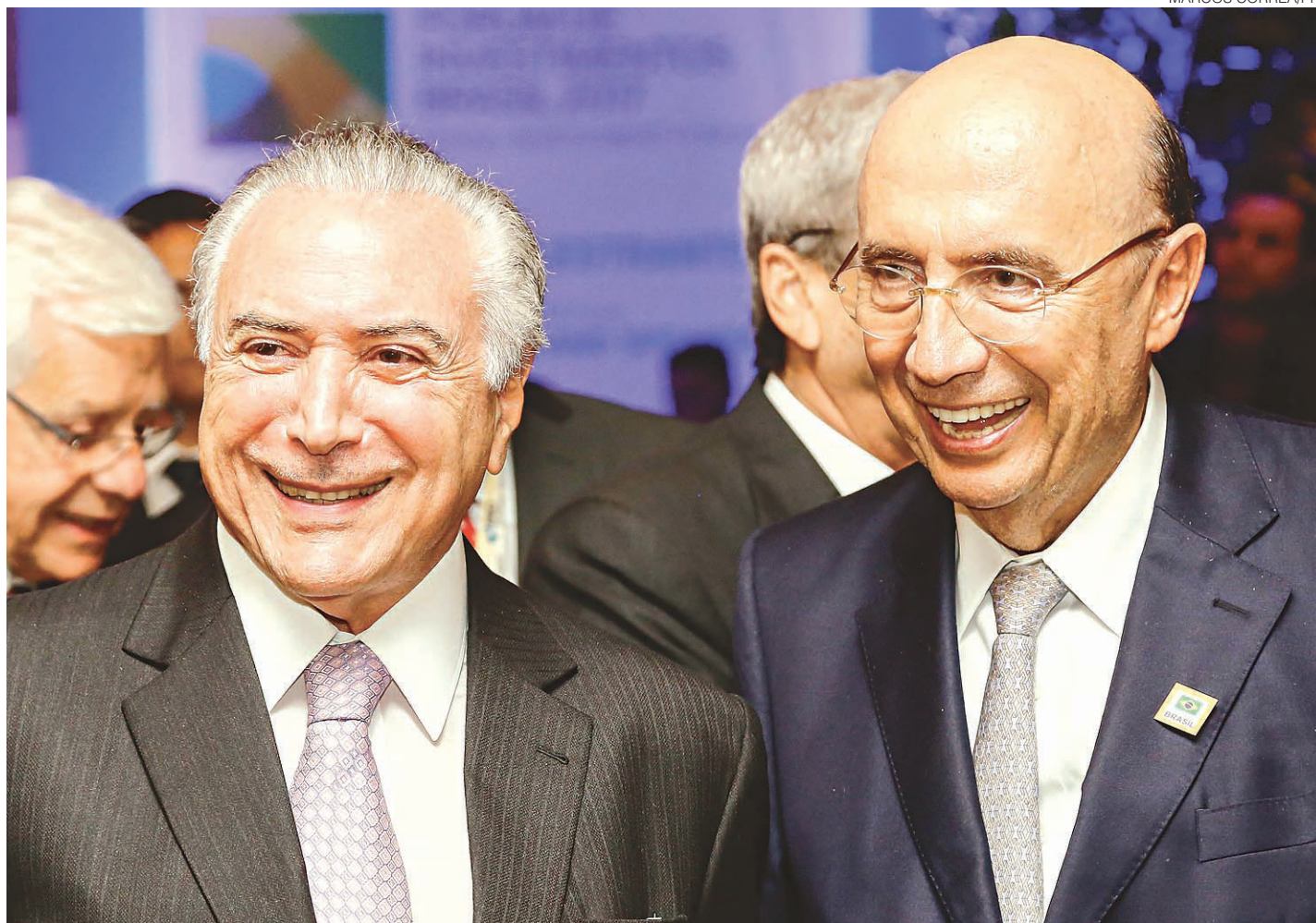
// Presidente da República, Michel Temer, e ministro da Fazenda, Henrique Meirelles, animadíssimos com crescimento do PIB

Os economistas dizem ainda que veem como pouco provável que o desempenho excepcionalmente robusto das exportações líquidas se mantenha no mesmo patamar ao longo do ano, de forma a compensar a contribuição ainda negativa do ambiente doméstico.