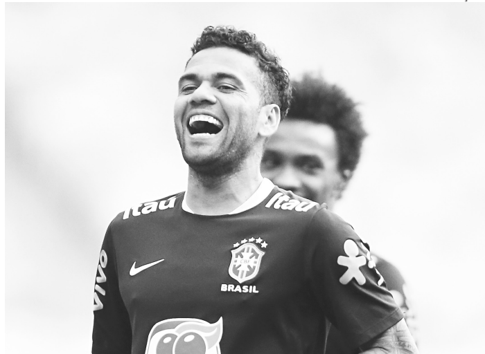
// Lateral Daniel Alves gosta de polemizar com o português

Acostumados a grandes combates, Cristiano Ronaldo e Dani Alves apimentaram por anos a rivalidade entre Barcelona e Real Madrid. Amizade entre eles jamais existiu.