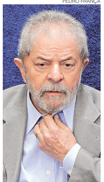
// Luiz Inácio Lula da Silva, ex-presidente da República

Ainda de acordo com o texto -que ainda pode sofrer modificações até sábado (3), quando o congresso se encerra-, o PT rejeita qualquer possibilidade de eleição via colégio eleitoral e defende, além da convocação de uma Assembleia Constituinte, as eleições diretas para substituir Temer