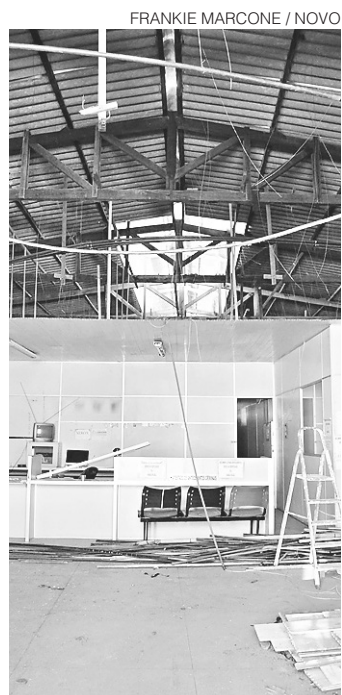
// Acidente afetou a emissão de antecedentes criminais

A nota afirma que o processo de licitação para reforma do prédio já está em andamento e que a mudança para nova sede deve ocorrer até o final do ano.