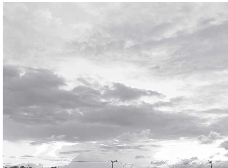
Um lindo registro de uma das belezas naturais mais belas, o céu.