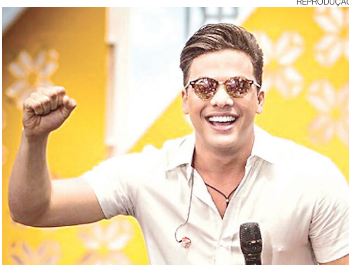
// A música "Ressaca de saudade" já está nas rádios de todo o país

Se todas essas novidades do cantor emplacarem rápido, o cearense deve dominar as rádios, já que está com quatro músicas nas paradas. Na lista com as cem mais tocadas no Brasil, segundo a Crowley (empresa