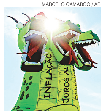
// Inflação para 2018 permanece prevista em 4,40%

Essa projeção é do boletim Focus, uma publicação elaborada pelo BC (Banco Central) e divulgada em Brasília, às segundas-feiras. A projeção para a expansão do PIB em 2018 caiu de 2,48% para 2,40%. A estimativa para