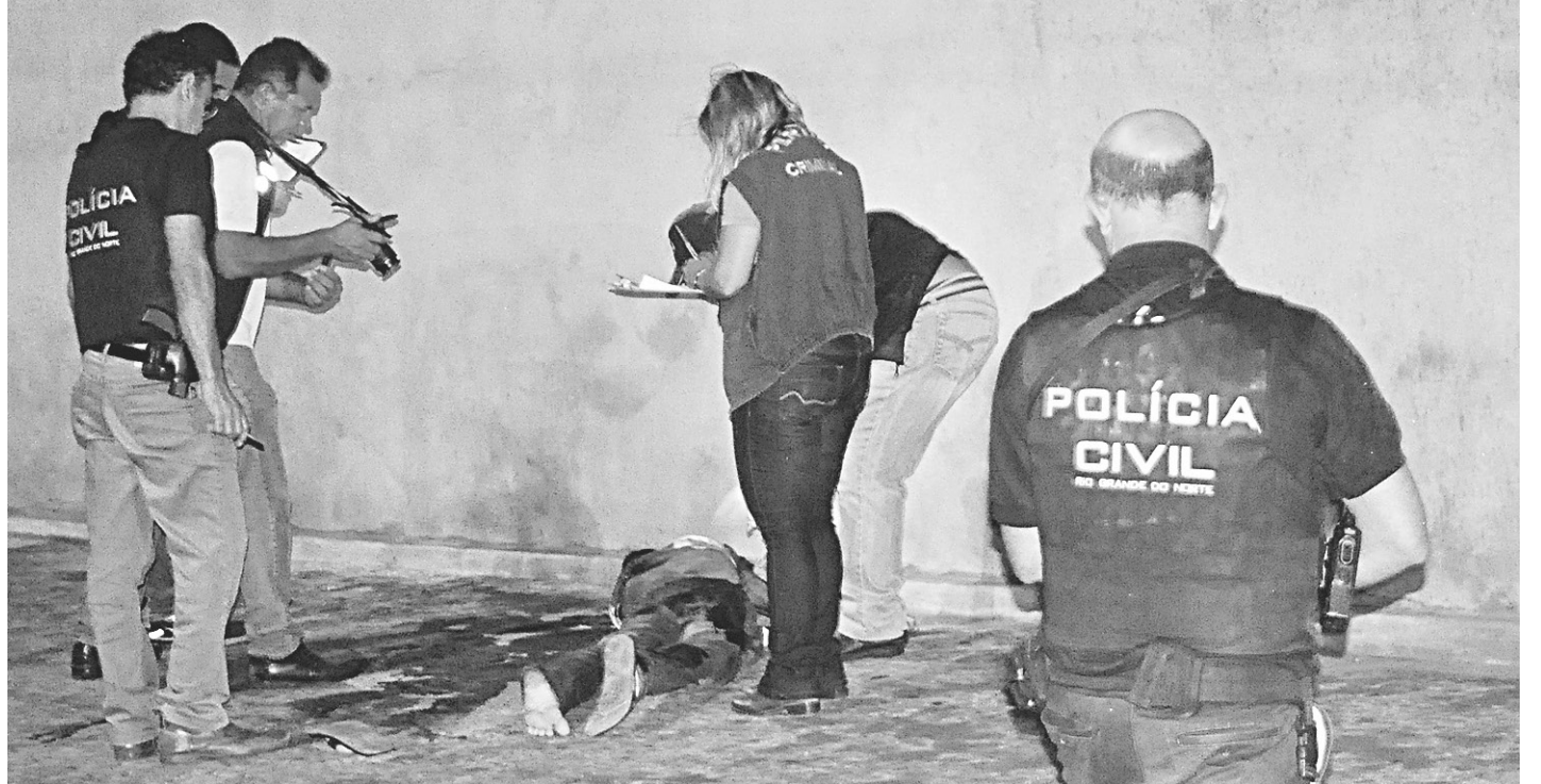
// Segundo o estudo do IPEA, os registros permitem calcular uma taxa de 28,9 assassinatos para cada 100 mil brasileiros

Na outra ponta da tabela, a cidade de Jaraguá do Sul, em Santa Catarina, é o município com mais de 100 mil habitantes que registra a menor violência letal. Foram cinco assassinatos em 2015 e uma taxa de homicídios de 3,1 casos para cada 100 mil habitantes.