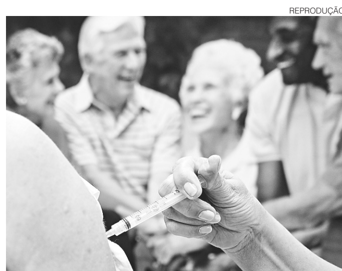
// Vacinação segue até o próximo dia 09 em todo o Brasil

A meta é de vacinar 90% do público-alvo, mas, até o momento, nenhum grupo prioritário atingiu o índice, que inclui crianças de 6 meses a menores de 5 anos; pessoas com 60 anos ou mais; tra-