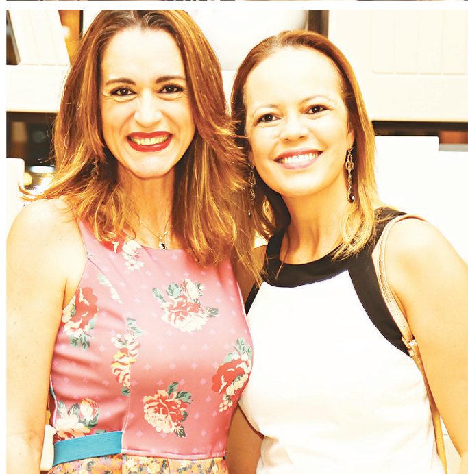
COSMA E DAMIANA