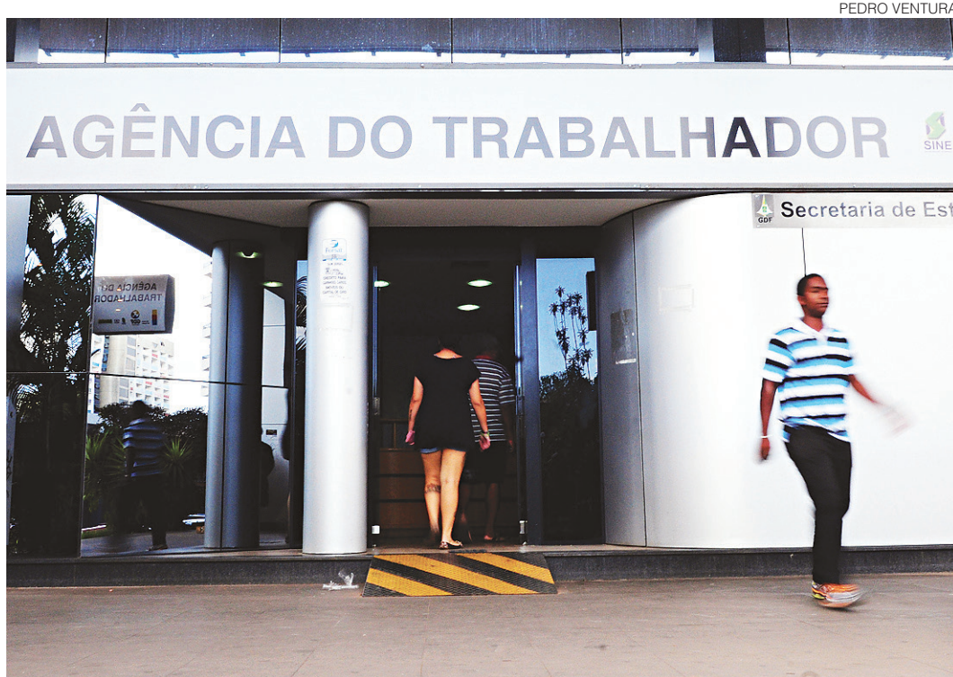
// Pesquisa mostra que pequenas empresas são "porta de entrada e saída" para o mercado de trabalho

Os trabalhadores acima de 65 anos representaram um percentual muito pequeno dos contratados em 2016: 0,3% nas micro e pequenas empresas e 0,2% nas médias e grandes. Quando comparase a quantidade de contratados em números absolutos, no entanto, os pequenos negócios saem à frente. Enquanto médios e grandes empresários contrataram 11.120 pessoas nessa faixa etária em