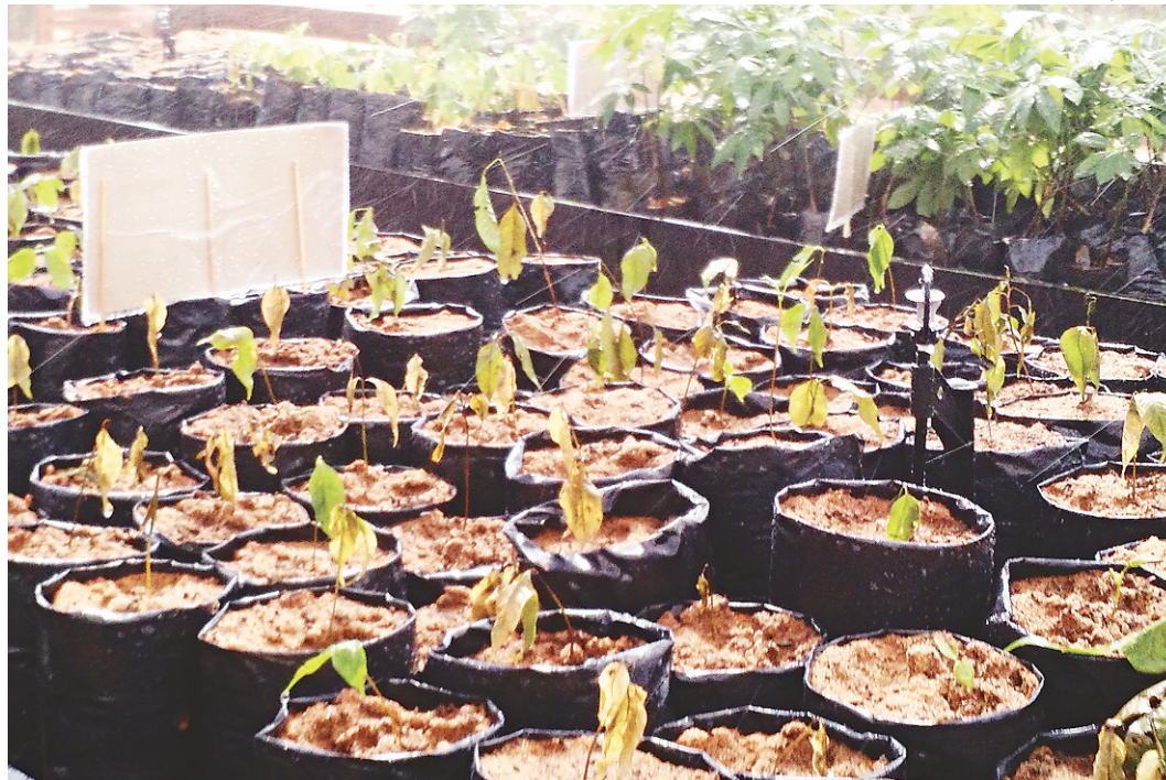
// Mudanças servirão para recompor as áreas do próprio parque, que é unidade de conservação ambiental

O Centro de Mudanças e seus anexos abrangem uma área de aproximadamente 500m 2 e foram elaborados dentro de uma proposta sustentável, com a utilização de metodo-