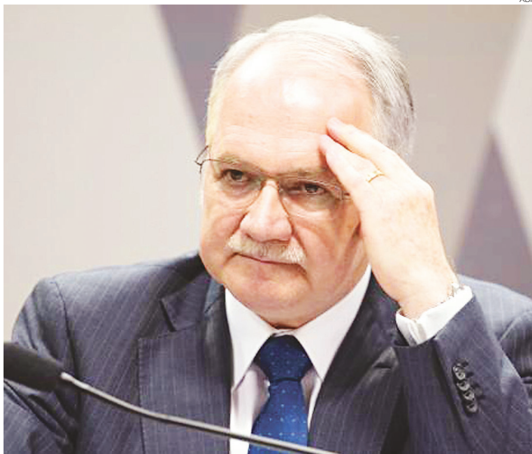
// Edson Fachin, ministro do STF: prisão preventiva para assegurar a ordem pública

"Em determinados casos, as peculiaridades do delito podem evidenciar maior reprovabilidade e, nessa medida, tais particularidades podem robustecer o receio de reiteração delituosa e, por consequência, o risco à ordem pública. Trata-se de juízo preambular próprio da provisoriedade das medidas cautelares. Sob essa ótica, lamento averbar, mas é