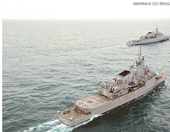
// Primeiro navio está previsto para 2022 e o último para 2025

O conjunto do negócio também será explicitado - dos termos da participação da indústria local até o pagamento de royalties em futuras vendas internacionais do produto, passando pelas compensações comerciais e os índices de nacionalização. O grupo contratado terá de fabricar as corvetas no País, consorciado com parceiros do setor naval