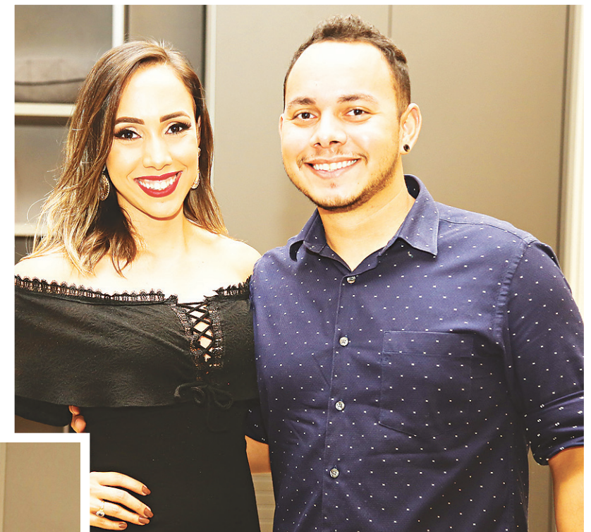
TICA E TECO