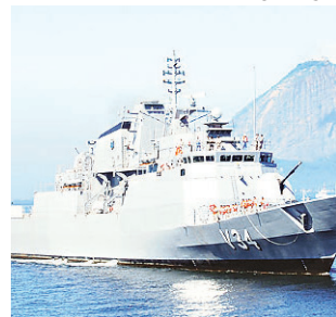
MARINHA DO BRASIL

Ministros começam a julgar chapa Dilma/Temer, suspeita de abuso de poder econômico, caso que pode resultar na cassação do peemedebista e na inelegibilidade da petista. NOVO traz dois especialistas falando sobre a causa. Política #3