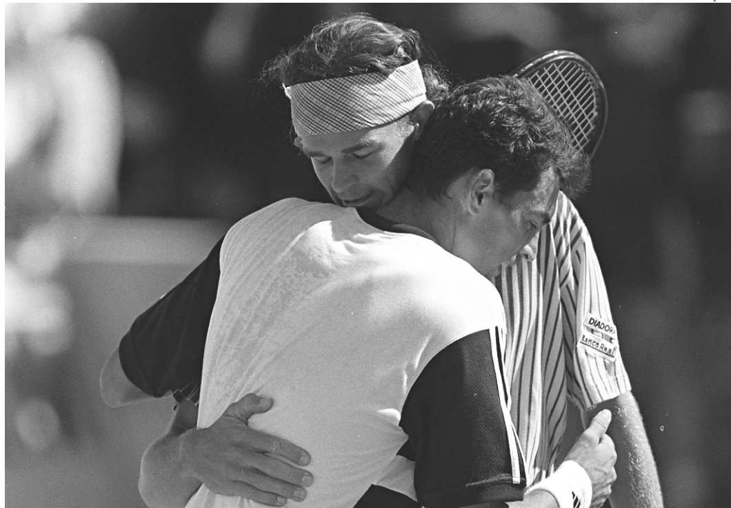
// Em 1997, aos 20 anos, Guga se tornou um dos tenistas de menor ranking a ser campeão no saibro de Paris

mento por parte de Roland Garros até hoje. Desde que começou a atual edição do torneio, o brasileiro vem recebendo uma série de homenagens, a começar pelo documentário produzido pela própria Federação Francesa de Tênis contando a trajetória do primeiro título.