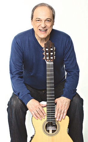
// Toquinho se apresenta sábado no Teatro Riachuelo