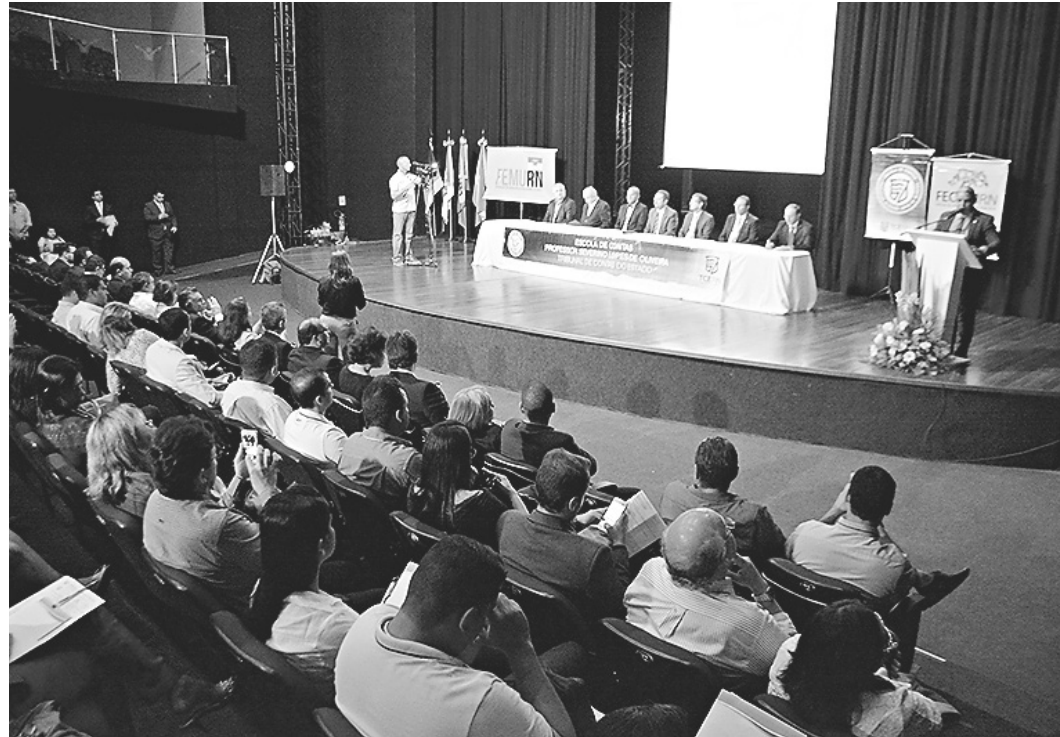
// Acesso à Informação: 49 municípios do RN receberam nota zero do Ministério da Transparência

De acordo com Benes Leocádio, apesar das notas baixas, os municípios estão caminhando para ampliar o acesso a informação e