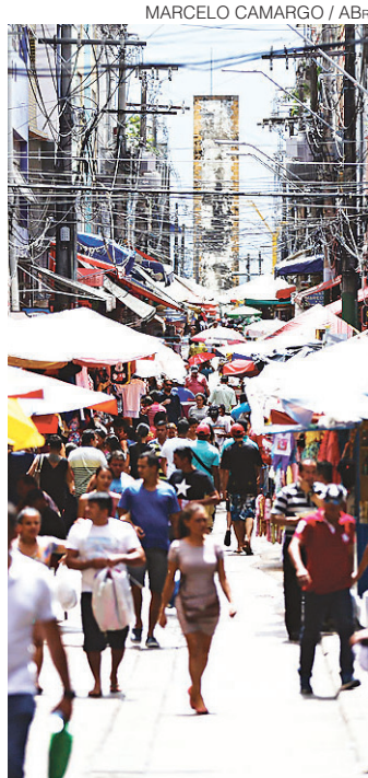
// Novo modelo só será usado no comércio e no setor de serviços

No entendimento do governo, varejo e serviços poderão usar o novo contrato porque oferecem situações