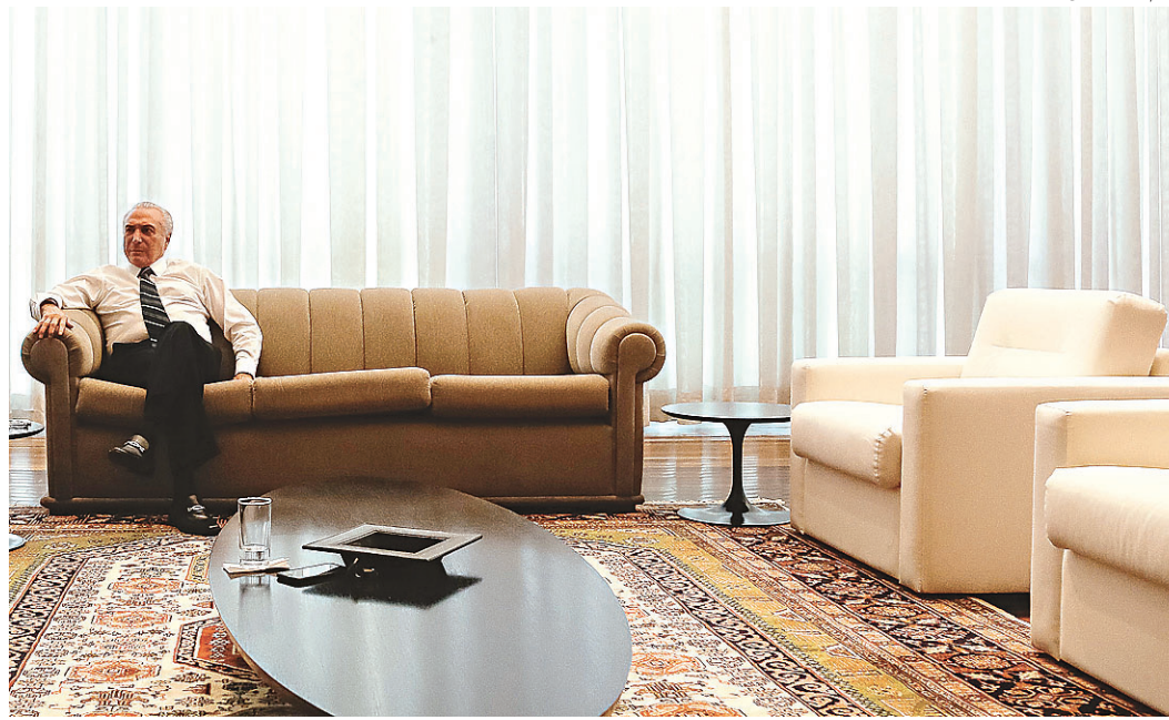
// Expectativa de Michel Temer é que Rodrigo Janot ofereça denúncia contra ele na semana que vem

Como a reforma previdenciária enfrenta resistência até na base aliada, a avaliação de assessores e auxiliares presidenciais é de que ela "mais atrapalharia do que ajudaria" neste momento e de que o esforço prioritário deve ser o de garantir a permanência do pe-