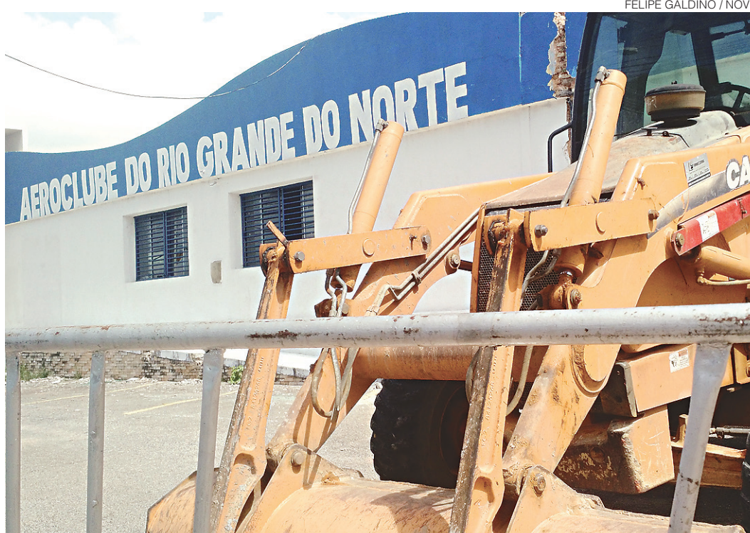
// As obras de restauração serão encerradas em dezembro e irão resgatar a aparência da década de 1950