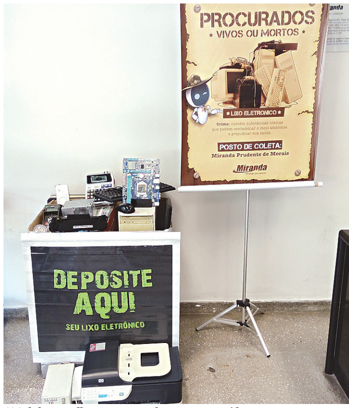
// Celulares, pilhas e computadores são os resíduos mais comuns

No UNI-RN, a iniciativa está atrelada ao programa institucional "UNI-RN Sustentável", que visa desenvolver na comunidade acadêmica atitudes diárias de respeito ao meio ambiente. Desde 2015, o UNI-RN participa de campanhas de coleta de lixo eletrônico. A instituição já foi certificada, inclusive, como instituição parceira da Natal Reciclagem, empresa referência na capital, no gerenciamento e reciclagem de resíduos sólidos.