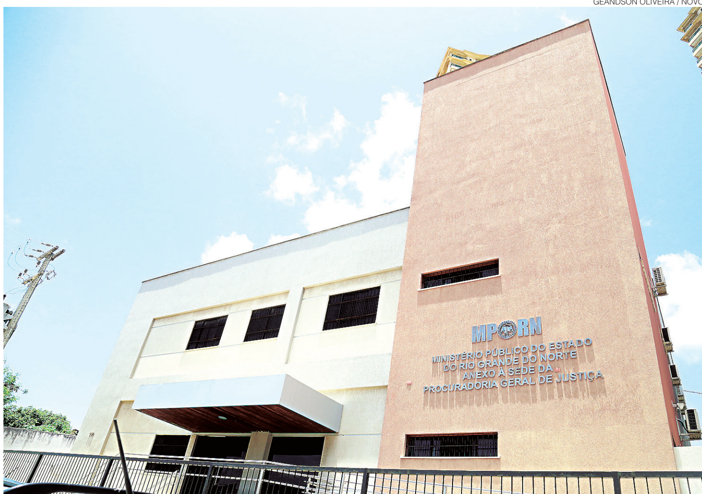
// Suspeitas são de facilitação de fuga, falsidade ideológica e material, tráfico de influência e organização criminosa

Foram cumpridos cinco mandados de busca e apreensão, sendo dois nas casas de duas advogadas e os outros três na residência de agentes penitenciários do sistema prisional do RN. As suspeitas são