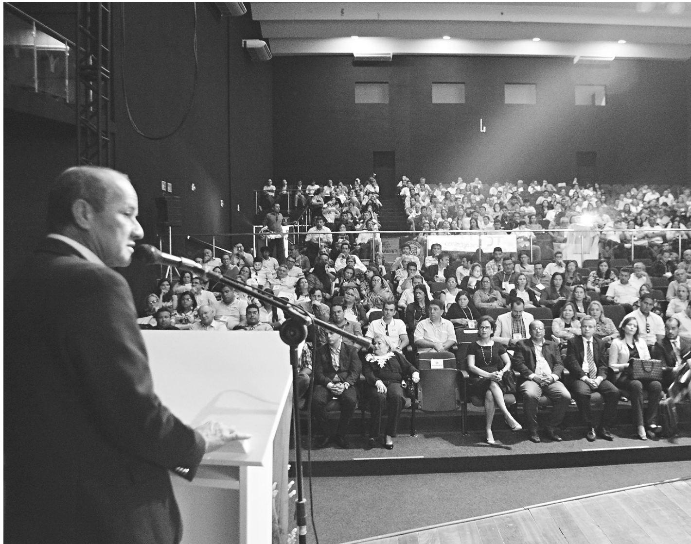
// Encontro regional de orientação dos gestores públicos do Rio Grande do Norte, promovido pelo TCE, foi encerrado ontem em Parnamirim