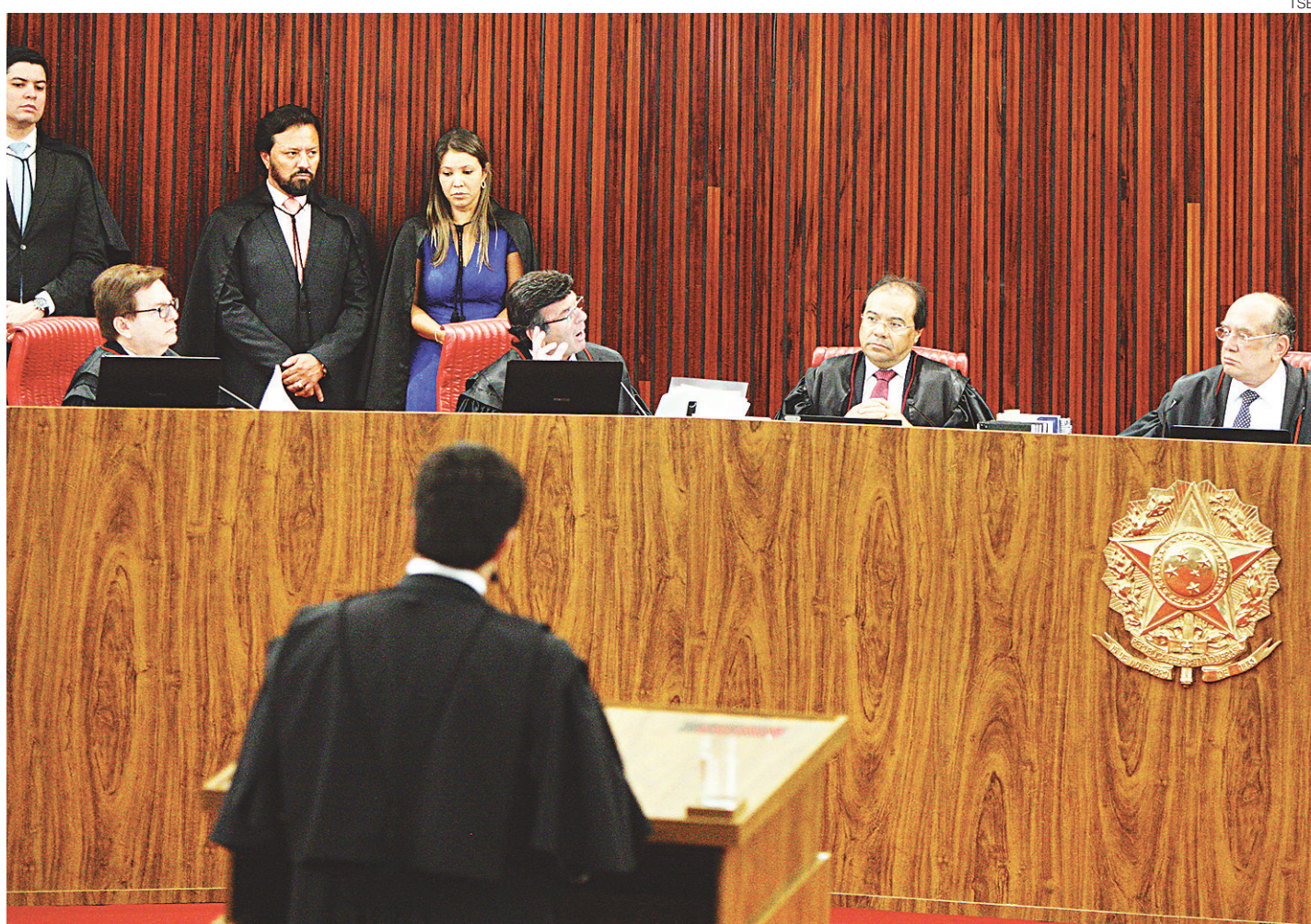
// Sessões de julgamento no Tribunal Superior Eleitoral continuam hoje e podem ser finalizadas neste sábado

O governo informou inicialmente que o presidente usou avião da Força Aérea Brasileira (FAB) para os dois destinos, mas na quarta-feira, 7, recuou e afirmou que recorreu a um jato particular, sem pagar pelo serviço. Temer disse que "não sabia a quem pertencia a aeronave".