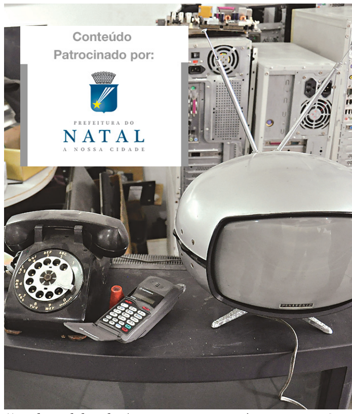
// Produção de lixo eletrônico vai crescer 19% até 2018, aponta a ONU