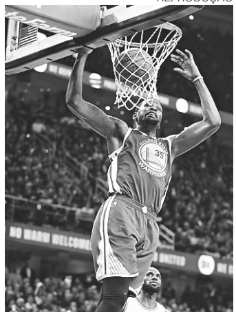
// Durante acertou cesta de 3 e garantiu vitória do Warriors

"Ele assumiu", disse o técnico do Warriors, Steve Kerr. "Você pode adivinhar que ele sabia que este era o seu momento. Tem sido um jogador fantástico na liga por um longo tempo, mas ele sente que esta é a sua oportunidade, o