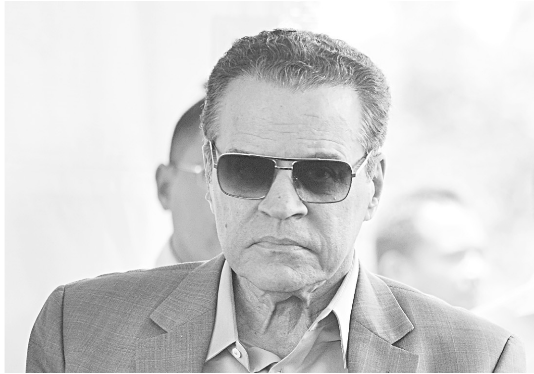
// Henrique Eduardo Alves, ex-ministro: alvo da Operação Manus, da Polícia Federal