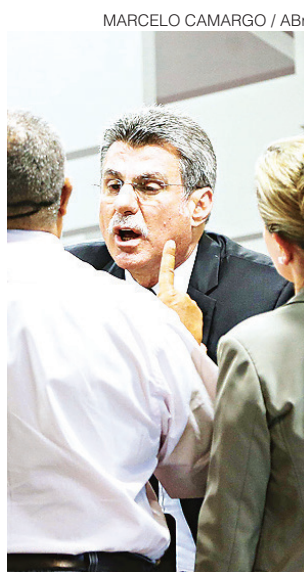
MARCELO CAMARGO / ABR